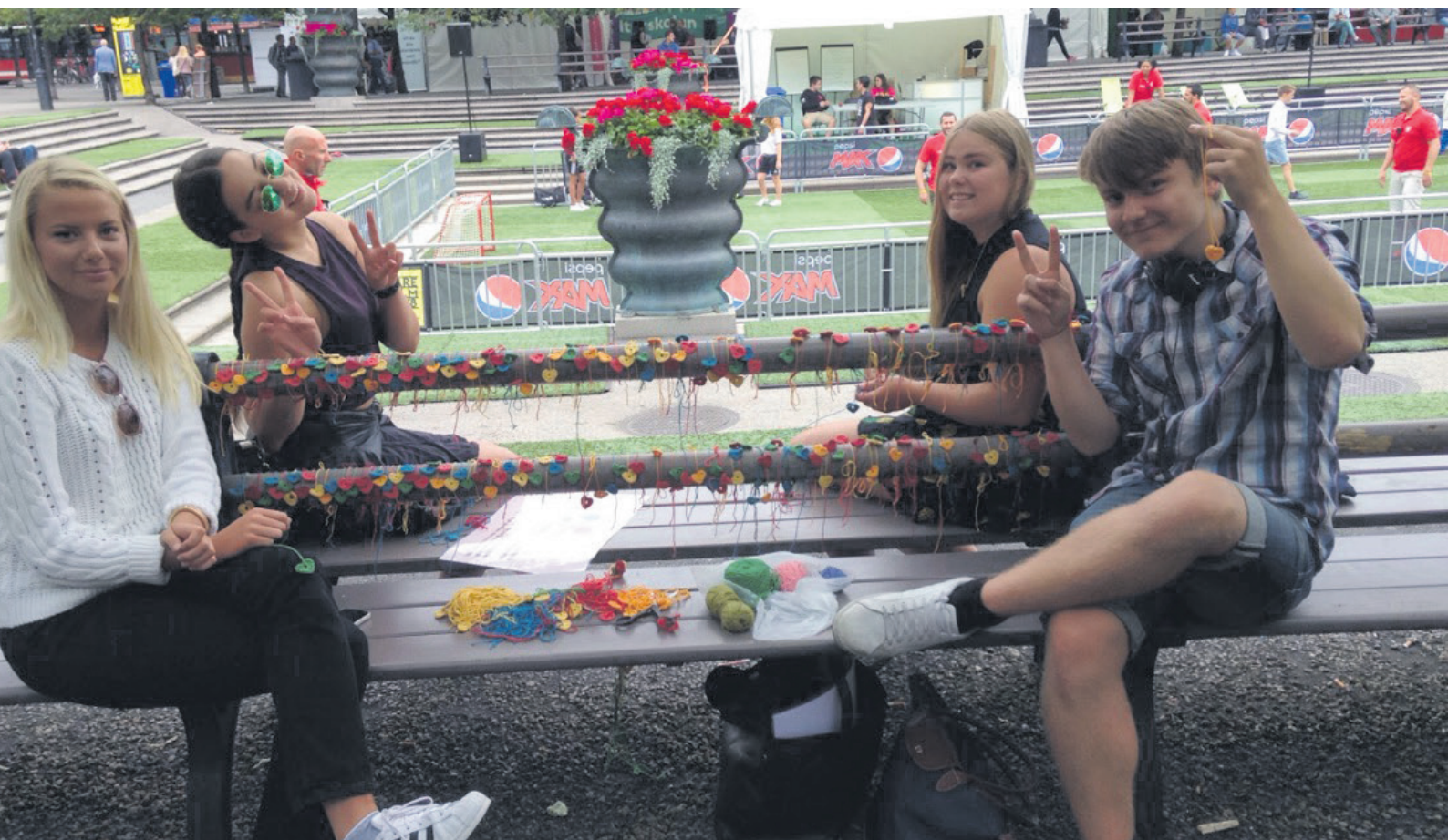
Fig. 11. DIY-workshop på We Are Sthlm, period 3.

Gruppen utförde en workshop i origami för en grupp barn mellan 9-11år. Syftet med arrangemanget var att låta barn vara med och skapa deras omgivning och skapa en trevlig miljö. Deras förhoppning var att vara på ett barnsjukhus. På grund av semesterledighet kunde sjukhusen tyvärr inte ta emot gruppen.