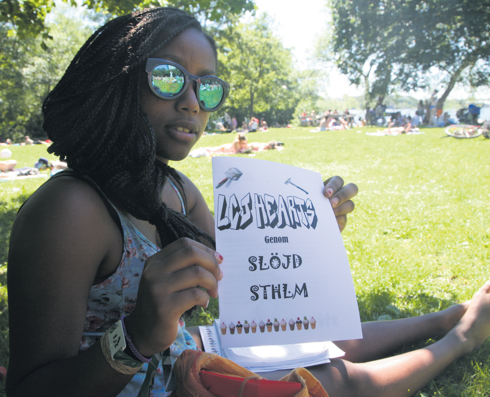
Fig. 2. Team LCJ HEARTS, period 1.