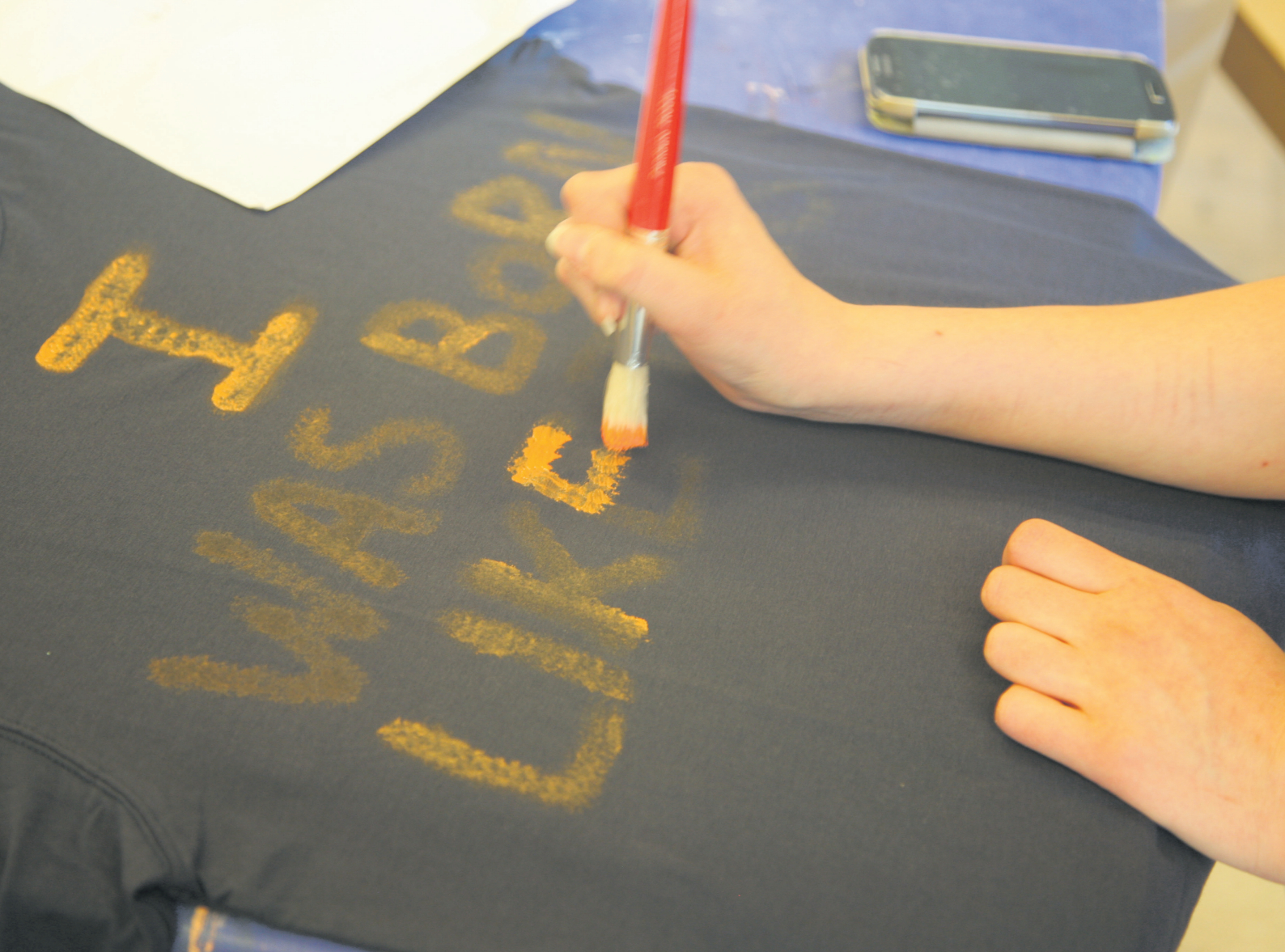
Fig. 3. Från arbetsgruppen Creative Minds Think Alike´s workshop, period 1.

"Det är konstigt att man kan bli så fysiskt trött av att tänka! Jag håller på att bryta ihop för jag har suttit och tänkt så mycket under två timmar."