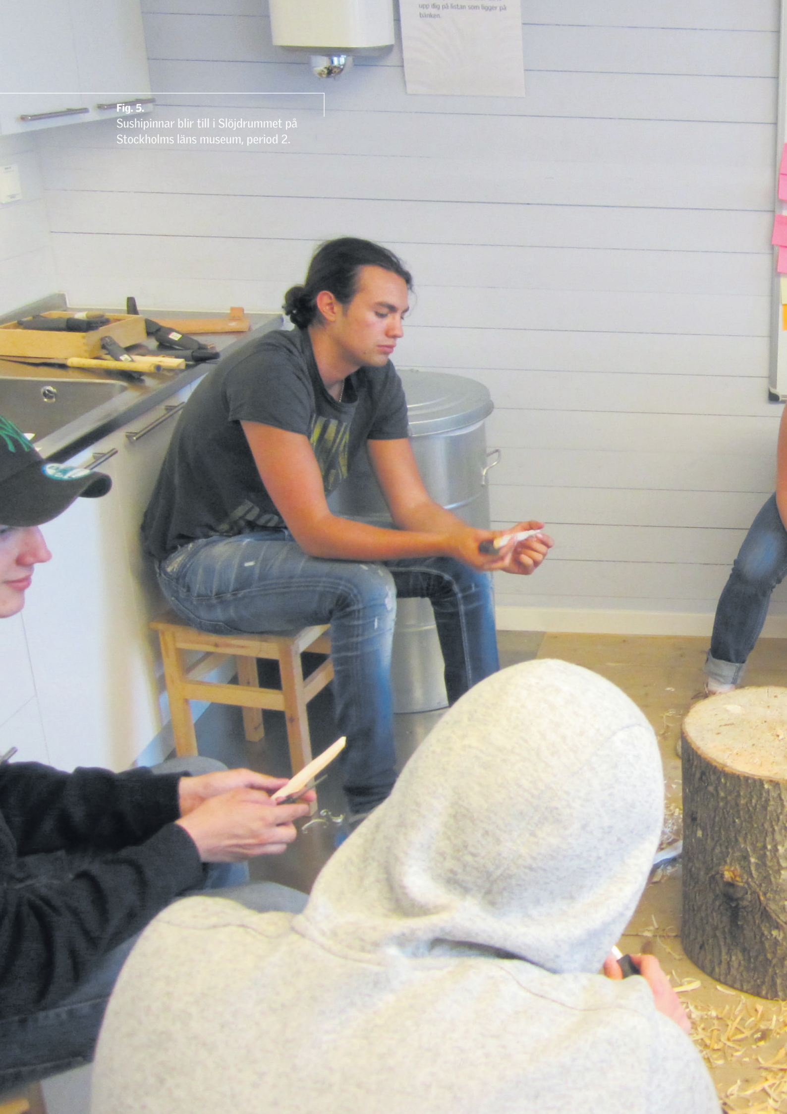
Fig. 5. Sushipinnar blir till i Slöjdrummet på Stockholms läns museum, period 2.

upp till på listan som ligger på bänken.