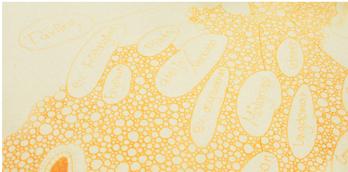
Fig. 7. Idéarbete, period 3.

Målsättningen var att alla skulle få prova på att genomföra ett arrangemang utifrån sina egna idéer och att på så vis få en inblick i arrangemangets alla delar, från projektering till marknadsföring, förberedelse, genomförande och efterarbete. Detta innebar att de skulle få prova på att projektleda själva och få utrymme att organisera sig, med stöd av handledning vid behov.