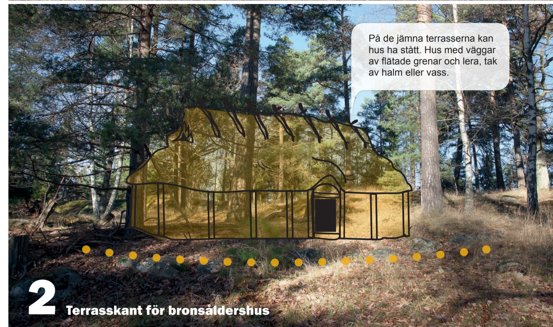
2 Terrasskant för bronsåldershus

På de jämna terrasserna kan hus ha stått. Hus med väggar av flätade grenar och lera, tak av halm eller vass.