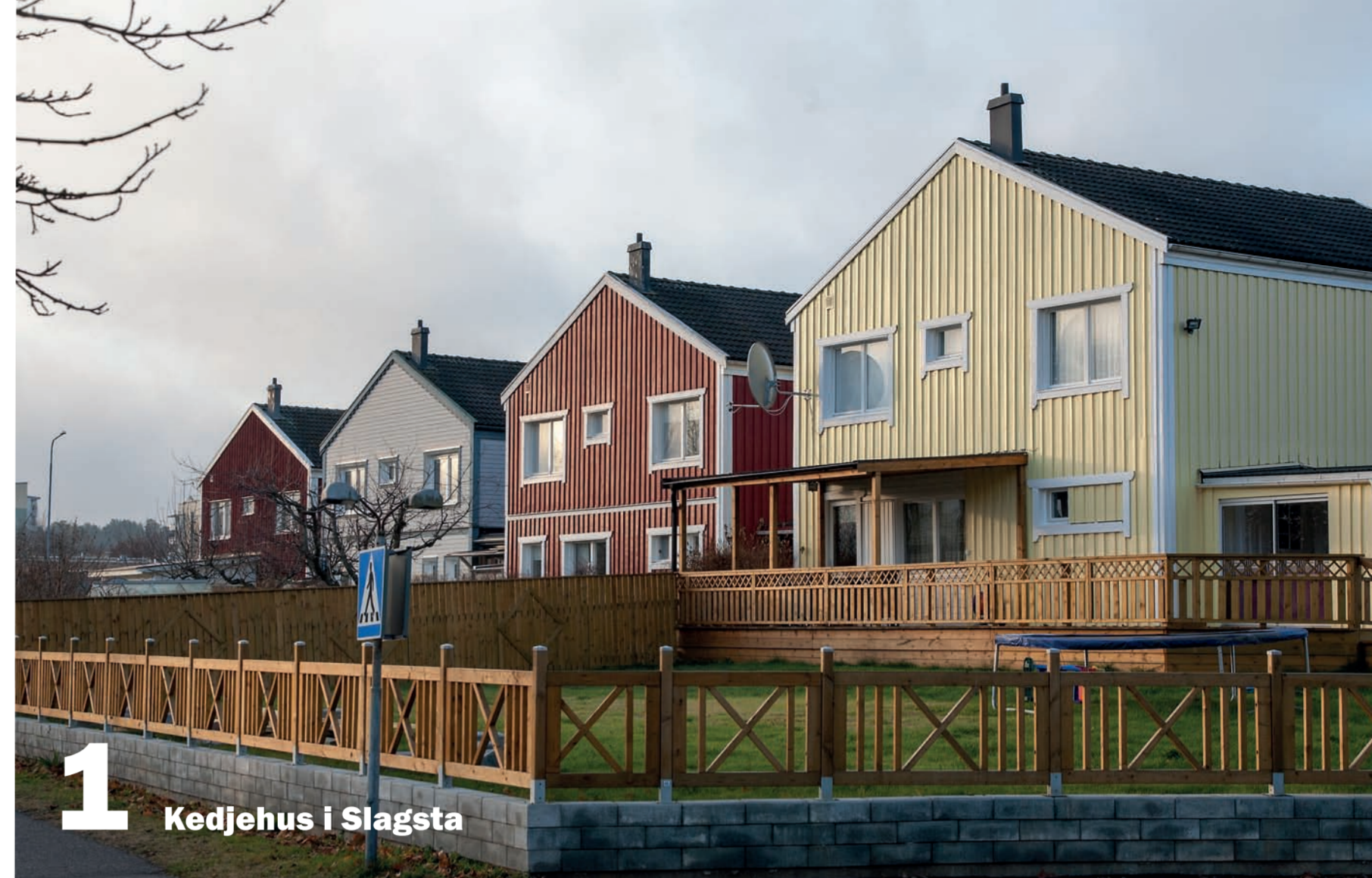
1 Kedjehus i Slagsta