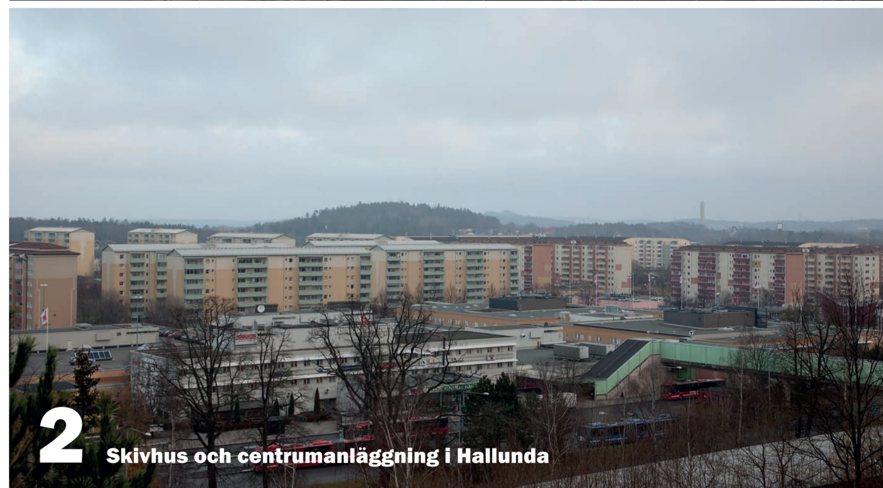
2 Skivhus och centrumanläggning i Hallunda