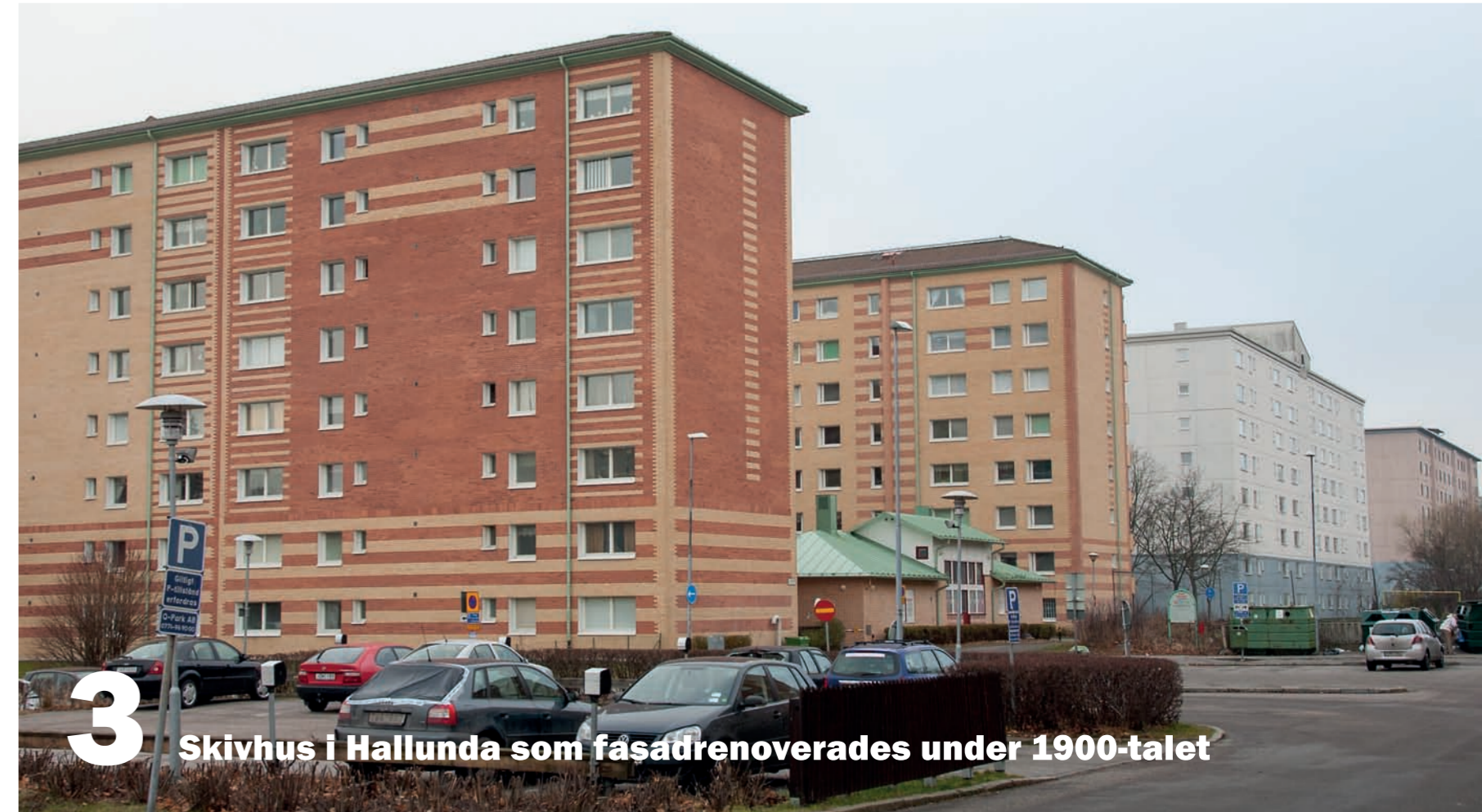
3 Skivhus i Hallunda som fasadrenoverades under 1900-talet