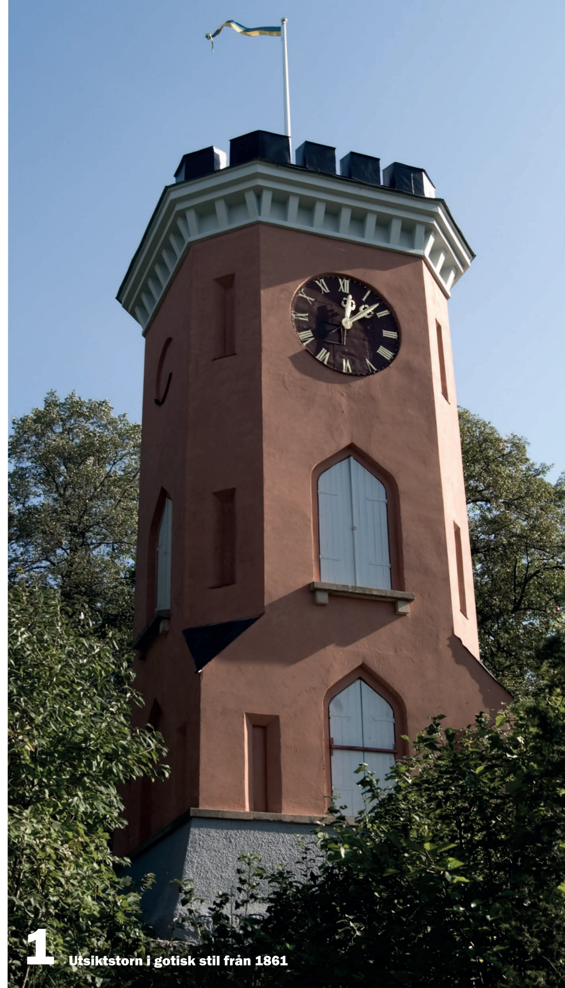
1 Utsiktstorn i gotisk stil från 1861

Botkyrka socken, fornlämnning nr 8. Vårdas av Botkyrka kommun. Fornlämningar är skyddade enligt lag. Länsstyrelsen.