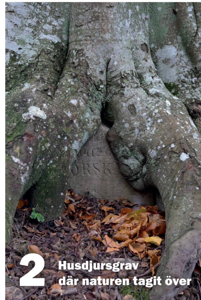
2 Husdjursgrav där naturen tagit över

I slutet av 1700-talet blev det populärt att anlägga romantiska, så kallade engelska parker. På slingrande gångvägar genom ett planterat naturlandskap med böljande kullar, skulle man mötas av överraskningar i form av små tempel, utsiktstorn och medeltida ruiner.