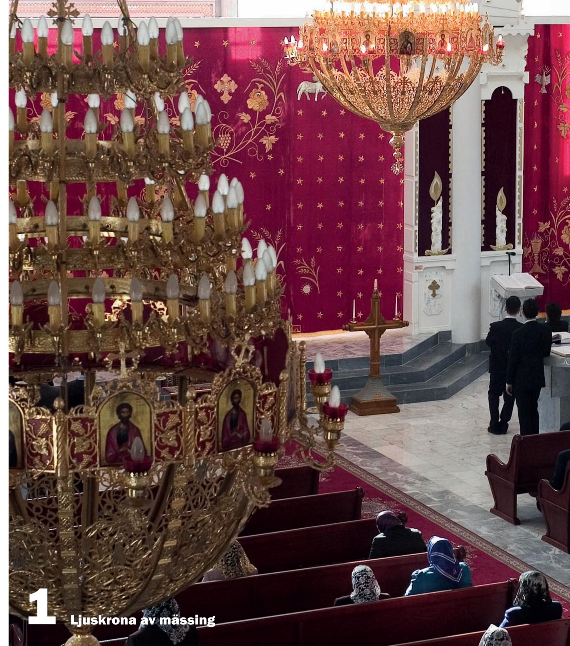
1 Ljuskrona av mässing