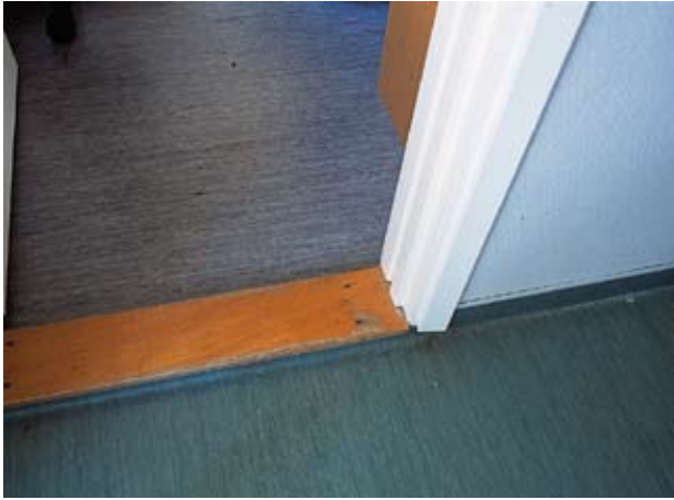
I några av husen hittar man spår från tidigare perioder. På bilden ser man de linoleumgolv som fanns i husen från början. Badrumsväggen är klädd med perstorpsplatta.