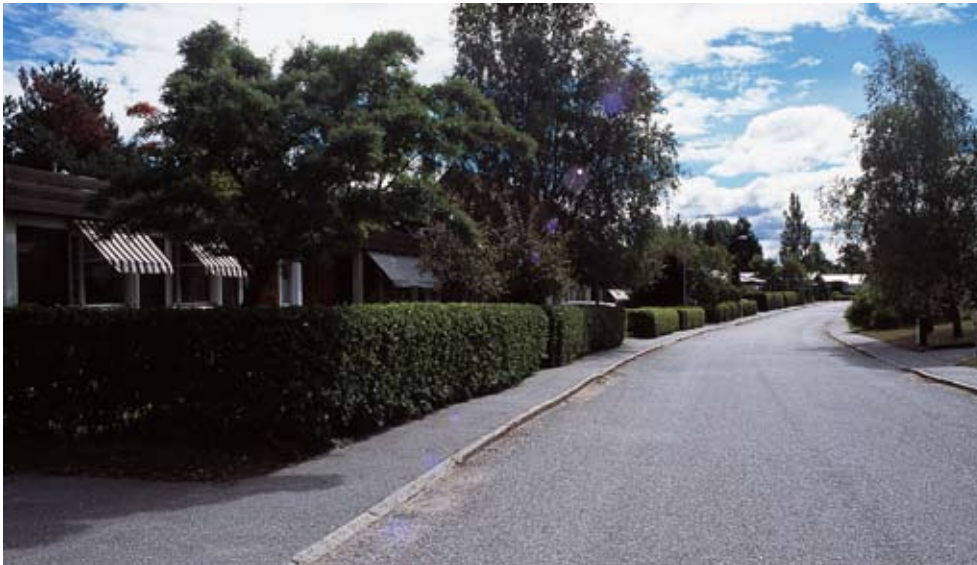
Trädgårdarna är numera uppväxta och avgränsar tomterna från varandra. Som helhet inger Berghem idag ett inbott och trivsamt intryck.

Berghems stadsplan typisk för sin tid. Tomterna är samlade i grupper längs korta gatuslingor och anpassade efter den kuperade terrängen. I mitten av varje husgrupp sparade man ut ett mindre grönområde och mellan den östra och den västra delen av området ligger ett stort grönområde med en låg- och mellanstadieskola.