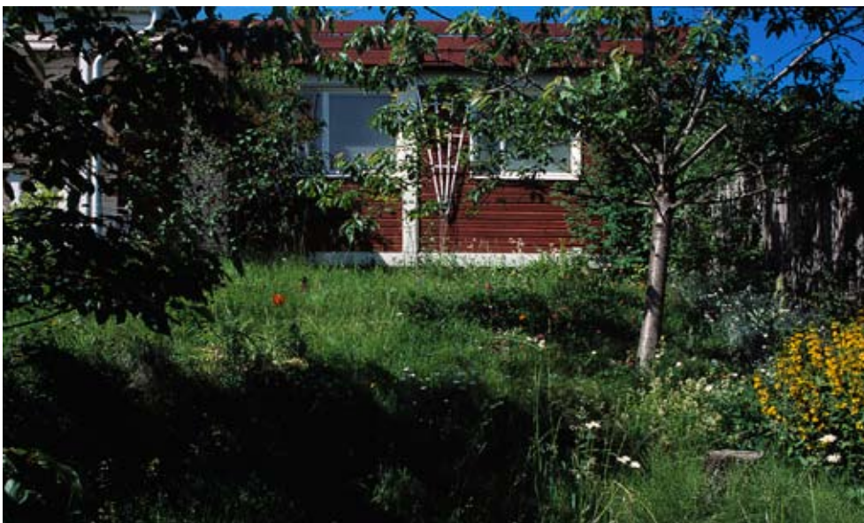
WP-villa förvandlad till röd liten stuga.

förförelsen ingår som element i våra liv som konsumenter, och formar vardagens estetik och kreativitet”. 129