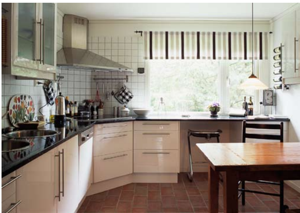
Ett av de senast ombyggda köken i området. Genom att lägga igen de stora fönsterna och bara ha ett mindre skapades större arbetsyta. Köksinredningen visar tydligt hur restaurangkökens utformning har påverkat köken i hemmen.

tillbehör i den självklara utrustningen. Hemdatorerna har i sin tur medfört att många skaffat kontorsmöbler som datorbord och kontorsstol.