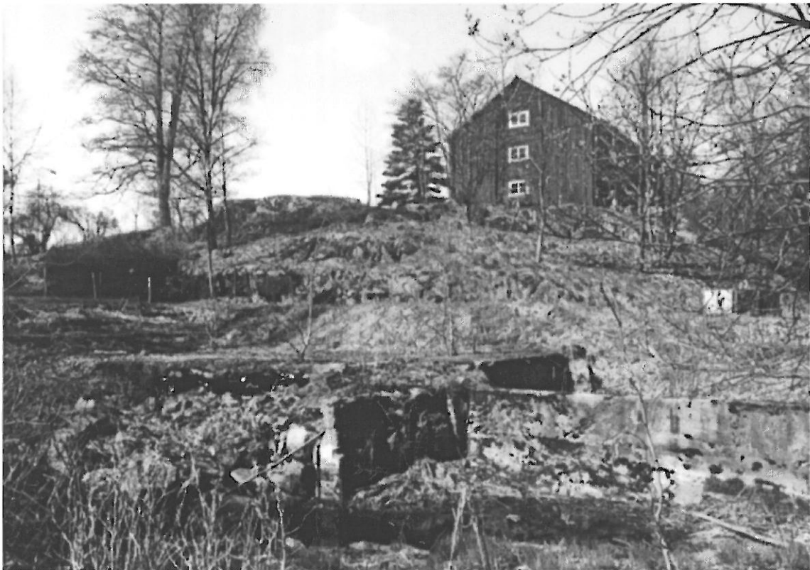
Kvarngrunden med magasinet i bakgrunden

Magasinet byggdes av Söderby gård, troligen under första hälften av 1800-talet. Magasinet hör samman med kvarnen från 1813, som drevs av ett maskineri för vattendrift från Samuel Owens verkstad. På häradskartan från 1906 är "Ångsåg- och kvarn" markerade vid Söderby. Magasinet användes i senare tid som militärförråd. Idag är det i privat ägo .