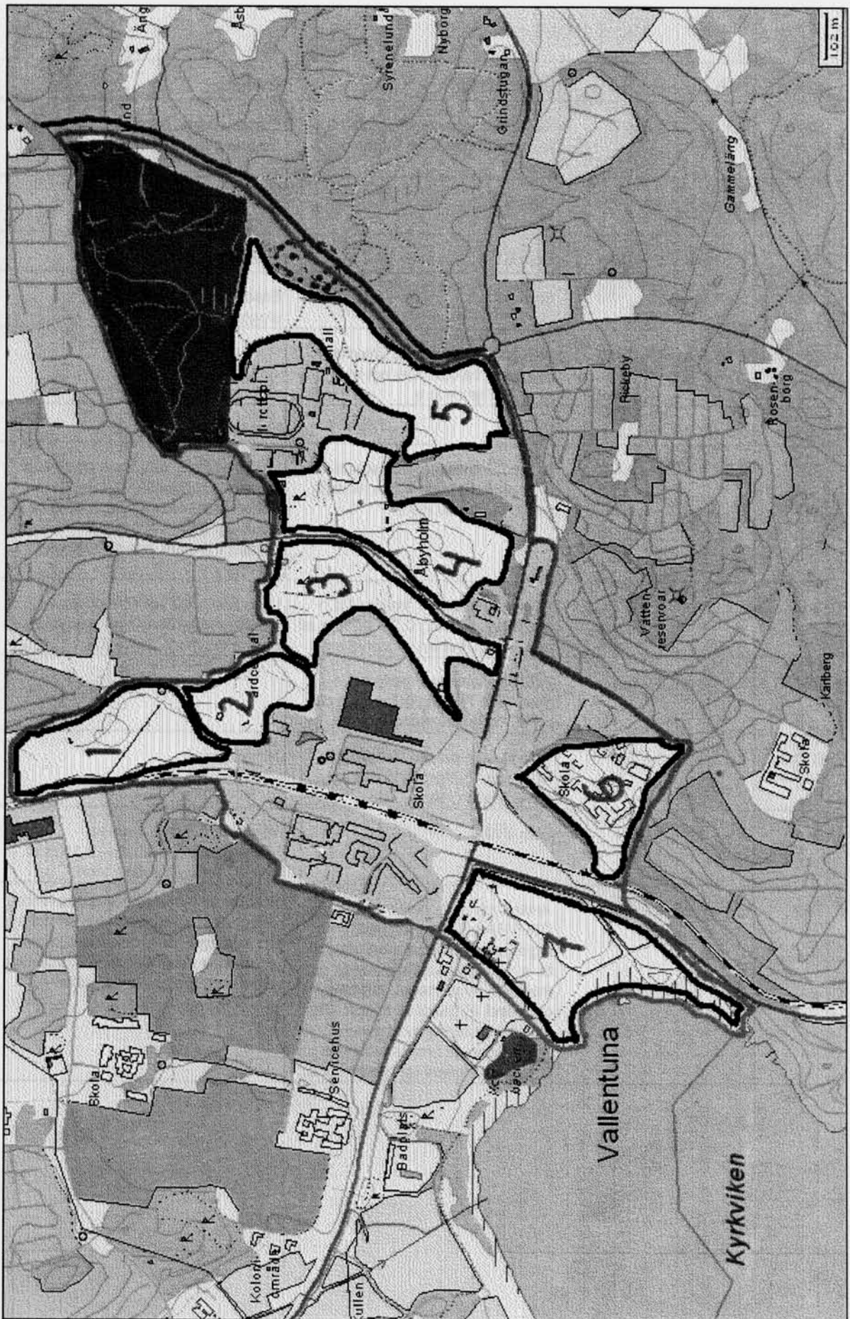
Utredningsområdets indelning i delområden