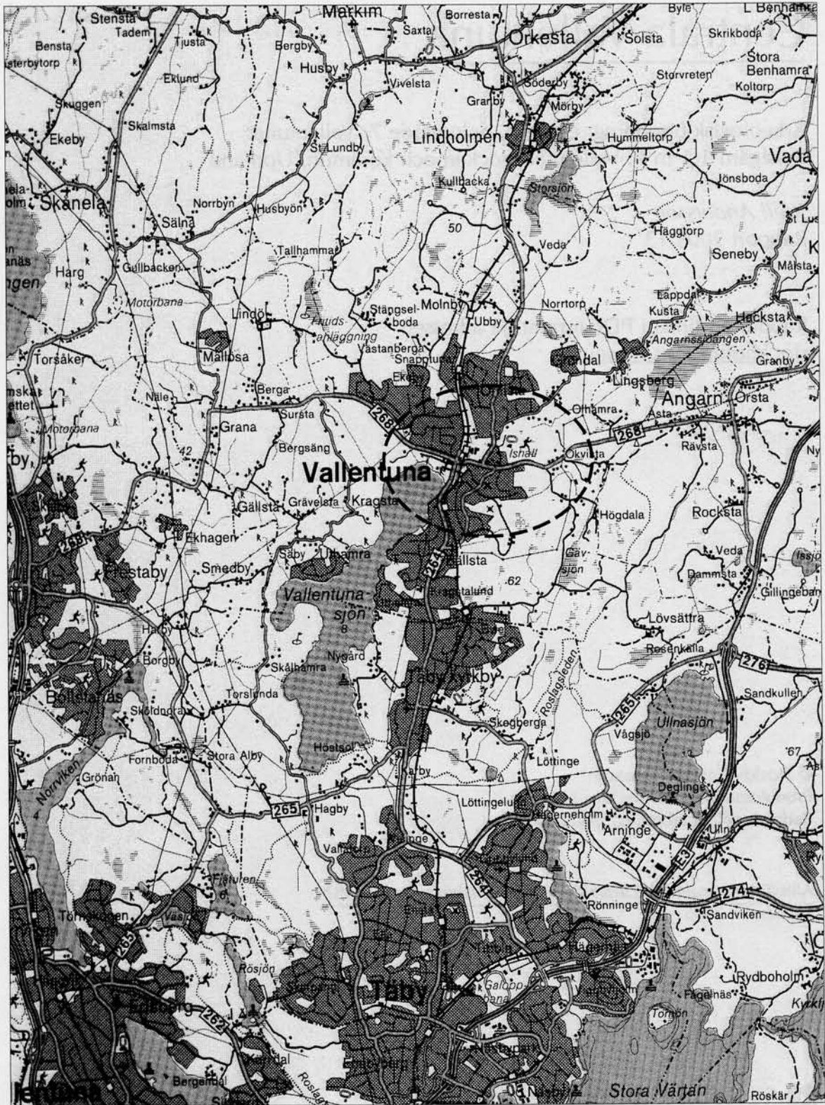
Fig 1. Utsnitt ur Blå kartan med utredningsområdet markerat. Skala 1:50 000.