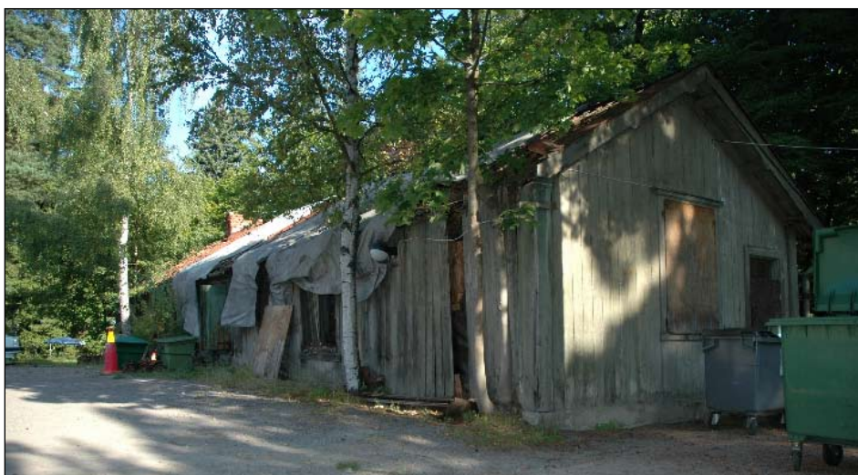
Exteriör fr. s.