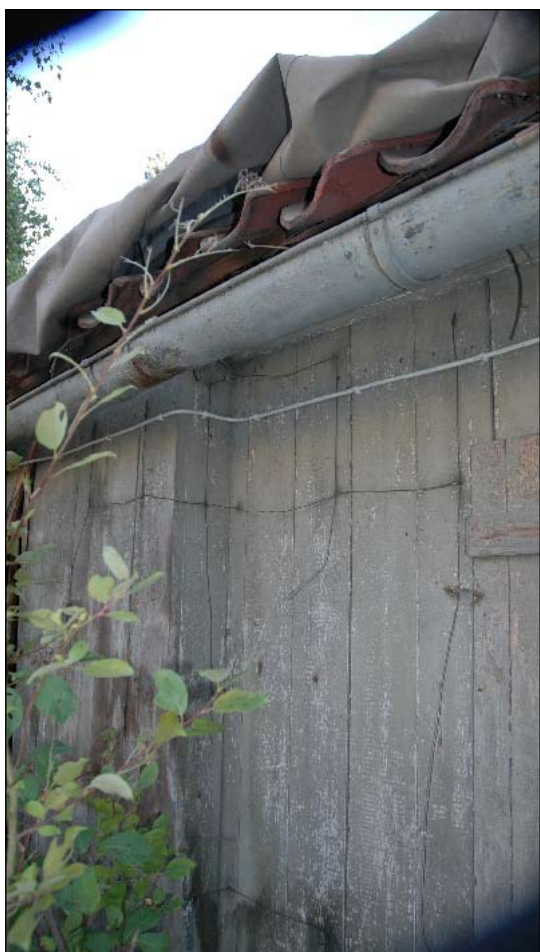
Skarv timmer/korsvirke fr. v.