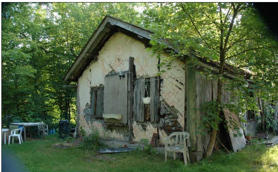
Exteriör fr. nv.