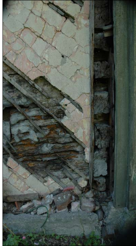
Puts och knut fr. nv.