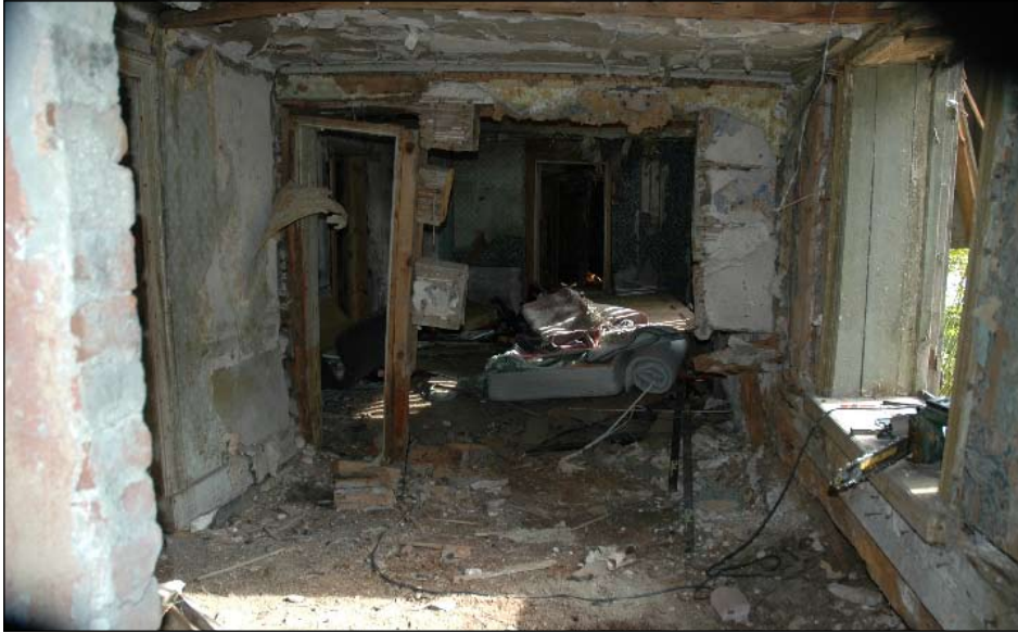
Timmerdel, kammare och korsvirkesdel fr. n.