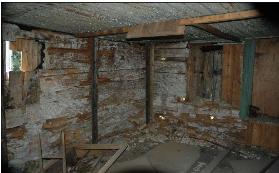
Timmerdel, stuga nv. hörn