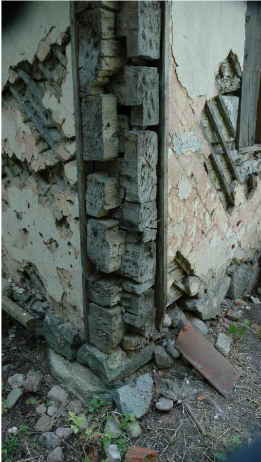
Knut i norr.