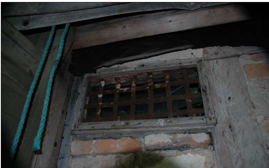
Fönster korsvirkesdel fr. ö.