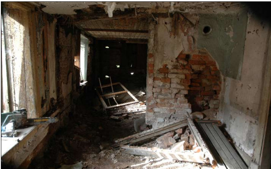
Timmerdel, kammare fr. s.