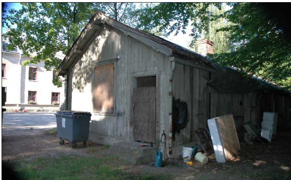
Exteriör fr. s.