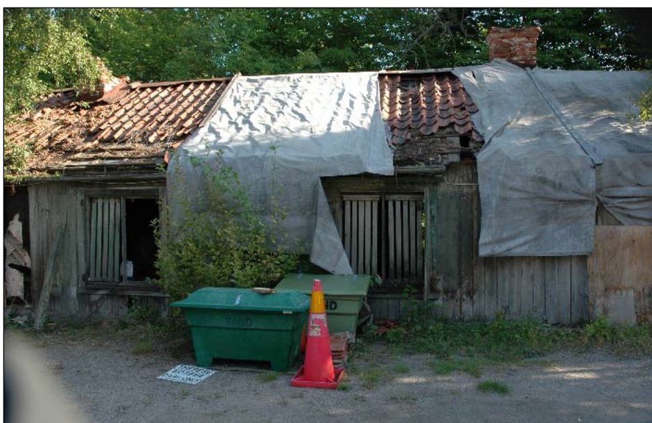
Exteriör fr. sv.