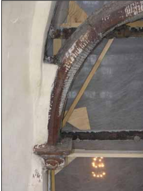
Missfärgad sandsten i masverk har tvättats. Bildnr: lp20070203.