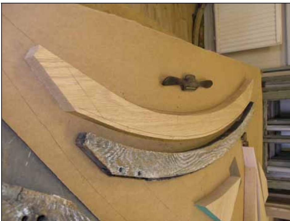
Rötskadade delar i de övre bågarna har ersatts med nytt virke. Bildnr: lp20070190 .

De övre bågarna har renoverats så tillvida att rötskadade delar har ersatts med nytt virke. Nyttillverkning av bågar har utförts med fransk ek och de övre bågarnas virke har renoverats med polsk ek.