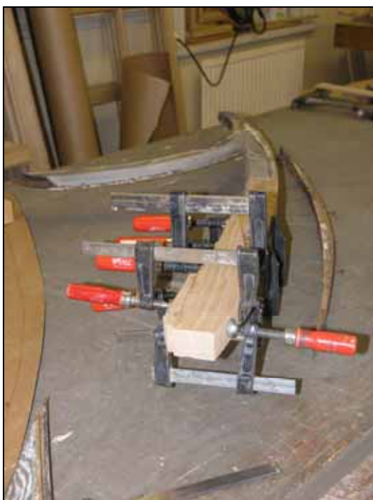
Rötskadade delar i de övre bågarna har ersatts med nytt virke. Bildnr: lp20070191.