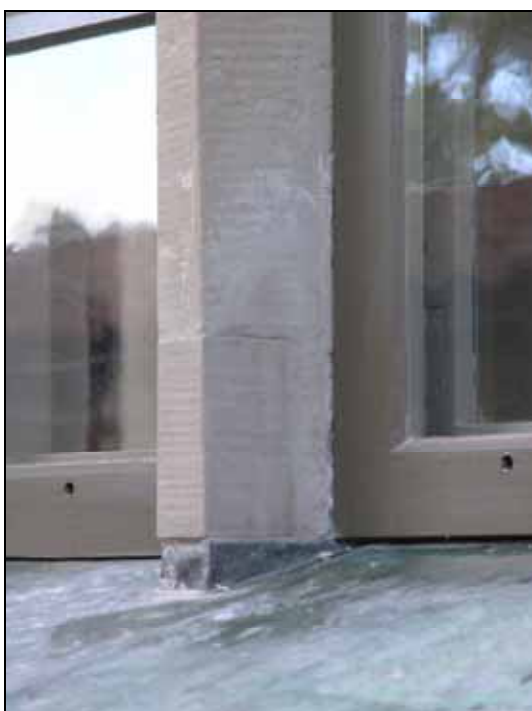
Ny sandsten i masverk. Bildnr: lp20070199.