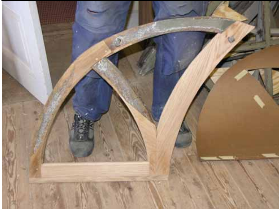
Skarvning av virke i de övre bågarna. Bildnr: lp20070192.