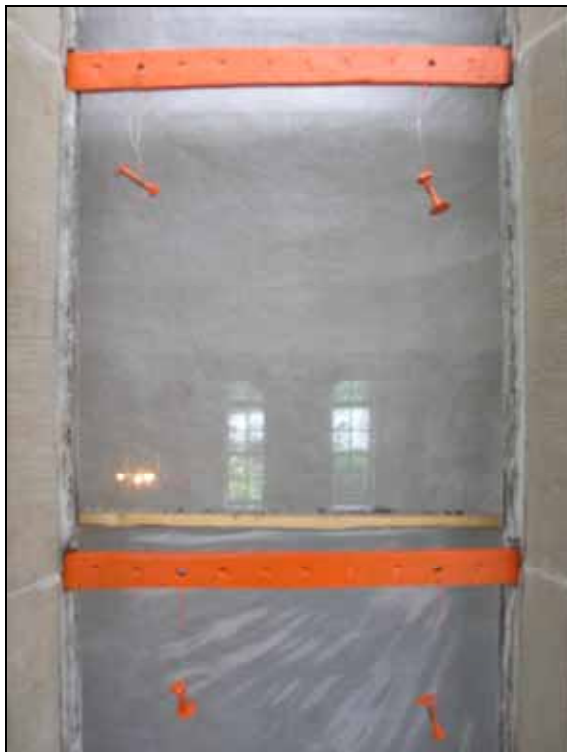
Stångjärn har rengjorts och målats med mönjerfärg. Bildnr: lp20070194 .