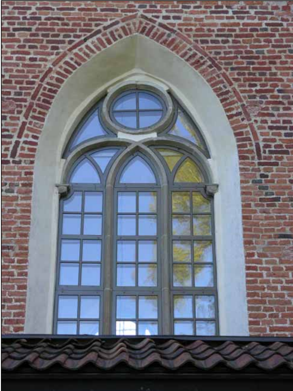
Fönster efter nytillverkning och renovering i långhusets norra sida. Bildnr: lp20070201.