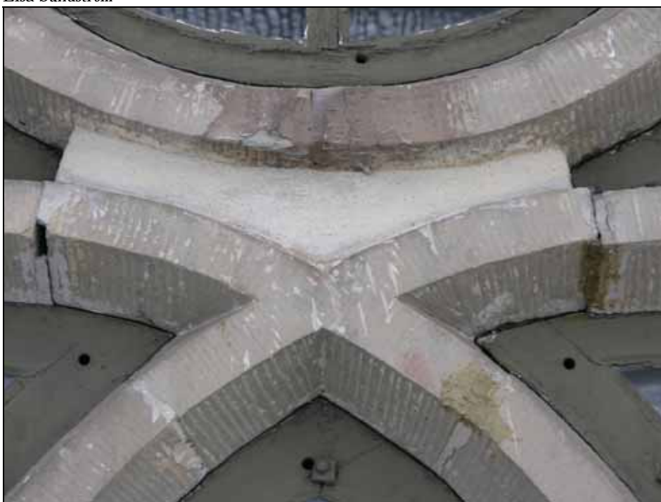
Exempel på gamla och trasiga lagningar som har lagats. Bildnr: lp20070197.