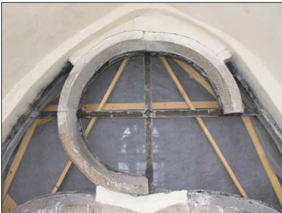
Lös sten i masverk som förankrats med rostfritt stål. Bildnr: lp20070197 .

Det norra fönstret vid predikstolen gick inte att ta ur då det är förbyggt av sakristian. Bågarna bedömdes vara i bättre skick än i övrigt varför bågarna har renoverats på plats. I fönstrets masverk har i den övre delen skadad sten förankrats med rostfritt stål.