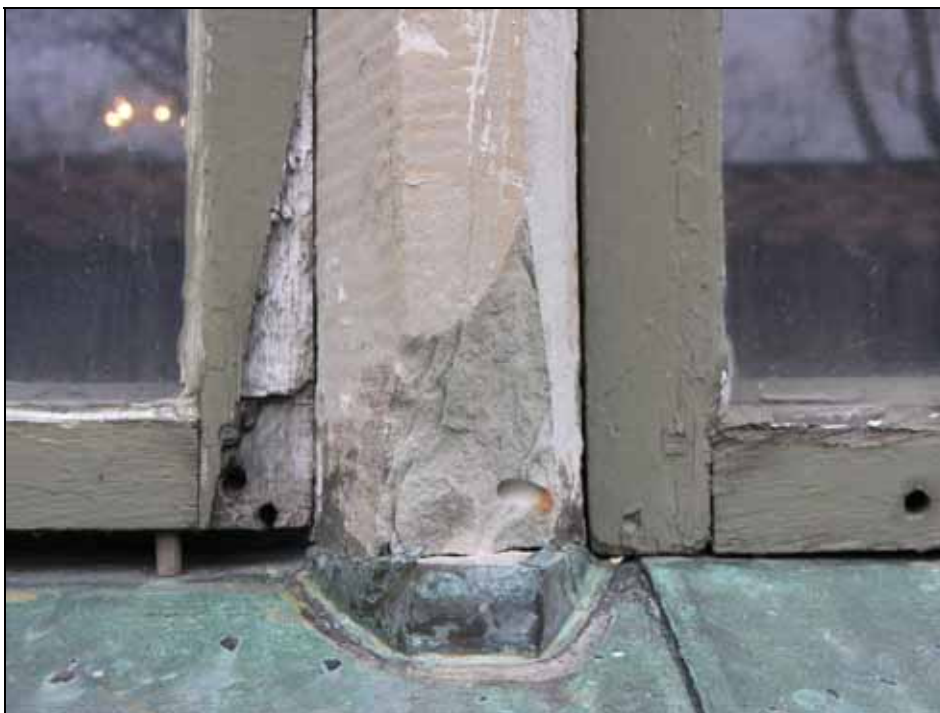
Exempel på skadad sandsten i masverket som ersatts med ny sten. Bildnr: lp20070198.

sten som lågerhuggits för hand i överensstämmelse med omgivande ytor. Gamla misspyrdande lagningar och mindre skador lagats med stenlagningsbruk.