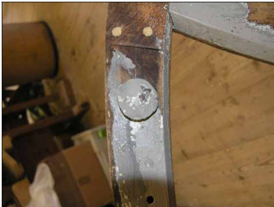
Infästningsbultar med för korta gängor har förlängts. Bildnr: lp20070193.

Fönsterbultar/infästningsbultar som med för korta gängor har förlängts genom insvetsning av mellanbit då fönsterbågarna flyttats ut 3-4 mm.