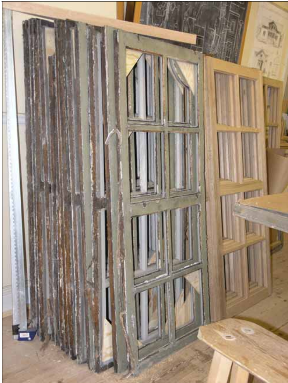
Gamla och nytillverkade nedre bågar i Ebbalunds verkstad. Bildnr: lp20070189.

Arbetena har avsett långhusets sex fönster, tre åt norr och tre åt söder. Arbetena har i huvudsak utförts som i etapp 1. Då bågarna var kraftigt rötskadade har de nedre rektangulära bågarna nytillverkats lika befintliga.