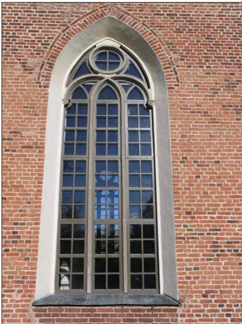
Fönster efter nytillverkning och renovering i långhusets södra sida. Bildnr: lp20070200 .

Skador i fönstersmygarnas puts har upplagats med kalkbruk och färgats in med kalkfärg i överensstämmelse med omgivande ytor.