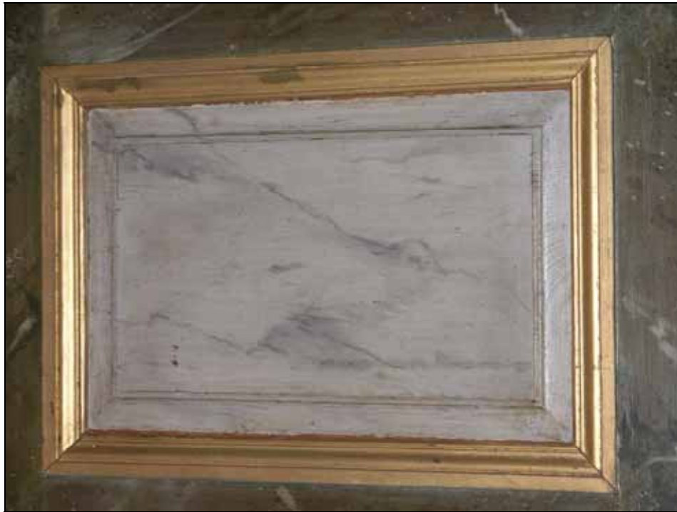
Missfärgade lagningar på läktarbarriärens listverk har omförgyllts. Bildnr: lp20080618.

Läktaren heltäckningsmatta och underliggande masonit har tagits bort. Trägolvet under mattan visade sig vara i gott skick och har rengjorts.