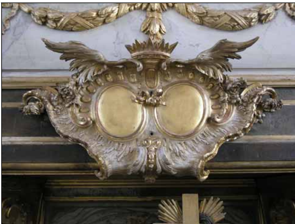
Naturligt slitage har lämnats utan åtgärd. Bildnr: lp20080614.