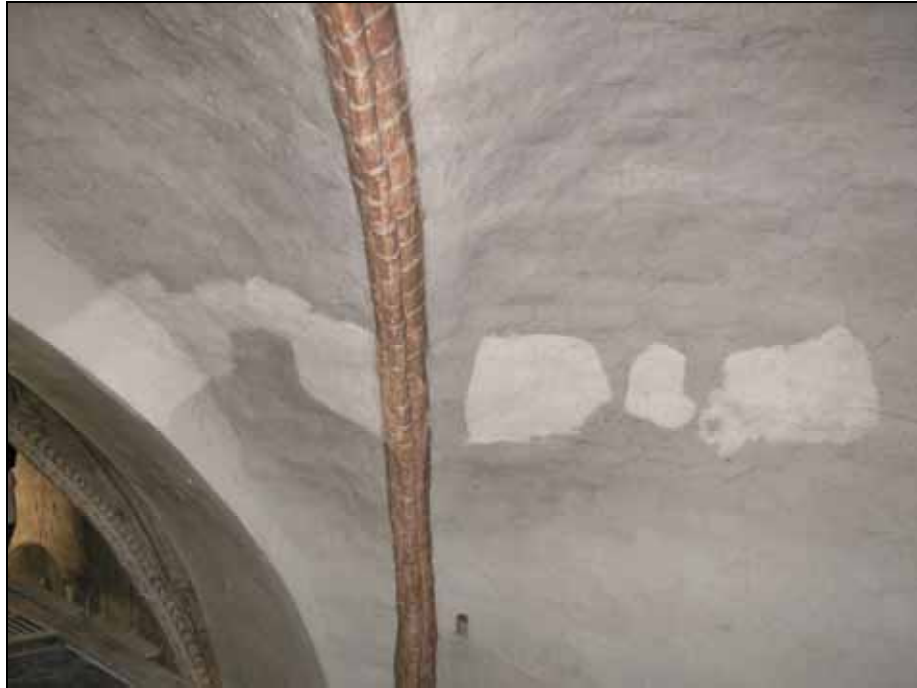
Rengjorda provytor. Bildnr: lp20080606.

Efter rengöringen med Gomma Pane har de mest störande mörka fläckarna och fläckar efter tidigare retuscheringar tonats in. Större sprickor har fästs, lagats med kalkbruk och tonats in. Då ytorna var för feta för kalkfärgsintoning har intoning utförts med kalklimfärg. Väggar vid läktare och västra väggen har, upp till en höjd av ca 2 m, tidigare bättringsmålats med en oljefärg. De ytorna har ommålats med en kalklimfärg.