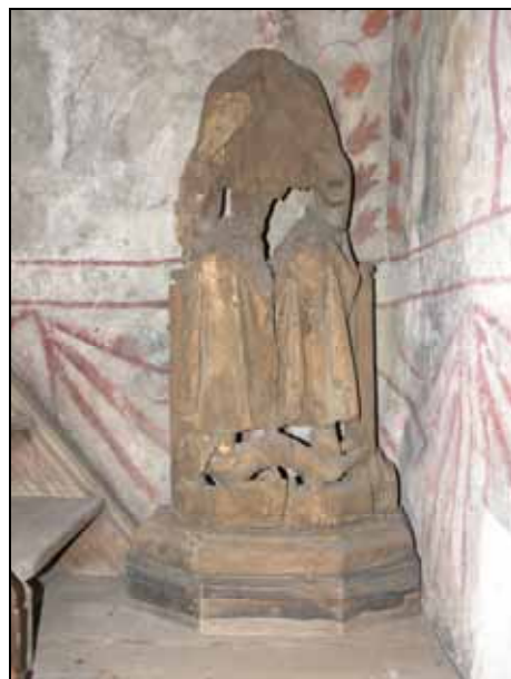
Träskulpturen Anna med Maria och barnet och S:t Olof placerade i koret. Bildnr: lp20080621/22.