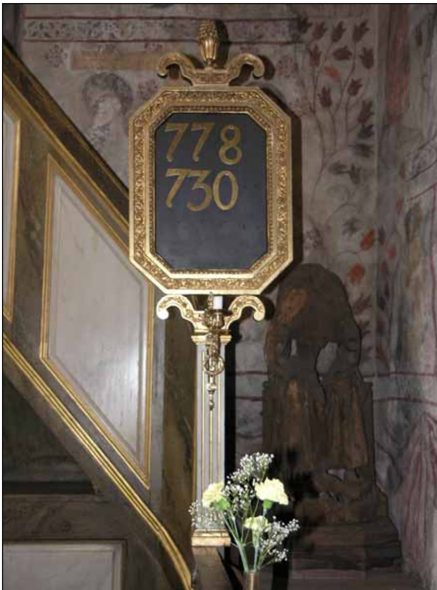
Den södra psalmnummertavlan efter restaurering. Bildnr: lp20080623.

Nummertavlorna har rengjorts och svagt bunden färg och förgyllning fästs. Skadade partier har partiellt uppstickats och krederats före partiell retuschering och omförgyllning.