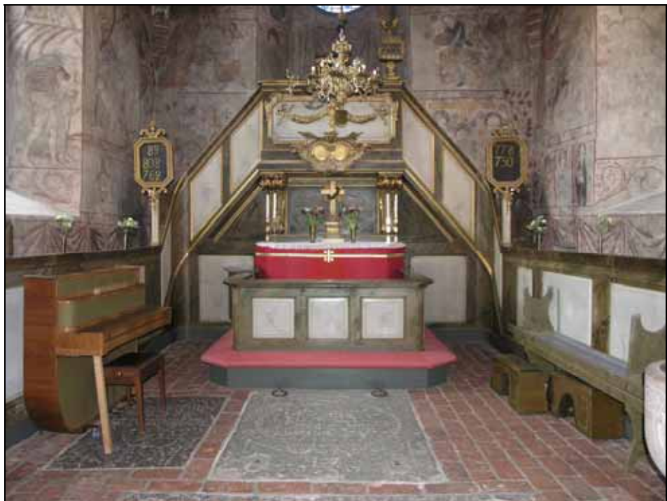
Altarpredikstolen och korbänkar efter restaurering. Bildnr: lp20080616.