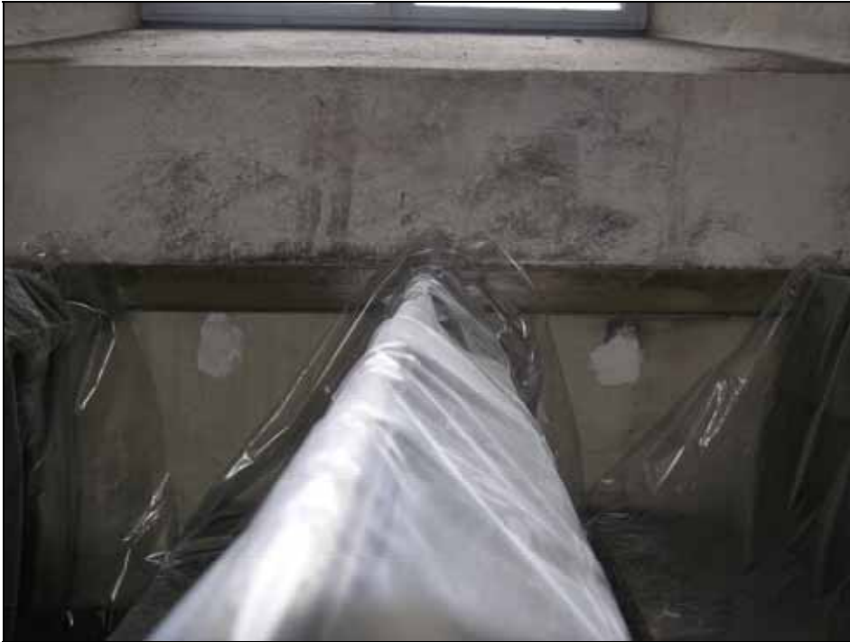
Linoljefärgsmålningen på de nedre långhusväggarna var skadat och målades om. Iögonfallande fläckar på kalkavfärgade väggar har tonats in. Bildnr: lp20080610.