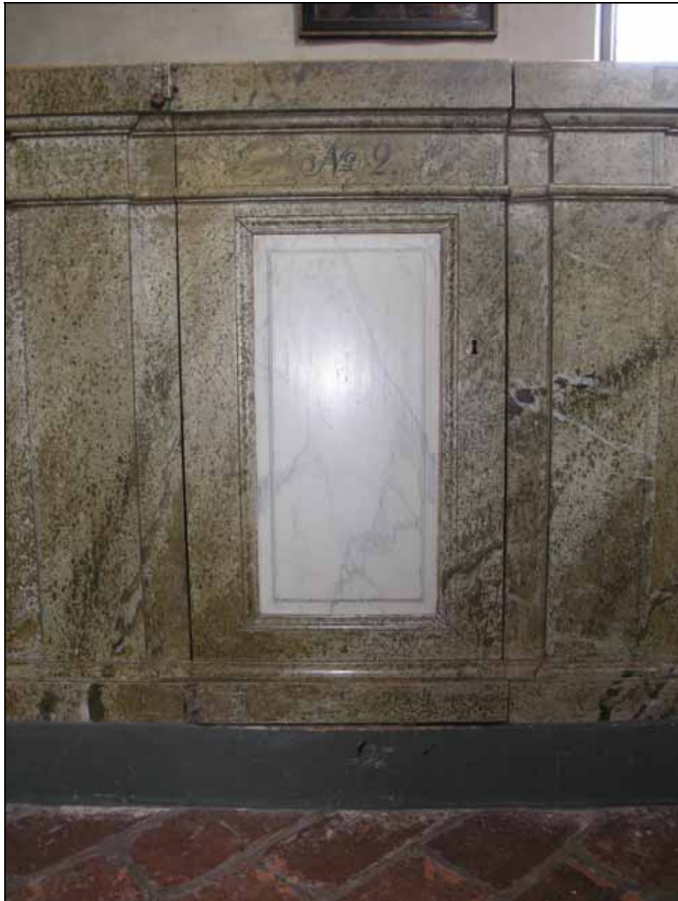
Dörr i bänkkvarter efter rengöring och konservering. Bildnr: lp20080612.

Bänkinredningen har rengjorts. Obundna färgskikt har fästs och mekaniska skrap- och skavskador retuscherats. Lagningar i bänkinredningen har efter byte av radiatorer marmorcerats lika befintligt. Naturligt slitage har lämnats utan åtgärd. Det noterades att under befintlig färg finns en äldre gråblå marmorceringsmålning och en äldre övermalad numrering av bänkdörrar.