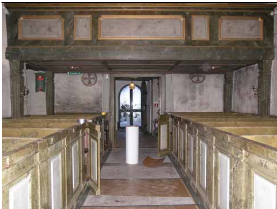
Kyrkorummet åt väst före rengöring. Bildnr: lp20080603.

Komplettering och ändring av armatur har utförts för att förbättra kyrkorummets belysning.