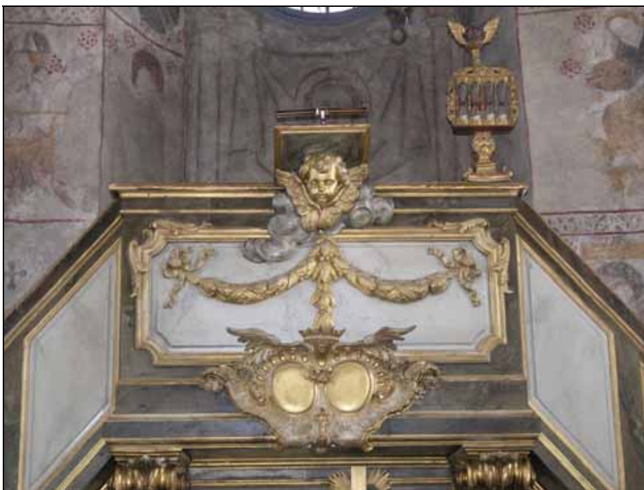
Altarpredikstolens svagt bundna färgskikt och förgyllning har fästs. Bildnr: lp20080612.

Altarpredikstolens ytor har rengjorts. Svagt bundna färgskikt och förgyllning har fästs och mekaniska skador retuscherats. Naturligt slitage har lämnats utan åtgärd.