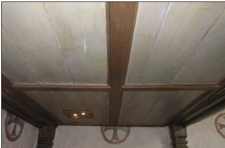
Läktarens undertak med nya infällda spotlights. Ett fält målades om. Bildnr: lp20080626.