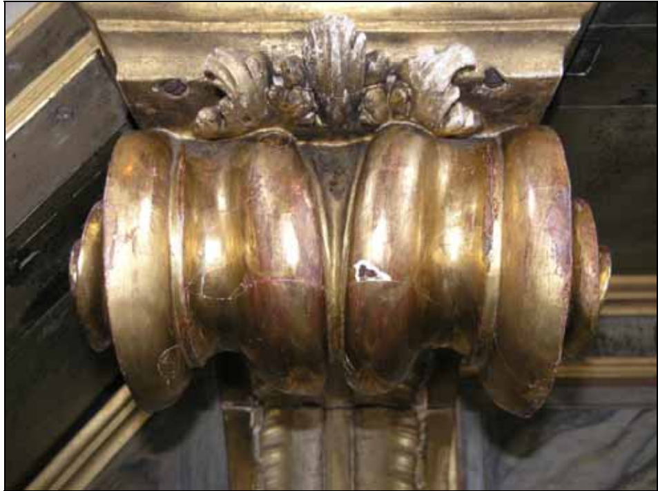
Mekaniska skador har fästs och retuscherats. Bildnr: lp20080615.