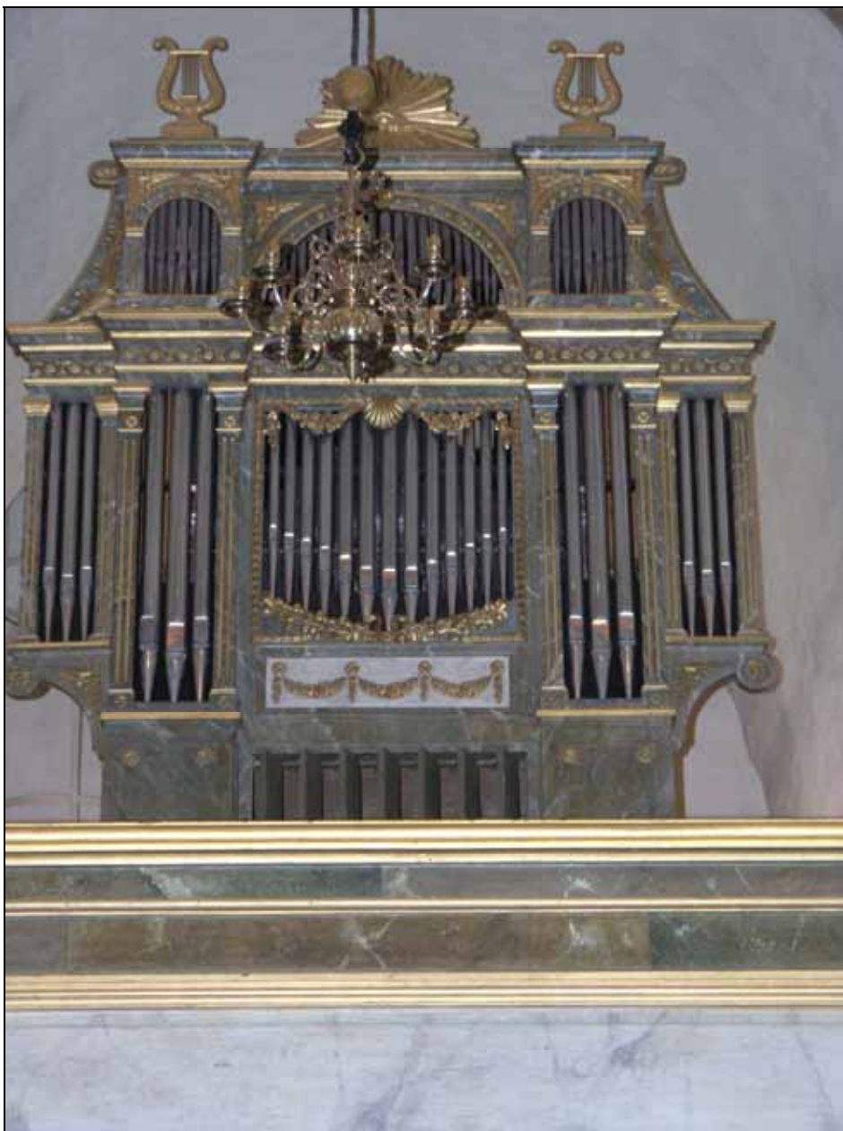
Orgeln efter rengöring och konservering. Bildnr: lp20080619.

Före restaureringen har skyddsätgärder avseende orgeln utförts och därefter täckts för att undvika nedsmutsning under arbetenas gång. Orgelns ytskikt har efter avtäckning rengjorts och en detalj i orgelns dekorativa utsmyckning som lossnat limmats tillbaka. Vidare har färgskikt på blindpipor säkrats och retuscherats och skador på en träspiegel på baksidan retuscherats.