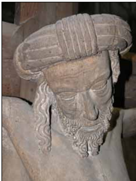
Detalj av triumfkrucifixet. Bildnr: lp20080620.

Träskulpturen Anna med Maria och barnet, S:t Olof och triumfkrucifixet har rengjorts genom dammsugning och försiktig borstning med mjuk borste. Lösa färgskikt har fästs.