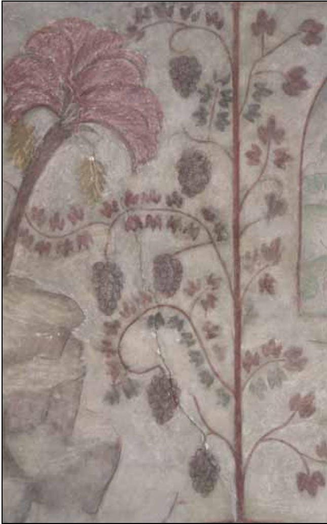
Spricka i målning utförd av Olle Hjortzberg på norra korväggen. Bildnr: lp20080607.