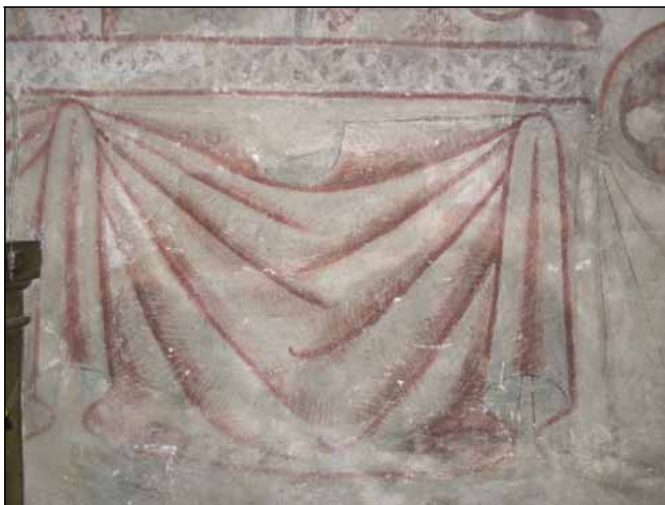
Draperimålning i korets nedre delar gav ett iögonfallande skadat intryck och har retuscherats i något större utsträckning än i övrigt. Bildnr: lp20080609.

Kalkmåleriet med draperimåleri i korets nedre delar uppvisade flertalet mekaniska skador och färgbortfall och gav ett mycket skadat intryck än i övrigt. De aktuella delarna har fästs och retuscherats i något större utsträckning än i övrigt.