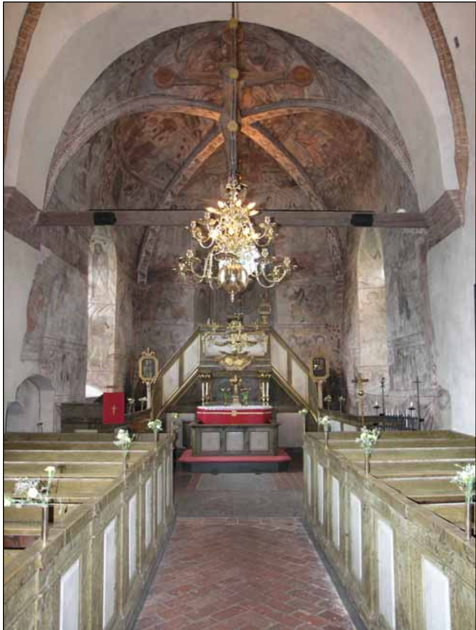
Kyrkorummet åt öster efter restaurering. Bildnr: lp20080628.