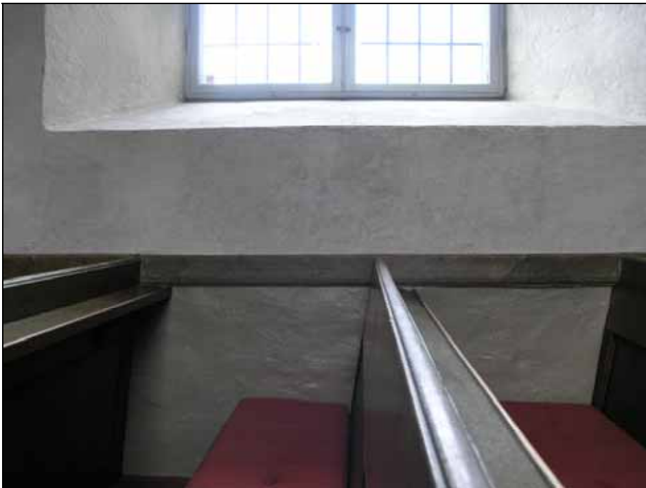
Nedre långhuvväggarna inom bänkkvarteren målades om. Bildnr: lp20080611.