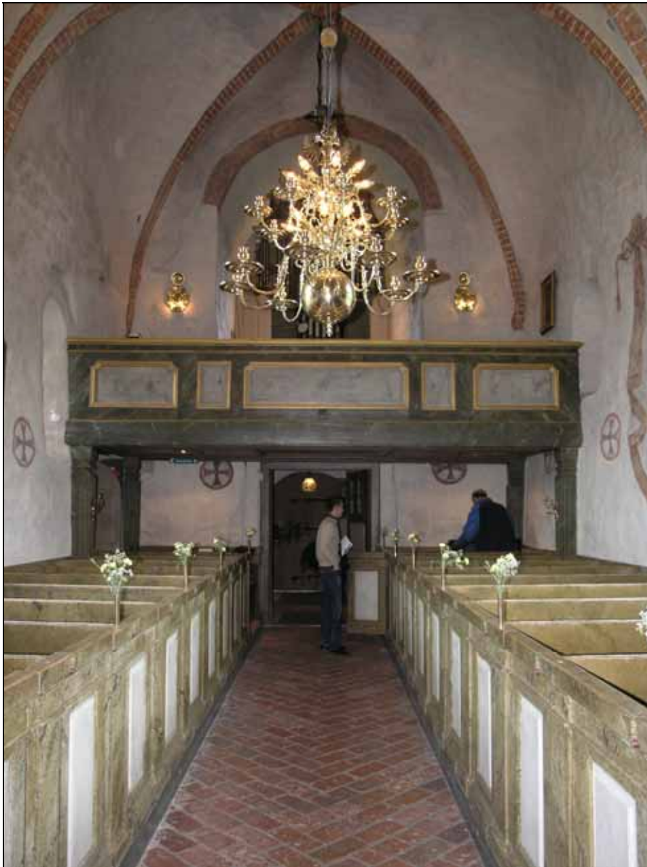
Kyrkorummet åt väst efter restaurering. Bildnr: lp20080629.