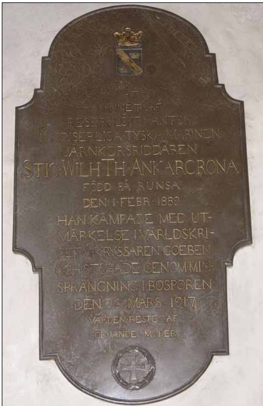
Minnestavlan av kalksten efter konservering. Bildnr: lp20080624.

Minnestavlan av kalksten har rengjorts. Tavlan uppvisade oljiga fuktfläckar kring den förgyllda inskriptionen och har slipats lätt. För att få en enhetlig ton har tavlan oljats in med rå linolja.