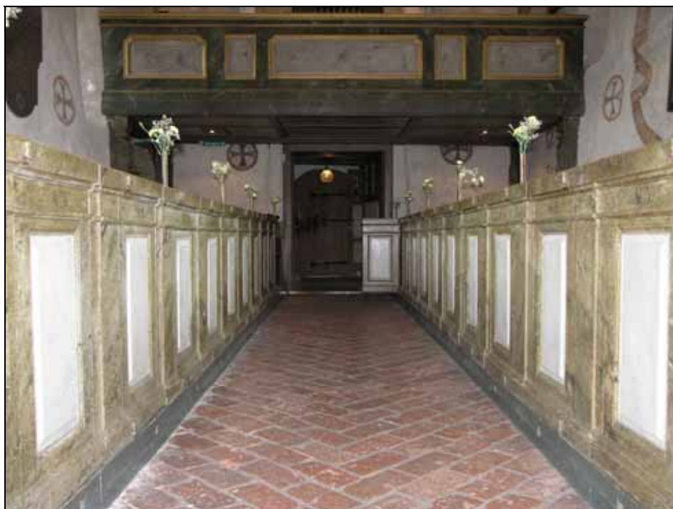
Kyrkorummet åt väst efter restaurering. På västra väggen under läktaren har en referensyta lämnats. Bildnr: lp20080604.