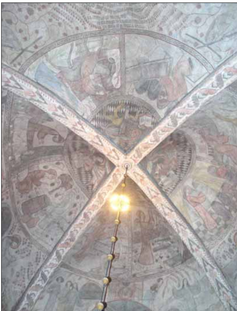
Belysningsarmatur installerad på takkronornas pendlar. Bildnr: lp20080625.

På kyrkans tre takkronor har installerats belysningsarmatur av typen MAXEL ALK 500. Ledningar till belysningen har dragits genom befintligt hål i taket.