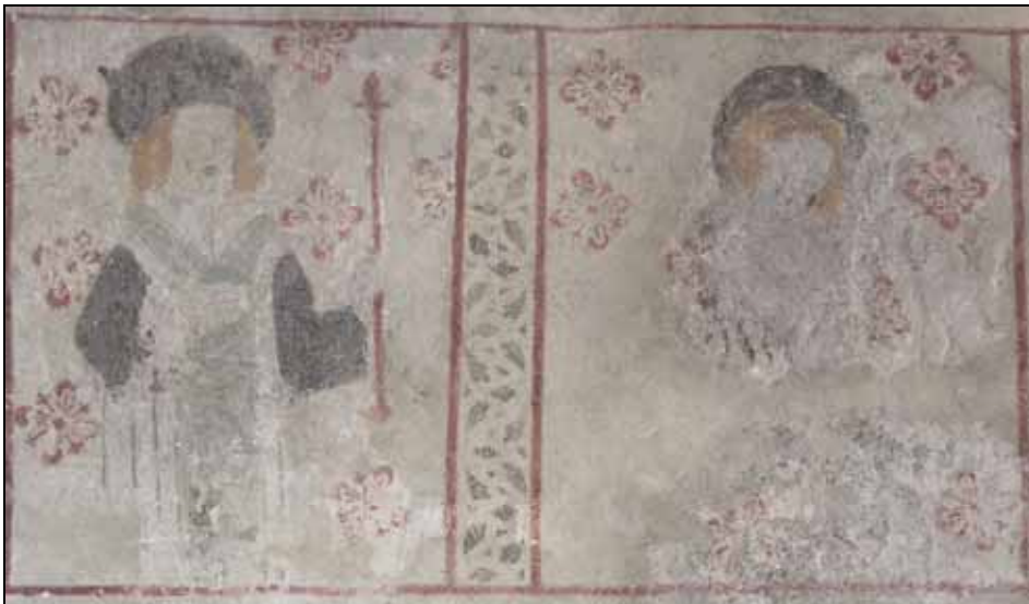
Det medeltida måleriet utfört av Albertus Pictor har lämnats utan retuscheringar. Bildnr: lp20080608.