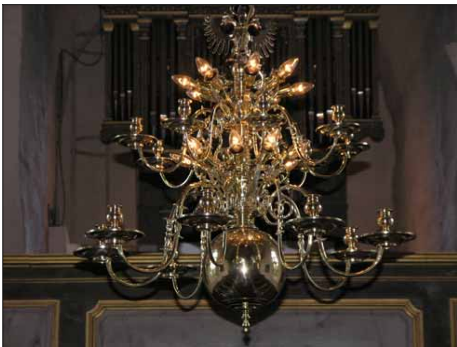
En av kyrkorummets tre mässingskronor efter rengöring. Bildnr: lp20080627.

Kyrkorummets ljusredskap har renoverats, rengjorts och polerats.