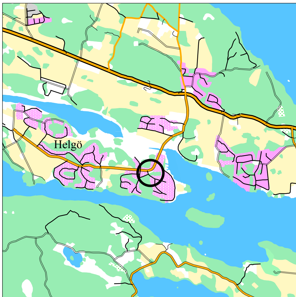
Karta över del av Helgö med markerat undersökningsområde, skala 1:40 000.