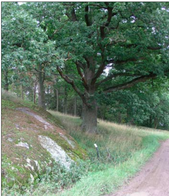
Fig 3. Runhällen vid Edeby.

Omnämns 1409 som i Edbby . Till Edeby hör tre gravfält (Lovö 50, 53 och 54) samt ett antal ensamliggande stensättningar. Runhällen på gravfältet Lovö 53 bör också räknas till det kulturhistoriska sammanhanget kring Edeby gård. Texten lyder: " Åfrid lät (bugga hällen) efter Svarthövde och efter Igulfast, sina söner, och efter Åsgöt ". Ristningen är från 1000-talet e Kr och ristad av en hustru efter sina söner och sin make. När den tillverkades låg den mycket nära Mälarens strandnivå. Placeringen av runhällen är vald i syfte att exponera mot farleden ut mot vattnet. På detta sätt markerades gårdens läge och status för de förbipasserande samtidigt som det också förmodligen markerade gårdens "hamnläge". Runstenarna hade ett kristet budskap och signalerade således att gårdens ägare bekände sig till den nya religionen.