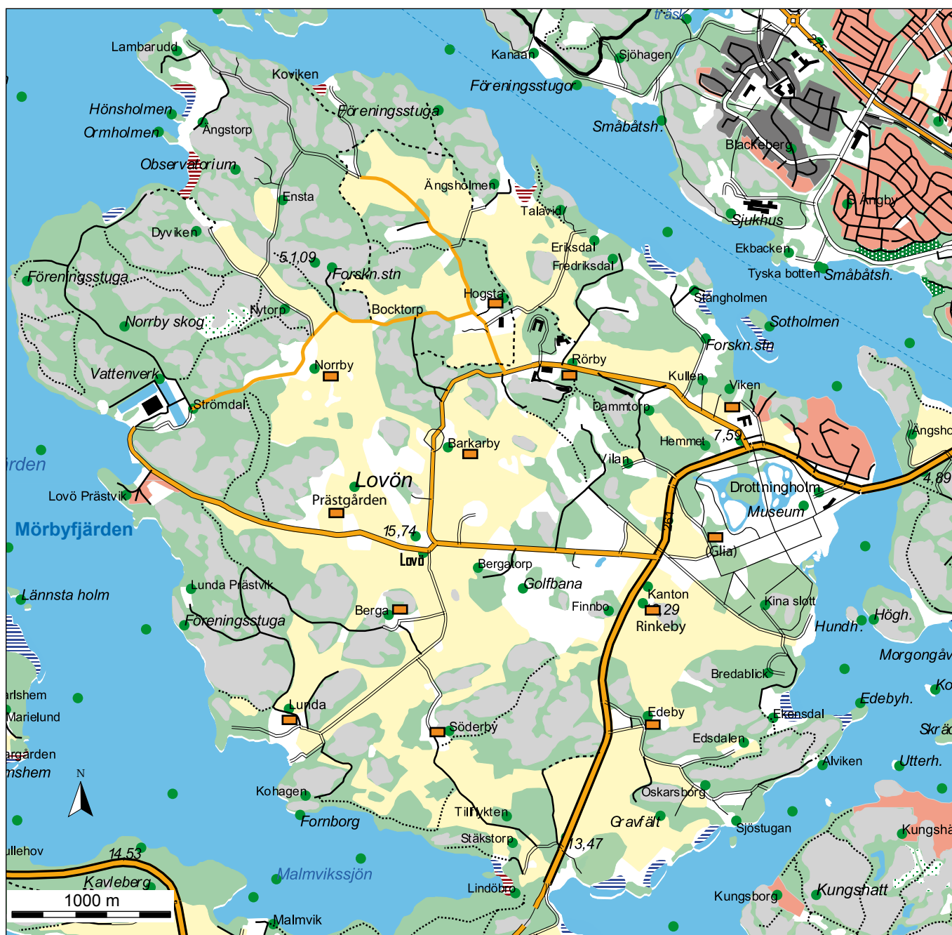
Lovö. (Utsnitt ur digitala terrängkartan).