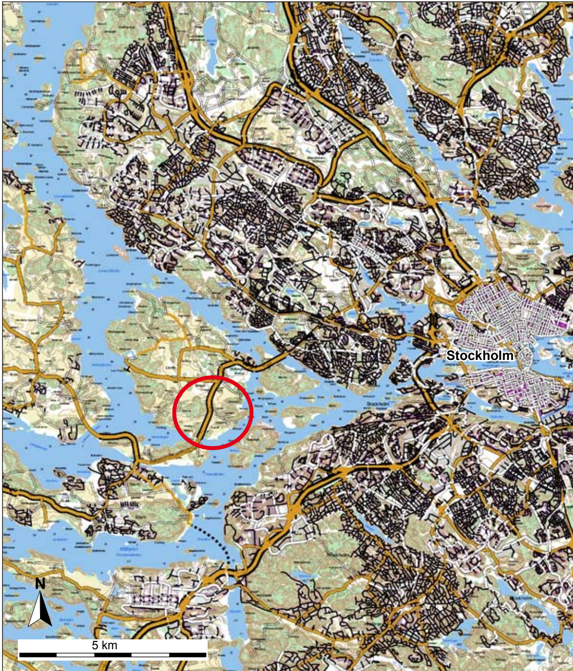
Fig 1. Utdrag ur digitala fastighetskartan med undersökningsområdet markerat. Skala 1:100 000.