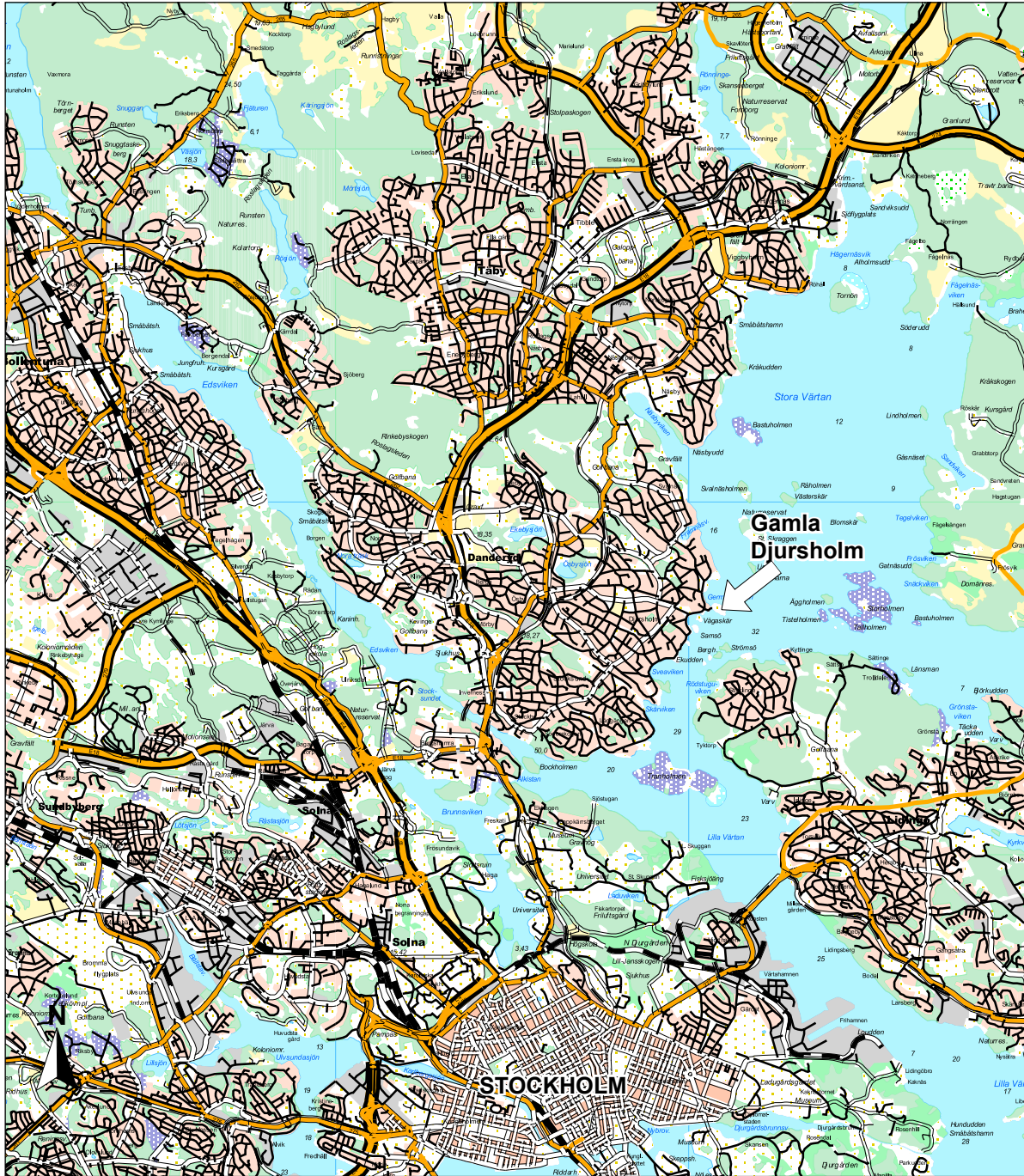
Fig 1. Utdrag ur digitala fastighetskartan med undersökningsområdet markerat. Skala 1:100 000.