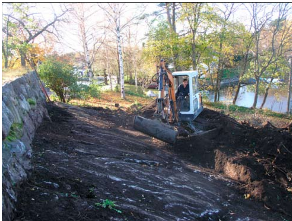
Fig 3. Schakt från NÖ.