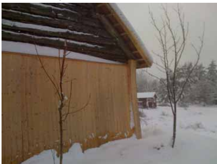
Norra gaveln efter reovering med halva fasaden panelfodrad och en snedställd vattbräda i mötet mellan panelen och timret. Knutarna har klätts in i skyddande lådor. Foto Sven Ahlbäck, 2008.

Före reoveringen var timret i norra gavelns nedre halva påverkat av både väder och rötskador och befanns vara i mycket dålig kondition. På inrådan av dåvarande antikvarisk kontrollant beslöts därför att klä in gaveln med en traditionell panel med enkla locklister samt de sönderfallna knutarna med lådor och med timret bevarat innanför. Detta har genomförts, dock med några avvikelser från arbetsbeskrivningen (se vidare under "Avvikelser").