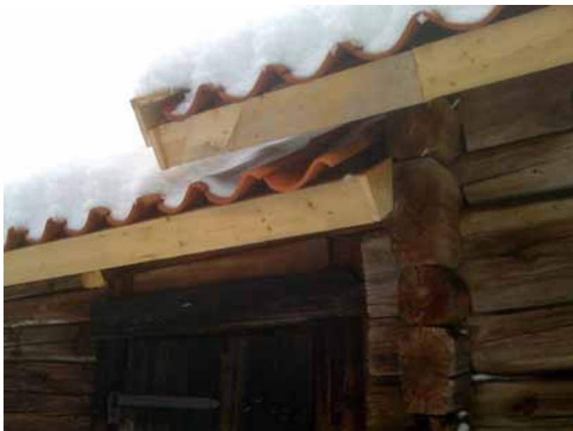
Mötet mellan den högre logen och den lägre snickarboden. Bägge med omlagda tak samt nya vindskivor och vattbrädor. Foto Sven Ahlbäck, 2008

Både taket på logen och snickarboden har omlagts med ny läkt och nytt enkupigt tegel samt kompletterats med nya vindskivor och vattbräder. Taknocken på logen har reparerats .