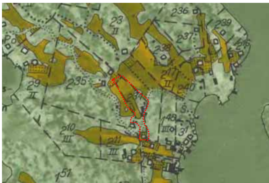
Ekonomiska kartan med fastigheten rödmarkerad