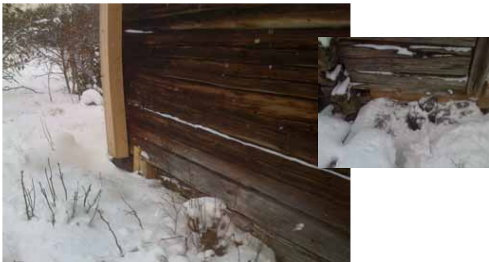
Västra långsidan efter reovering. Timret var mycket välhållet på denna sida, men har ändå stabiliserats med kramper. Norra hörnet har lyfts upp på en stolpe. Infälld bild: stödram/stödplanka under syllen. Foto Sven Ahlbäck, 2008

Utvändigt har bägge långsidornas väggar rätats upp och stockvarven förstärkts med sammantvingande järnkrampor. Stengrunden har kompletterats där den fallit ur och västra långsidans norra respektive södra hörn har lyfts upp med nya stöttor som i sinom tid skall bytas ut mot lämpliga stenar.