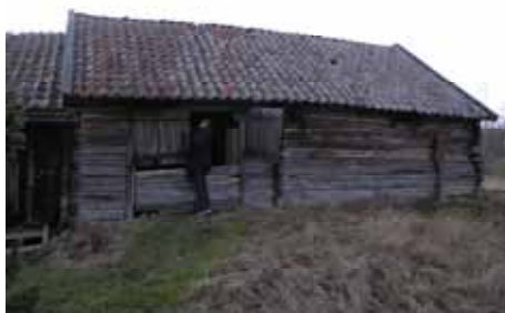
T.v. Logen sedd från öster före renovering Andreas Lindblad, Stockholms läns museum, 2008

Byggnaderna är uppförda i liggtimmer med utskjutande knutskallar. Arbetet har bestått i att logens stomme och knutar stabiliserats och att dess norra gavel klätts med stående brädpanel samt knutlådor. Grunden har reparerats och förstärkts och taket omlagts på bägge byggnaderna med nytt tegel samt nya vindskivor, nockbrädor och vattbräder. Därutöver har snickarbodens väggar stabiliserats och golvet reparerats.