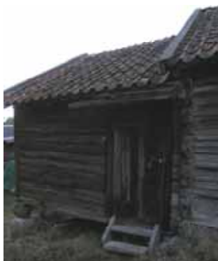
T.v. Snickarboden, sammanbyggd med logens södra gavel, före renovering. T.h. Längan med bägge byggnaderna från väster. I förgrunden den något yngre ladugården. Foto Andreas Lindblad, Stockholms läns museum, 2008