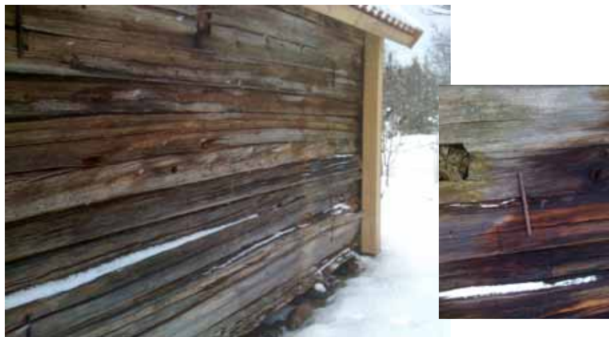
Logens östra långsida efter renovering. Väggen är uppräddad och timret hålls samman med ett antal järnkrampa). Infälld bild: järnkrampa

Renoveringens primära mål har varit att så långt som möjligt stärka samt rätta upp konstruktionen utan alltför stora ingrepp. Åtgärder som vidtagits är timret i norra gavelns hörnpartier invändigt försett med löpare och att bottensyllen i utsatta lägen förstärkts runt om logen med en underliggande stödräms/ stödräda. Timret har i enstaka fall skarvats där det varit nödvändigt.