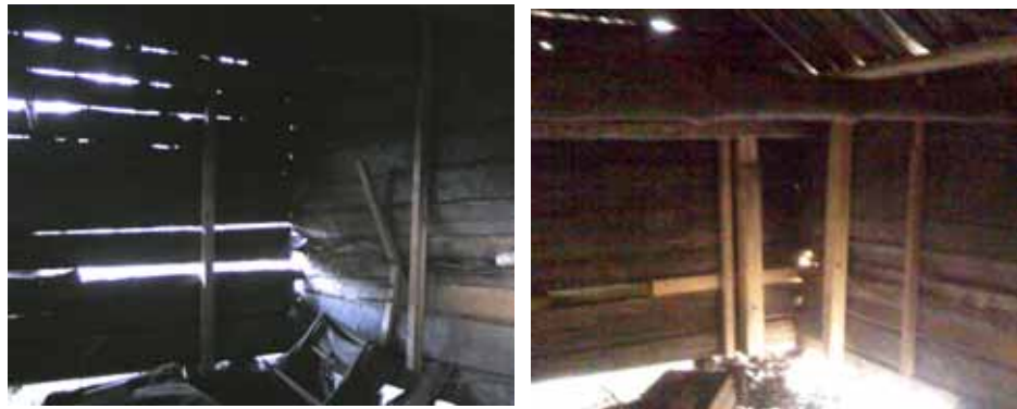
T.v. Norra gaveln invändigt före renovering, med stora springor mellan stockvarven. Foto Andreas Lindblad, Stockholms läns museum, 2008. T.h. Norra gaveln invändigt efter renovering. Timmerväggarna har stabiliserats med följare i gavelns resp hörn och skadat timmer bitvis skarvats. Foto Sven Ahlbäck, 2008

Logens långsida mot öster var kraftigt utkalvad dels på grund av sättningar, dels och mest beroende på att nordöstra gavelns rötskadade knutar sönderfallit och följaktligen sjunkit ihop. Samtidigt var norra gavelns timmer så urlakat av väder och vind att stora springor uppstått mellan varven. Försvagningarna i stommen hade även påverkat åstakets bärkraft, med en bägnande taknock till följd.