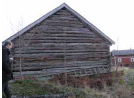
T.h. Logens norra gavel före renovering. Foto