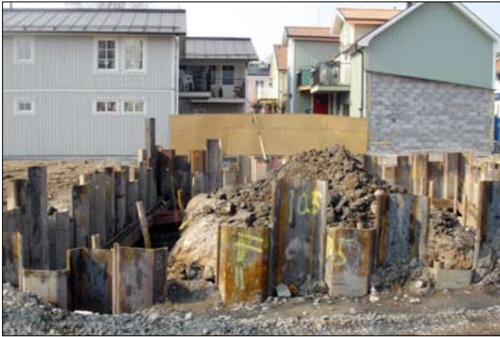
Arbetsområdet från öster. SSLM nr Lp 20080037.