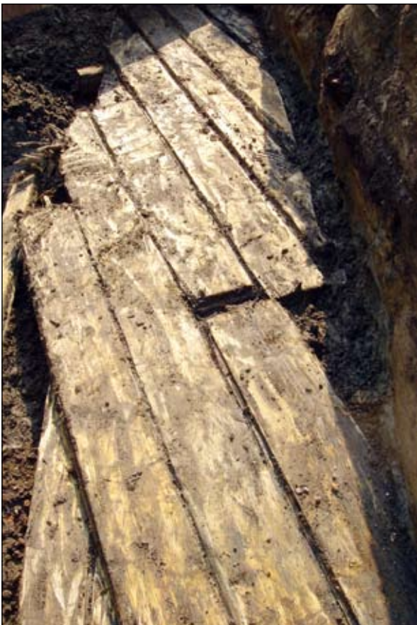
Den östra delen av rustbädden från norr. SSLM nr Lp 20080039