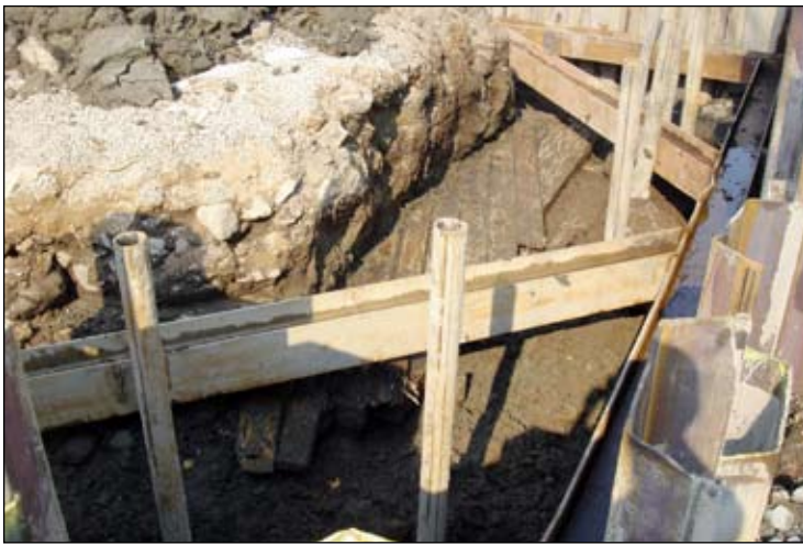
Den östra delen av rustbädden från sydöst. SSLM nr Lp 20080038.