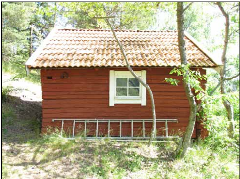
Källarboden från söder. Bildnr: lp20090372, Stockholms läns museum.