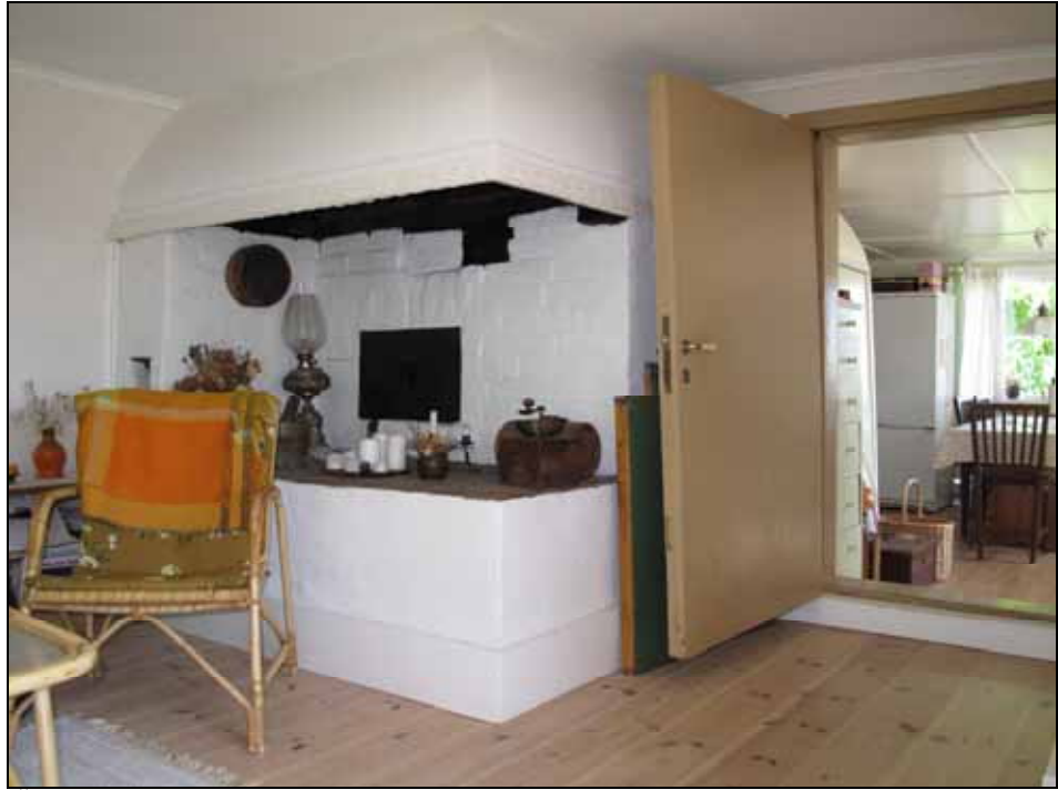
Öppen spis med bakugn i stugan. Bildnr: lp20090367, Stockholms läns museum.