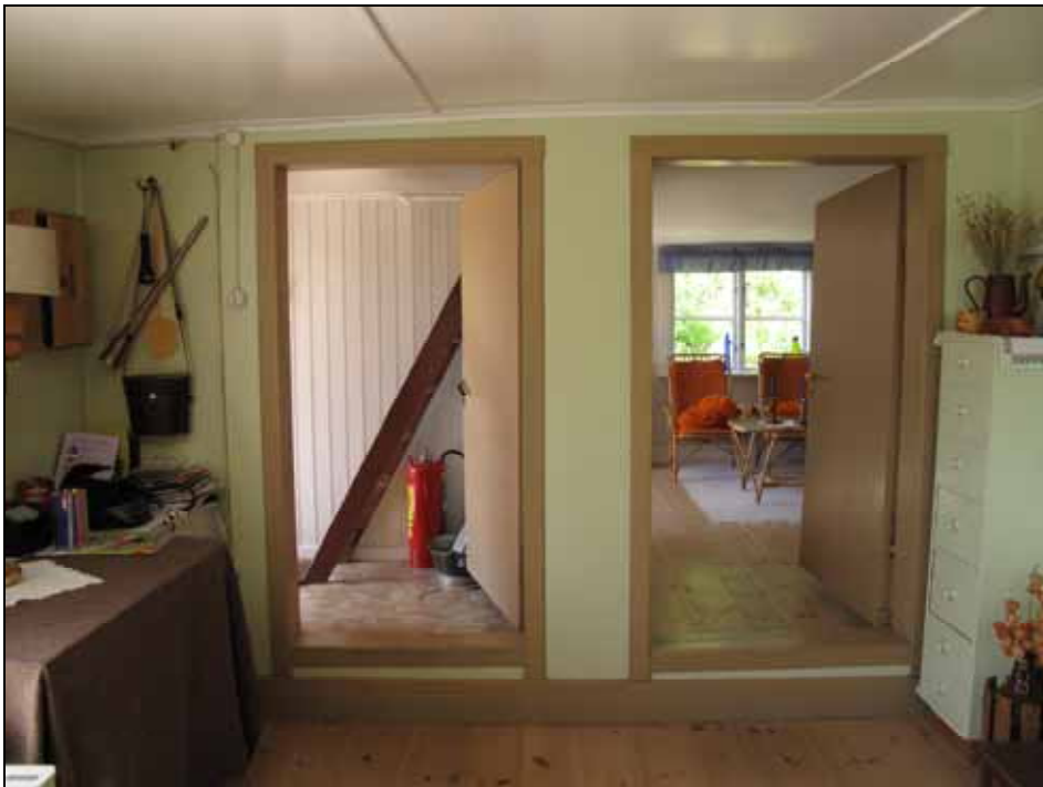
Torpet Landängen, interiör. Foto taget från kammaren (idag kök) mot stuga och inbyggd hall. Bildnr: lp20090366, Stockholms läns museum.