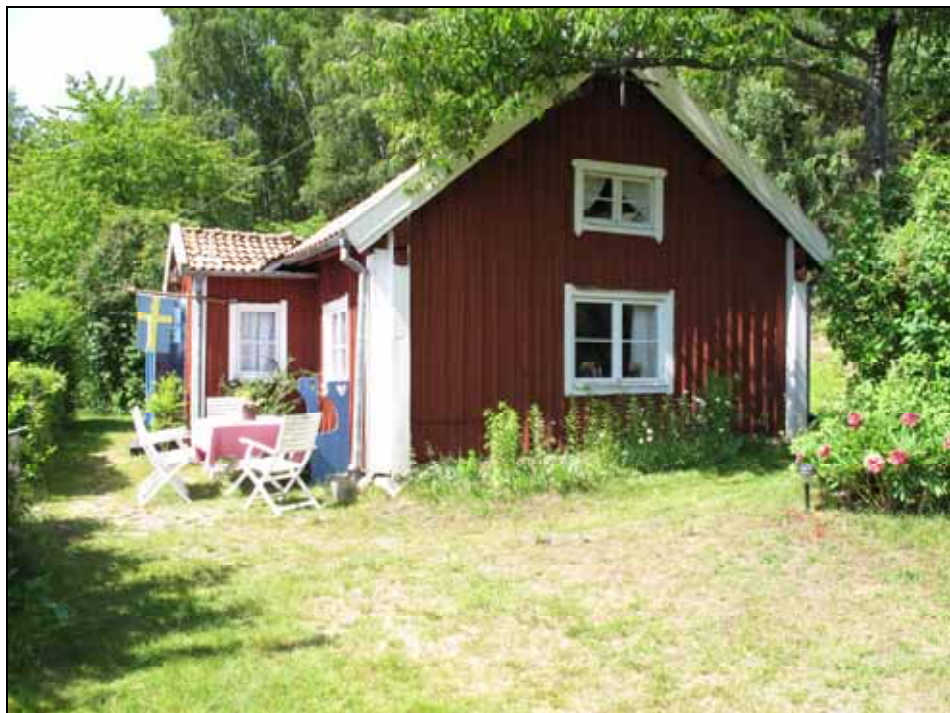
Torpet Landängen utgörs av en sidokammarstuga med tillbyggd farstuvist. Bildnr: lp20090364.