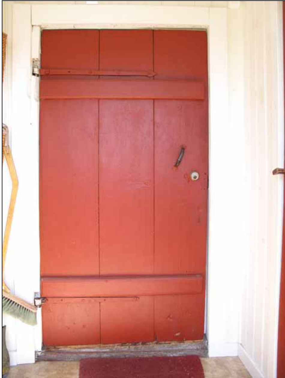
Inre entrédörr av stående brädor. Bildnr: lp20090369, Stockholms läns museum.