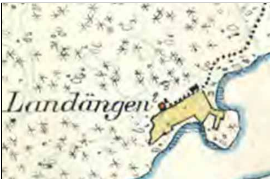
Landängens torp, utsnitt ur Häradsekonomiska kartan 1901-06, Lantmäteriverket Gävle.

1951 styckades fastigheten Landängen 1:1 upp av ett större antal fastigheter. Torpet Landängen har gett namn till området som idag i huvudsak är bebyggt med fritidshus.