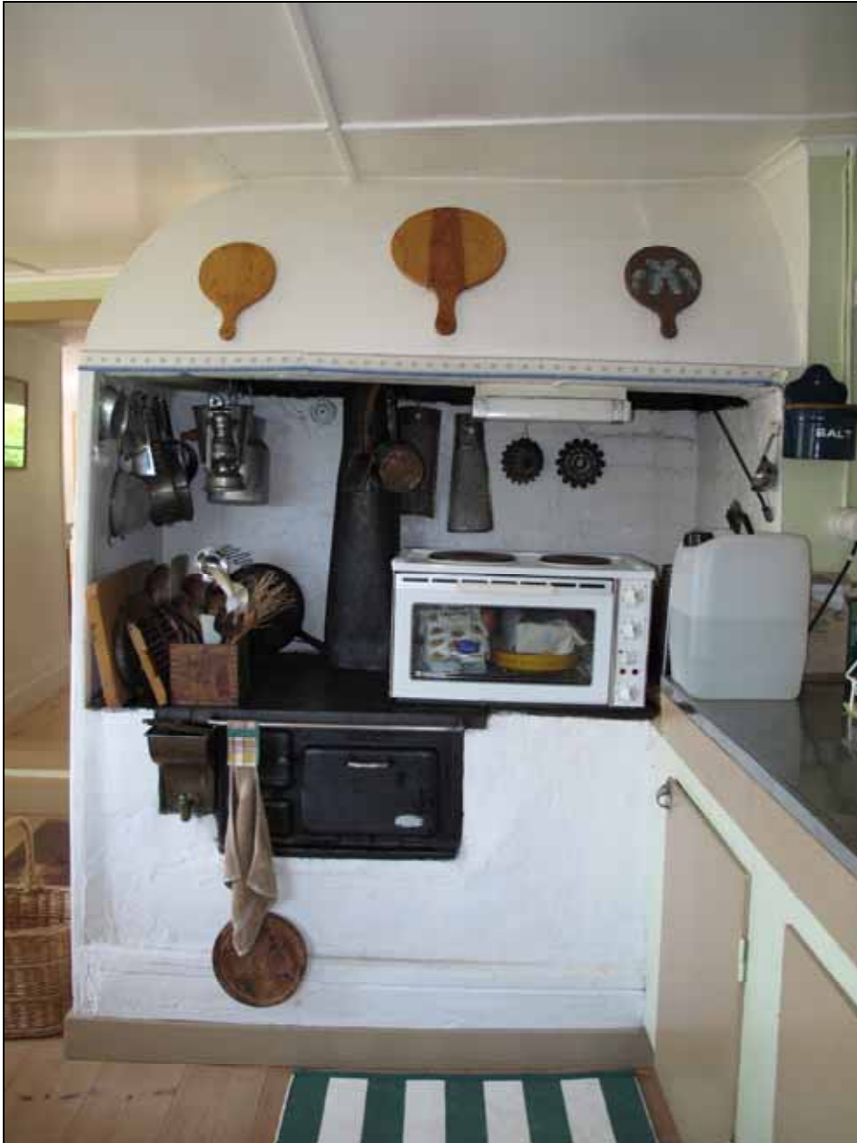
Öppen spis med järnspis. Bildnr: lp20090368, Stockholms läns museum.