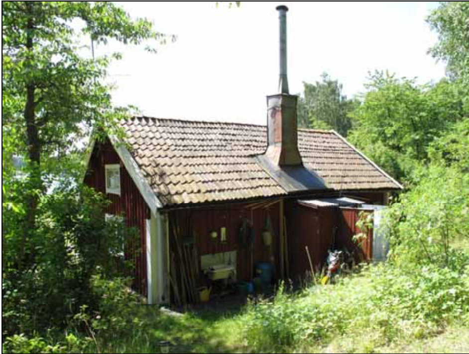
Torpet Landängen med plåtinklädd skorsten och tegeltak. Bildnr: lp20090365, Stockholms läns museum.