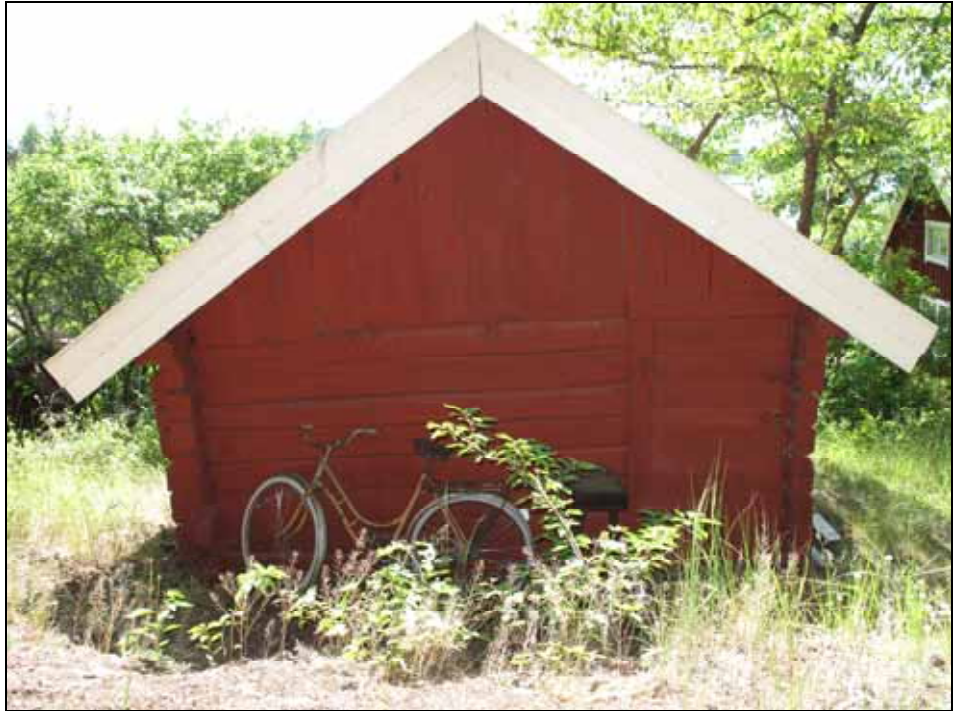
Källarboden från väst. Bildnr: lp20090371, Stockholms läns museum.