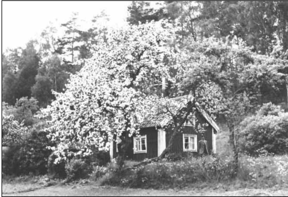
Torpet Landängen 1957.