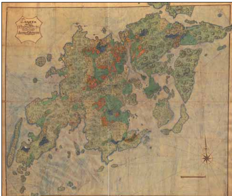
Muskö, Arealavmätning, 1773, Lantmäterimyndigheternas arkiv, Lantmäteriverket Gävle.