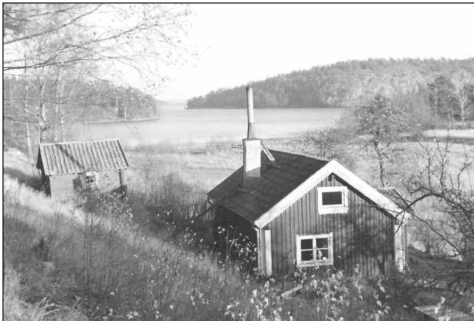
Torpet Landängen 1957.