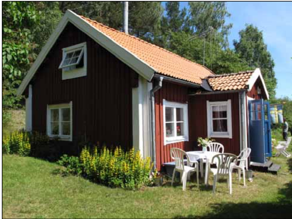
Fasaderna är klädda med rödfärgad locklistpanel. Bildnr: lp20090363, Stockholms läns museum.