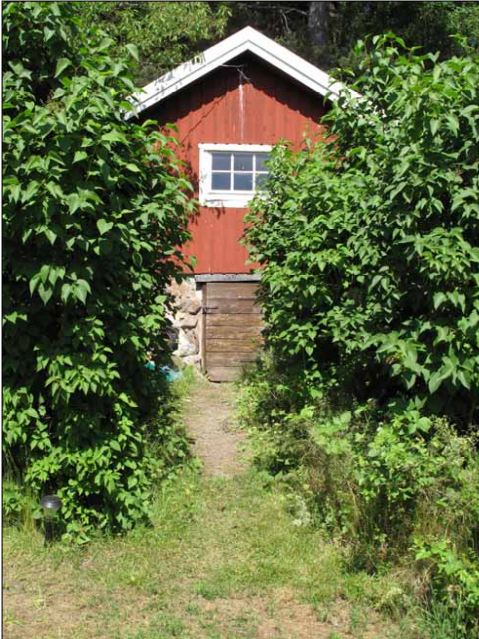
Källarboden från öster. Bildnr: Ip20090370, Stockholms läns museum.