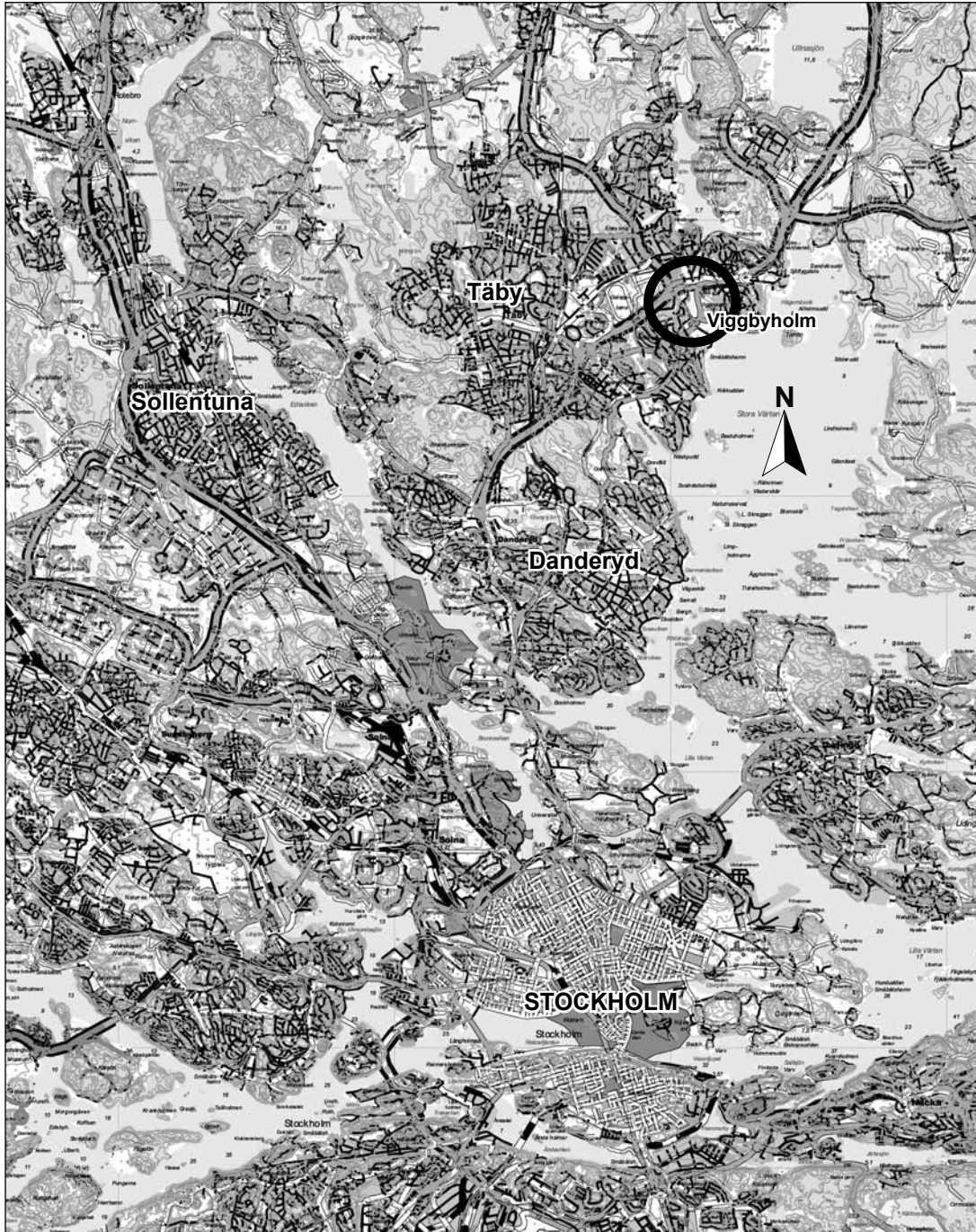
Fig 1. Utdrag ur digitala terrängkartan med platsen för undersökningen markerad. Skala 1:100 000.