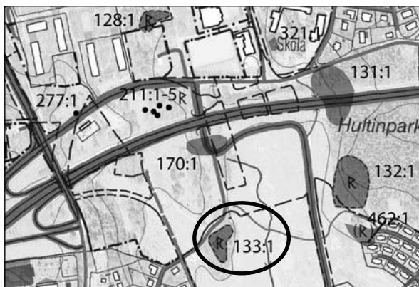
Fig 2. Utdrag ur digitala fastighetskartan med undersökningsområdet markerat med ring. Skala 1:10 000.

Fornlämningens tidigare kända utbredning lämnas efter avslutad förundersökning oförändrad.