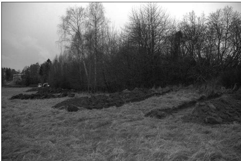
Fig 3. Tio sökschakt grävdes i syfte att avgränsa gravfältet, sett från norr.

I den mån det var nödvändigt rensades schaktens innehåll för hand med fyllhammare och skärslev.