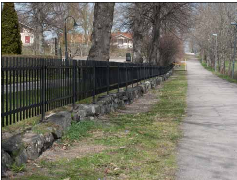
Den östra låga murens lösa stenar har justerats. Foto: Lisa Sundström. Bildnr: Ip20100122.

Den östra muren bestående av en grundmur är försedd med ett järnstaket, troligen härrörande från 1980-talet. Muren är kallmurad med till delar gjutna cementfogar. Enstaka stenar på den övre muren var lösa och några stolpinfästningar trasiga. Lösa stenar har lagts om och på ett enstaka ställe förstärkts med syrafri dubb samt fastgjuts dolt. En grind till minneslunden som tillkom under 1980-talet sattes igen varvid öppningen kompletterades med ett nytillverkat smidesstaket lika befintligt. Staketet som var något vridet har justerats något och kompletterats i överkant med plattjärn och förstörade infästningar. Staketet målades om i svart med färg lika befintligt.