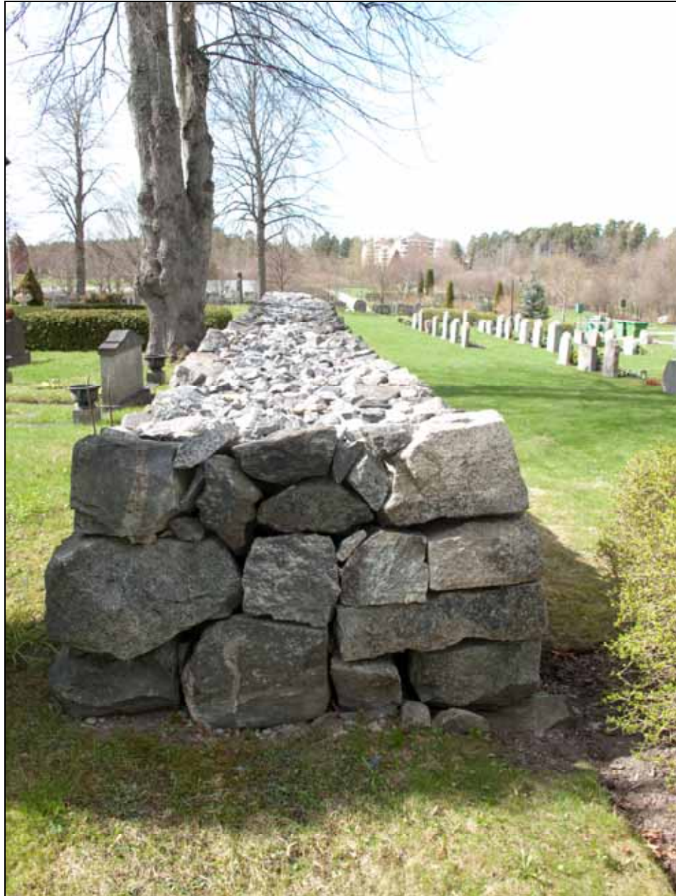
Den norra bogårdsmuren från öst efter renovering. Bildnr: lp20100125.