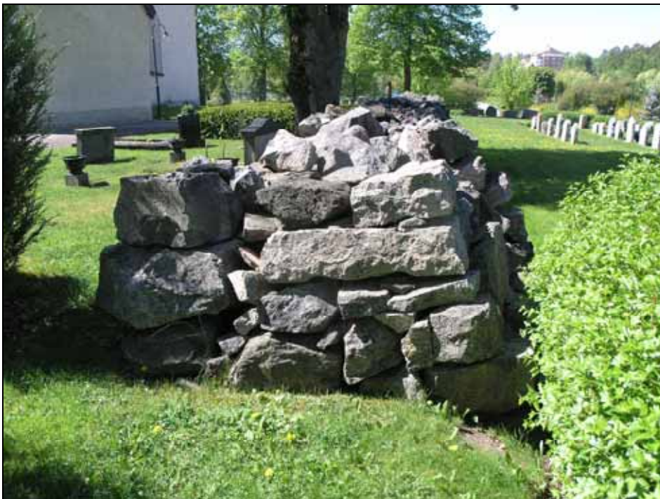
Den norra bogårdsmuren från öst före renovering. Bildnr: lp20100124.