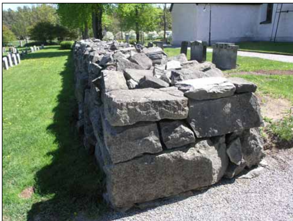
Norra bogårdsmuren från väst före renovering. Bildnr: lp20100123.

Del av den norra muren, ca 34 m lång, 1,0 m hög och 1,50 m bred, hade delvis rasat och s k kilsten saknades. Ca 30 % av muren har plockats ned och lagts om samt kompletterats med ny kilsten.