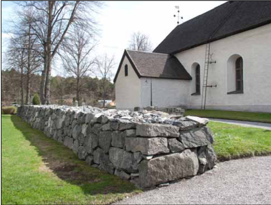
Den norra muren från väst, öster om ingång, efter omläggning och justering. Bildnr: lp20100121.