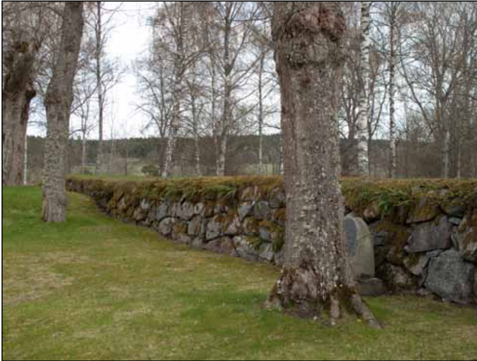
Den södra bogårdsmurens insida efter partiell omläggning. Bildnr: lp20100131.