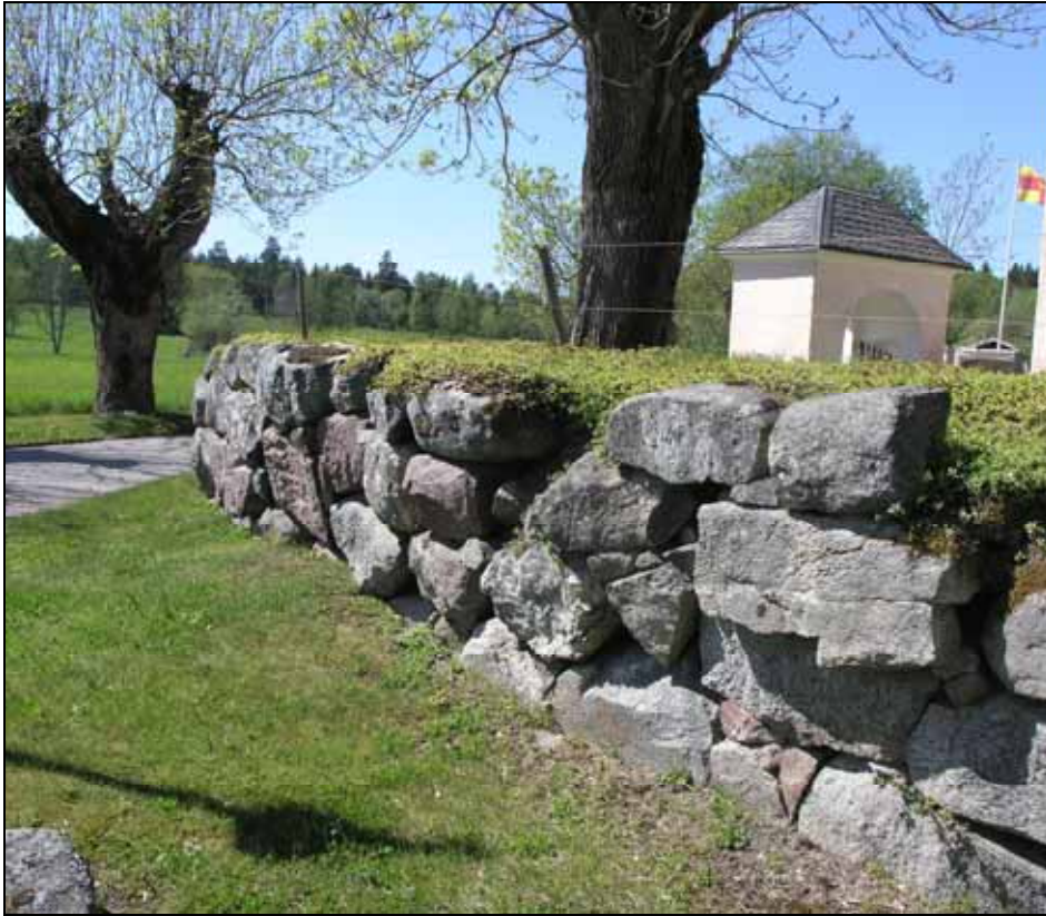
Den södra muren före renovering. Bildnr: lp20100127.