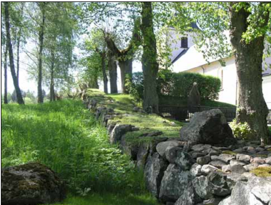
Den södra muren före renovering. Renovering utfördes fram till den stora stenen lagd på muren. Efter avslutade arbeten togs stenen bort. Bildnr: lp20100128.