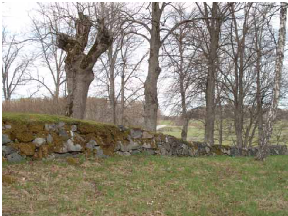
Södra bogårdsmuren efter partiell omläggning. Bildnr: lp20100130.