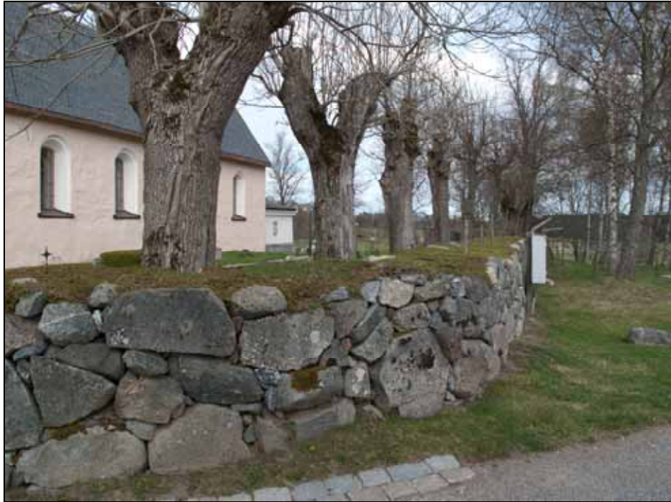
Den södra muren efter partiell omläggning. Bildnr: lp20100129.