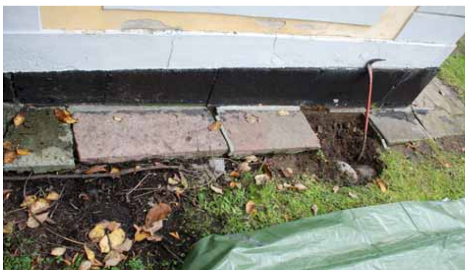
Ytligt liggande dagvattenledning av cementrör ligger parallellt med gravkorets grund. Bildnr: lp20100272