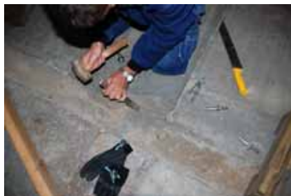
Tv. Flytspackel på stenen mejslas bort. Bildnr: lp20100254