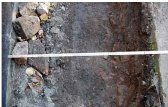
Gravvalvet kunde följas ca 85 cm utanför gravkorets västmur. Kammarens invändiga mått tyder på att den fortsätter under gravhällen. Bildnr: lp20100294