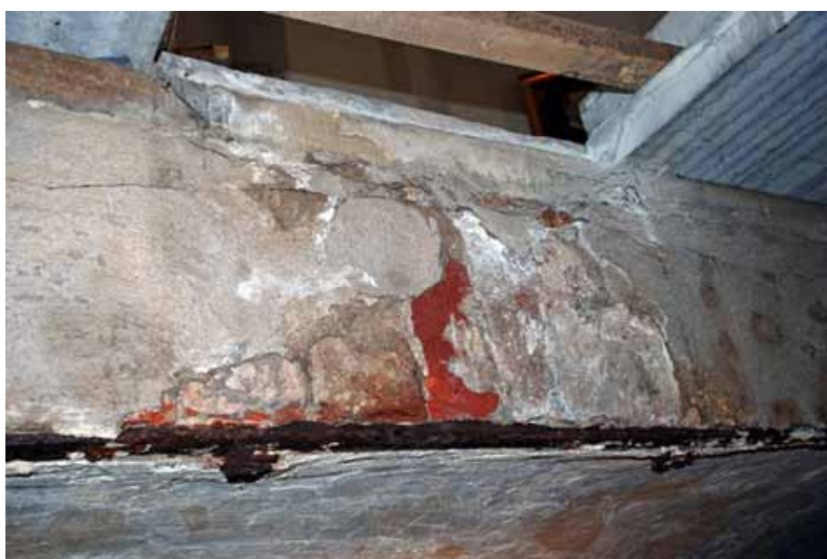
Valvet är murat med tegel av en stens tjocklek och förstärkt med plattjärn runt öppningen. Bildnr: lp20100266

I samband med förundersökningen gjordes en uppmätning av gravkoret och gravkammaren. Denna utfördes av Bengt Andersson, Mäteriet Alunda.