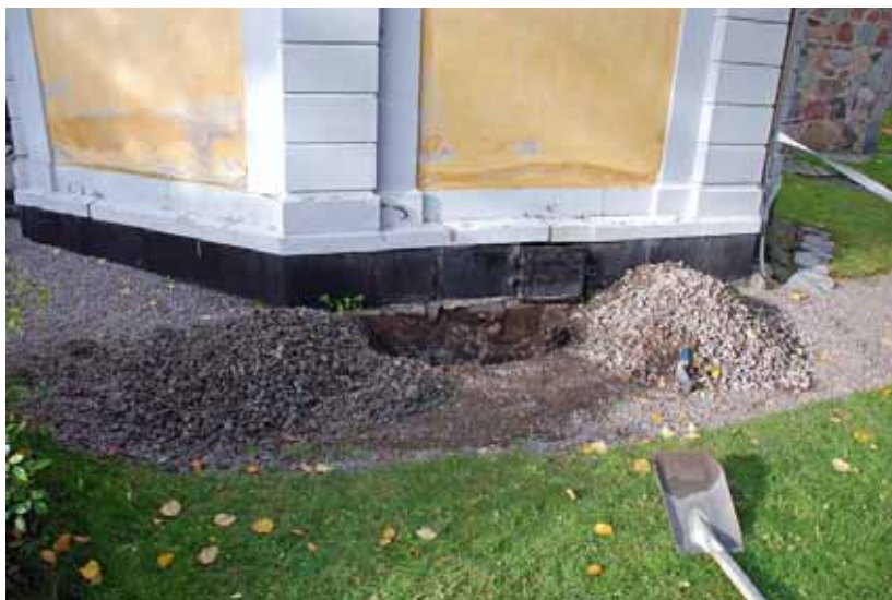
Provschaktets omfattning och läge vid gravkorets östra mur. Bildnr: lp20100251

Gravkammaren besiktigades genom att mittstenen i den tredelade kalkstenshällen lyftes. Mittstenen, som mäter 118 x 59 x ca 10 cm, liksom hela hällen är av senare datum än gravkorets byggnadstid.