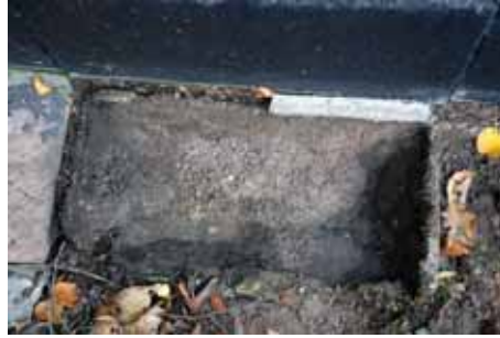
Plattor av sten lagda i en vagger av bruk med utjämmande grus och fogade med cement mellan plattorna och mot grunden. Bildnr: lp20100273 och lp20100274