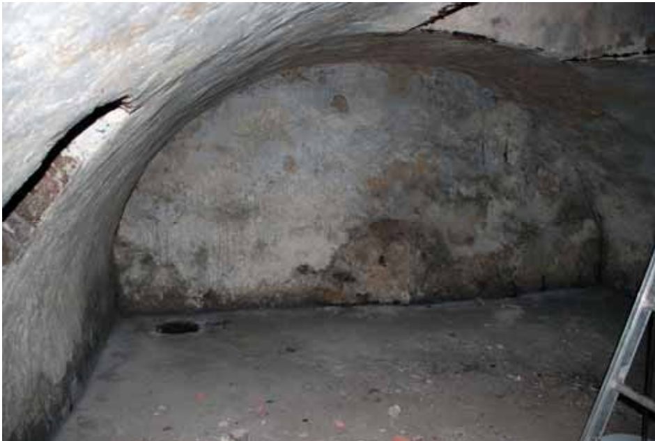
Gravkammare med murar av gråsten och tunnvalv av tegel. Rektangulärt rum med gavlar i norr och söder. Mot öster en murad glugg för ventilation. Gravkammaren har renoverats och fått cementgolv och golvbrunn. Väggar och valv har ursprungligen varit kalkputsade, senare överputsade med skifferputs som målats med färg som inte analyserats. Bildnr: lp20100264

Gravkammaren består av ett rektangulärt rum med fasade hörn mot norr. Gravvalvet är tunnvalvt med väggar och gavlar murade av gråsten och valv slaget av tegel. Väggar och valv är från början putsade med kalkputs, senare överputsade med en skifferputs och målade med en färg av okänd typ. Golvet har, okänt när, täckts med cement och golvbrunn har installerats. Möjligen finns ett äldre tegelgolv under cementgolvet.