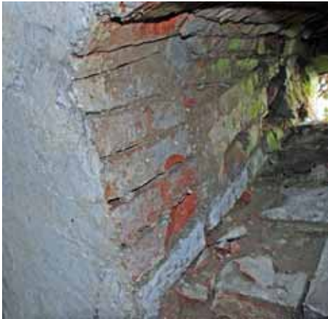
Tv. Tegelmur i glugg mot öster. Bildnr: lp20100267