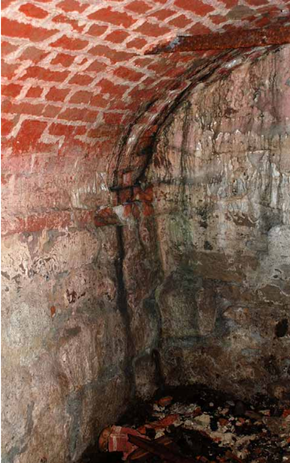
Missfärgning och fukt i västra delen av gravkammaren, den del av valvet som ligger utanför överbyggnaden. Gravvalvets sydvästra hörn. Bildnr: Ip20100286