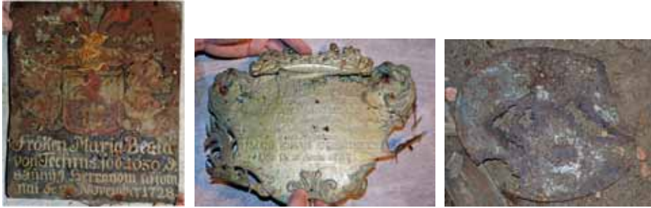
T.v. Kistplåt från 1728 över fröken Maria Beata von Technis. Bildnr: lp20100261 T.h. Kistplåt från 1732 över Jacob Johan Ehrenswerd (?) Bildnr: lp20100262 Längst t.h. Oidentifierad kistplåt från Langes gravkor. Bildnr: lp20100263

Gravkammaren består av ett rektangulärt rum med fasade hörn mot norr. Gravvalvet är tunnvalvt med väggar och gavlar murade av gråsten och valv slaget av tegel. Väggar och valv är från början putsade med kalkputs, senare överputsade med en skifferputs och målade med en färg av okänd typ. Golvet har, okänt när, täckts med cement och golvbrunn har installerats. Möjligen finns ett äldre tegelgolv under cementgolvet.