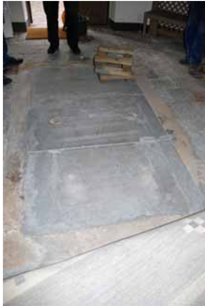
Tv. Kalkstenshäll i tre delar i nordsyd. Bildnr: lp20100252