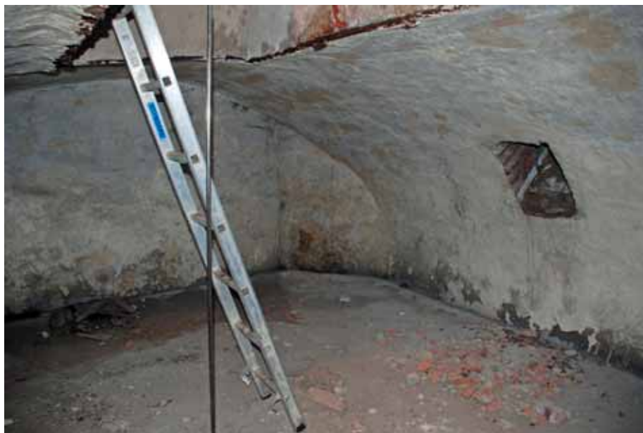
Gravvalv mot norr med avfasade hörn. Vid gaveln ligger namnplåtar från kistor. I tunnvalvets mitt finns en rektangulär öppning med nedgång till gravkammaren. Bildnr: lp20100265