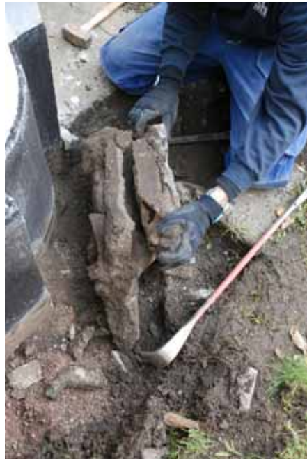
Tv. Brott på dagvattenledningen har orsakat läckage. Th. Del av ledningen vid gravkorets hörn är gjuten på plats. Bildnr: lp20100275 och lp20100276