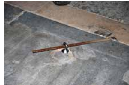
Th. Expanderbult skruvas in i stenen. Bildnr: lp20100255

Kalkstenshällerna var delvis avjämnad med flytspackel som mejslades bort för att kunna såga längs fogen. Det visade det sig att mittstenens ena hörn var avslaget på två ställen. Expanderbult skruvades in och stenen lyftes med hjälp av domkraft.