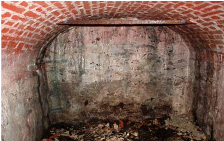
Gravkammaren med tunnvalv parallellt med kyrkans sydmur. I väster ligger ca 1 meter av kammaren utanför gravkorets västmur. Dragjärnen har murats in för att förstärka valvet, troligen redan i samband med att gravkammaren byggdes. Bildnr: lp20100285

Gravkammaren har golv lagt av tegel. Väggarna är murade av gråsten upp till valvets anfang. Kammaren täcks av ett tunnvalv som är slaget av tegel. Väggarna är kalkputsade och kalkavfärgade i svagt rosa. Tegelmurar vid öppningen är kalkputsade och avfärgade med en tegelimiterande målning. Tunnvalvet är förstärkt med två dragjärn. Dragjärnet i väster motsvarar läget för det ovan liggande gravkorets västmur vilket talar för att det är inmurat samtidigt med valvslagningen. Västligaste partiet av valvet uppvisar mera nedsmutsade ytor än övriga delar av rummet. En trolig anledning är att den delen av valvet ligger utanför överbyggnaden och nästan direkt under marknivån utan skydd mot fukt. Dessutom ligger en ytlig dagvattenledning ovanför valvet. Eftersom dagvattenledningen varit igensatt av en lövpropp och frusit sönder har den västra delen av valvet utsatts för stora mängder vatten.