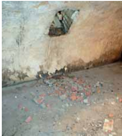
Th. Nedanför gluggen ligger vittrat tegel. Bildnr: lp20100268