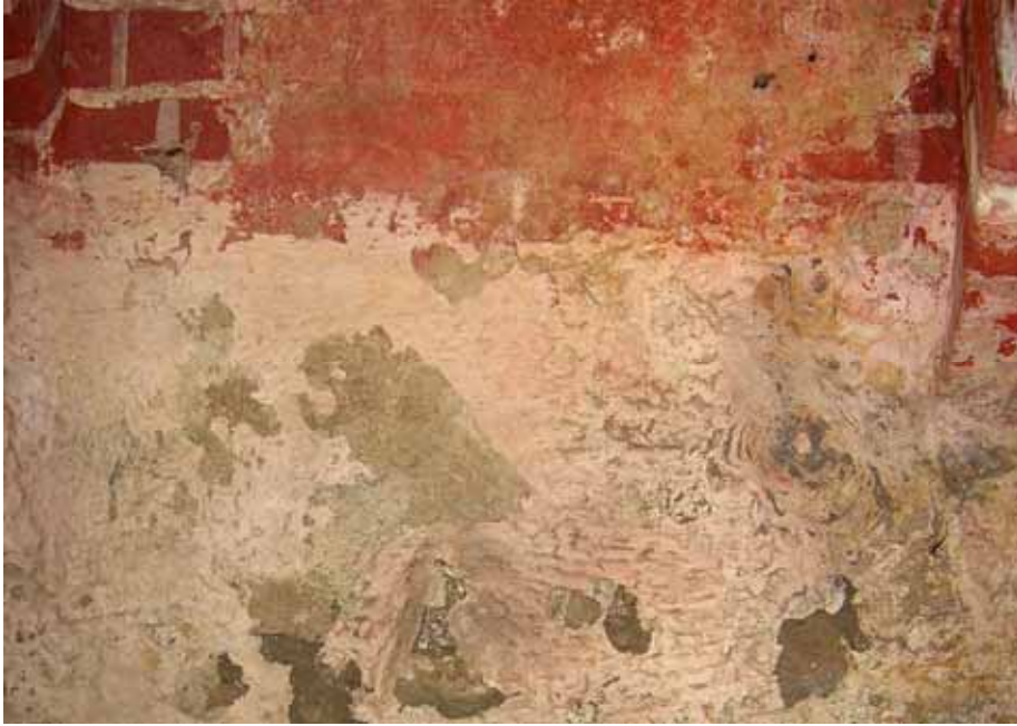
De gråstensmurade väggarnas insida är tunt kalkslammade och avfärgade i svagt rosa. Bildnr: lp20100292