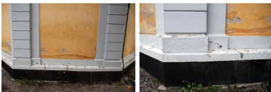
Tv. Fuktskador i gravkorets putsade mur. Th. Skador på linolja-målad sandstenslist över asfaltstruken (tidigare tjärad) sockel av Roslags-sandsten. Bildnr: lp20100249 och lp20100250

Med syfte att göra iakttagelser om gravkorets fuktproblem inleddes förundersökningen med besiktning av grundmuren från utsidan. En provgröp ca 60 cm utefter östra fasaden och 30 cm ut från fasaden grävdes i en första etapp till ca 70 cm djup. Fyllnadsmaterialet, under den marktäckande singeln, bestod till 100 % av makadam. För att få en bättre uppfattning om grundmurens uppbyggnad fortsatte grävningen ner till ca 100 cm djup fortfarande med makadam som enda fyllning.