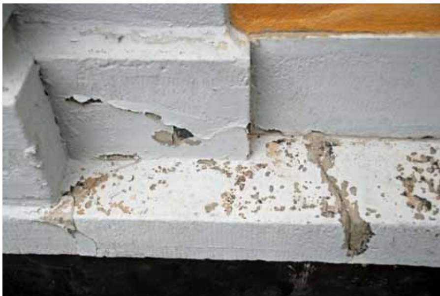
Lågerhuggen sandstenslist målad med oljefärg vid restaureringen år 2000. Bildnr: lp20100259