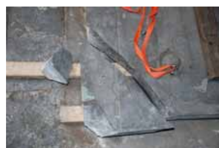
Ett hörn var avslaget och lagat. Bildnr: lp20100257