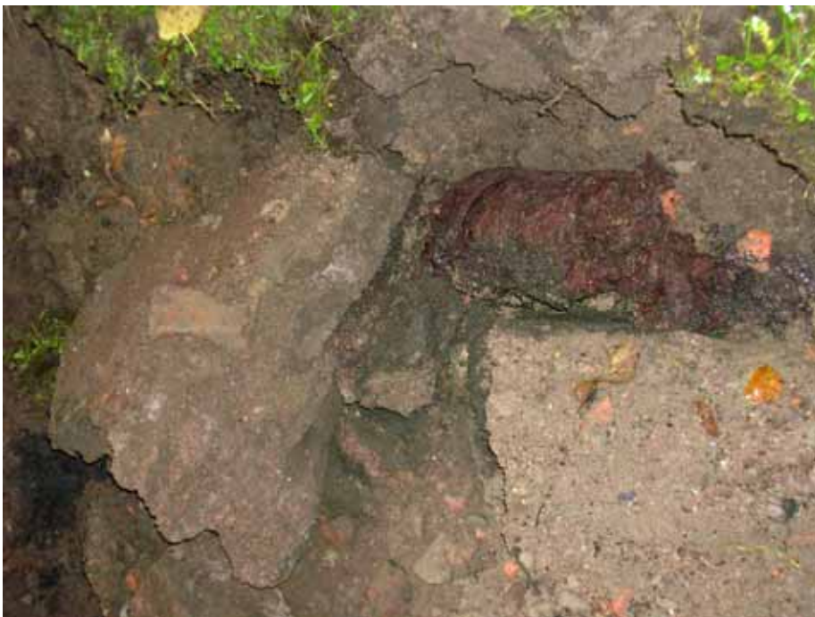
Det mörka i bilden är en lövpropp som bildats i dagvattenledningens platsgjutna del. Bildnr: lp20100281