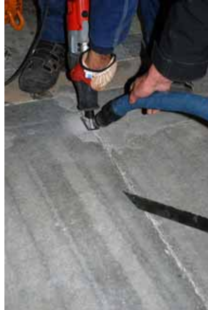
Th. Fogbruket sågas längs fogen. Bildnr: lp20100253