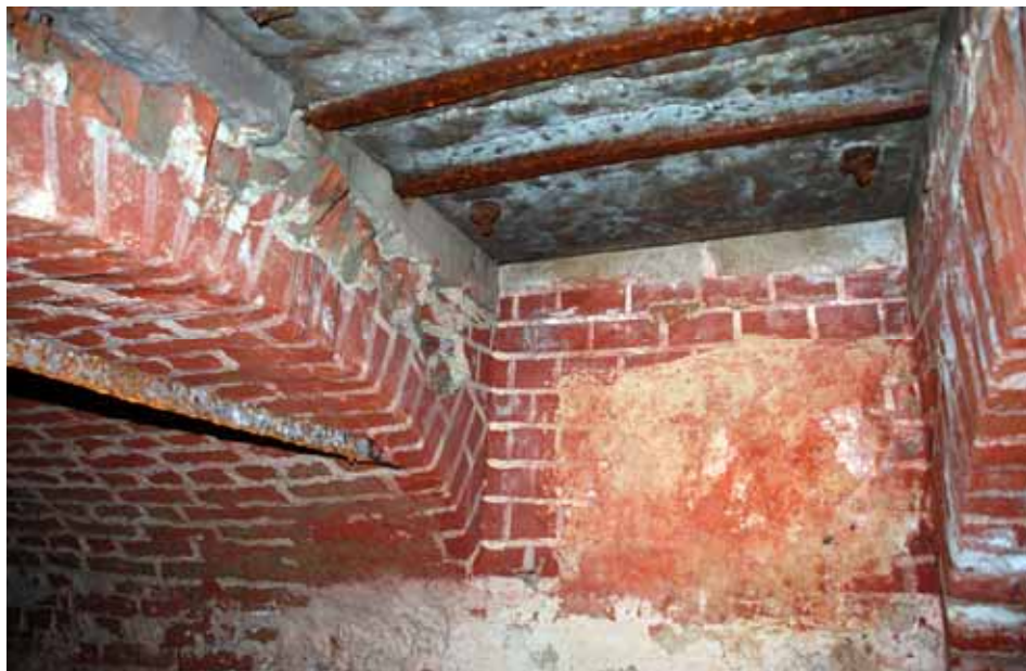
Under öppningen i öster är väggpartiets kalkputs målad i ett tegelimiterande mönster. Därunder är väggen kalkputsad och avfärgad i svagt rosa. Dragjärn inmurat i tunnvalvet. Bildnr: lp20100291

Öppningen till gravkammaren ligger i öster. Runt öppningen ligger en stenram som vilar på tunnvalvet och på en avlastningsbåge i östra muren.