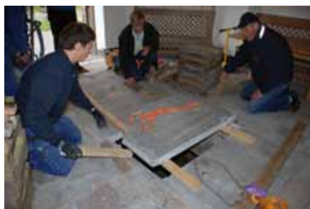
Mittstenen till kammaren har lyfts. Bildnr: lp20100256

Kalkstenshällerna var delvis avjämnad med flytspackel som mejslades bort för att kunna såga längs fogen. Det visade det sig att mittstenens ena hörn var avslaget på två ställen. Expanderbult skruvades in och stenen lyftes med hjälp av domkraft.