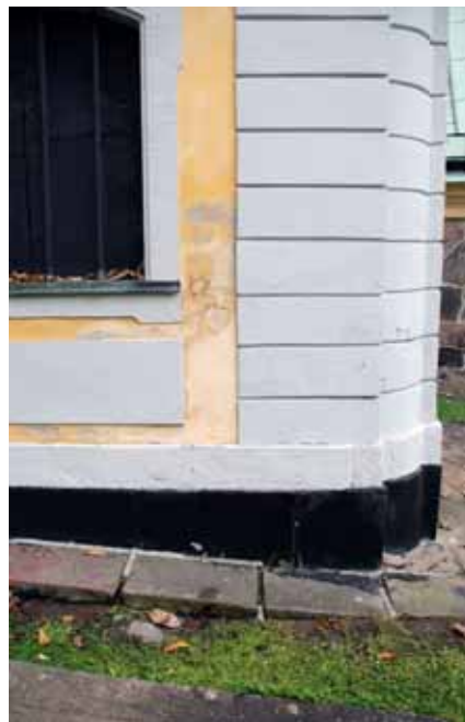
T.v. Stupspråk i hörn mot kyrkans långhus leder ner vatten från stora delar av kyrkans takfall mot söder. T. h. Stenläggning intill gravkoret lyftes upp och sparades. Bildnr: lp20100270 och lp20100271