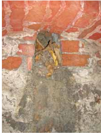
Avlastningsbåge vid östra muren med glugg igentäppt av skräp och löv. Bildnr: lp20100287 och lp20100288