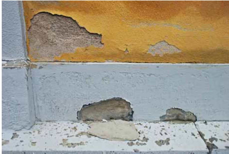
Fuktskador på sandstenslist och putsad fasadmur av tegel. Bildnr: lp20100260

Den skadade sandstenslisten är målad med oljebaserad färg. Listen uppvisar omfattande skador där stenen har vittrat och bitar lossnat. Den putsade muren ovanför har skador orsakade av fukt och ytor där putsen släpper. Synliga fuktskador förekommer på gravkorets samtliga fasader.