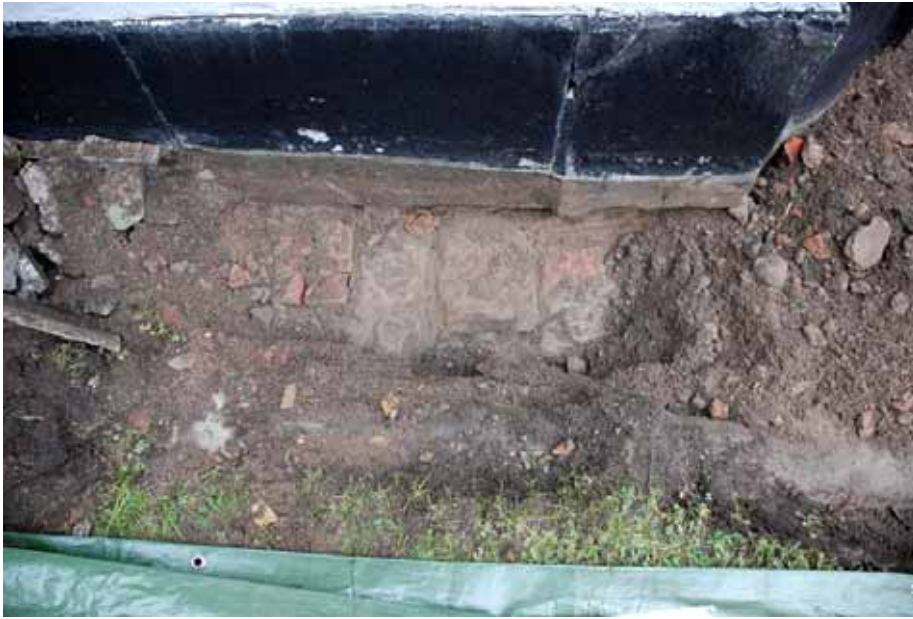
Frilagda konstruktioner och dagvattenledning. Bildnr: lp20100280