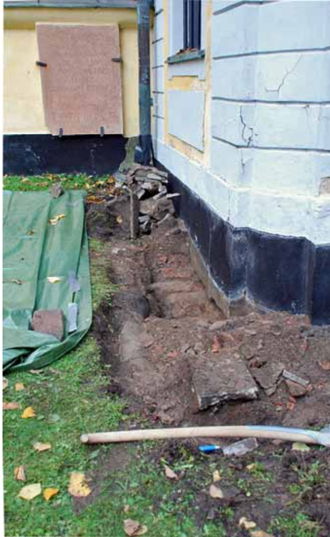
Grävningens utbredning oktober 2008 kom att omfatta ett större område än som först var planerat. Upptäckten av den läckande dagvattenledningen medförde att cementrören måste bytas mot en tillfällig ledning av plast i samma läge över tegelvalvet. Bildnr: lp20100282