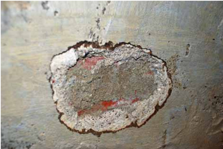
Gravvalvet var ursprungligen kalkputsat, senare överputsat med skifferputs (det mörkare skicket) och målats med obekant färgtyp. Bildnr: lp20100269