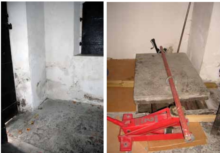
Langes gravkor med stengolv, kalkputsade tegelväggar samt fönsterluckor av järn. Fuktskador i muren i sydvästra hörnet. Bildnr: lp20100293 och lp20100283

Gravvalvet öppnades genom att stenhällen i sydöstra hörnet av gravkoret lyftes upp. Gravkammaren besiktigades och kistorna befanns vara så skadade att det var svårt att bestämma antal kistor. Sex kistplåtar hittades och togs till vara för identifiering och restaurering av metallkonservator.