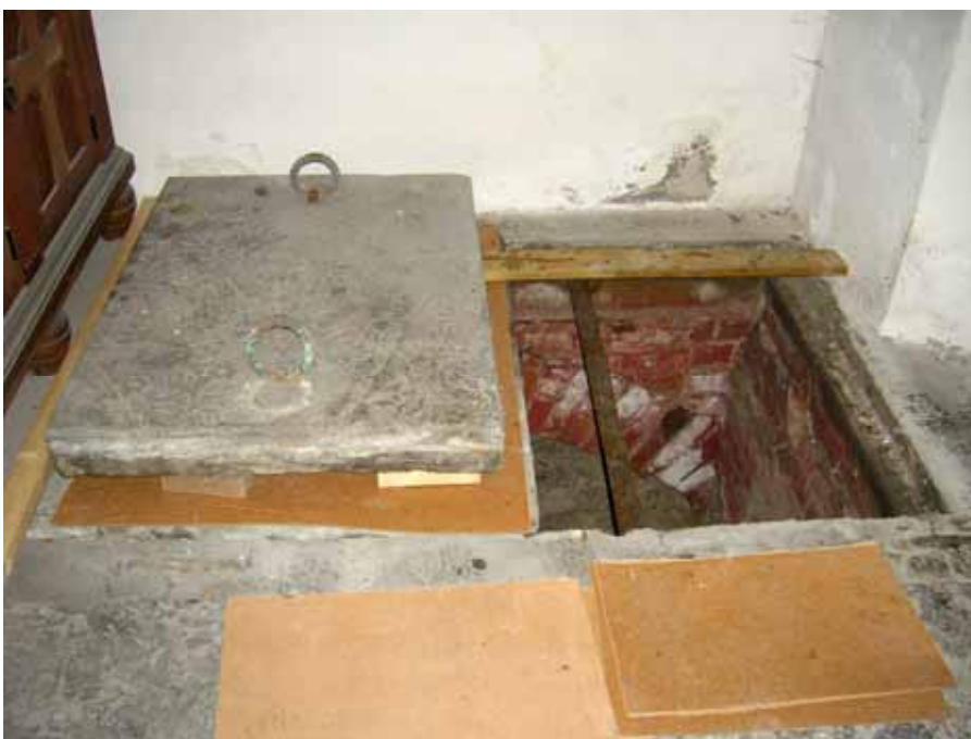
Nedgång till gravkammaren i SÖ hörnet av gravkoret. Bildnr: lp20100284