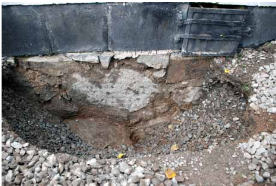
Provschakt med grundmur av gråsten frilagd ner till ca 1 meters djup. Bildnr: lp20100258

Grundmuren består under marknivå av stora, tuktade grästensblock och liggande, icke tuktad sten synlig vid ca 1 meters djup. Ovan mark täcks sockeln av huggen, sandstenskvarer av Roslagssandsten struken med svart asfalt över tidigare tjärstrykning. Marken närmast grundmuren är tidigare utgrävd och fylld med makadam till ett djup av minst en meter.