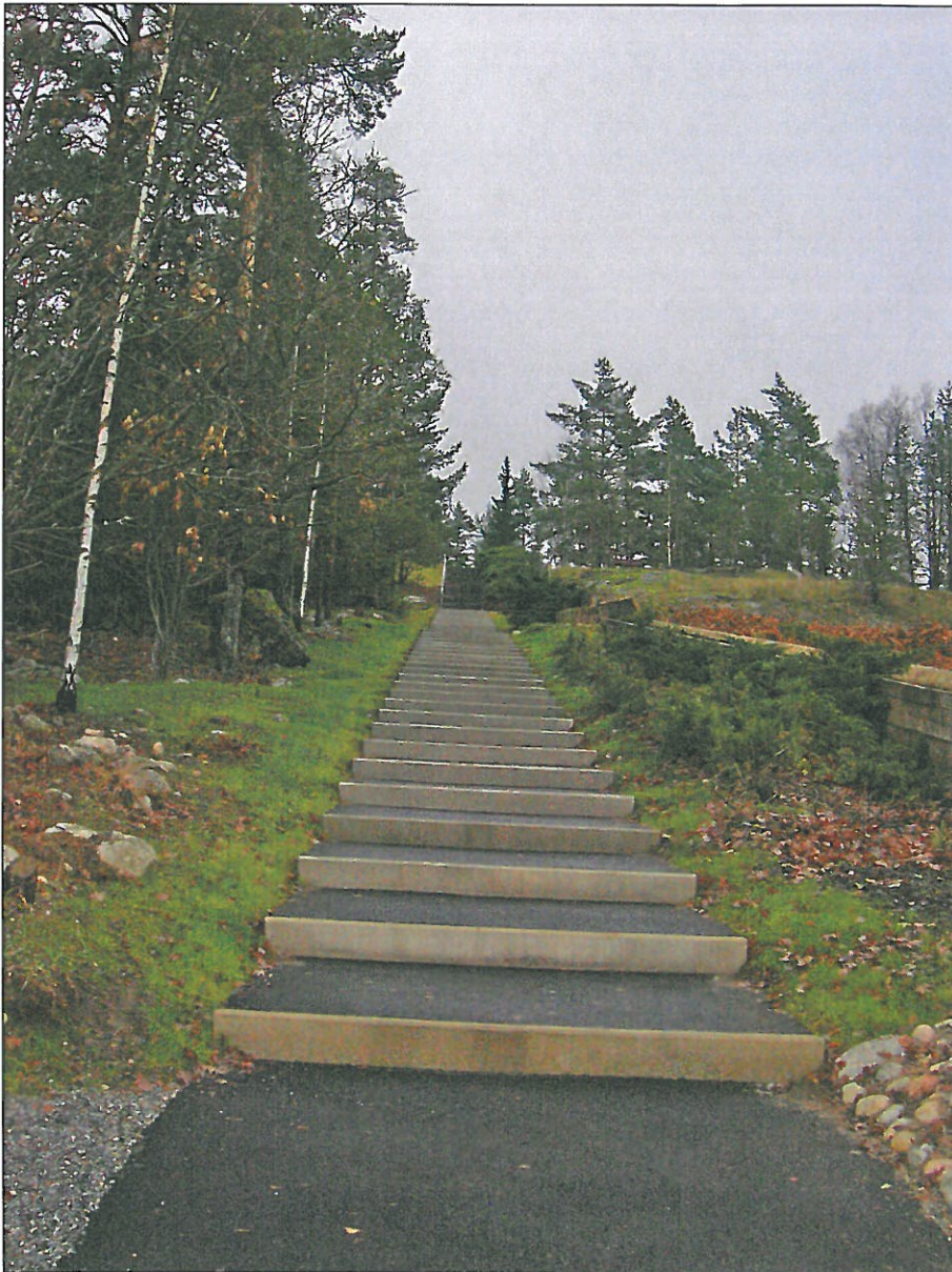
Gångtrappans kantstöd av betong har ersatts med nya stöd i 2 meters längder. Marken på båda sidor om trappan har återställts. Trappplanets djup har kortats för att stämma med 3 steg/plan. Bildnr: lp20100375