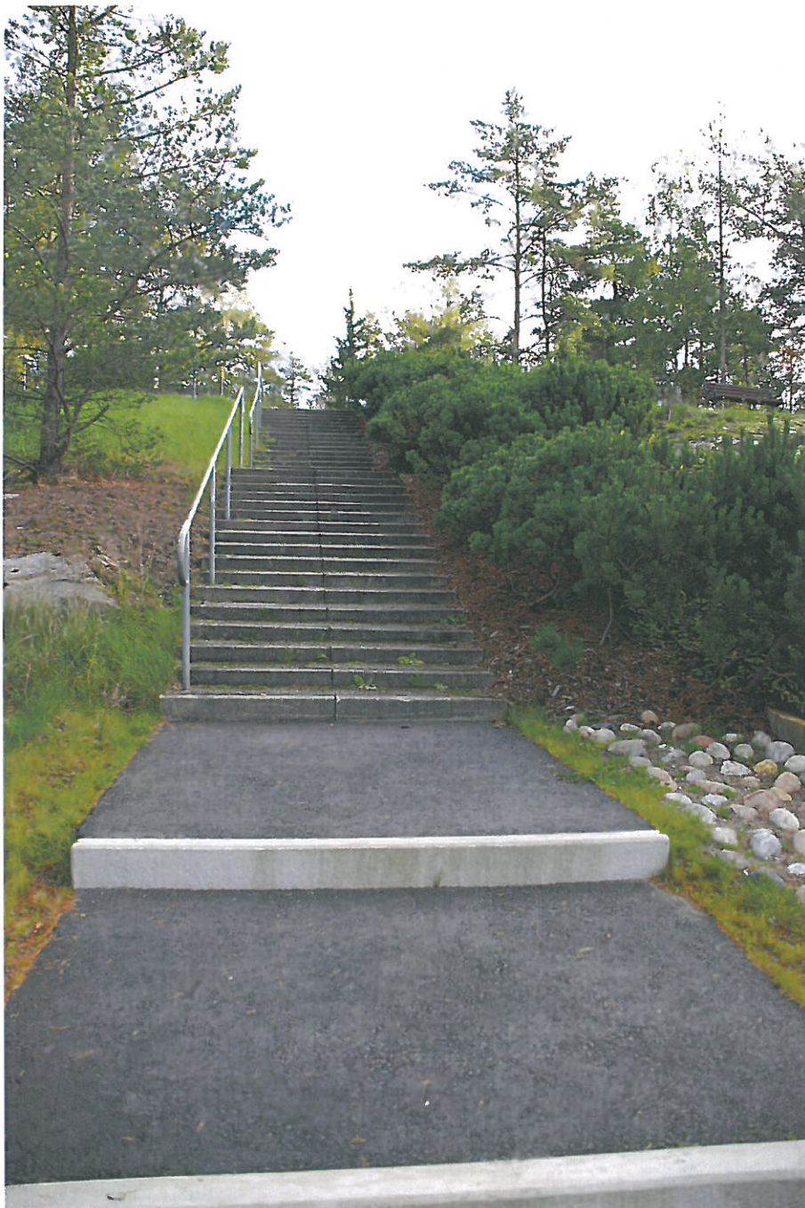
De två översta trapploppen före renovering. Trappan i etapp 2 är en fortsättning av den i etapp 1 renoverade delen av gångtrappan. Bildnr: lp20100377

I etapp 2 åtgärdades hösten 2008 de två översta trapploppen av gångtrappan vid vattentrappan. De var utformade med kantstöd av betong och plansteg av asfalt lika övriga trappan upp till minneslunden från Pilgrimskapellet. De var vidare försedda med handledare på ena sidan. Enligt handlingarna skulle anläggningen utföras med två raka fribärande enloppstrappor av gjuten betong (Trappa typ M1- 11-1 från Strängbetong). Även våningsplanet mellan trapporna skulle utformas som ett prefabricerat våningsplan i betong.