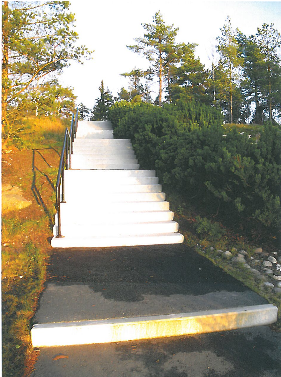
Etapp 2 efter renovering. Bildnr: lp20100380