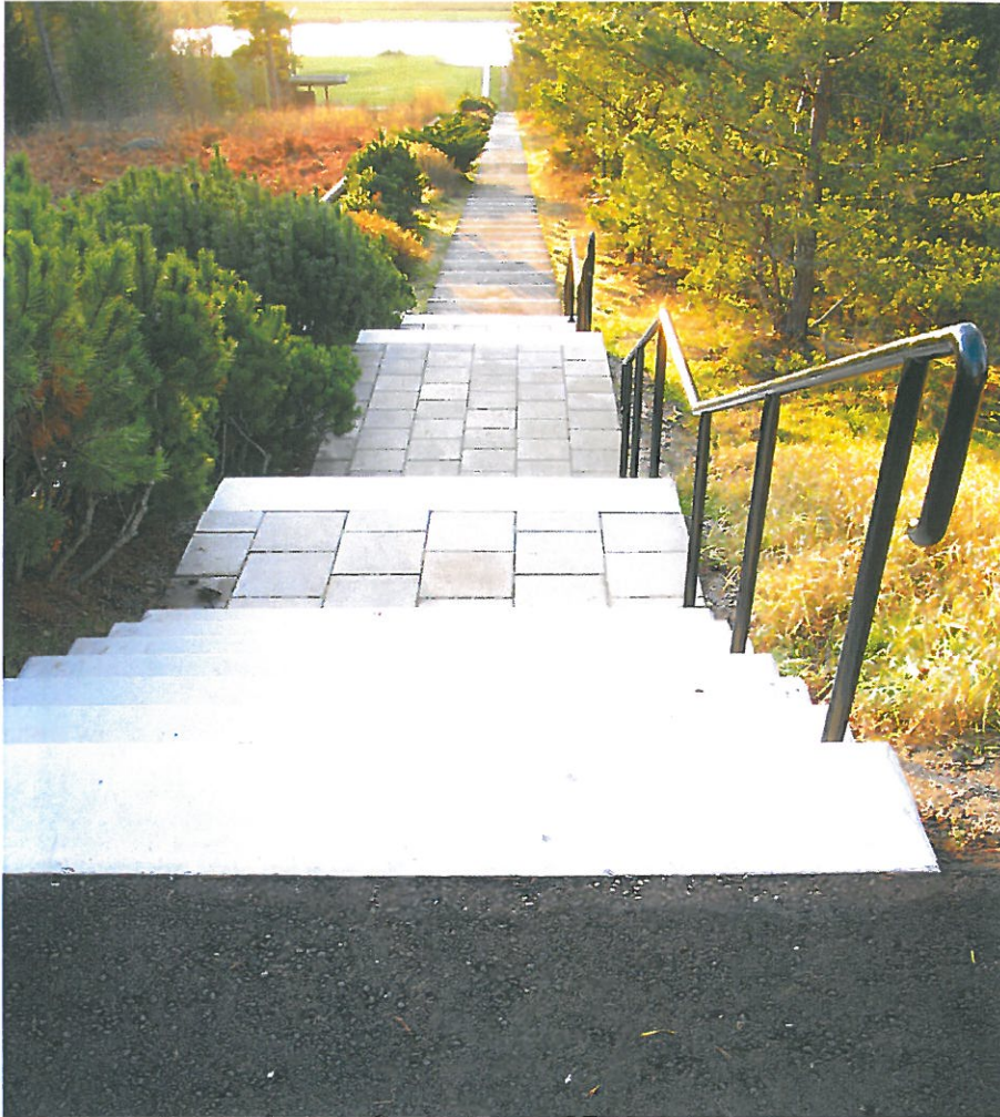
Etapp 2 efter renovering. Fyra fribärande trappor gjutna i betong med ytbeläggning av Terrazzo. Mellanliggande trappplan belagda med standardplattor i betong. Nya, målade handledare. Bildnr: lp20100379