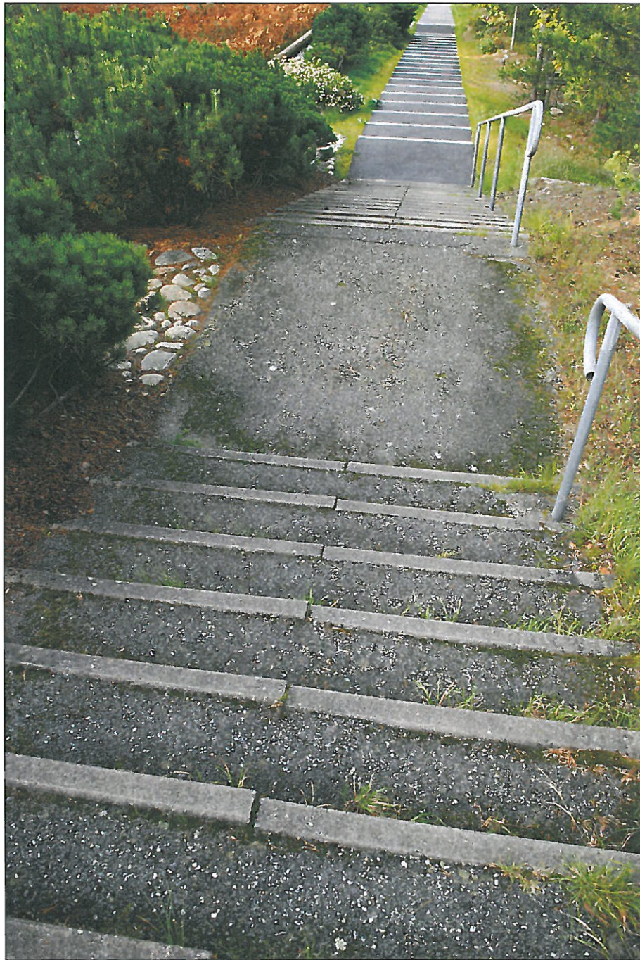
Etapp 2 före renovering. Bildnr: lp20100378