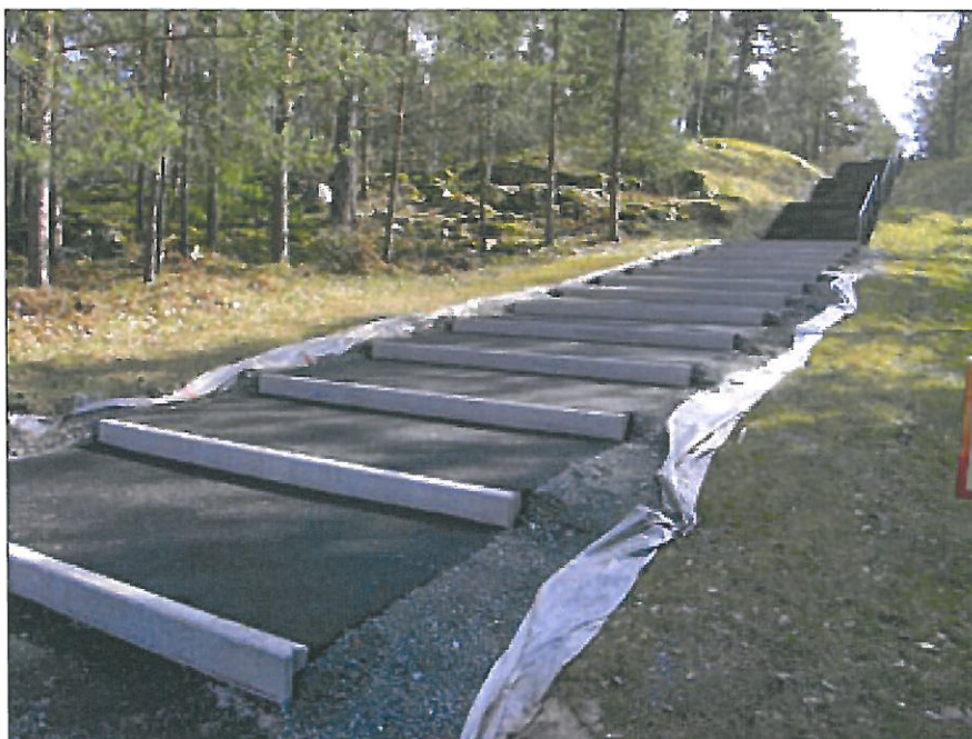
Gångtrappa från ekonomigården till minneslunden under arbete i april 2007. Prefabricerade kantstöd, i form av L-stöd av betong i längder om 2 meter och asfalterade plansteg. Bildnr: lp20100369