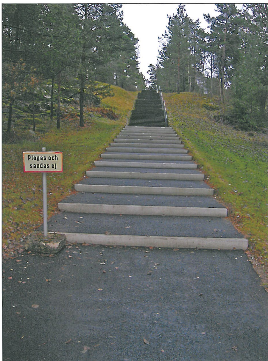
Gångtrappa från ekonomigården mot minneslunden samt markarbeten efter renovering. Bildnr: lp20100371