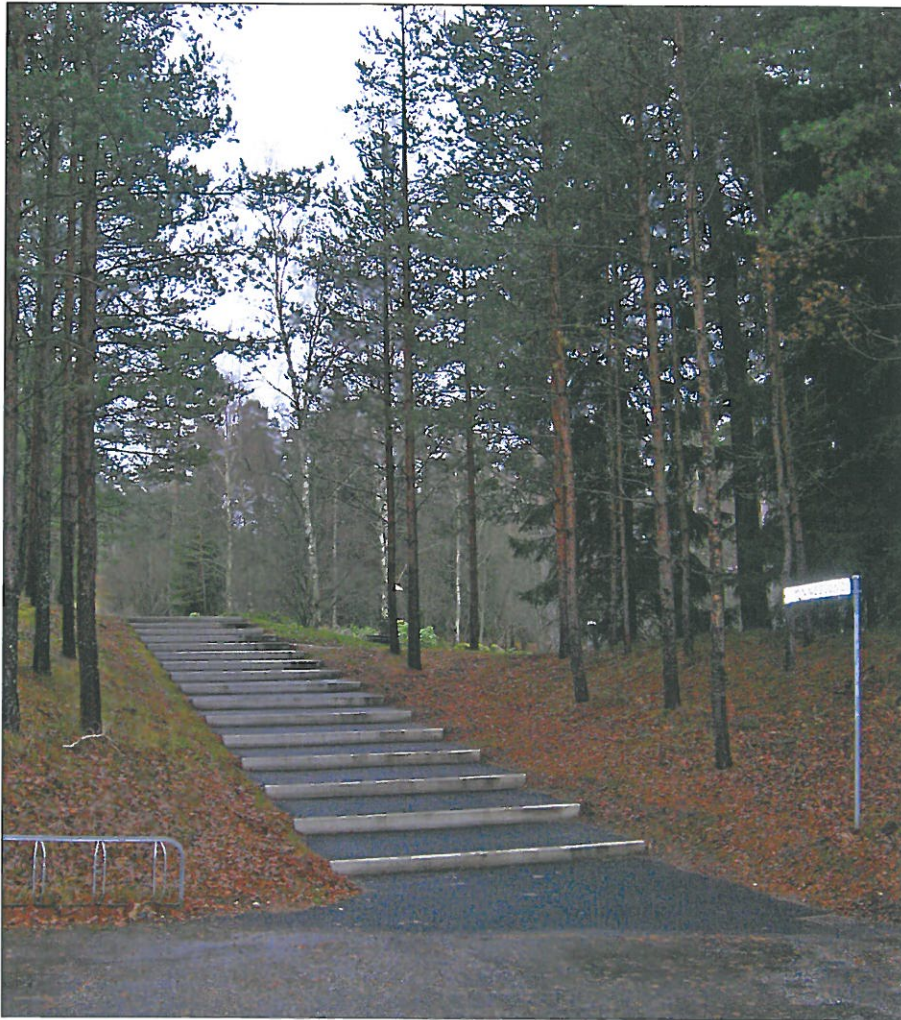
Gångtrappa och markarbeten efter renovering. Bildnr: lp20100370