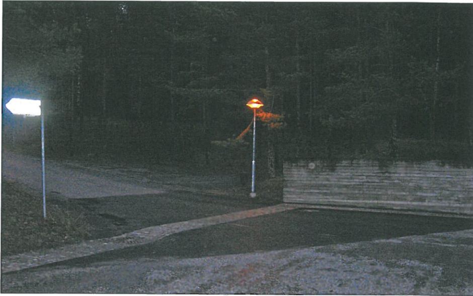
Anslutning mot väg vid entrén till griftegården har fått ändrad lutning. Bildnr: lp20100381