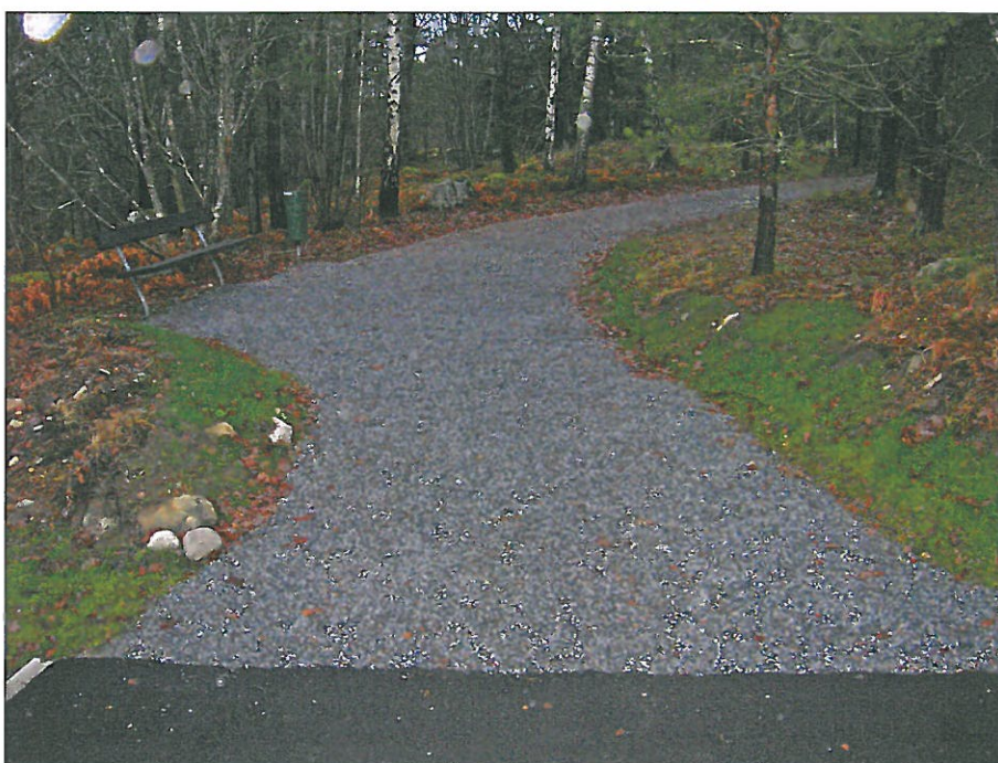
Anslutande vägar till gångtrappan är grusade med singel. Bildnr: lp20100376