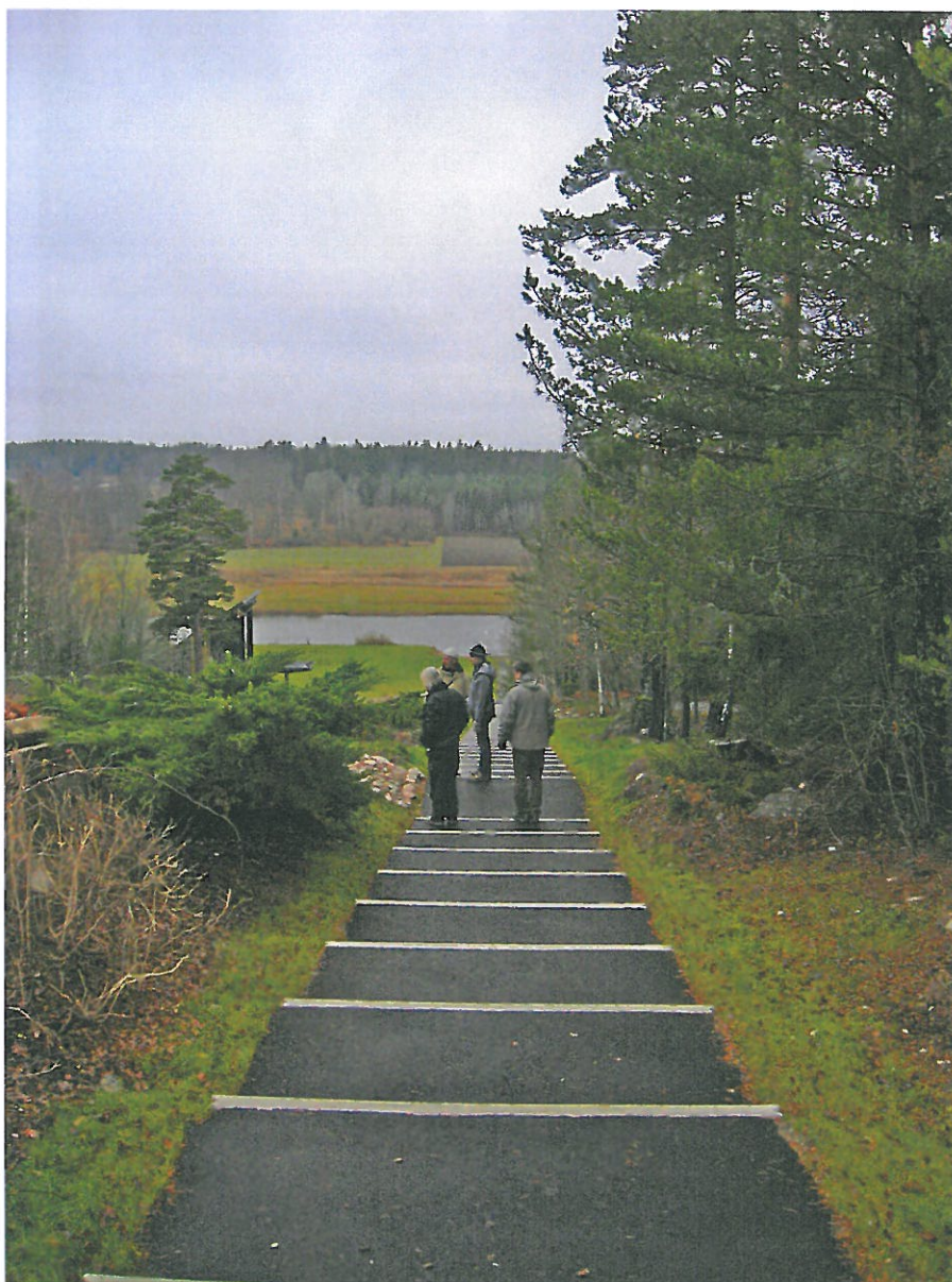
Gångtrappor från minneslunden ner till Pilgrimskapellet. Vid sidan om gång- trappan rinner vattentrappan. Bildnr: lp20100374