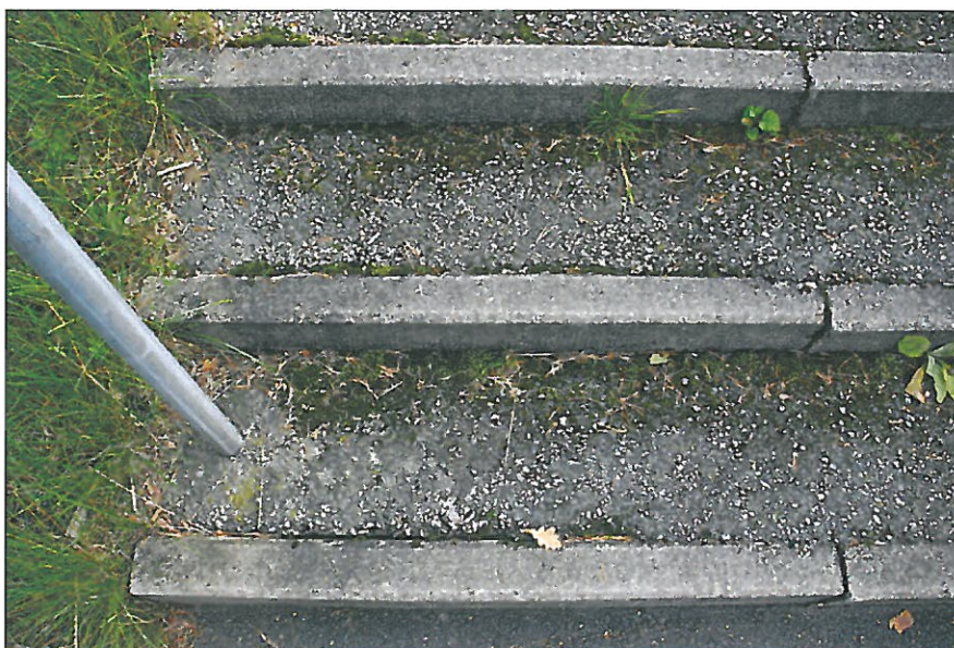
Gångtrappornas kondition före renovering. Kantstöd i form av I-stöd av betong i längder om 1 meter. Bildnr: lp20100368.