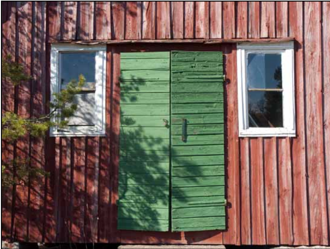
Magasinet före renovering. Bildnr: Ip20100503.

Magasinsbyggnaden är en f.d. visthusbod som i äldre tid hörde till Brottö gård. Visthusboden är enligt Franzon 1 uppförd år 1885.