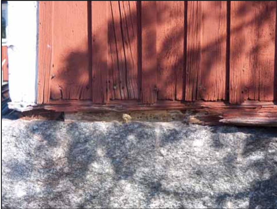
Svårt angripen del av syllstock och trasiga vattbräddor. Bildnr: lp20100505.