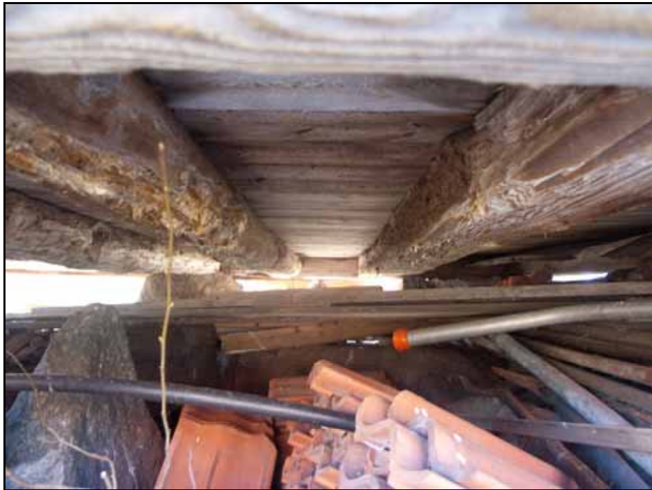
Angripna golvbjälkar före renovering. Bildnr: lp20100504.

Byggnaden uppvisade framförallt skador i golvbjälklag och syllar men även fönster och vattbrädor var i dåligt skick. Tre golvbjälkar ersattes med nya. Syllstockarna ersattes på tre sidor och på den fjärdes sidan kompletteringslagades syllen till hälften. Vattbrädor nyttillverkades. På en fasad lagades ersattes en del panel med ny.