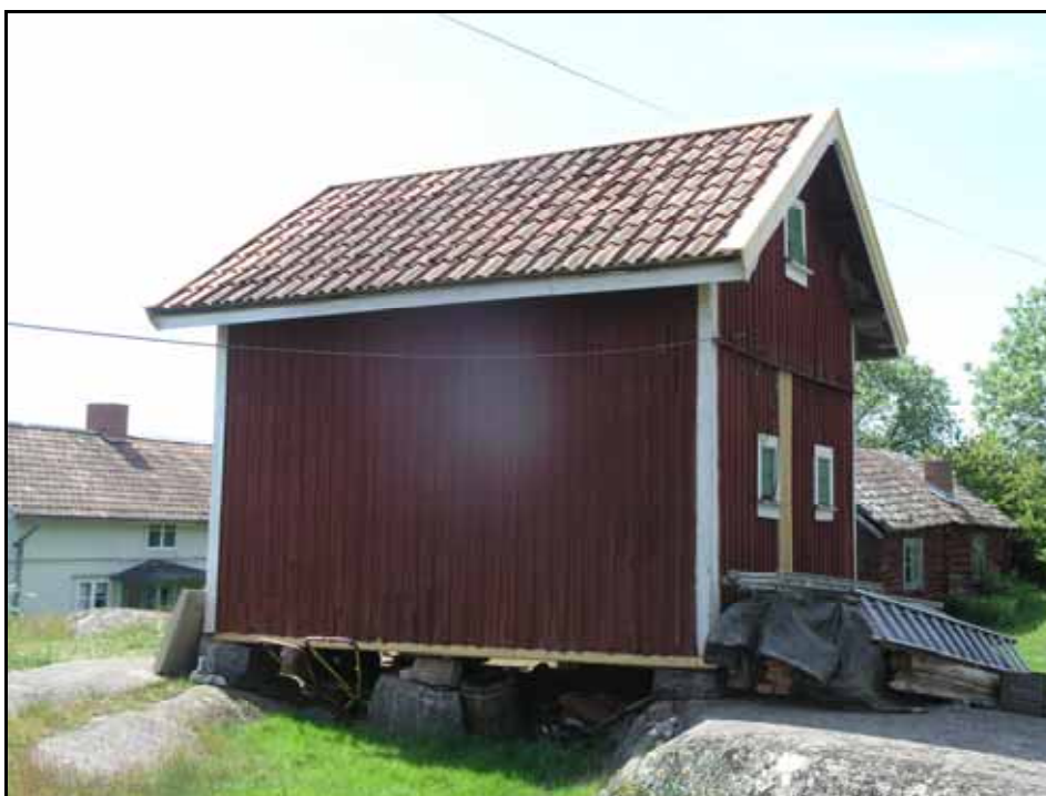
Vattbrädor, nockbrädor, täckbrädor och vindskivor nyttillverkades samt en mindre del panel ersattes med ny. Foto: Lisa Sundström, bildnr. lp20100508

Taket lades om och kompletterades i mindre utsträckning med på gården befintligt taktegel. Underlagspanel och takpapp visade sig vara i gott skick. Bär- och ströläkt lagades samtnockbrädor, täckbrädor och vindskivor nyttillverkades.