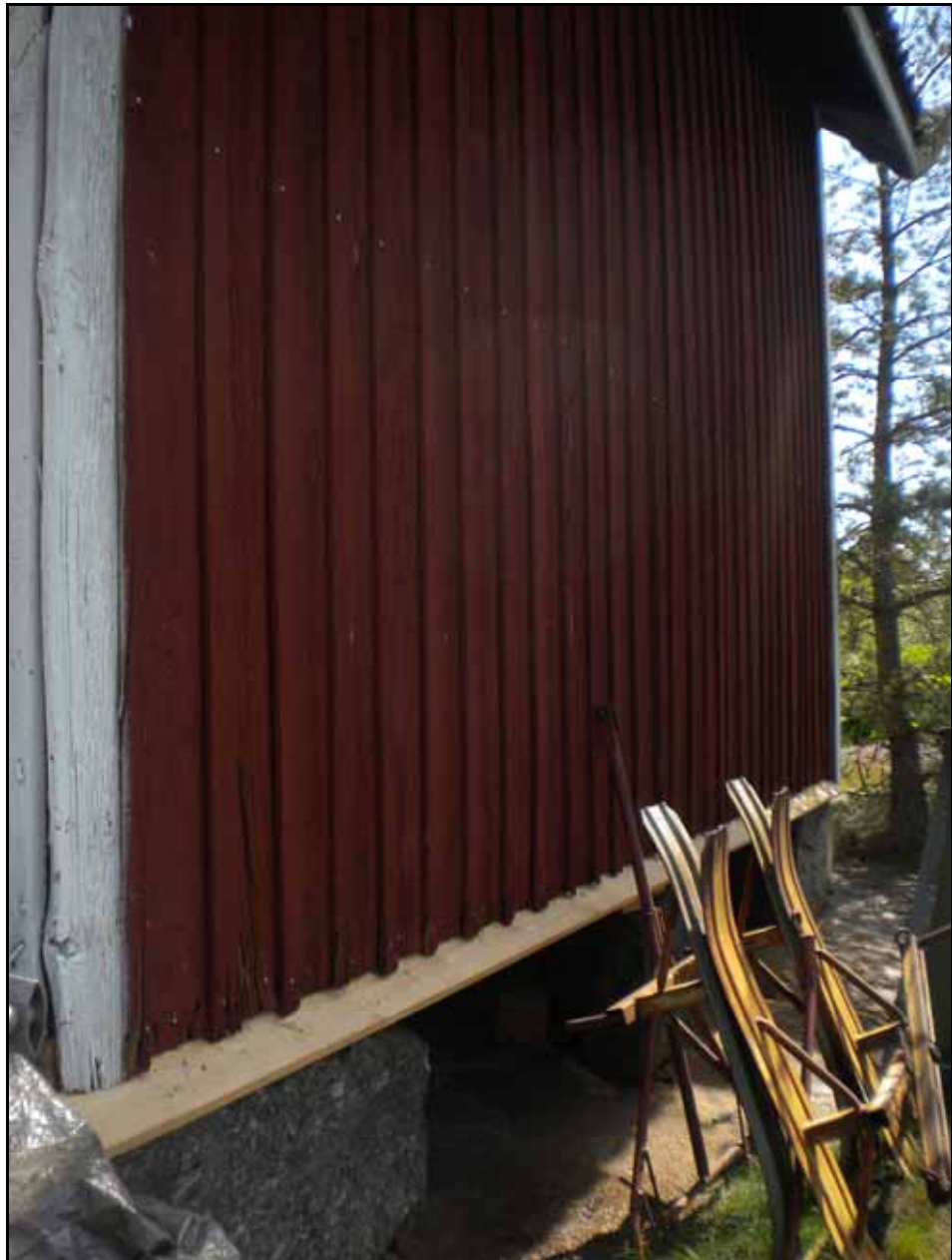
Nya vattbräddor tillverkades. Bildnr. lp20100507.