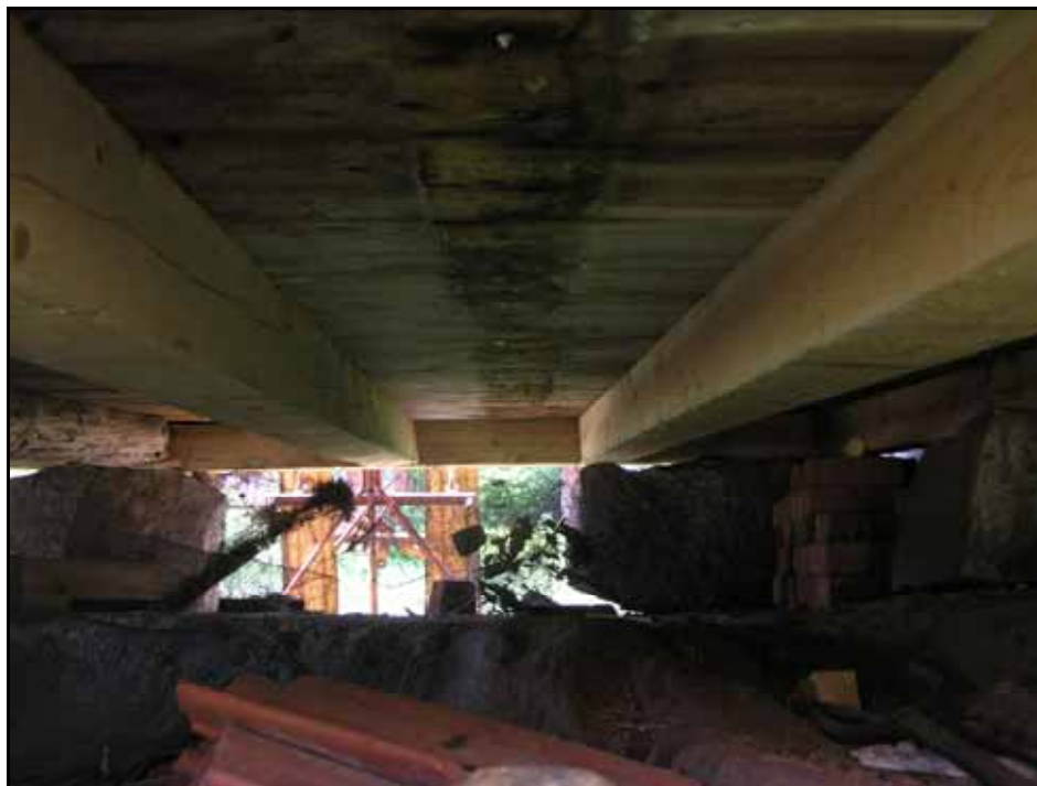
Tre golvhjälkar nytillverkades samt syllstockar på tre sidor. Entrésidans syllstock lagades till hälften med nytt virke. Bildnr: lp20100506.