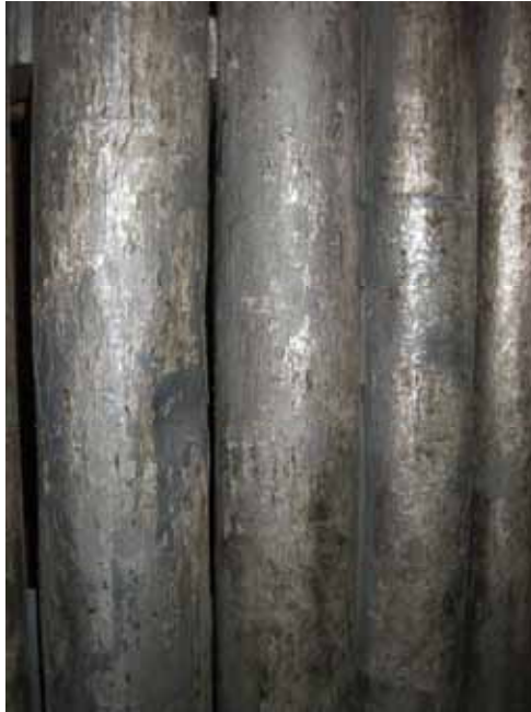
Figur 5. Bemålade och försilvrade orgelpipor.

Orgeln i söder har baksidan vänt mot ett fönster. Detta har orsakat en lättare uttorkning och färgen spricker och reser sig. Där flagor fallit bort blottas underliggande färglager som vittnar om en annan färgsättning. Även piporna har målats i en färg, sedan försilvrats och därefter övermalats igen. Dock har stora partier av den senaste övermålningen fallit bort och resterande instabila färgskikt är tydligt. Delar av de blottade försilvrade ytorna har oxiderats och syns som svarta fläckar.