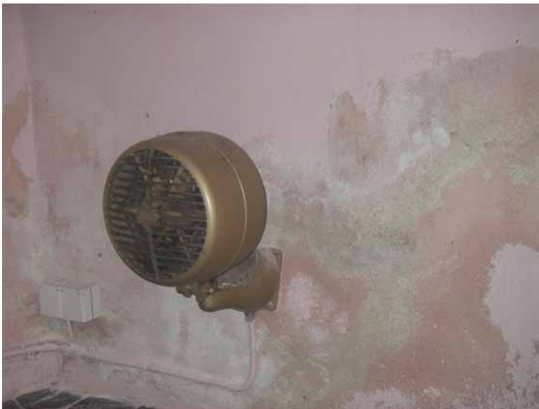
Figur 2. Skadad puts i sakristian, norra väggen.

Sakristian står också ouppvärmad och väggarna är inte särskilt nedsmutsad. Väggarna i sakristian har målats i en rosa kulör med akrylatfärg. Denna färg har på vissa ytor börjat resa sig och delvis fallit bort och blottat en underliggande rosa kalkfärg. På framförallt norra väggen har stora saltutfällningar vittrat sönder putsen.