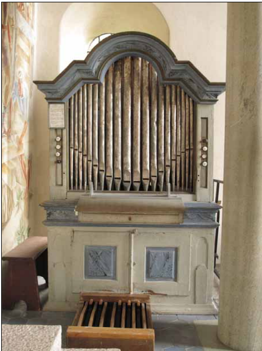
Orgelns fasad och pipor har konserverats.

Orgelfasaden och piporna har rengjorts, konsoliderats och retuscherats.