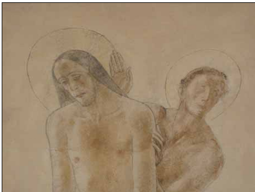
Detalj av absidens bemålning efter konservering.

Rapporten finns i PDF-format på adressen www.stockholmslansmuseum.se