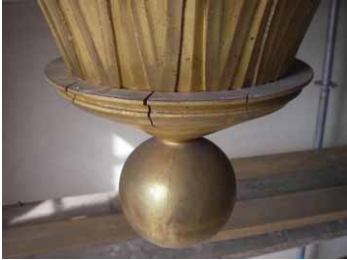
Figur 6. Förgyllningsskador på ljuskrona.