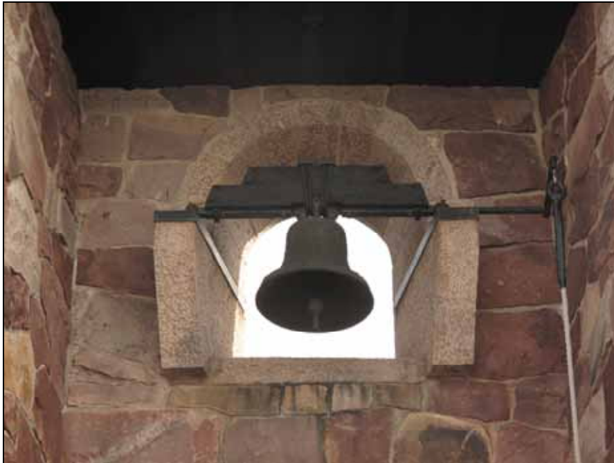
Repet till klockan har byggts ut mot ett kraftigt rep av hampa.