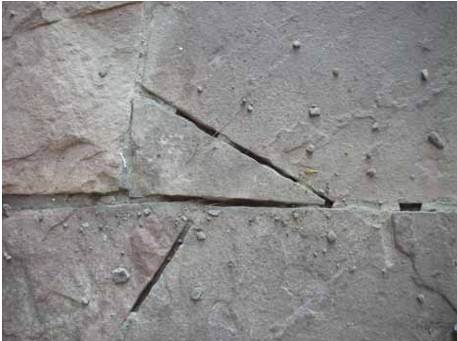
Figur 7. Trasiga fogar och synliga befintliga fogar av olika bruksorter.

Fogarna mellan kalkstensplattorna i golvet består av olika sorters bruk vilket förutom i hållfasthet visar sig genom nyansskillnader och struktur. Fogarna har alltså lagats allt eftersom i olika omgångar. Trots och kanske beroende på dessa spänningar mellan bruken har fogarna delvis luckrats upp och lossnat.