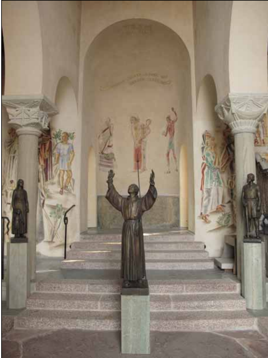
Kalkmåleri åt öst efter konserveringsåtgärder.