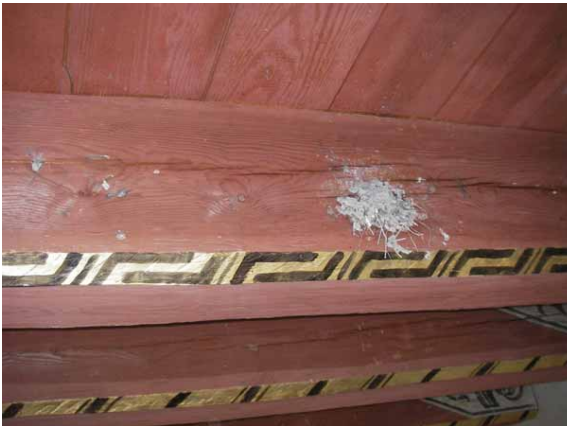
Figur 4. Rester av fågelbo på takbjälke.

Plattaket med synliga bjälkar är i gott skick. Dekormålningarna är intakta. Inga synliga fuktskador i anslutning till saltutfällningarna i väggarna var synliga. Ett lättare dammlager och spindelväv förekommer främst i skarvarna till de putsade väggarna. Dock finns rester av fågelbon i form av lera och gräs på de yttersta bjälkarna vilka missfärgas av den en gång fuktiga leran.