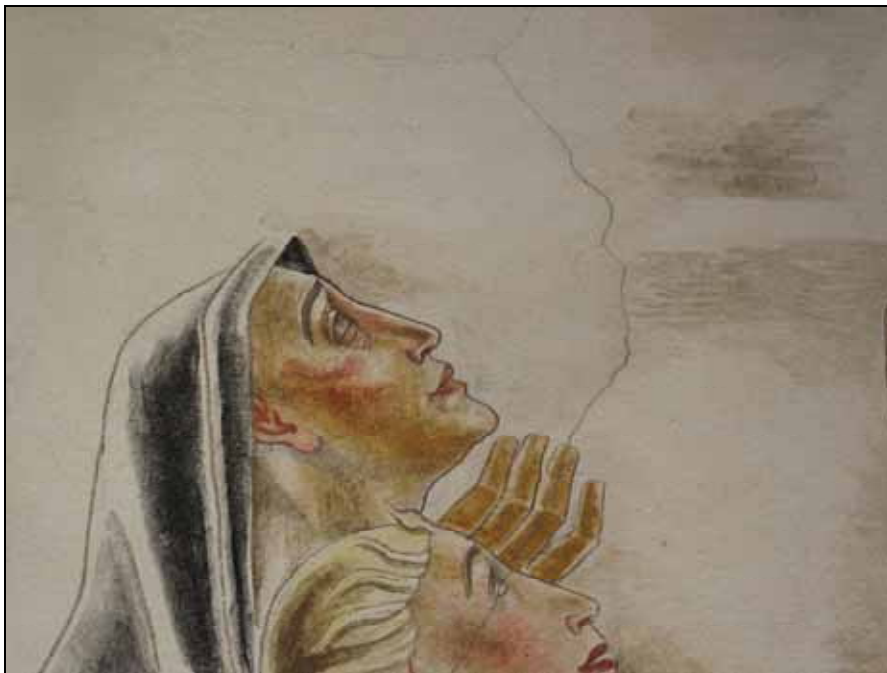
Exempel på spricka i måleriet som lagades och retuscherades.

Det invändiga kalkmåleriet uppvisade missfärgningar, saltutfällningar samt en pågående nedbrytning av måleriet. Måleriet har rengjorts, konsoliderats och retuscherats. Takets bemålade bjälkar har rengjorts och retuscherats. Väggarnas puts har rengjorts, putslagats och tonats in. Se bilagd konservatorsrapport.