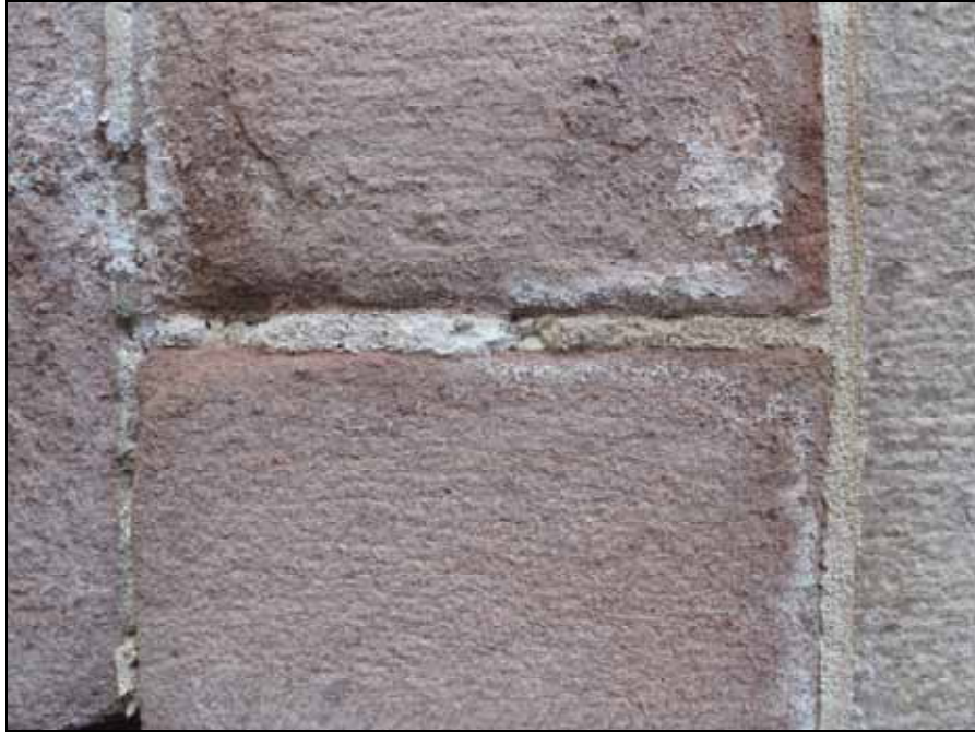
Exempel på saltutfällningar med skadad fog och sten som följd i portalen.