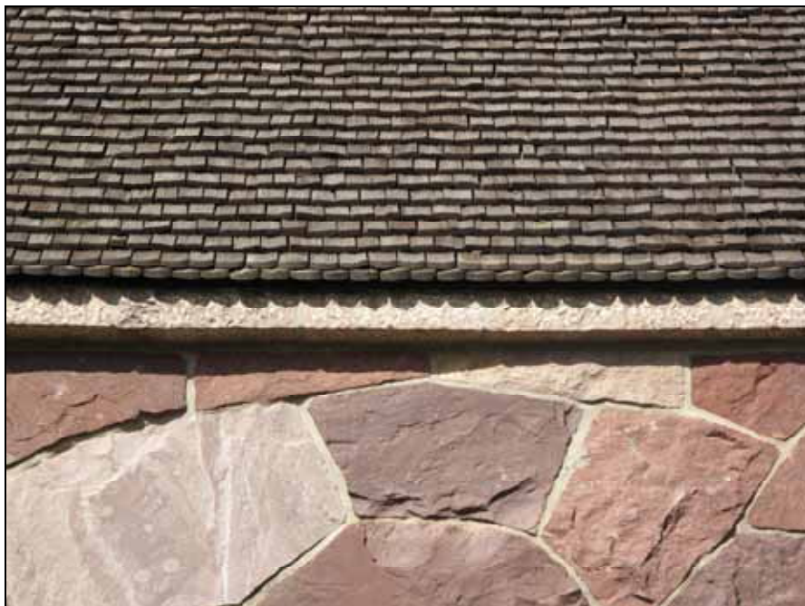
Det spåntäckta taket har setts över och tjärats.

Taket har setts över och omtjärats med dalbränd trätjära sommaren 2009. Spån i dåligt skick, ca 20 st, har bytts mot nya lika befintliga bevarade i kapellets uthus. Tornets takfotsinklädning ommålades med svart linoljefärg.