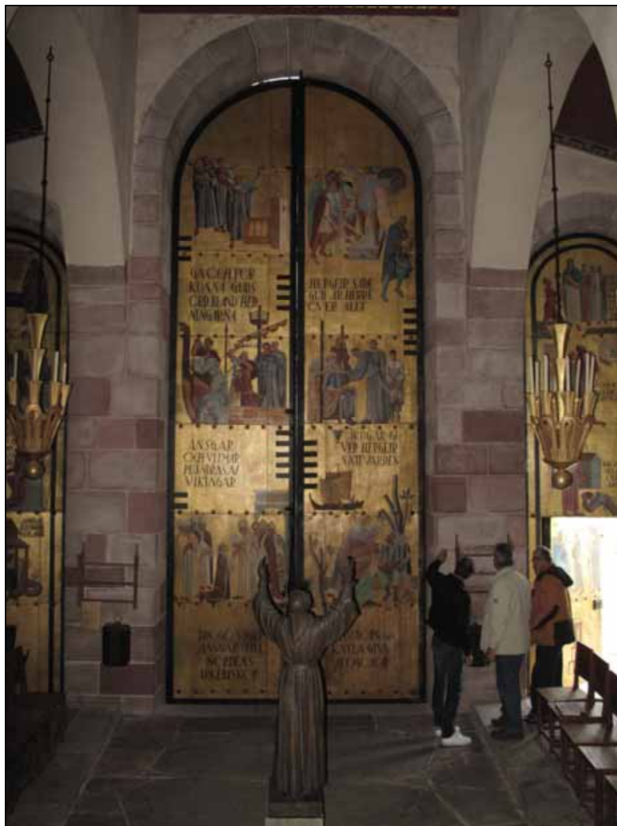
Portarnas bemålade kopparplåt rengjordes, retuscherades och fernissades.