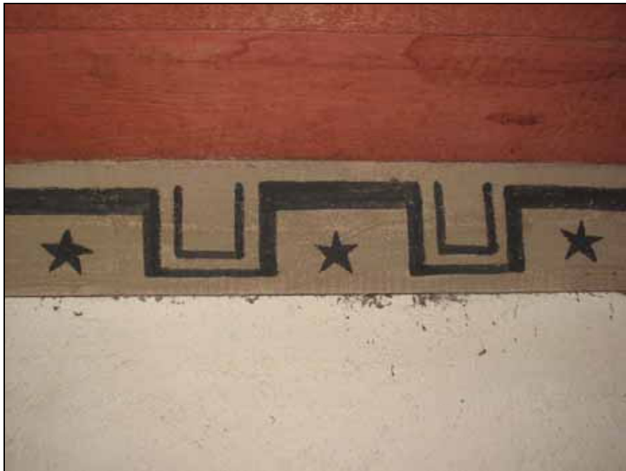
Taken och den dekorativt bemålade takfotslisten rengjordes.