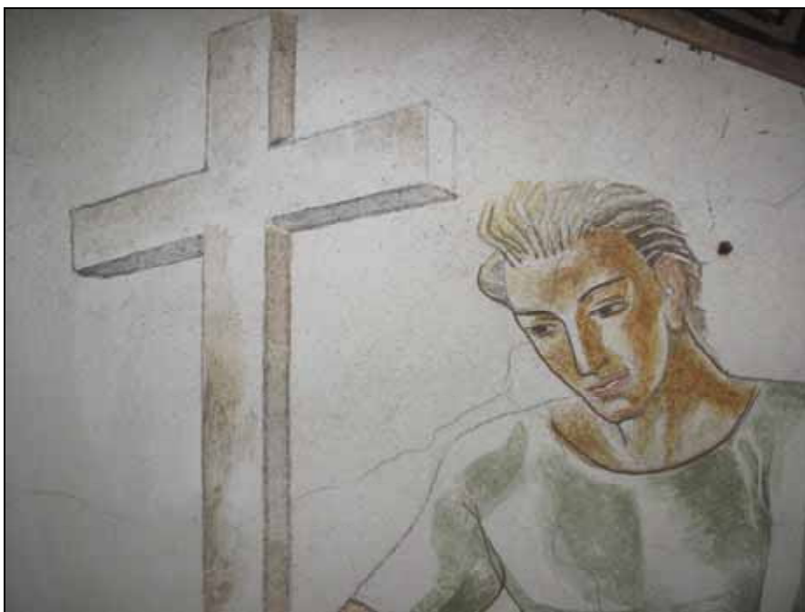
Exempel på nedsmutsade väggar och sprickor som rengjordes, lagades och retuscherades.