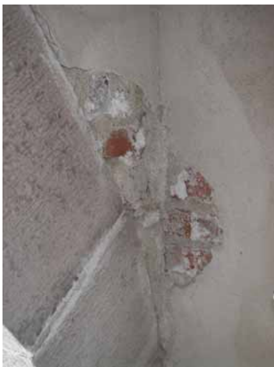
Figur 1. Putsbortfall med saltutfällning, västra väggen.

Kapellet står ouppvärmvt vilket i stort förhindrat smuts och damm att bränna fast vid väggarna. Däremot har lättare damm och spindelväv lagt sig på den grova putsens ojämnheter. Stora putsckador förekommer främst på kapellets västra väggar i anslutning till portalen i sandsten och trätaget. Där förekommer stora putsbortfall, kalkbruket har vittrat sönder till följd av de tydliga saltutfällningarna. Saltvandringarna följer fogarna och mynnat ut i stora saltutfällningar som inte kristalliserats och blivit hårt, men orsakat söndervittrad puts, blekta färgpartier och uppluckrad sandsten.