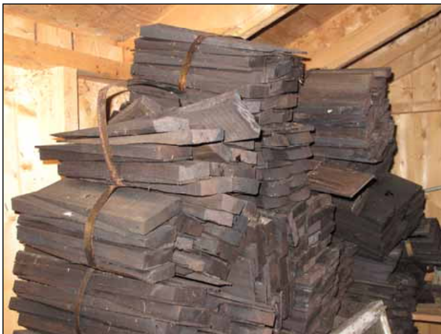
Ursprungliga spån finns bevarade i ett uthus vid kapellet.