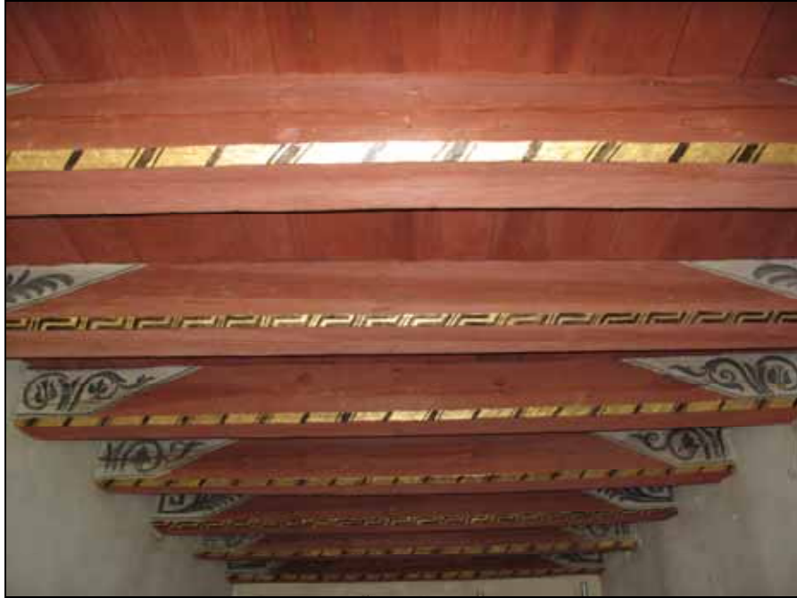
Tak och dekorativt bemålade takbjälkar har rengjorts.