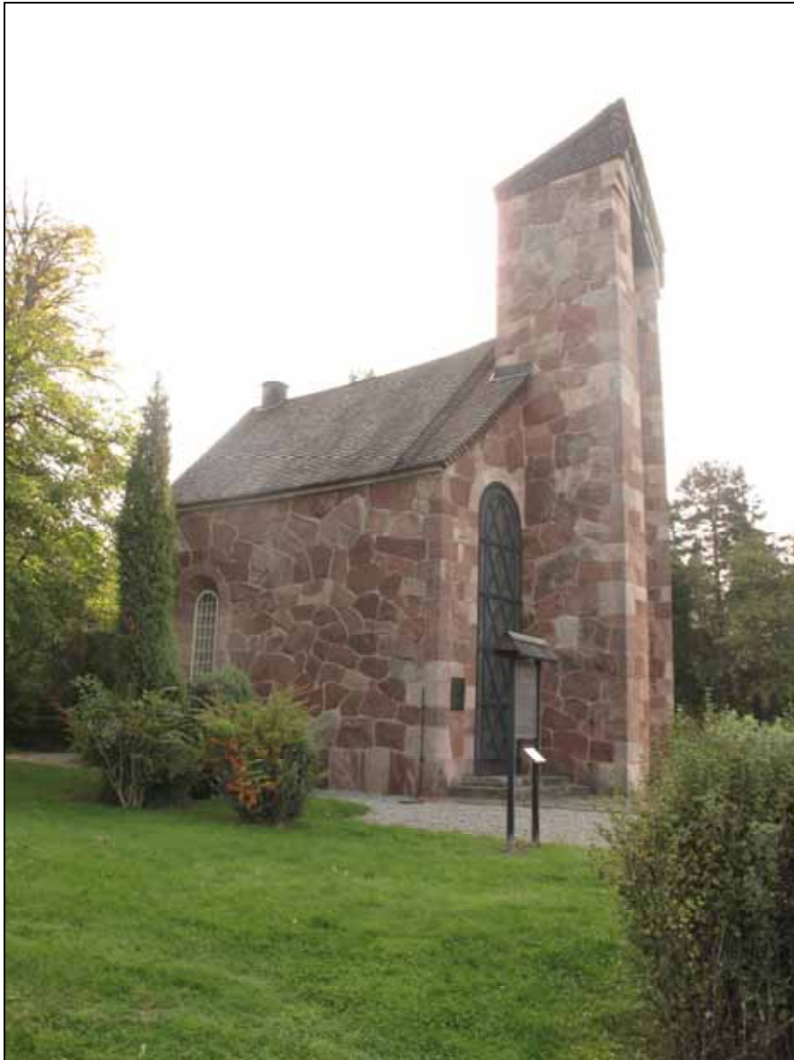
Norra långfasaden efter borttagning av lavar.