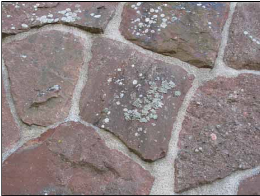
Exempel på lavbevuxta stenar på den norra fasaden.