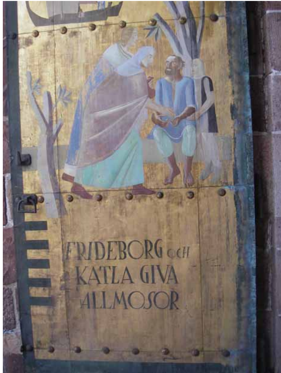
Figur 3. Västra mittporten med matt yta, ärgbildning och mekanisk nötning synligt.

På portarnas insidor skildras Ansgarskrönikan med målningar på förgyllda kopparplåtar som spänts upp på ekportarna. Stora ärgblommor har fällts ut längs med den svarta bården på främst den norra mittporten men i mindre grad även på den södra mittporten. Denna bård utsätts för ett fuktigt mikroklimat när den ligger an mot sandstenen i portalen. Ärgdroppar har fällts ut jämnt fördelat över portarnas ytor.