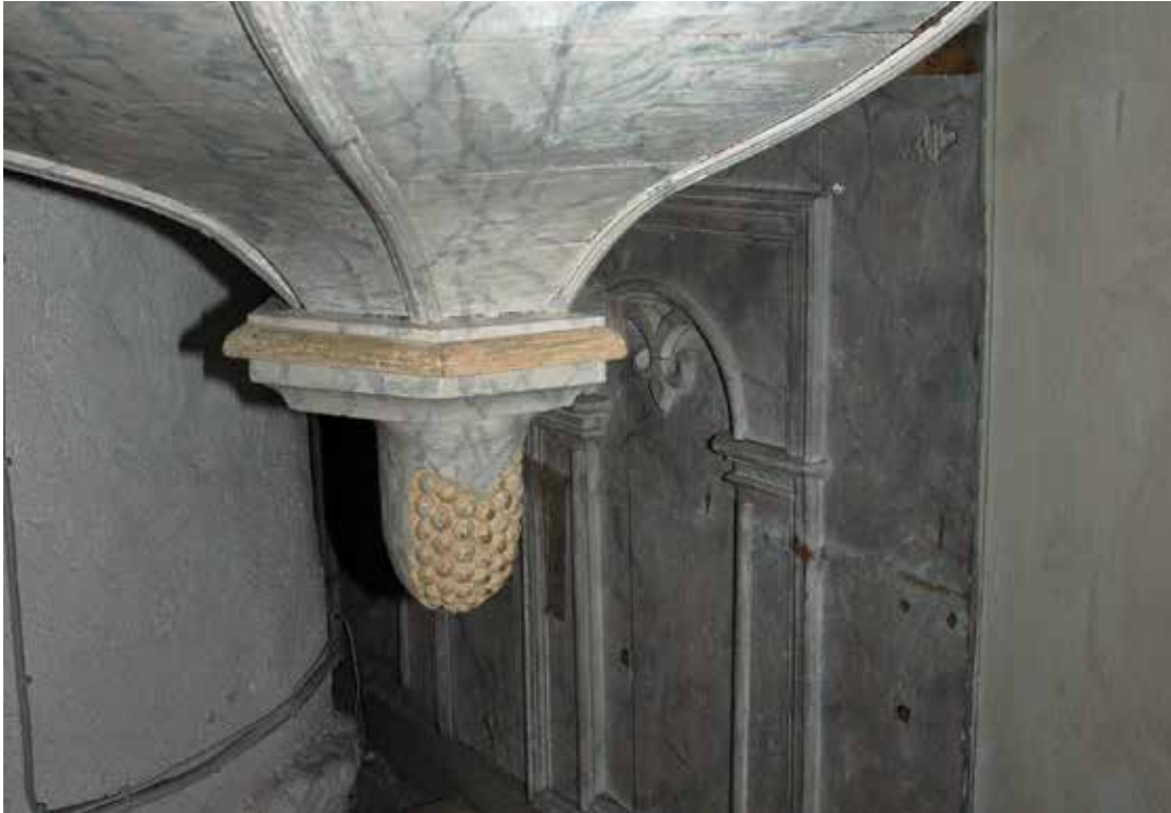
Fig 11. Ytterligare gamla bänkkvartersidor från 1700-talet befinns dolda under predikstolen. Lp_2012_00283.