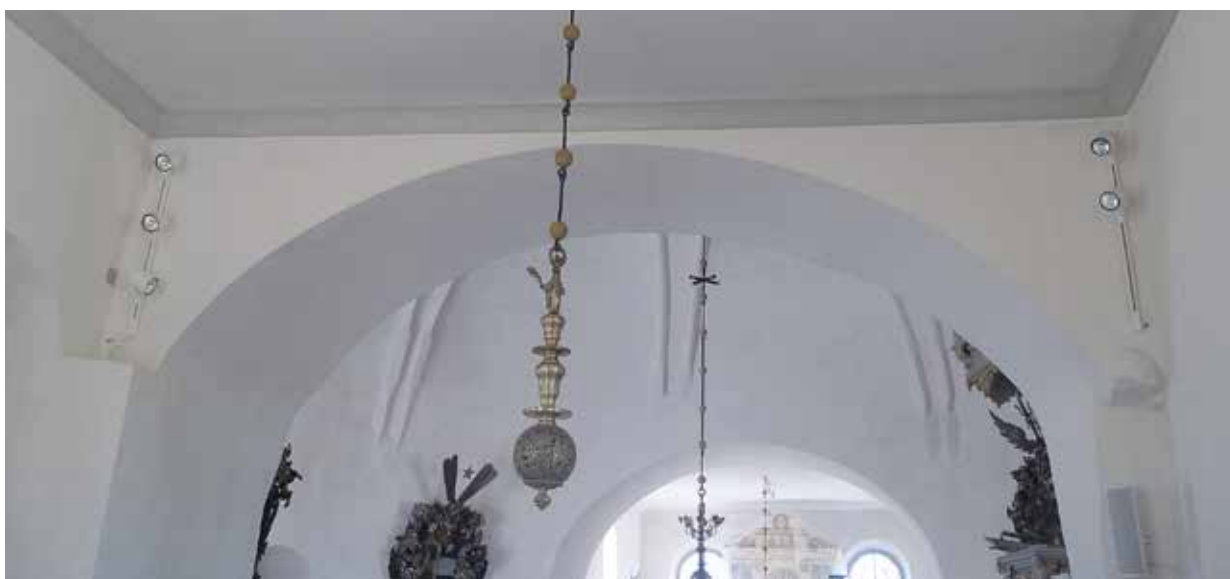
Figur 31. Spotlightslinga i högkorets nischer (tre plus tre spotlights, på bilden dock två i den norra) Lp_2012_00305.

För den nya belysningen drogs jordade ledningar, dock eftersträvades att använda befintliga ledningar i den mån det var möjligt. I högkoret hade tidigare ledningar dragits i spår i väggen. Denna metod användes inte, utan en reversibel lösning, där ledningarna gömdes utmed väggar eller under mattor tillämpades. Belysning i form av spotlights från tre olika ljusarmar installerades. En ljusarm med två spotlights placerades i bakkorets tak i linje med ljuskronan. Ett litet hål i taket togs upp för att leda ner elsladden från vinden. Två ljusarmar med tre spotlights vardera placerades i högkoret, ej synliga från rundhuset, på vardera sida om valvet, i vardera nisch. Bakom de två nummertavlorna i högkoret monterades läsbelysning som kan riktas mot altaret. Belysningsarbeterna utfördes av Wasastadens Eltjänst AB som utgick från ett åtgärdsförslag upprättat av Ljusbyggarna AB, Klas Möller.