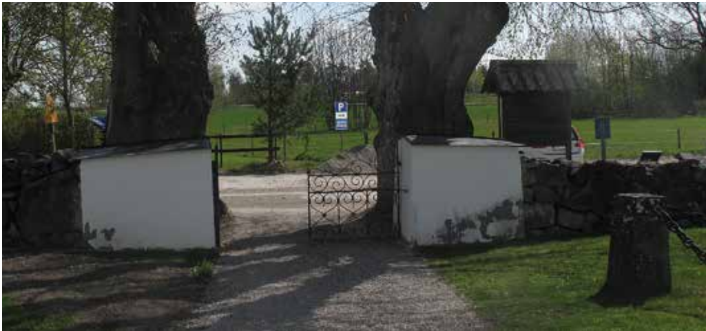
Figur 36. Grindstolparna med den avskavda basen Lp_2012_00282.

Kalkfärgen på grindstolparna hade flagnat nedtill. Huvarna som täcker ovensidorna når inte ut över basen på stolparna, då stolparna har en bredare bas än topp. Inför invigningen bättringsmålades grindstolparna provisoriskt med silikatfärg.