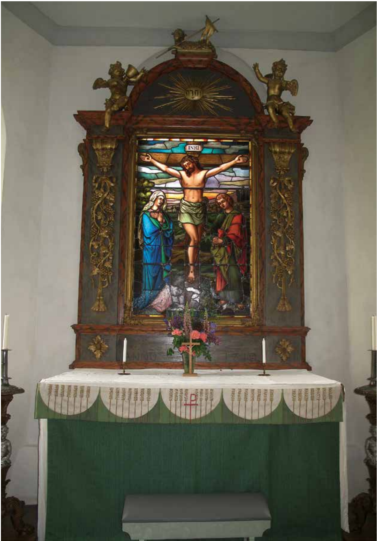
Fig 5. Altaret och altartavlan Lp_2012_00233.