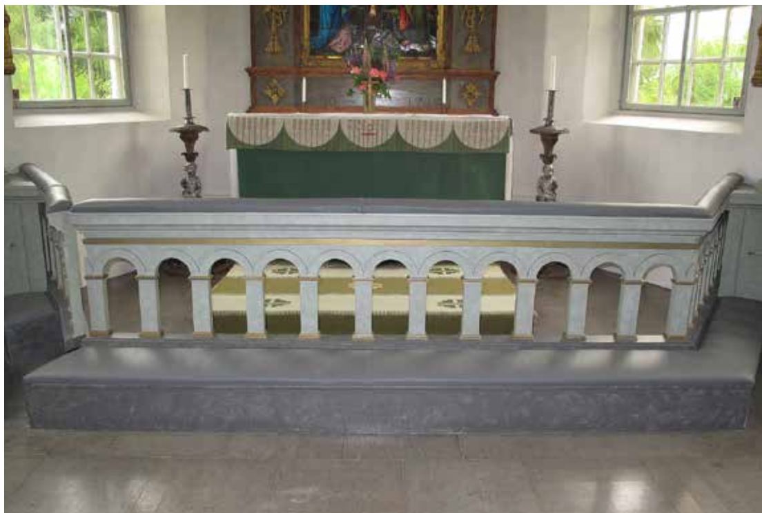
Fig 7. Nytt skinn på altarringen och knäfallet Lp_2012_00322.