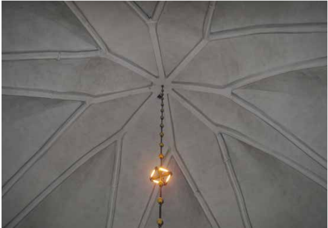
Fig 1. Stjärnvalvet innan rengöring Lp_2012_00320.