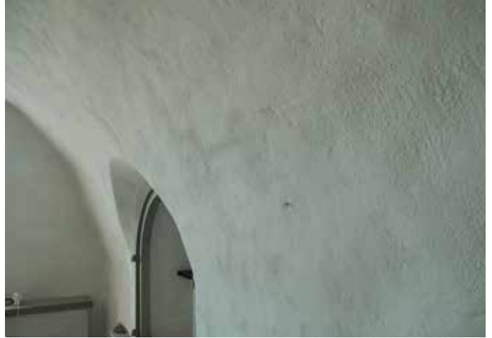
Figur 16. Valvet i sakristian efter mögelsanering, limkalkfärgning och kalkfärgning LP_2012_00272.