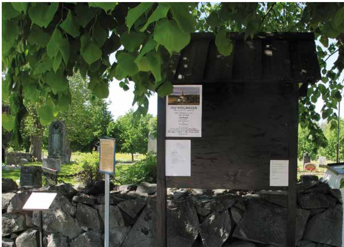
Figur 38. Anslagstavlan efter målning Lp_2012_00284.