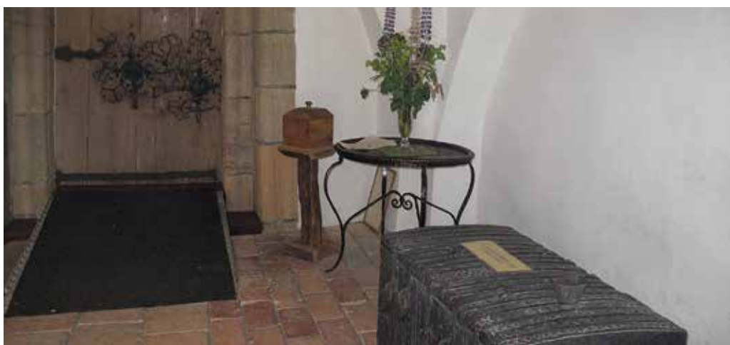
Figur 35. Det gamla elementet befanns tidigare bakom kistan i den östra nischen i vapenhuset Lp_2012_00311.