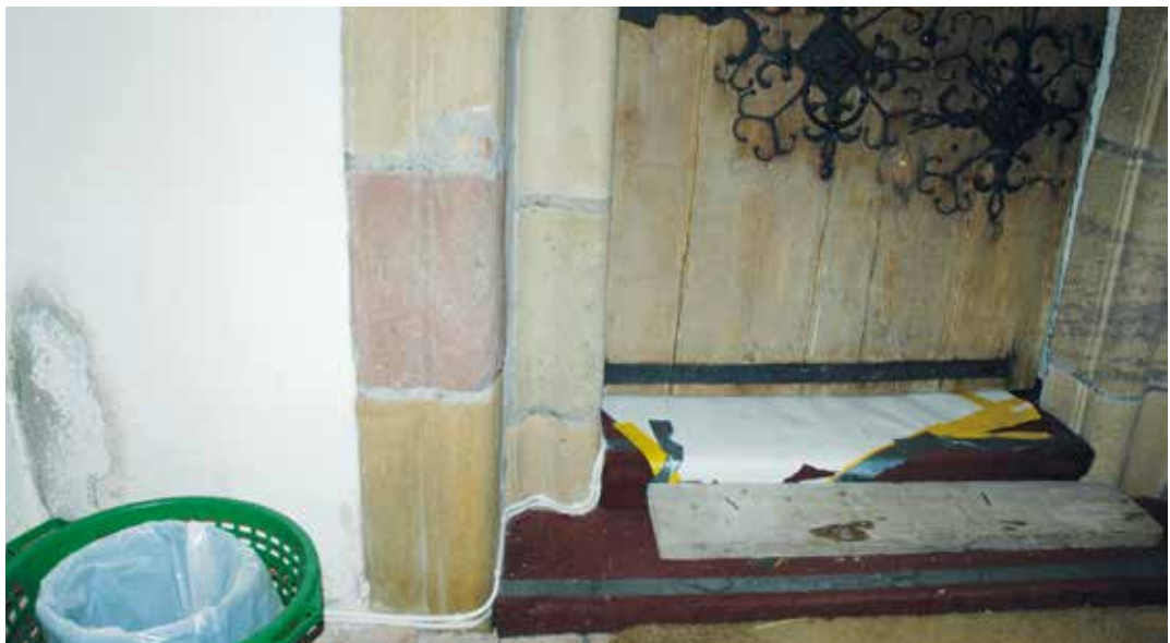
Figur 21. Sladdarna längs med golvet/muren i vapenhuset innan målning. På den ursprungliga porten syns medeltida järnbeslag. Lp_2012_00310.