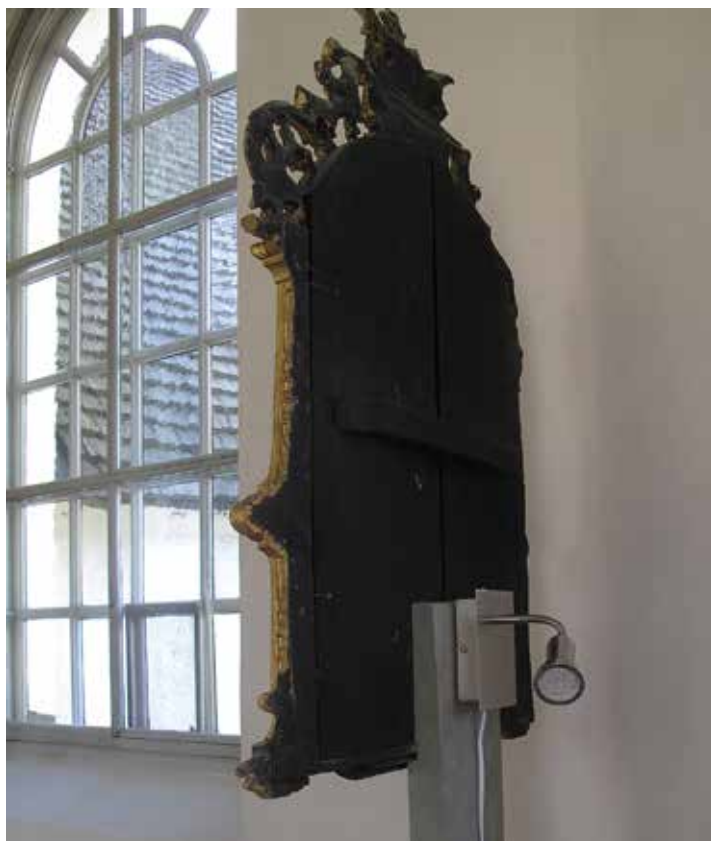
Figur 33. Den nya belysningen bakom den norra nummertavlan Lp_2012_00308