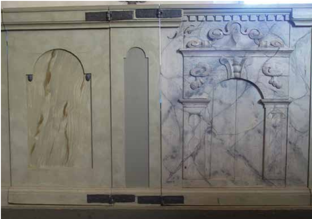
Fig 8. Det tidigare marmoreringsmåleriet bredvid den bevarade äldre dörren som härstammar från 1600-talet, i bänkkvarteret mot norr Lp_2012_00286.