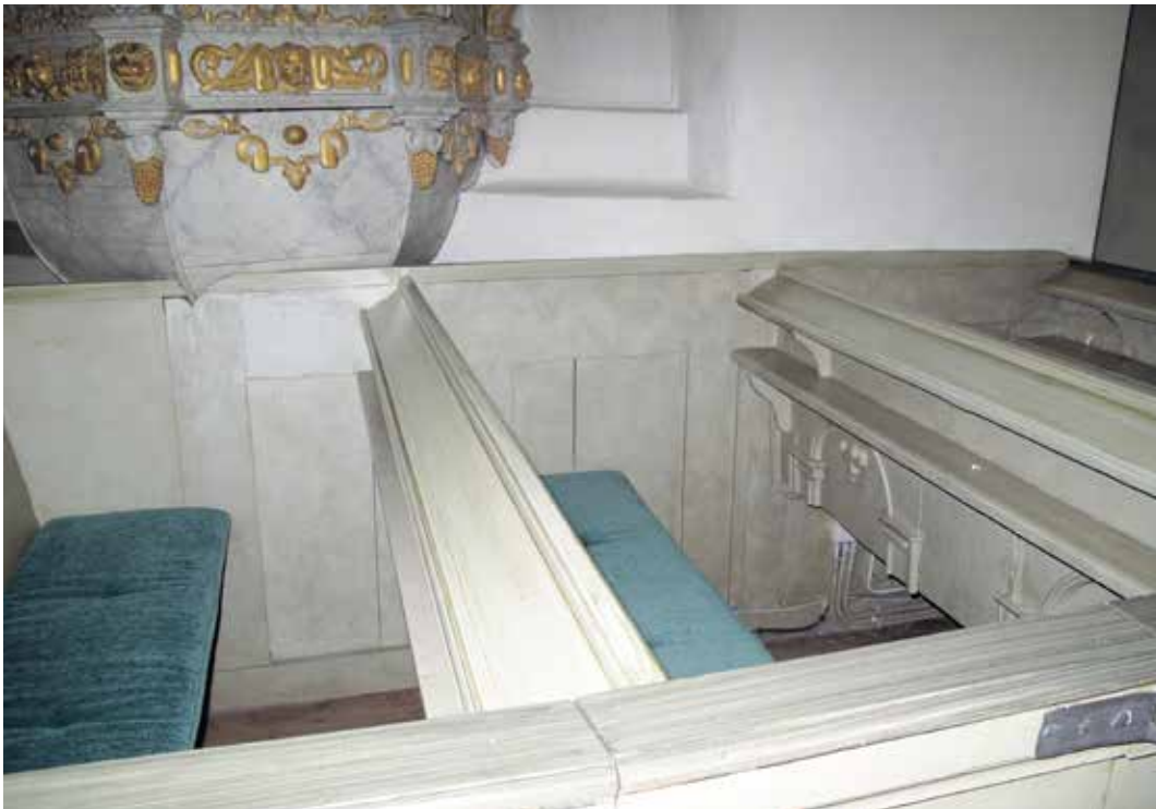
Fig 12. Delar av 1700-tals bänkinredning i andra bänkraden i norra kvarteret Lp_2012_00265.