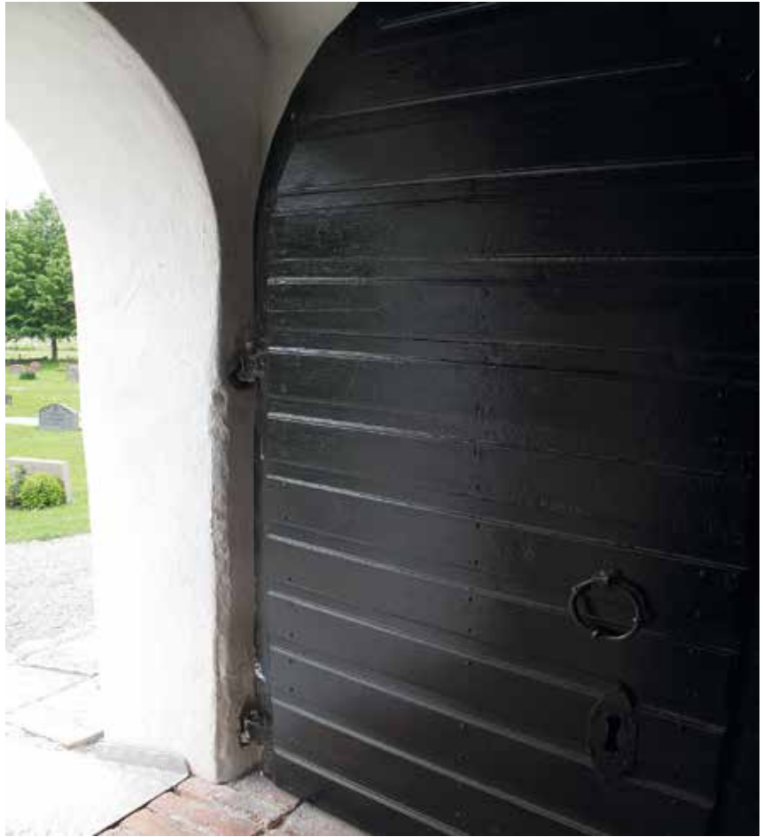
Figur 20. Kyrkporten efter det att gångjärnen åtgärdats, de släthyvlade brädorna syns nedtill Lp_2012_00274.