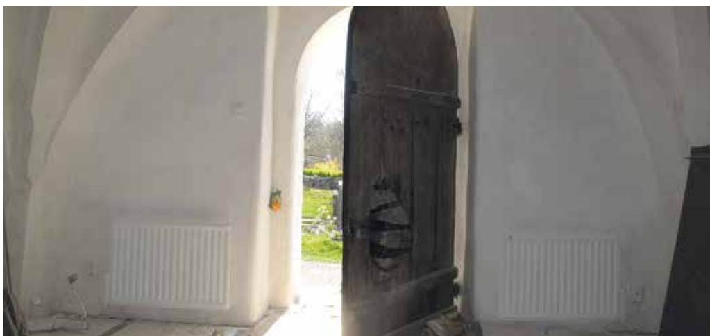
Figur 34. De två nya elementen i vapenhuset placerades mot söder Lp_2012_00268.

Två små vita korrugerade elburna element (olja) placerades på den södra väggen i vapenhuset, på var sida om kyrkporten. Efter diskussion om huruvida ett nytt element skulle placeras lika det tidigare, på den östra väggen, eller som de nya, på den södra väggen godkändes den senare placeringen. Det gamla elementet avlägsnades, väggen putsades och retuscherades av konservatorerna och i den östra nischen har nu enbart kistan sin placering. Denna stod tidigare framför elementet varpå energiförsörjningen försämrades. En ny elcentral placerades i ett skåp i bakkoret bakom orgeln. Installation av el i sakristian, till vv-beredare och belysning ovan bänken, gjordes samt framdragnings av elkablar utfördes till samtliga armaturer som monterades. Även framdragnings av kabel till högtalarsystemet utfördes och förstärkning av infästningsanordning för takkrona gjordes.