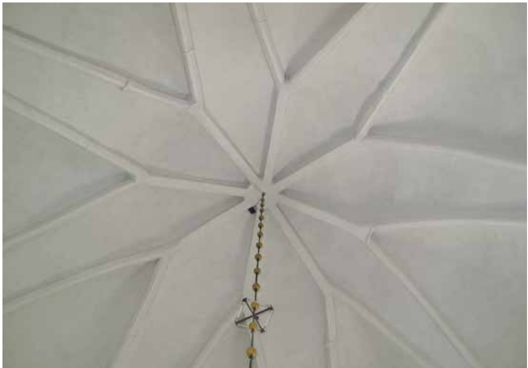
Fig 2. Stjärnvalvet efter rengöring Lp_2012_00229