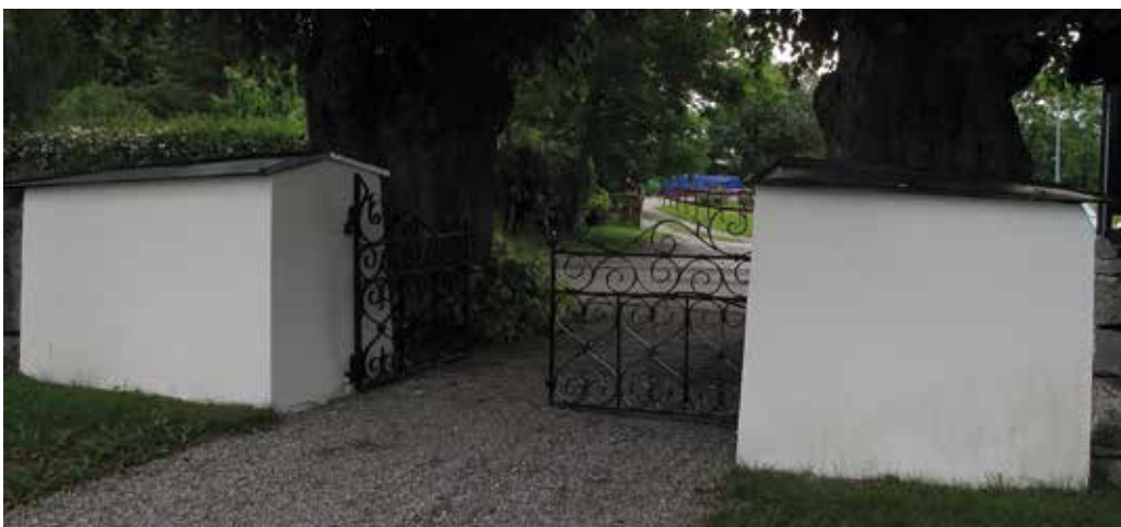
Figur 37. Grindstolparna när de bättringsmålats inför invigningen av kyrkan Lp_2012_00302.