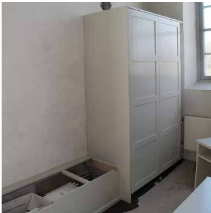
Figur 27. Den nya skåpinredningen, det södra skåpet i orgelkoret, även bänkförvaringen har målats in i samma kulör Lp_2012_00319.

I bakkoret fanns två låga skåp placerade längst bak. Nya högsåp i trä för förvaring av bl.a. noter monterades och målades in i en välliknande kulör till den orgeln har, en ljus grågrön ton. Skåpsatserna kom från Fredells och målades av Recreo Bygg AB. De är placerade i vardera bakre hörn i orgelkoret. Rundade, matta knoppar i zink, crom, nickel valdes till skåpens dörrar. Även den bänkförvaring som finns utmed väggen målades. Styrpulpeten, som tidigare stod bakom det södra bänkkvarterets sista rad, placerades på den norra sidan. Detta för att vaktmästaren lättare skall kunna ha uppsikt över ingången till kyrkan, vilken kan ses från denna plats. Pulpeten dirigerar ljud och ljus och målades in lika resterande bänkrader, med marmoreringsmålning.