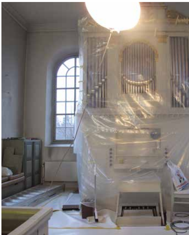
Figur 26. Den gamla skåpinredningen samt bänkförvaringen skymtar i det södra hörnet bakom orgeln. Lp_2012_00277.