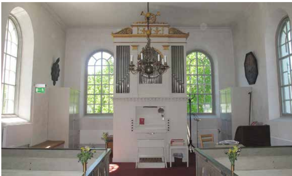
Fig 4. Orgeln Lp_2012_00232.

Predikstolen torrenjordes och borstades och enstaka lösa föremål, en tallkotte och ett ängelhuvud, tillhörande stolen fästes. Orgelfasaden rengjordes, altartavlan skrapades från stearin samt förgyllda delar rengjordes och nummertavlorna borstades och förgyllda ytskikt fästes av konservatorerna.