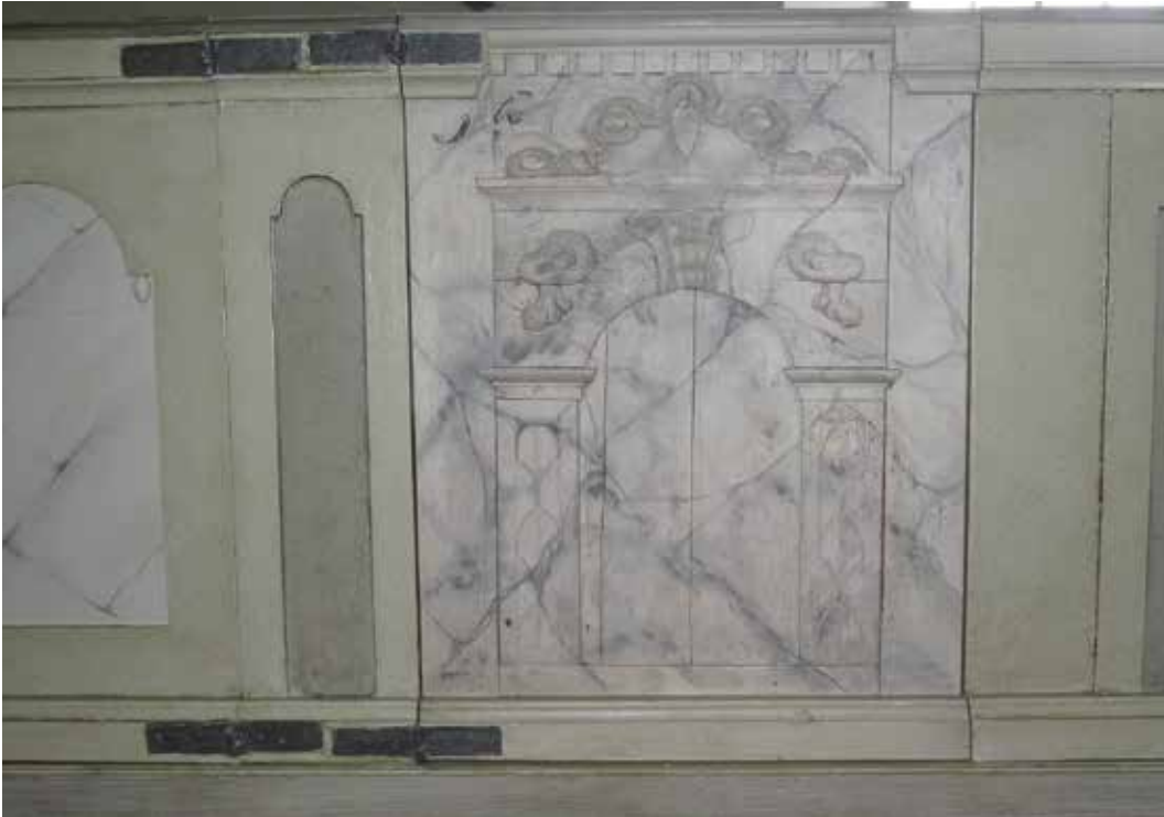
Fig 9. Till vänster i bild syns den nya marmoreringsmålningen. Lp_2012_00269.