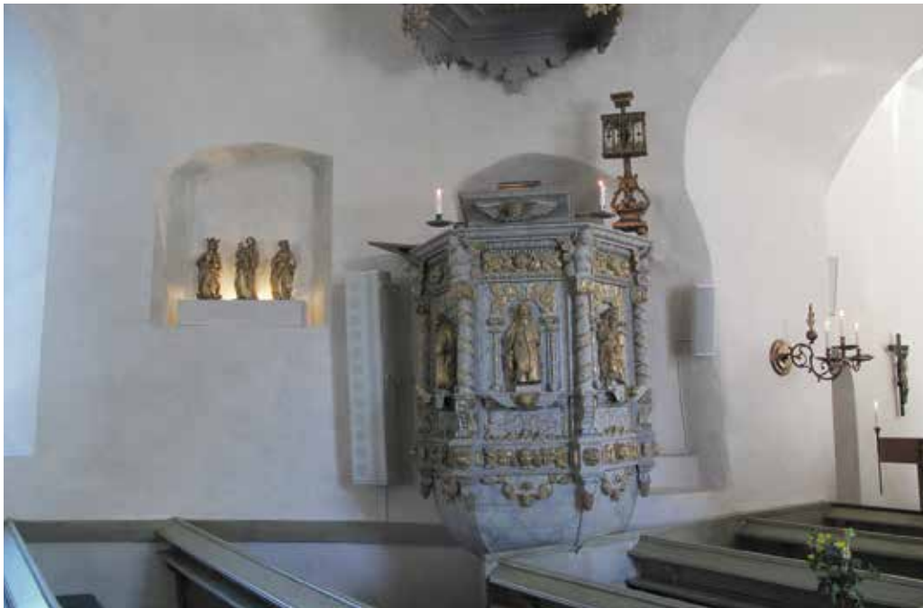
Figur 29. Huvudhögtalaren placerad väster om predikstolen, och de två mindre högtalarna öster om predikstolen. Den ena skymtar på väggen i högkoret Lp_2012_00323.

Högtalare, tidigare installerade i rundhusets norra fönster respektive på motsvarande sida på södra rundhusväggen, demonterades. I deras ställe monterades en ny huvudhögtalare på väggen till vänster intill predikstolen i rundhuset, lodrätt placerad med basen vid trälisten mitt på väggen. Till att börja med placerades huvudhögtalaren för högt, som på bilden nedan. Den justerades och sitter längs med listen, (se fotot av predikstolen). Två mindre högtalare monterades på väggen till höger om predikstolen.