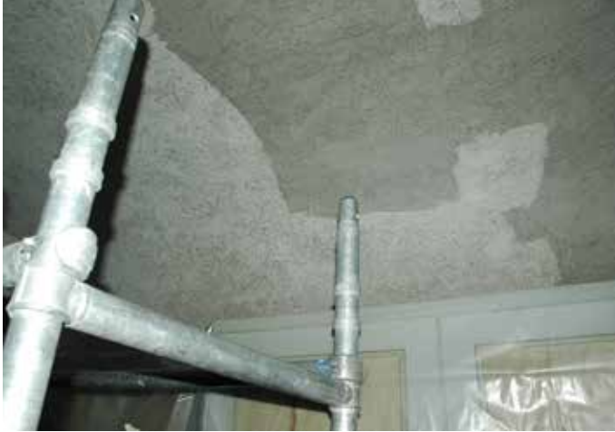
Figur 15. Det mögelhärjade valvet i sakristian innan, samt under rengöring med gomma pane LP_2012_00288.