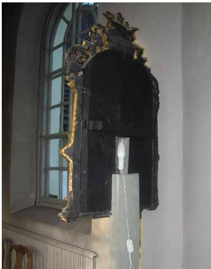
Figur 32. Den gamla belysningen bakom den norra nummertavlan Lp_2012_00267