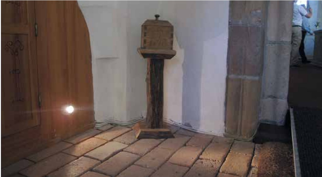
Figur 22. Sladdarna efter målning och klamring, samt belysningen fästad i skåpet Lp_2012_00275.