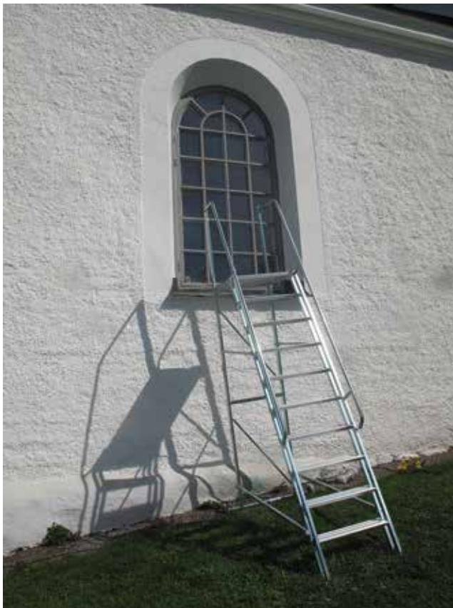
Figur40. Stegen utanför nödutgångsfönstret utan någon plattsättning undertill. Lp_2012_00321