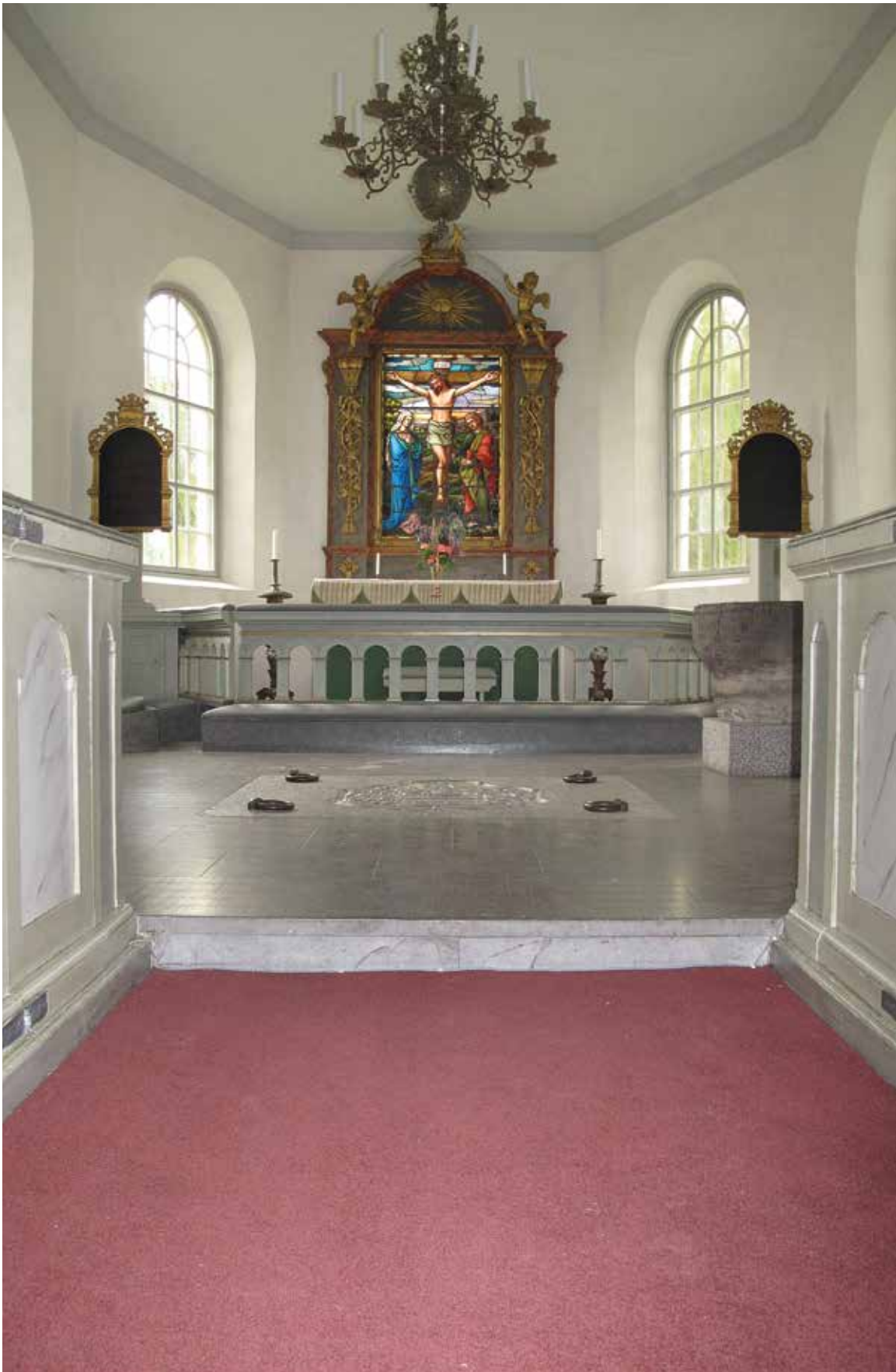
Fig 14. De främre bänkraderna och högkoret Lp_2012_00301.