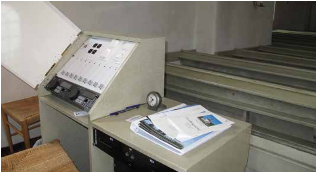
Figur 28. Den nya styrpulpiten, målad i samma färgton som övriga snickerier Lp_2012_00278.