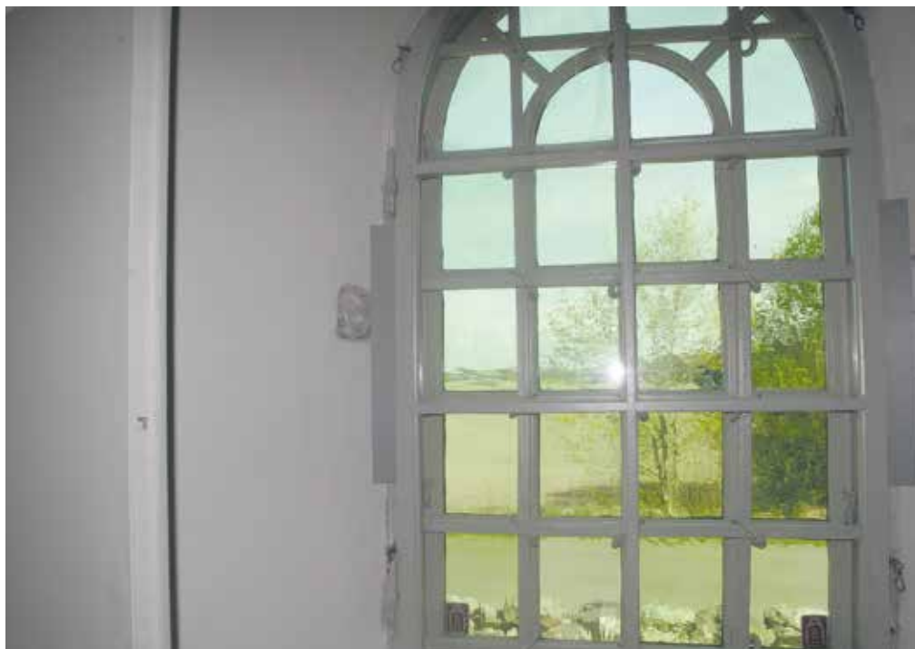
Figur 18. Vinkellister döljer luftspalterna Lp_2012_00273.