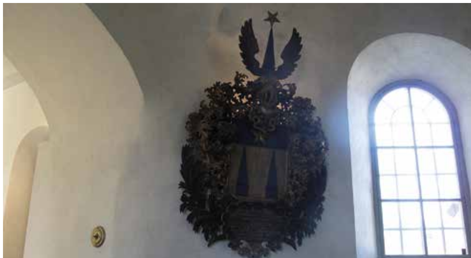
Figur 25. Adelstiernas vapen. Belysningen lyser i överkant på vapnet Lp_2012_00316.