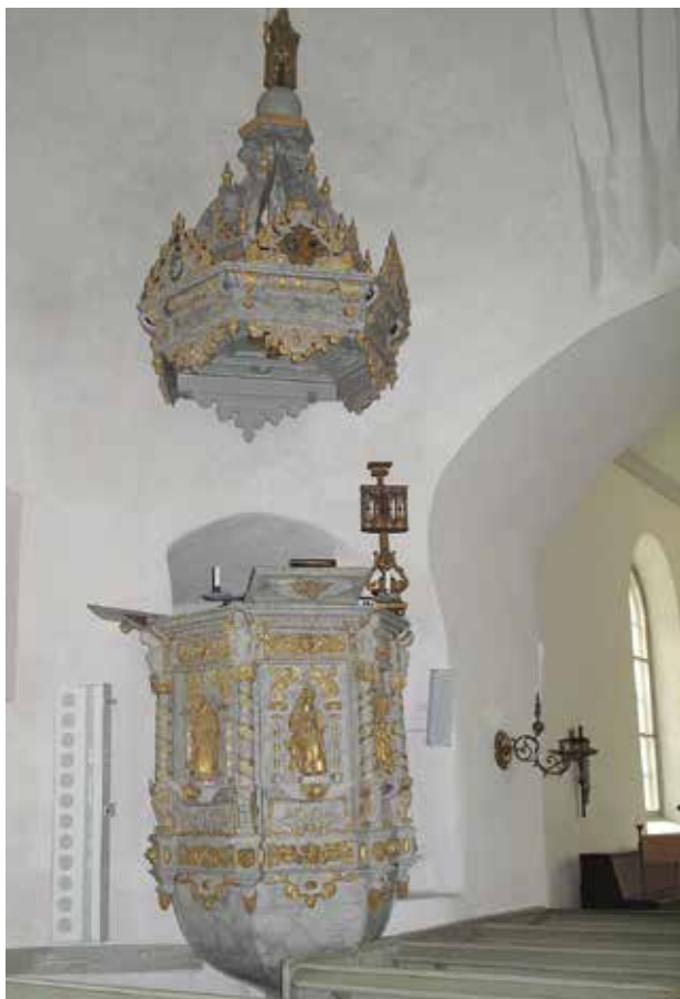
Fig 3. Predikstolen Lp_2012_00230.