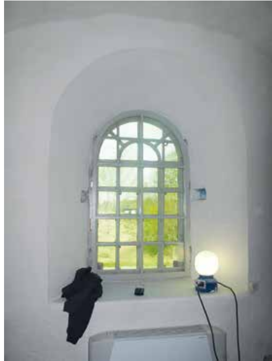
Figur 17. Fönstret i sakristian försett med luftspalt för bättre ventilation Lp_2012_00304