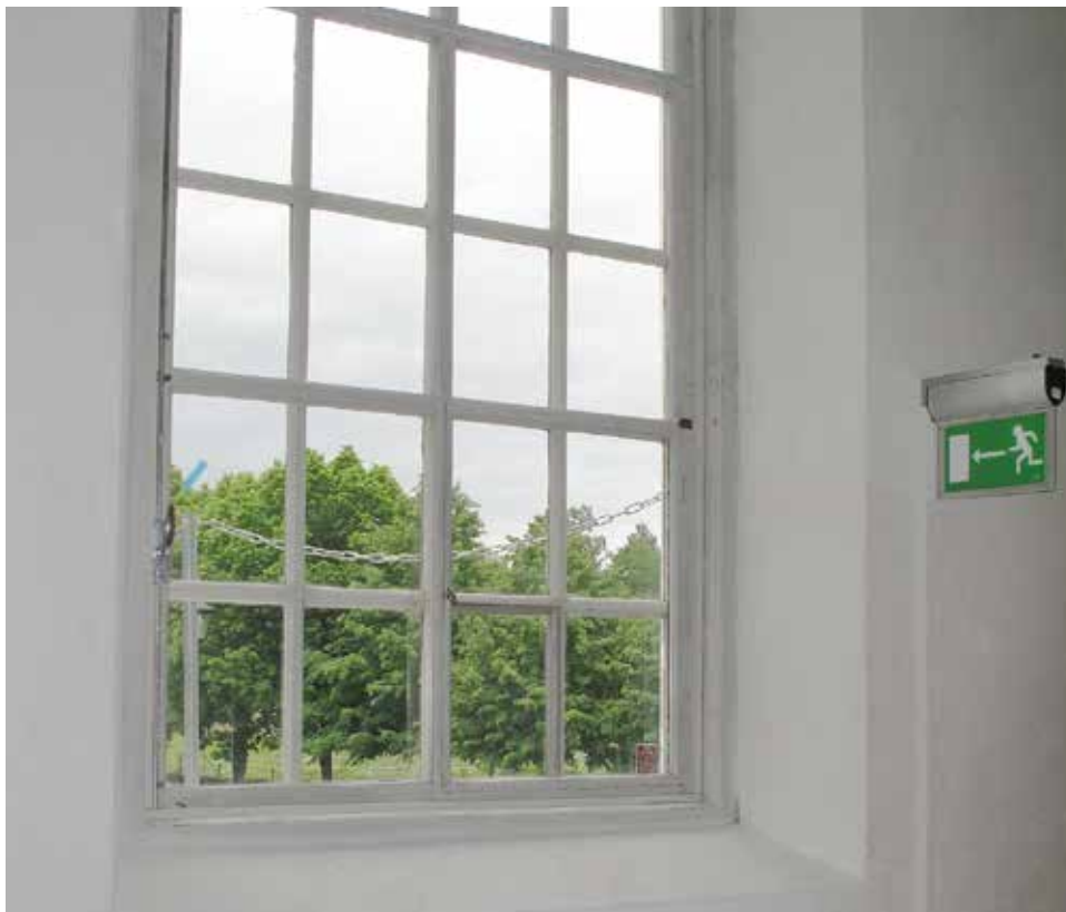
Fig 13. Det södra fönstret i orgelkoret försågs med en nödutgång Lp_2012_00271.

Fönsterbänkar lagades med gipsbruk i den mån det behövdes och ströks med latexfärg. Samtliga fönster putsades efter restaureringsarbetenas slutförande. Nödutgången i det södra fönstret i orgelkoret förstörades genom delning av fönstret, vars nedre del, nedanför bågformen högst upp i fönstret, försågs med en ny vänsterhängd karm och gjordes utåtgående. (Se vidare under punkten räddningsväg ).