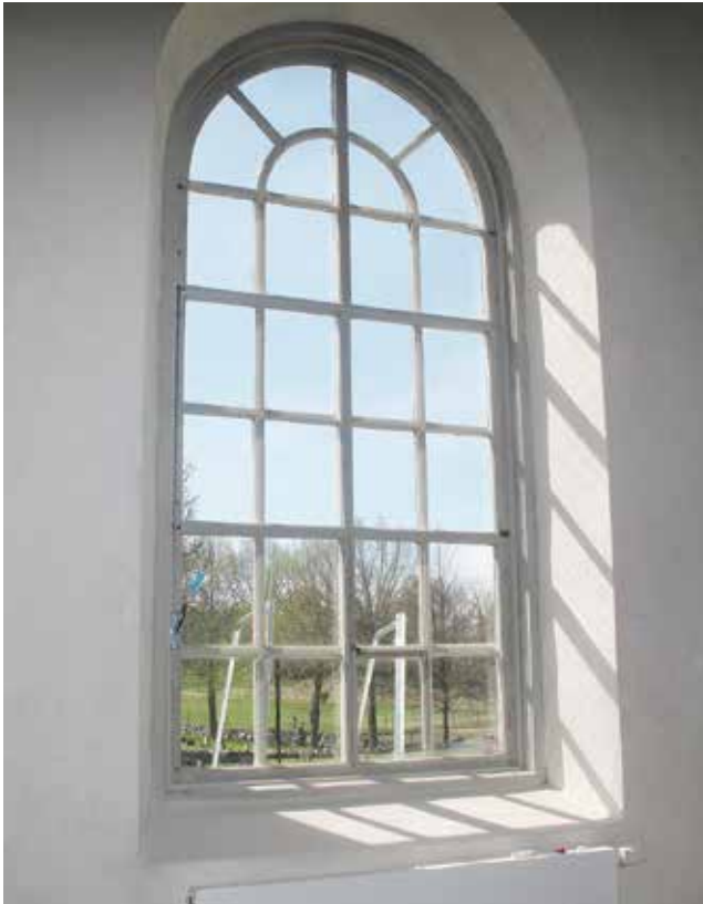
Figur 39. Utrymningsfönstret i orgelkoret. Lp_2012_00261