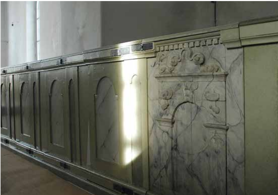
Fig 10. Utsidorna är målade och marmoreringsmålade i en grå nyans, liknande den på den äldre dörren. Lp_2012_00270.