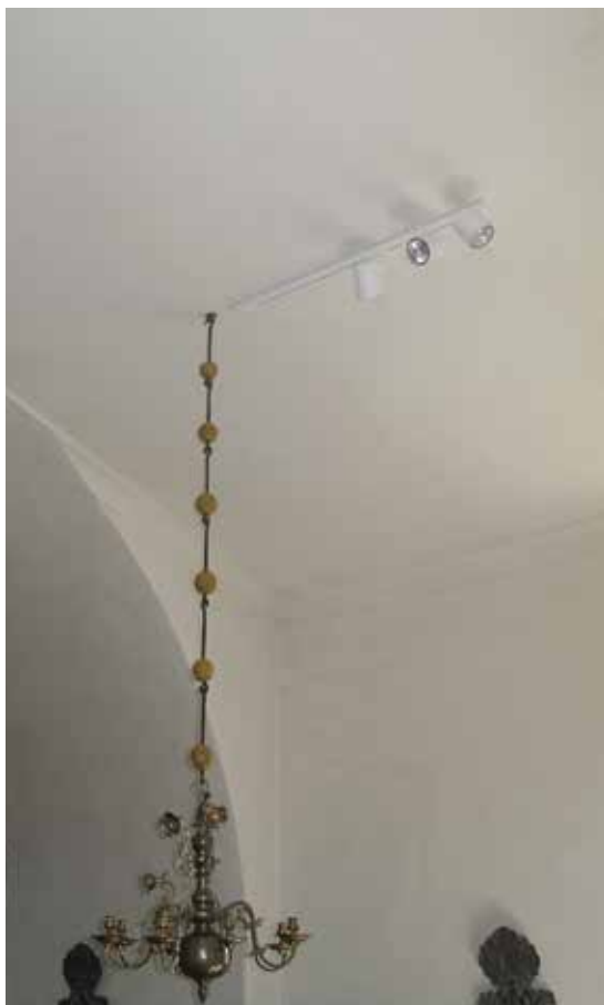
Figur 30. Spotlightslinga i orgelkoret (på bilden tre stycken spotlights, sedermera endast två stycken) Lp_2012_00266.