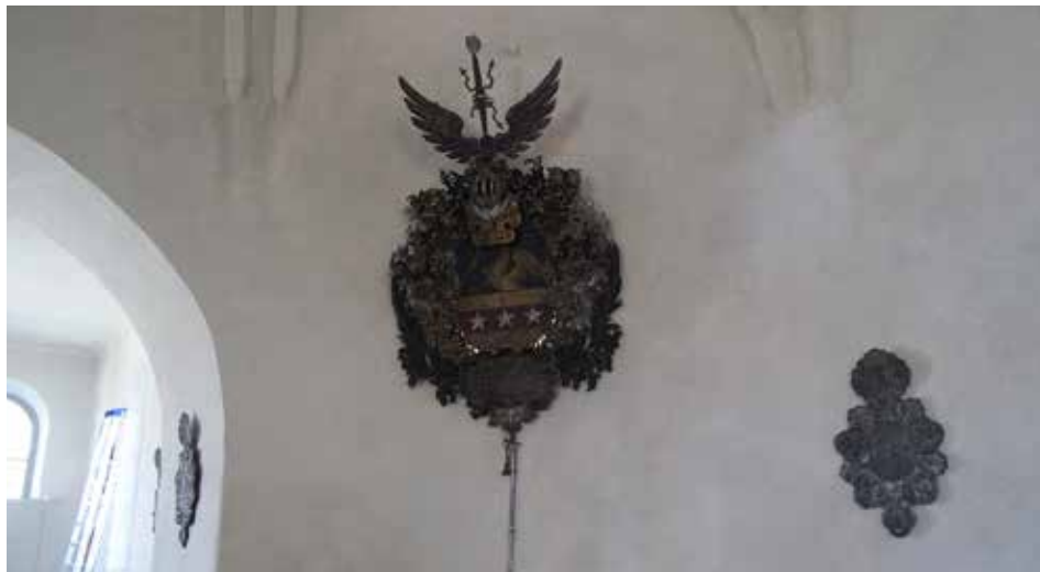
Figur 24. Blixenstiernas vapen med svärdet nedan Lp_2012_00276.