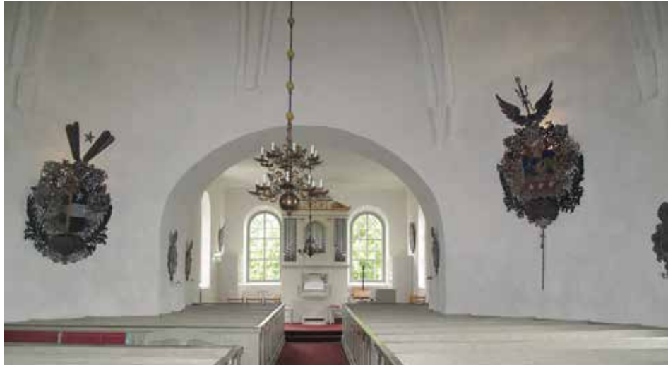
Figur 23. Två av de tre stora vapnen i rundhuset, t.v. Nordschölds och t.h. Blixenstiernas Lp_2012_00313.