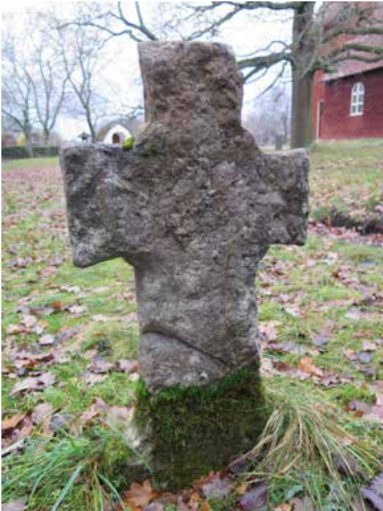
Fig. 38. Gravsten från 1600-talet med korsform Lp201400342