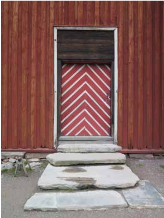
Fig. 13. Ingång i tornets bottenvåning. Lp201400311