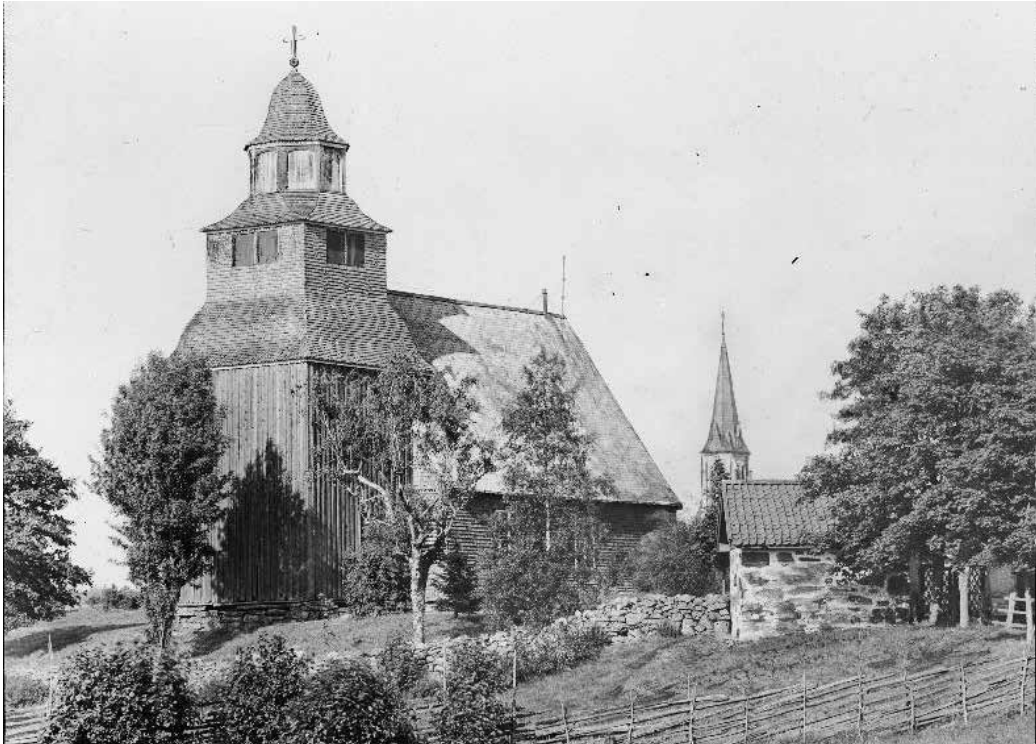
Fig. 2. Seglora kyrka på ursprunglig plats 1906. På bilden syns också den nya kyrkans torn samt en mindre byggnad som användes som arkiv.