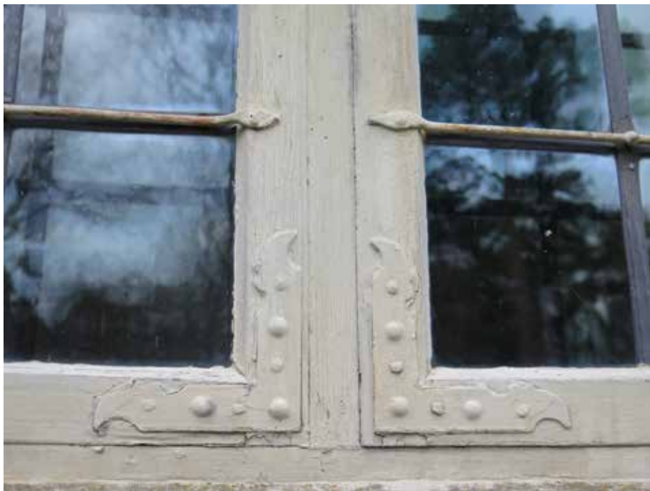
Fig. 18. Detalj från ett av kyrkans fönster. Hörneslag av 1700-talstyp. Lp201400316