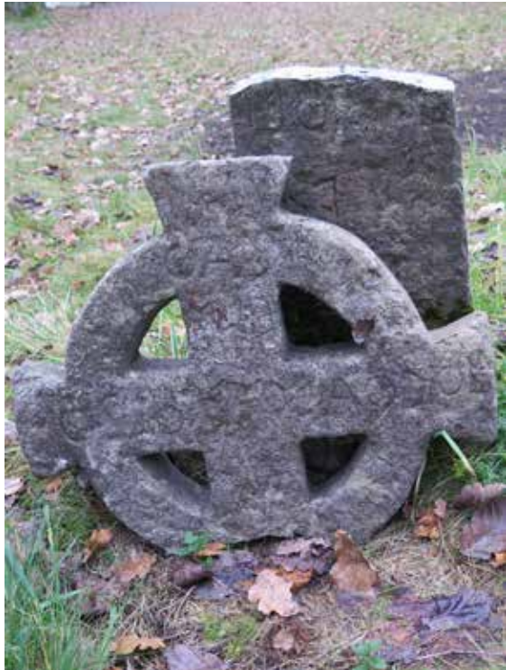
Fig. 39. Gravsten med ringkorsform. Lp201400340