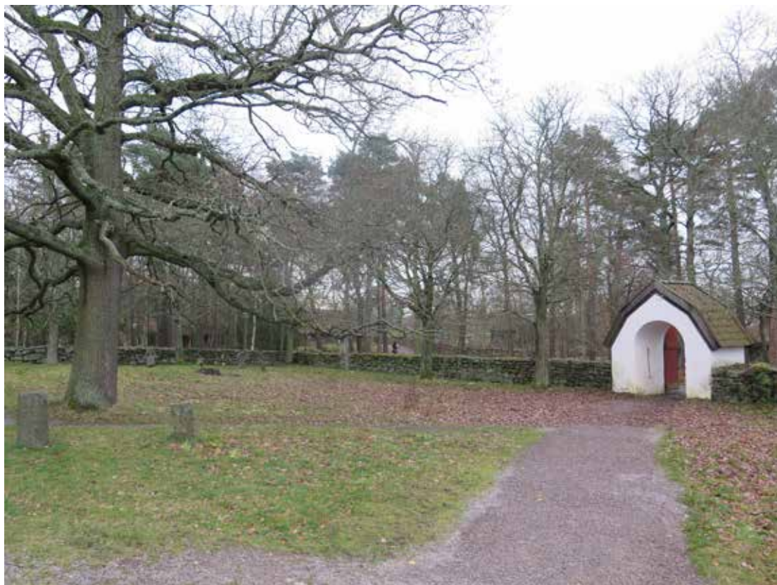
Fig. 29. Del av kyrkogården söder om kyrkan. Lp201400330

Utöver oxlarna som står längs med kyrkogårdsmuren finns en stor ek centralt placerad på den södra delen av kyrkogården. I övrigt finns två relativt nyplanterade björkar samt ett träd intill tornet i nordväst. Längs gången mellan den södra stigluckan och kyrkan växer en rosenbuske. Söder om kyrkan växer vintergröna på marken. I övrigt finns få planterade växter. Några träd har tagits ner på kyrkogården, vilket syns genom stubbar som finns kvar.