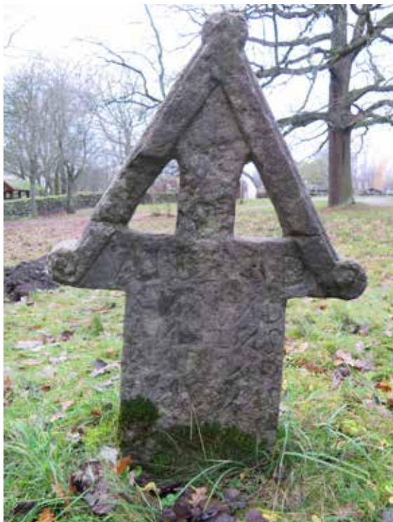
Fig. 41. Gravsten med form lånad från träkors. Lp201400339