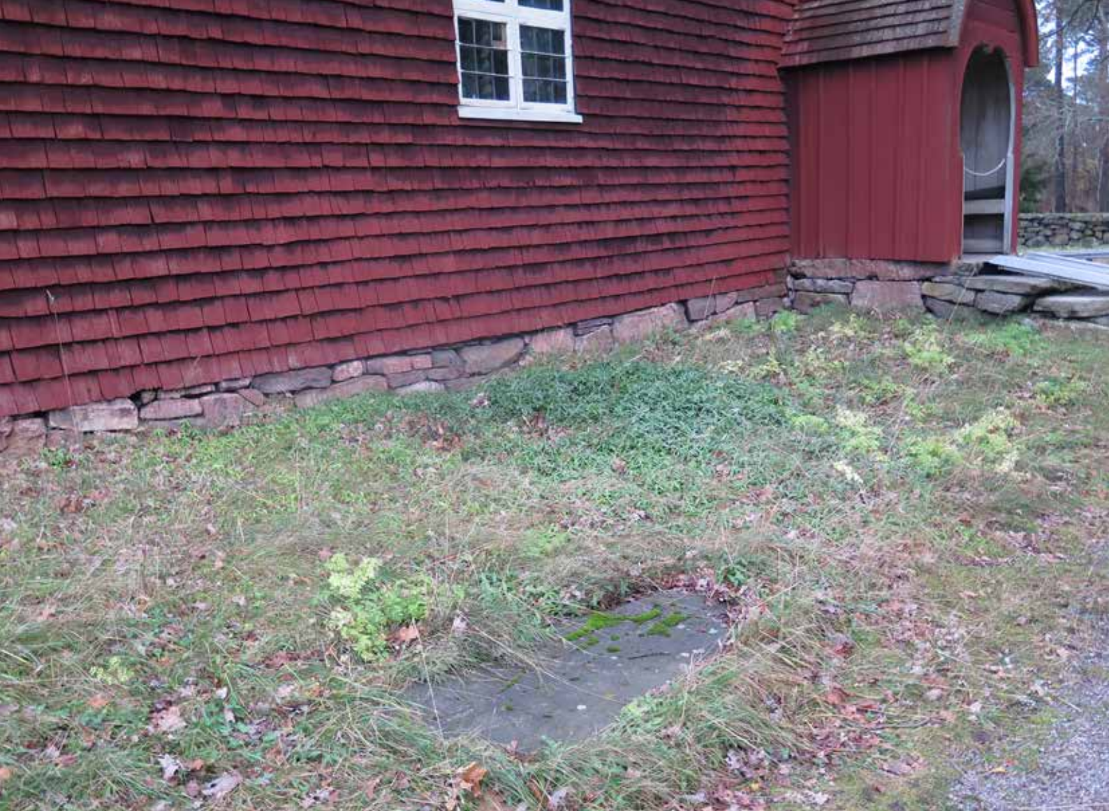
Fig. 35. Gravsten troligen från 1100-talet, nära kyrkans södra vägg. Lp201400336