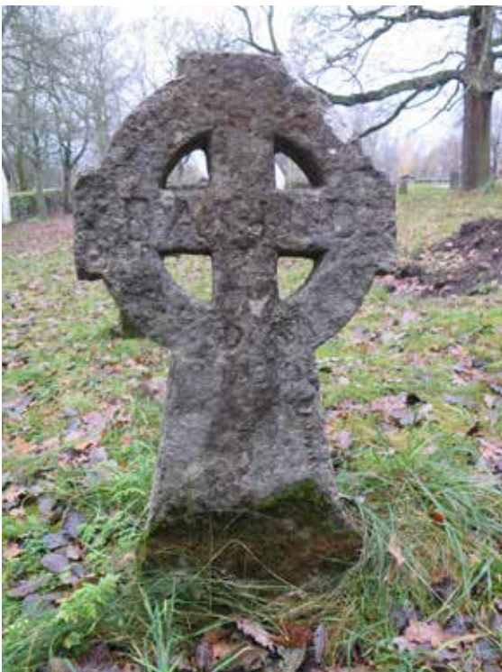
Fig. 40. Gravsten från 1769 med ringkorsform. Lp201400341