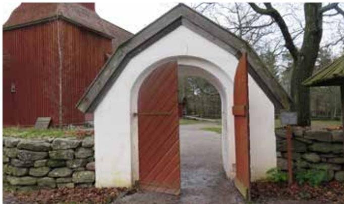
Fig. 33. Västra stigluckan. Lp201400333