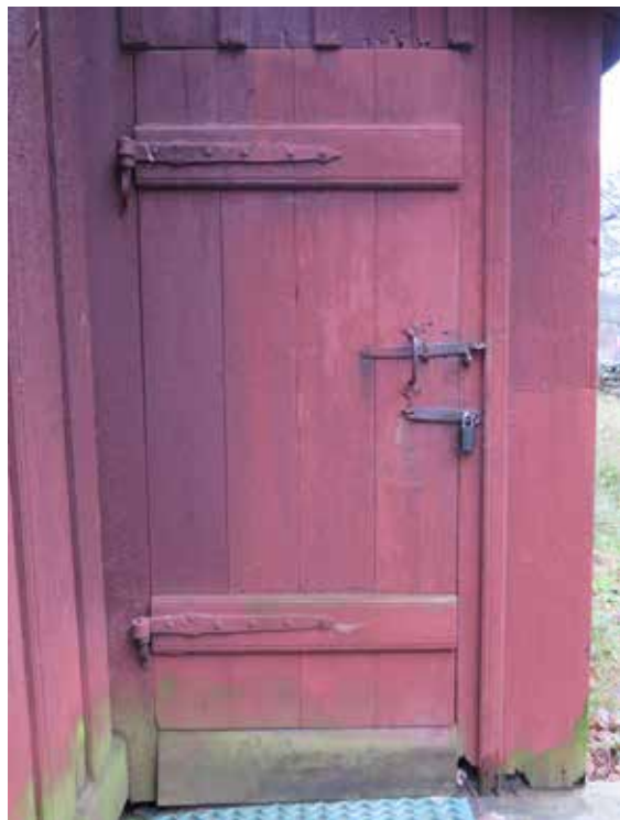
Fig. 16. Ingång till sakristian. Lp201400314