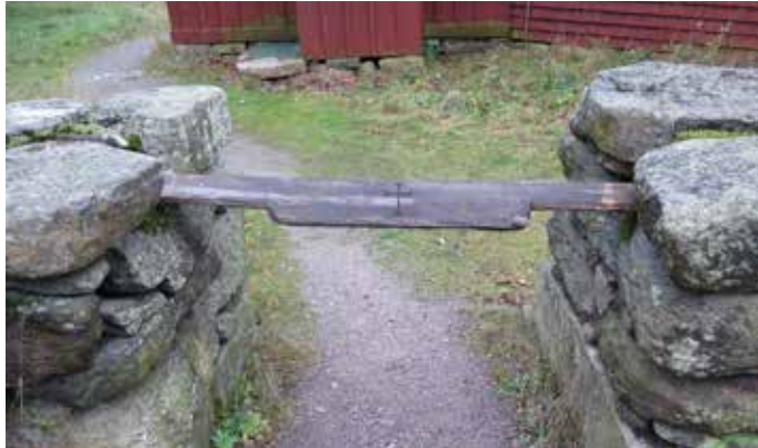
Fig. 31. Ingång till kyrkogården i norr. Lp201400331