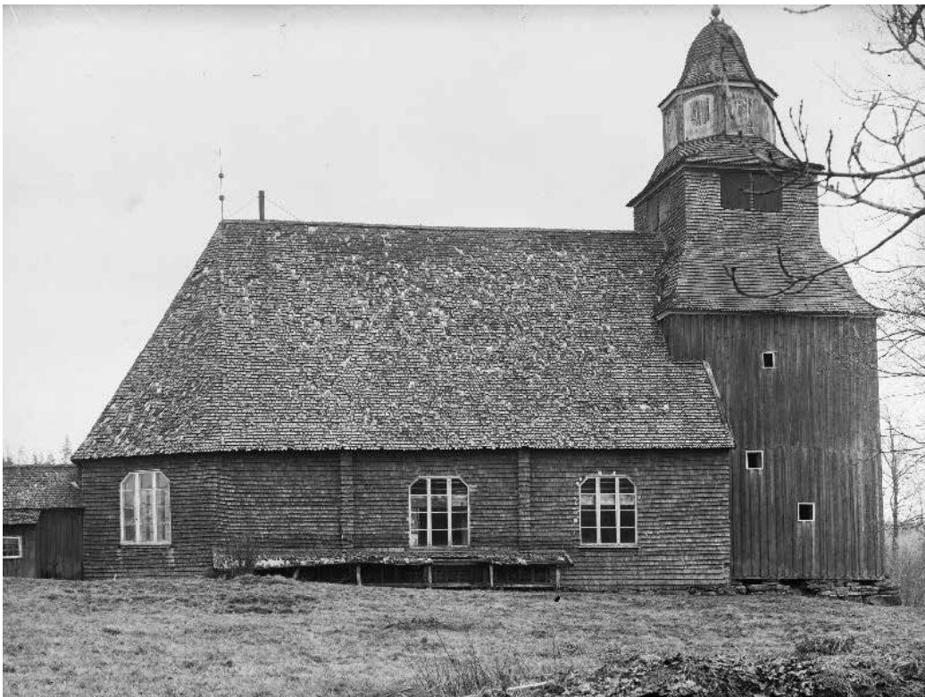
Fig. 3. Seglora kyrka på ursprunglig plats. Foto taget från norr. Foto Anders Roland, okänt årtal. Bildkälla: Riksantikvarieämbetet