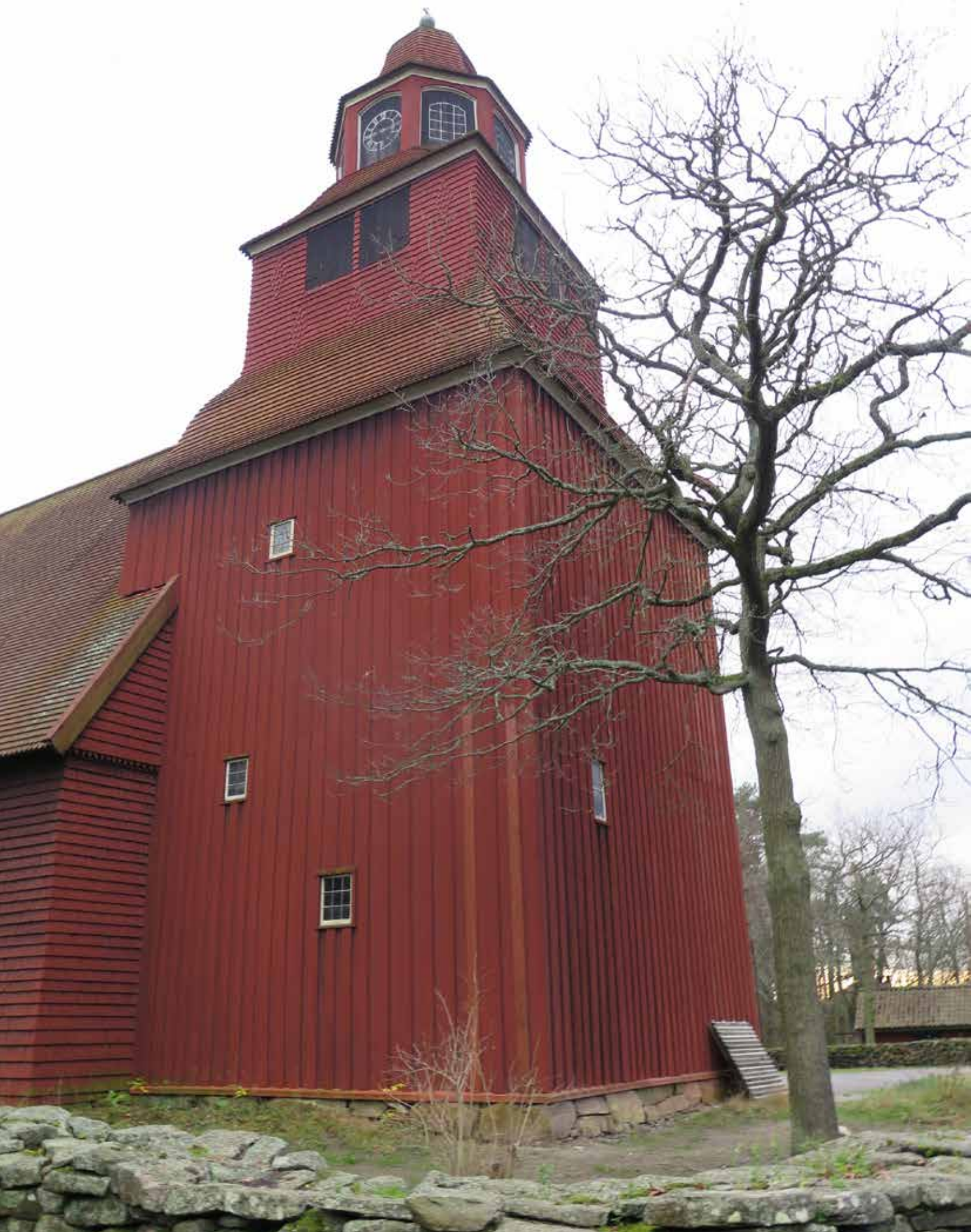
Fig. 11. Kyrktornet fotograferat från nordväst. Lp 201400317