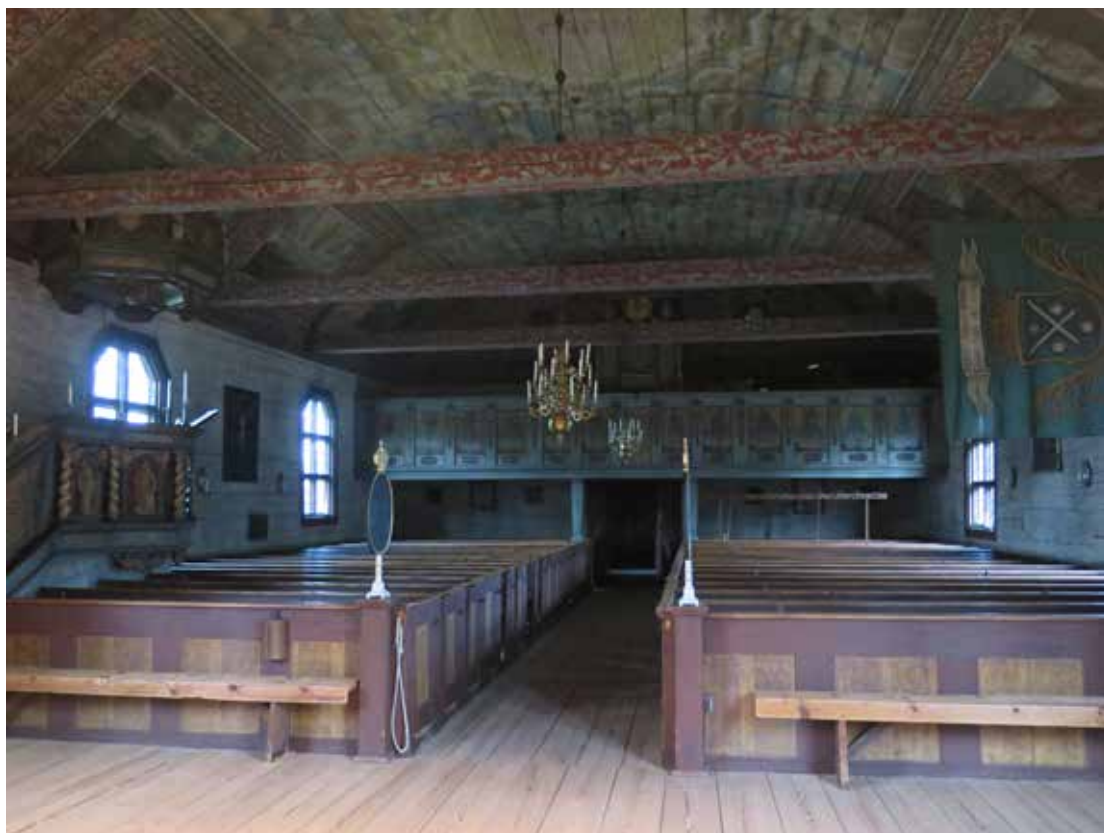
Fig. 19. Långhuset med de slutna bänkkvarteren och målat tak. Lp201400320