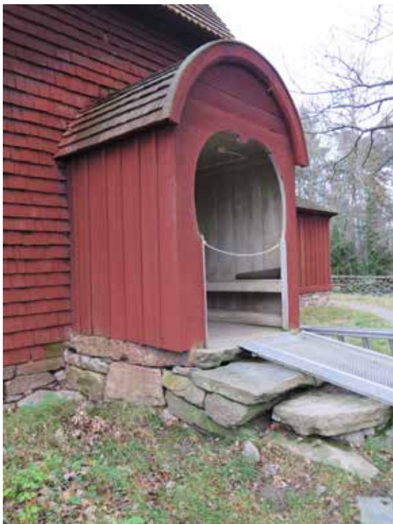
Fig. 15. Koringången på södra långsidan. Lp201400313