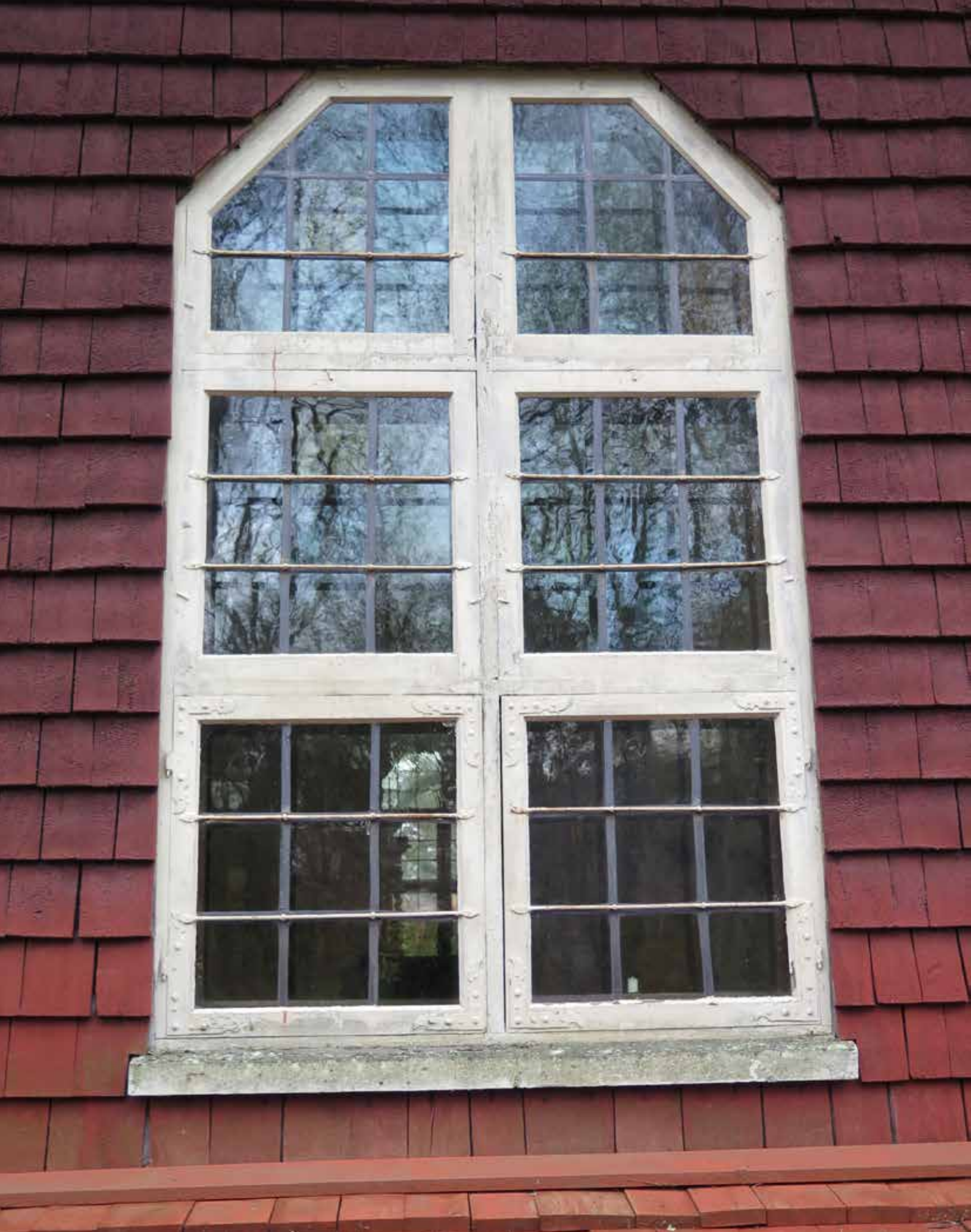
Fig. 17. Ett av fönstren på norra långsidan. Lp201400315