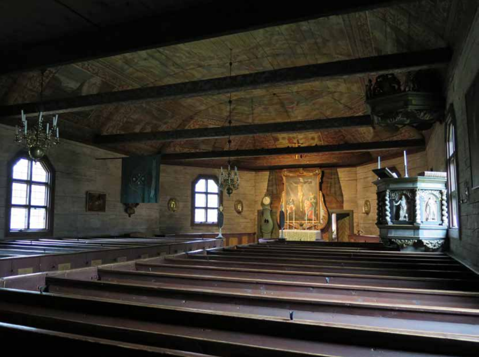
Fig. 20. Långhus och kor. LP_2014_00322

Den slutna bänkinredningen är ursprunglig och består av ett bänkkvarter på var sida om mittgången med vardera 17 rader. Bänkinredningen har målats om flera gånger men har nu sin ursprungliga rödbruna färgsättning med björkimitation på speglarna. På varje spegel står bänkradens nummer i grått. De tre sista raderna saknar dörrar. Varje gård hade ursprungligen sin egen plats i kyrkan. Vid bänk 9 på höger sida finns en skylt kvar som visar att det var platser för folket från gårdarna Seglered och Åhrebo. Framför varje bänkkvarter står en enkelt utformad bänk i omålat trä. På de främre bänkarnas hörnstolpar finns två ovala nummertavlor med förgyllda detaljer, som nyttillverkades omkring år 2000 med de ursprungliga nummertavlorna som förlaga. Längst fram på det södra bänkkvarterets bröstning sitter en bössa i trä. Framme i koret finns korbänkar på var sida om altaret. Korbänkarnas färgsättning är densamma som bänkkvarterens.