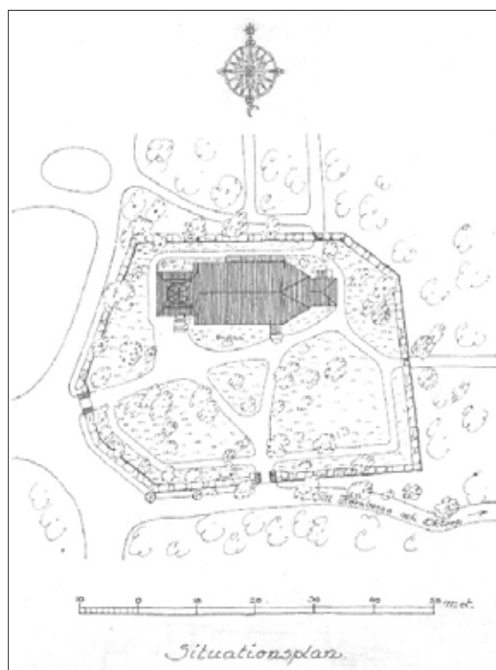
Fig. 6. Situationsplan av kyrkan och kyrkogården på Skansen. Här syns att kyrkogårdens form och gångarna anlagts något annorlunda än i Seglora. Anders Roland. Bildkälla: Skansens arkiv