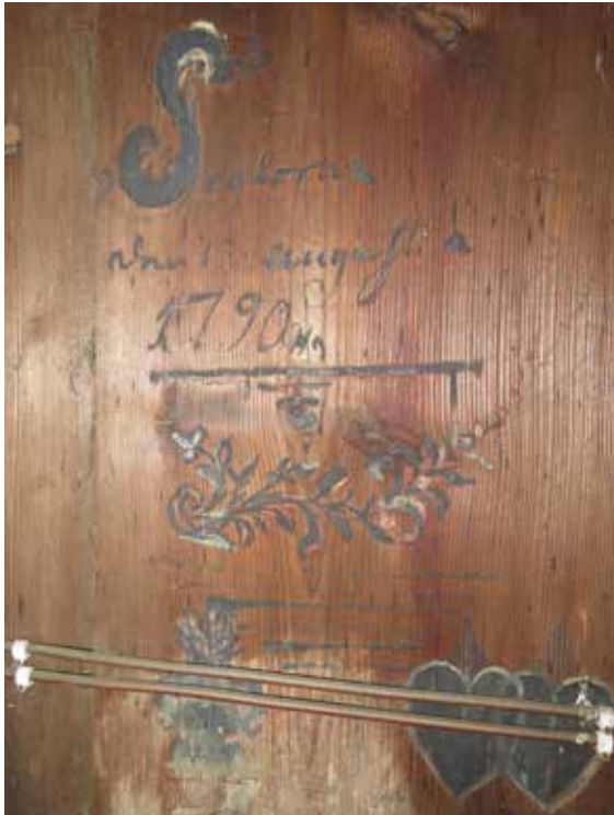
Fig. 26. Spår från olika tider på väggarna i tornet. Lp201400327