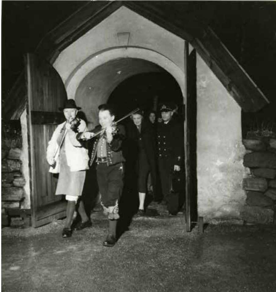
Fig. 8. Adventsfirande vid Seglora kyrka, 1952.