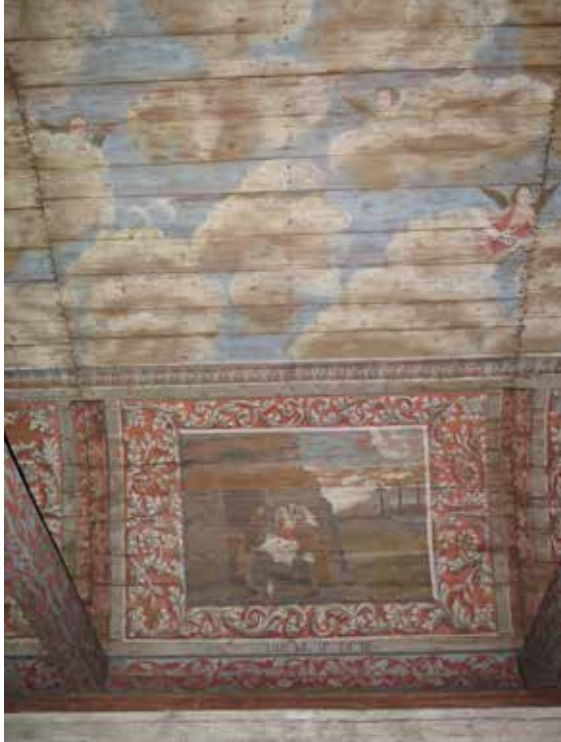
Fig. 23. Del av det bemålade taket på norra sidan. Motivet är Kristi begravning. Lp201400324