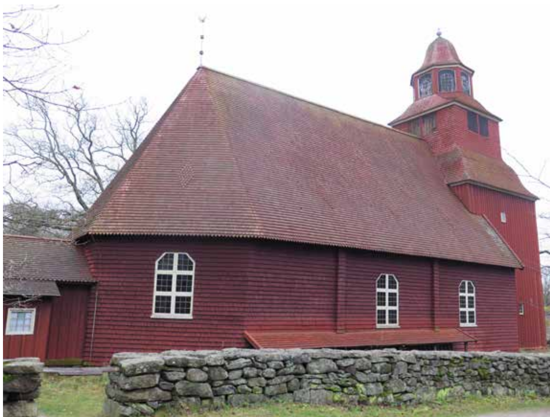
Fig. 12. Kyrkan fotograferad från nordost. Lp 201400319

Det finns två ingångar till kyrkan i söder, en i tornet och en in till koret. Ingång finns också genom sakristian.