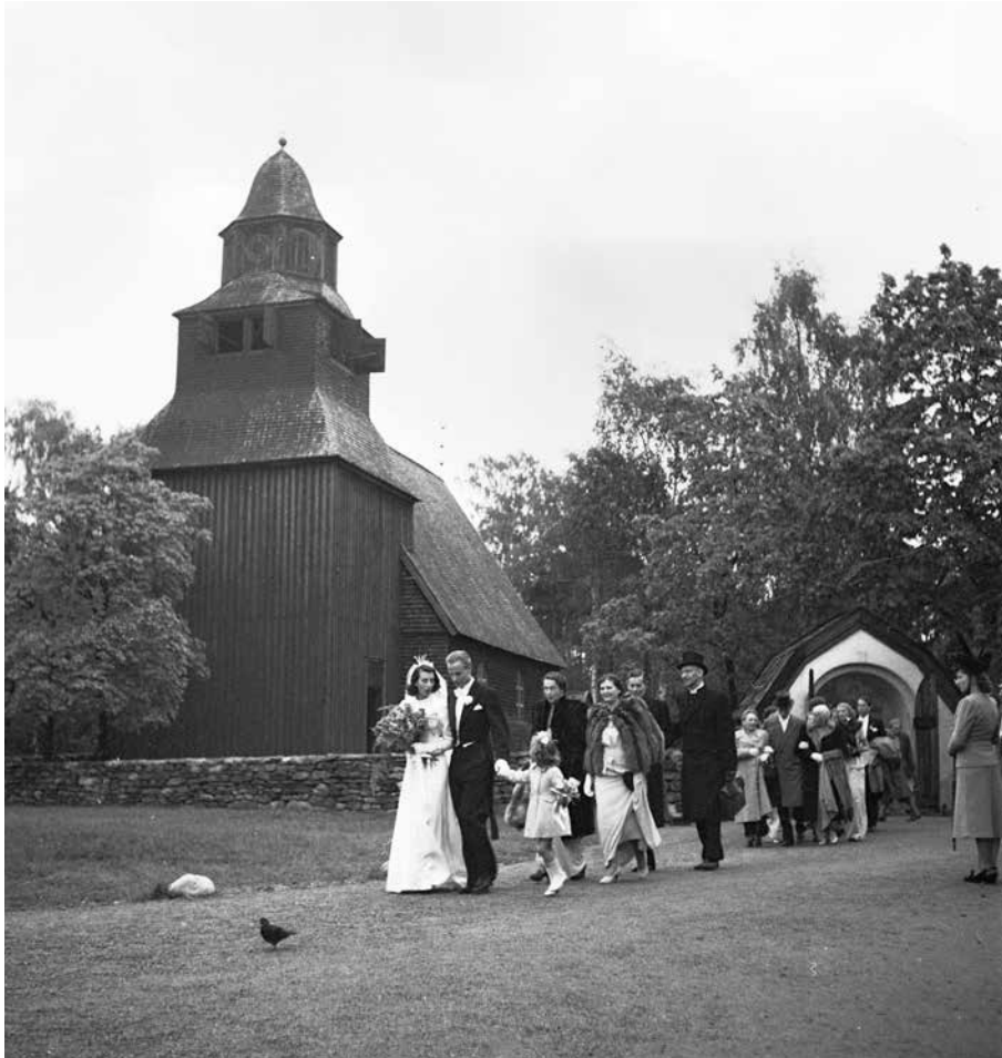
Fig. 7. Bröllopsfölje vid Seglora kyrka på Skansen, 1948.