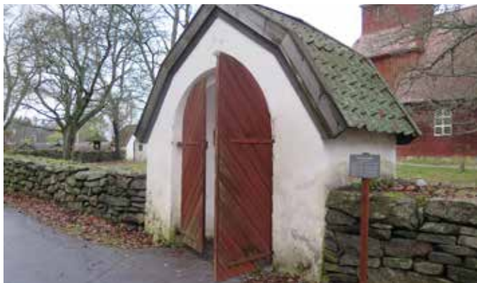
Fig. 34. Södra stigluckan. Lp201400334