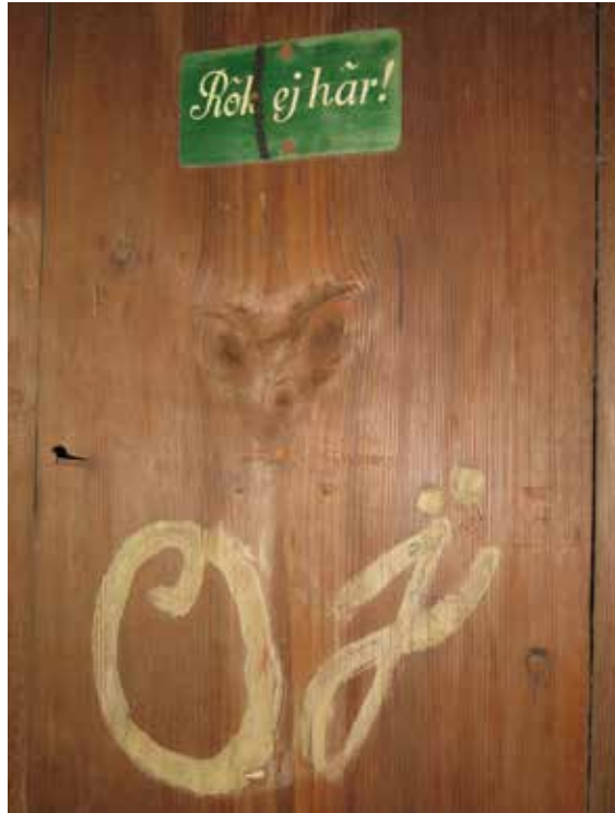
Fig. 27. Spår från olika tider på väggarna i tornet. Lp201400328

Sakristian nås genom en dörr på altarets södra sida. Mot koret har bräddörren profilsågad fiskbenspanel målad i en grönblå kulör. In mot sakristian är bräddörren målad i samma grå kulör som övriga snickerier i sakristian. Sakristian har ett omålat brädgolv och ett vitmålat bräddtak. På väggarna sitter en kopia av en 1870-talstapet som går i blått, vitt och beige. Rummet är möblerat med skrivbord, stol, bokhylla, textilskåp och en kista som införskaffades av församlingen 1710. På den västra väggen sitter en tavla med kort information och historik över Seglora kyrka och vilka som var inblandade vid flytten till Skansen. Från sakristian finns en utgång genom ett vindfång på dess norra sida. Vindfånget nås genom en bräddörr som är gråmålad in mot sakristian och har liggande brunmålad panel mot vindfånget. Vindfånget är inrett med brunmålad träpanel på väggar och tak. Dörren ut mot kyrkogården har brunmålad fiskbenspanel. Alla dörrarnas handtag och haspar är smidda.