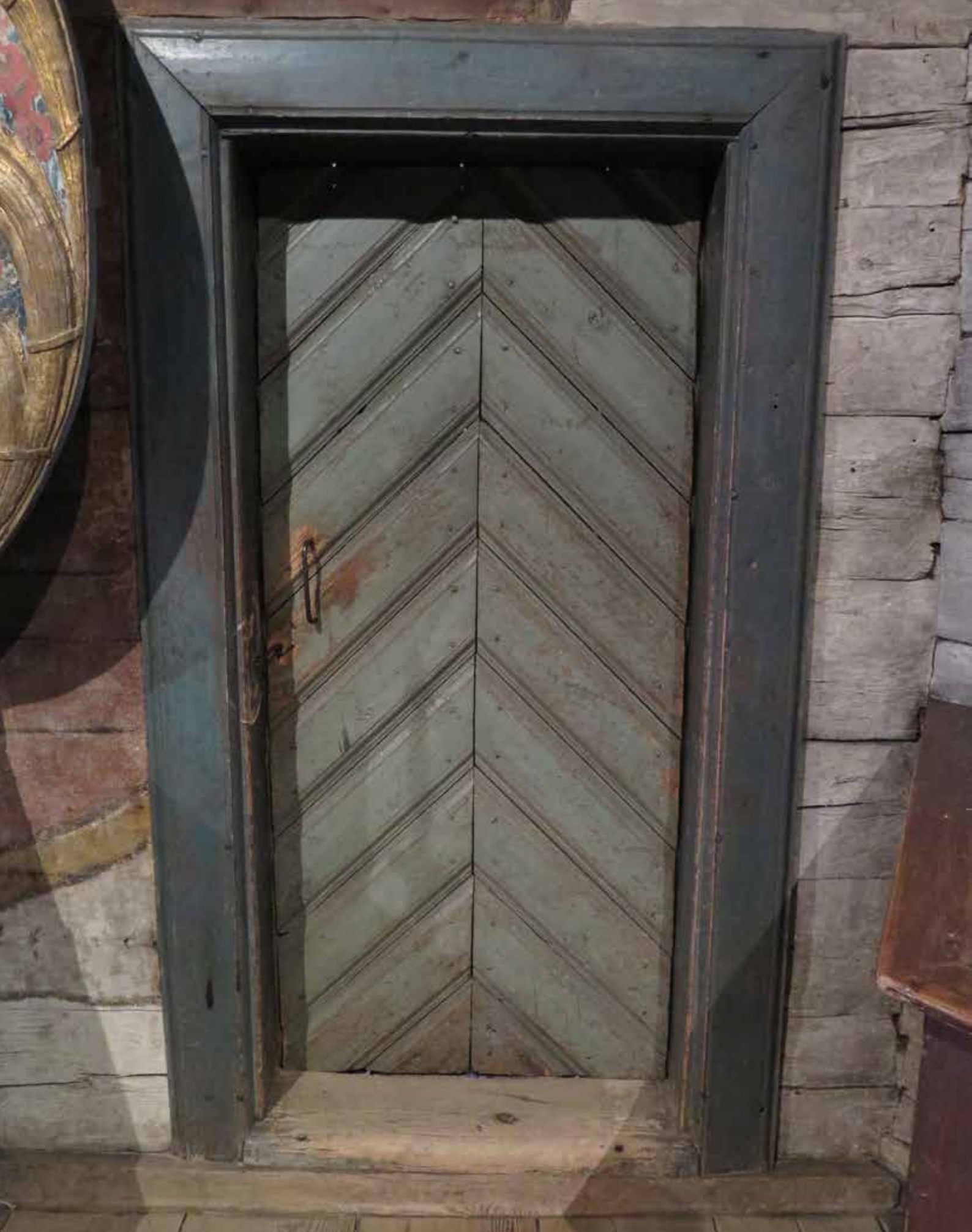
Fig. 25. Dörren från koret in till sakristian. Lp201400326