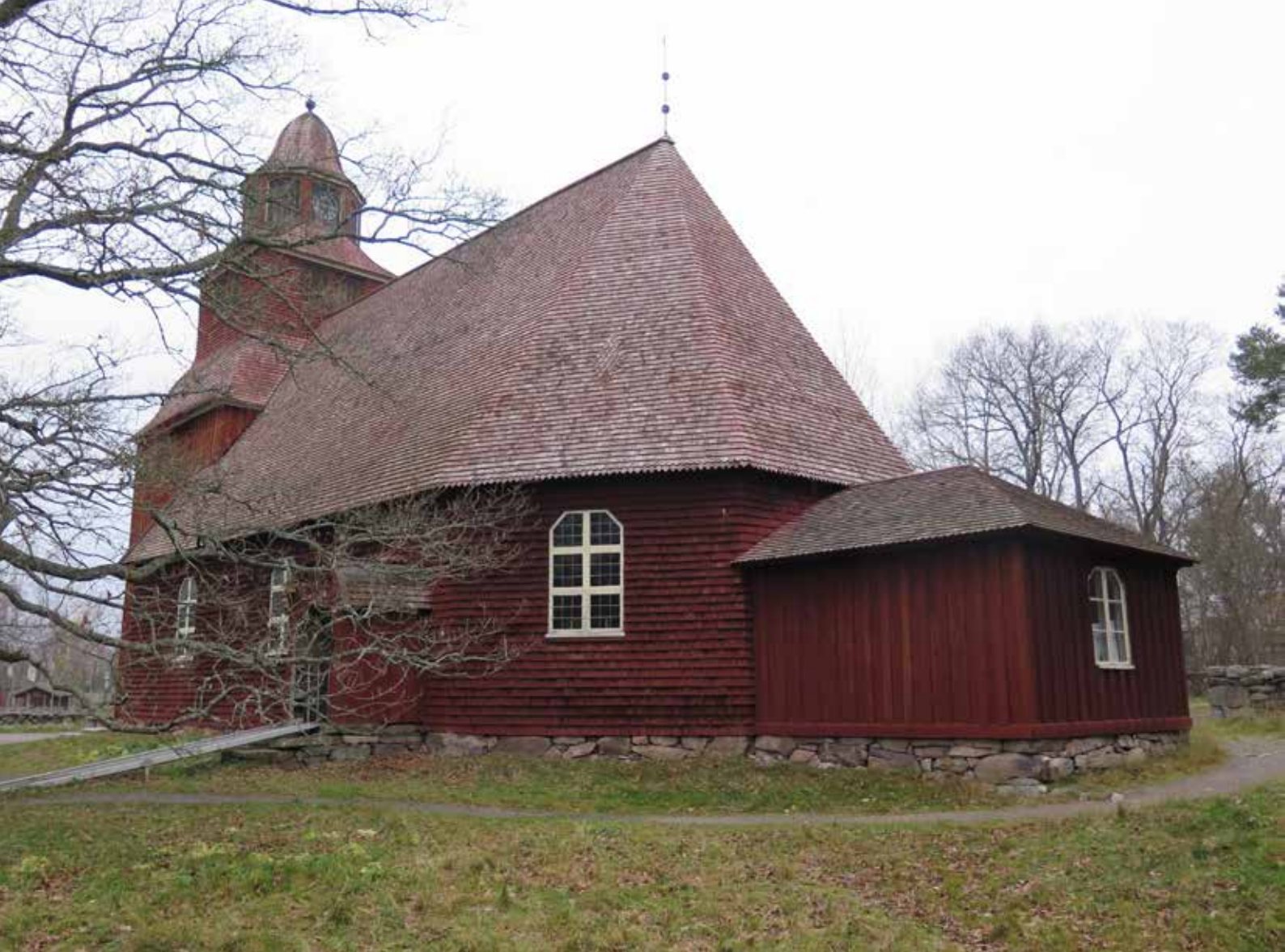
Fig. 9. Kyrkan fotograferad från sydost. Här syns det tresidiga koret och den senare tillbyggda sakristian. Lp 201400318