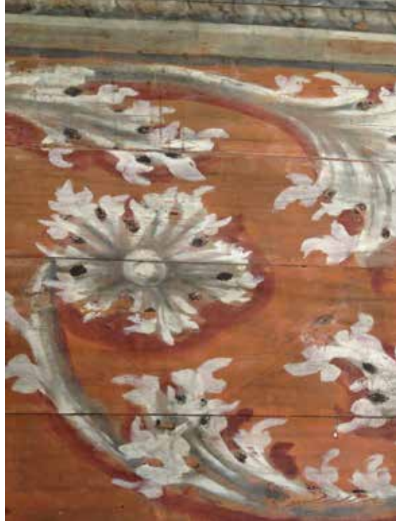
Fig. 24. Detalj av takmåleri. Lp201400325

Orgelläktaren utmed den västra gaveln nås genom en trappa från vapenhuset. Läktarens bröstning är målade med symboliska bilder från Nya testamentet och bibelcitat. Mellan speglarna finns målade blomrankor. När kvinnofolksläktaren inte återuppbyggdes tillverkades två nya speglar på orgelläktarens bröstning. Mitt på läktarbarriären finns en text från 1814 som berättar att kyrkan målades om då. Vid återuppförandet på Skansen togs sentida färgskikt bort och måleriet på bröstningen idag är en blandning mellan det ursprungliga och senare tillägg. Färgsättningen går i blågrått. På läktaren finns en centralt placerad orgel. Den tillverkades 1777 och köptes in från Films kyrka i Uppland. Den fick sin plats i Seglora kyrka 1963. Orgelns fasad är i gustaviansk stil och målade i blågrönt med förgyllda delar. På läktarens norra sida står en mindre, digital orgel. I väggen mellan läktare och torn finns två små rektangulära fönster med blyspröjs.