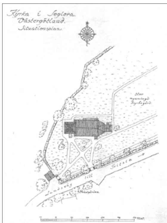
Fig. 5. Situationsplan av kyrkan och äldre del av kyrkogården i Seglora. Anders Roland, 1916.

Från Seglora kyrkogård och omgivning flyttades ingenting förutom ett fåtal gravvårdar med till Skansen. Kyrkogårdsmur, stigluckor, övriga byggnader och gravvårdar fyllde fortfarande sina funktioner på platsen även efter att kyrkan inte fanns kvar. På Skansen anlades en kyrkogård och kyrkogårdsmur eftersom det ansågs vara en viktig del i en kyrkomiljö, både kulturhistoriskt och arkitektoniskt. Kyrkogården på Skansen är i stort sett en kopia av den äldsta delen av Seglora kyrkogård, men anpassad efter platsens terräng. Gångsystemet på Skansen anlades något annorlunda än i Seglora.