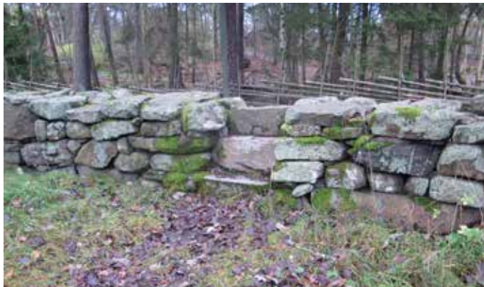
Fig. 32. Trappa i kyrkogårdsmurens östra del. Lp201400332