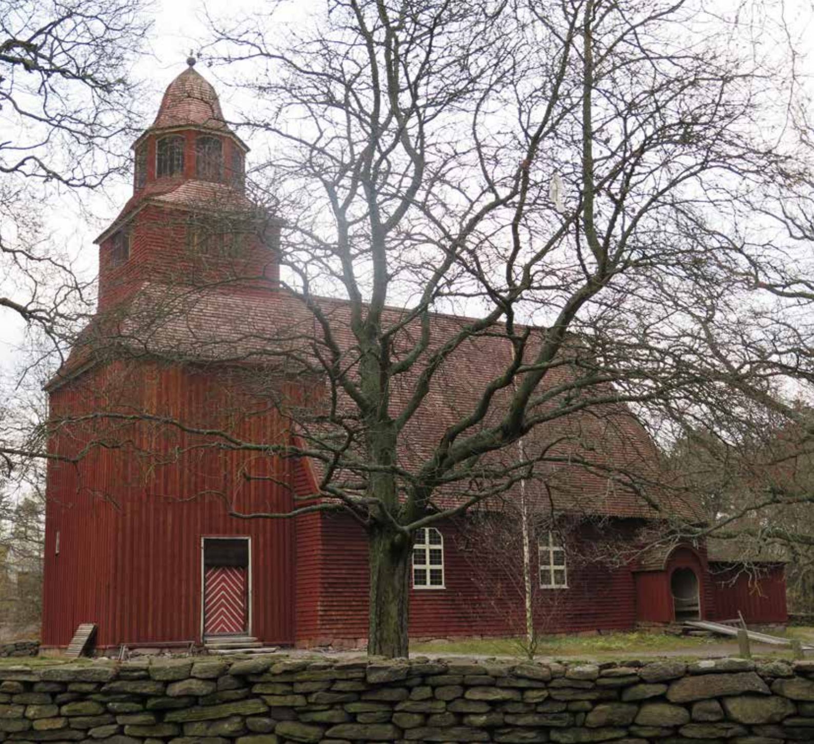
Fig. 1. Seglora kyrka. Fotografi taget från sydväst. Lp201400310