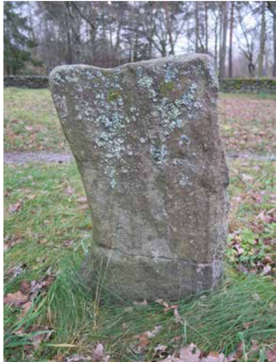
Fig. 37. Gravsten utan inskription, från Seglora kyrkogård. Lp201400338

Gravsten från 1600-tal med korsform. Gravstenen har tidigare varit av i flera delar, men är lagad. Inskriptionen är svår att tyda till följd av vittringsskador.