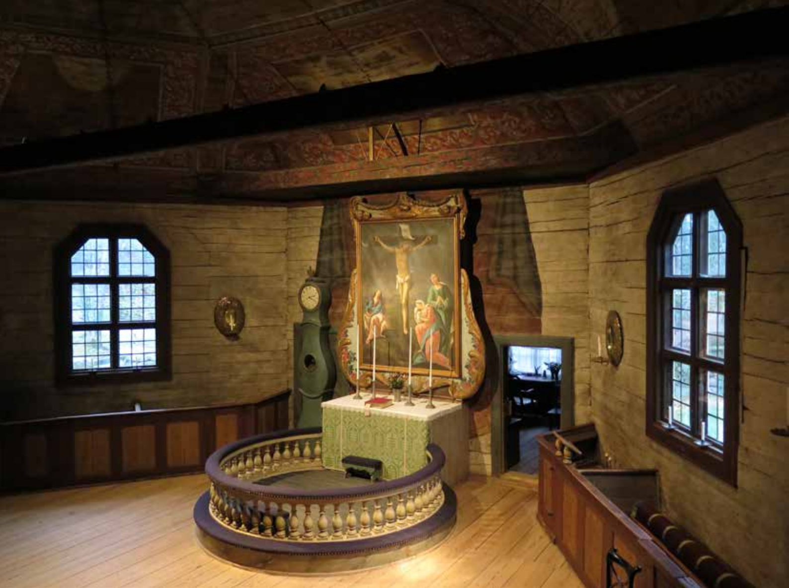
Fig. 22. Koret med altare och bänkar på sidorna. Höger om koret finns ingång till sakristian. Lp201400323