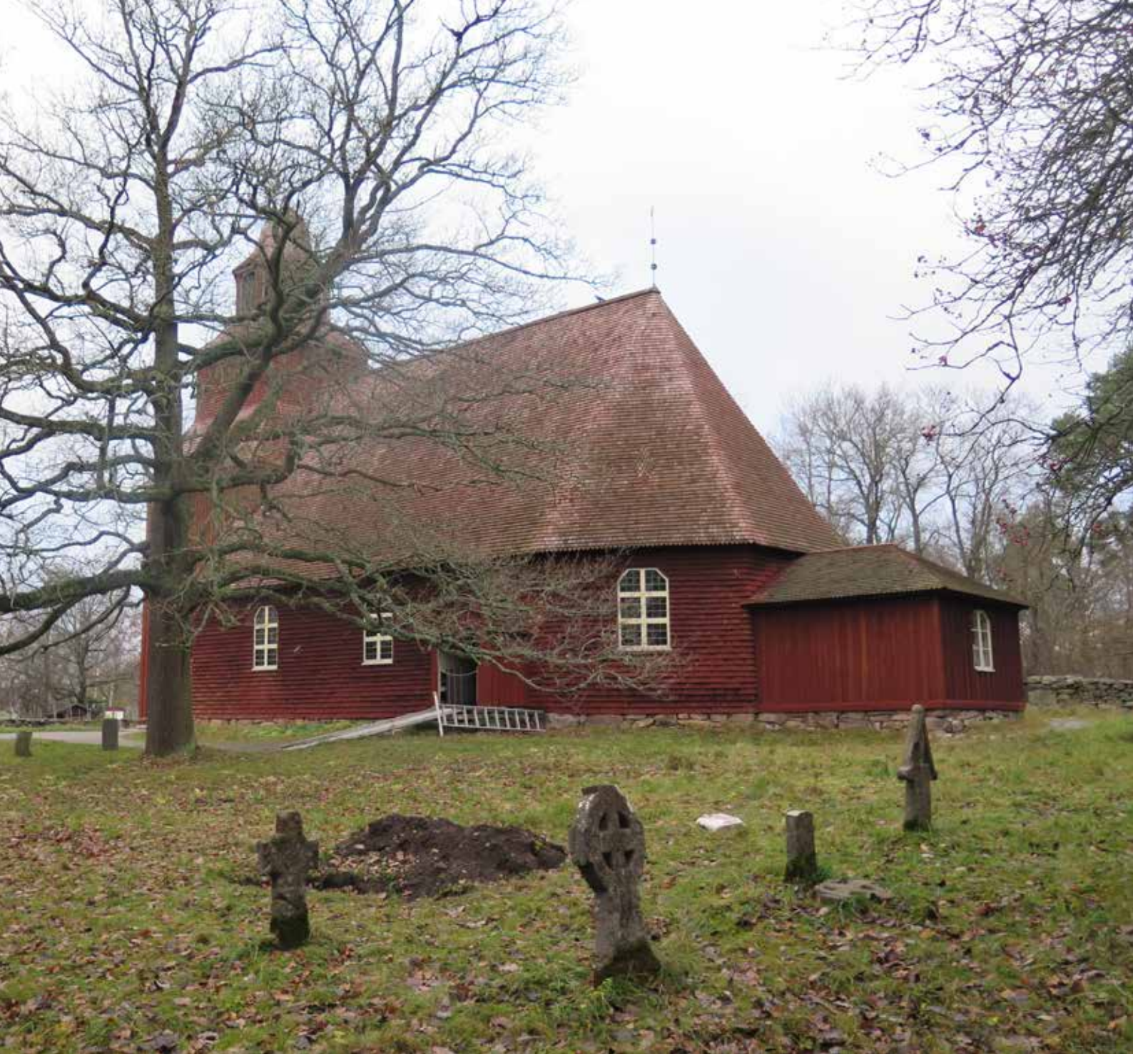
Fig. 30. Gravstenar på kyrkogårdens sydöstra hörn. De fyra gravstenarna närmast i bild stod ursprungligen på Rackeberga kyrkogård i Västergötland. Lp201400335