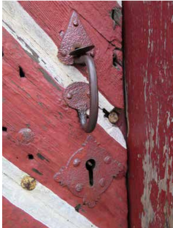
Fig. 14. Detaljbild från kyrkporten. Lp201400312