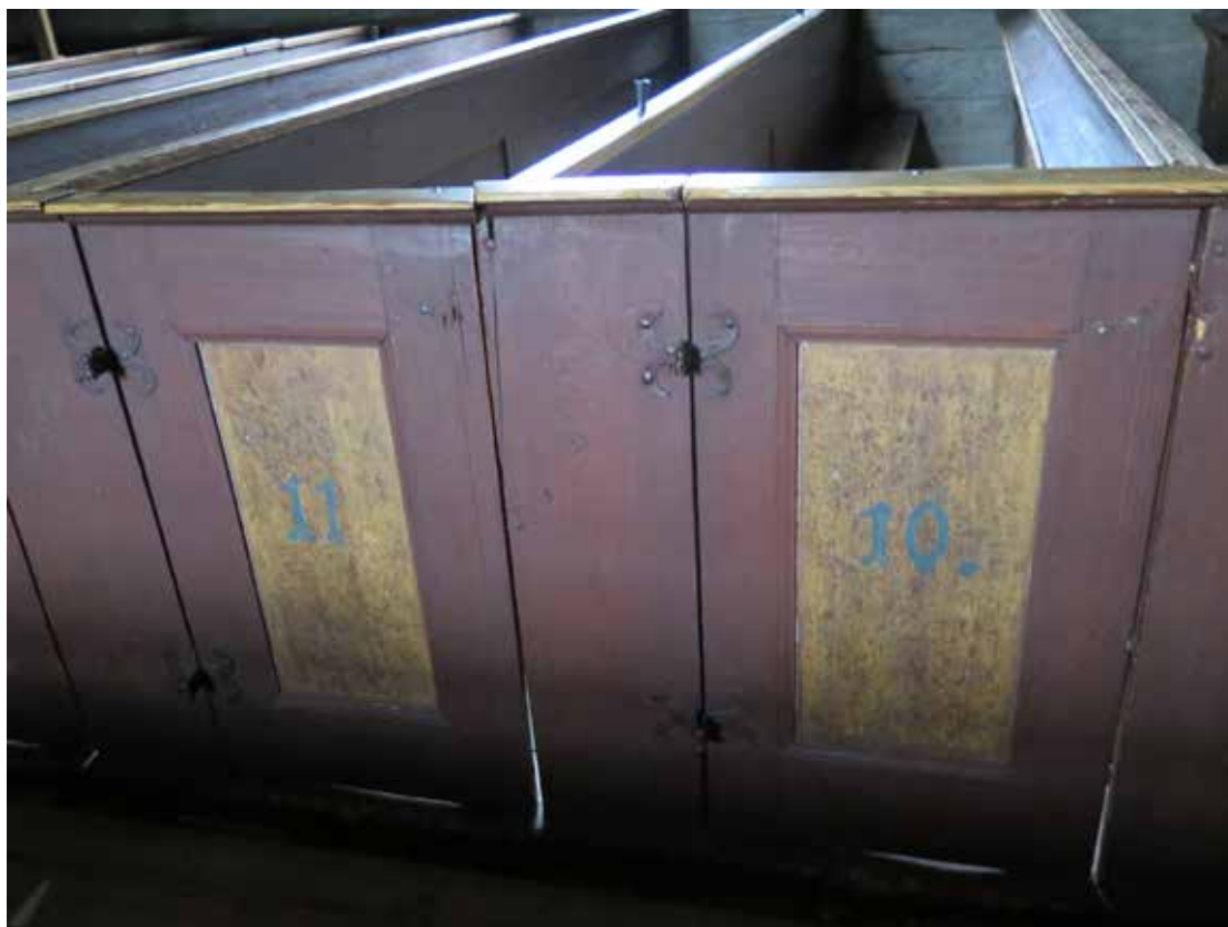
Fig. 21. Bänkarna har en färgsättning i brunt som återställdes vid flytten till Skansen. Lp201400321

Innerfönstrens snickerier är målade i en rödbrun kulör, ibland med röda lister. I timmerväggarna syns skarvar som visar att större fönster har funnits tidigare.