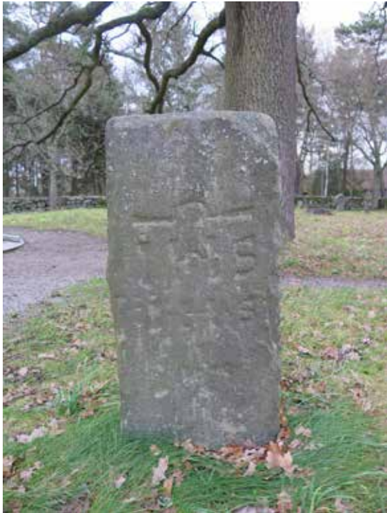
Fig. 36. Gravsten med kristusmonogram, från Seglora kyrkogård. Lp201400337