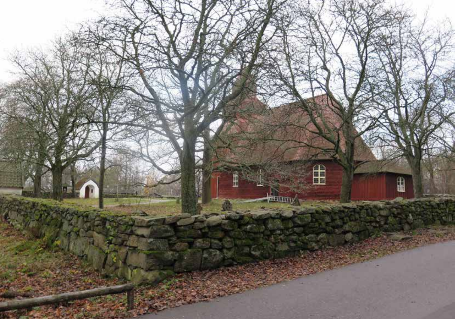
Fig. 28. Kyrkomiljön fotograferad från sydost. Lp201400329