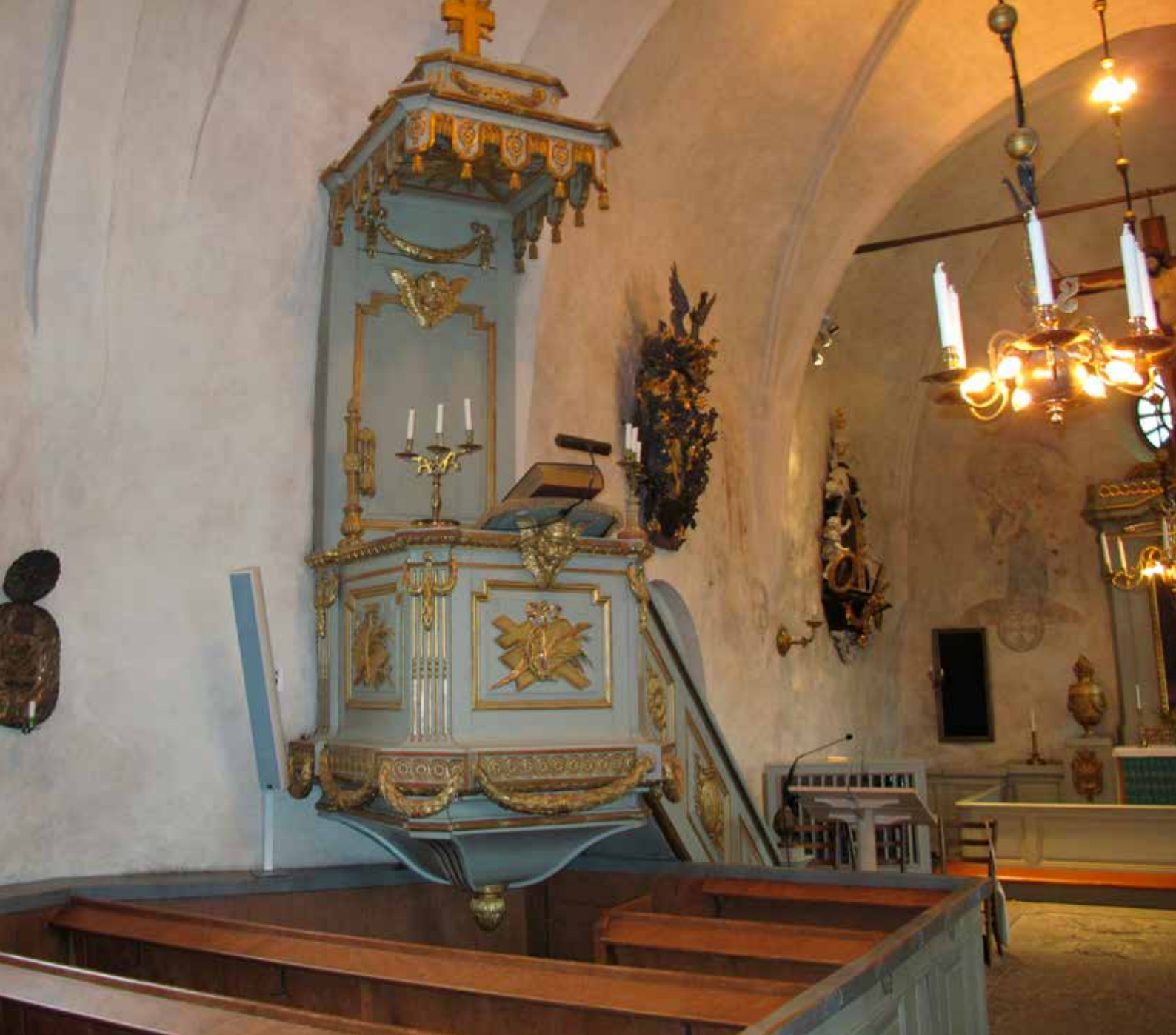
Fig.21. Predikstolen efter konserveringsåtgärderna. Förgyllningen glänser och står i kontrast mot korgens rena grå färg. LP_2015_00187.