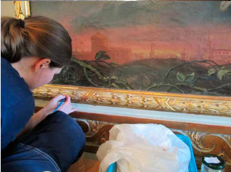
Fig.17. Pågående arbete med att rengöra och konservera kor och altaruppsats. LP_2015_00183.