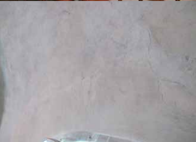
Fig.11. Övre delen av det bakre fönstret på sydväggen är synligt på orgelläktaren. Här var väggen skavd, smutsad och hade sprickor innan åtgärderna. LP_2015_00176.