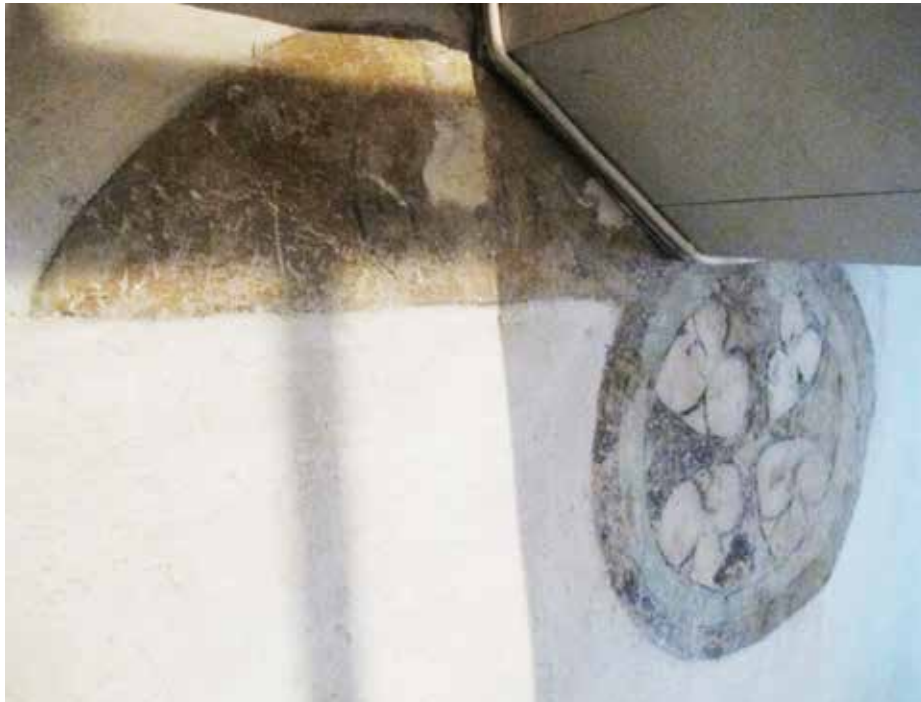
Fig.4. Ett konsekrationsskors strax under orgelläktaren vid trappan. Korsen är de äldsta målningarna i kyrkorummet och bör från början ha varit tolv stycken. De tecknades i vigd olja av den invigande biskopen och imålades därefter som cirkelkors. Det har antagligen funnits en apostel ovanför korset, som inte är synlig idag pga läktaren. LP_2015_00170.