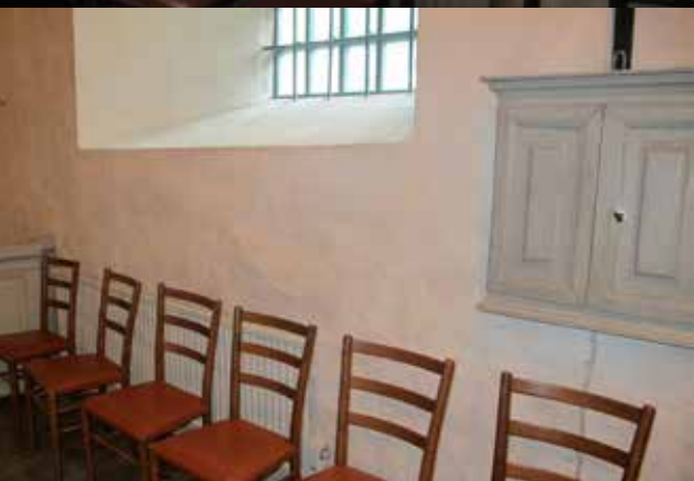
Fig.10. Efter konserveringen var väggen jämnare och ljusare samt putsskadorna var lagade. LP_2015_00177.