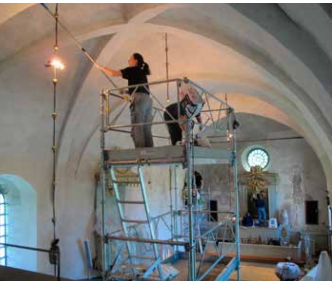
Fig.5. Pågående rengöring av valven i långhuset från ställning. LP_2015_00171.