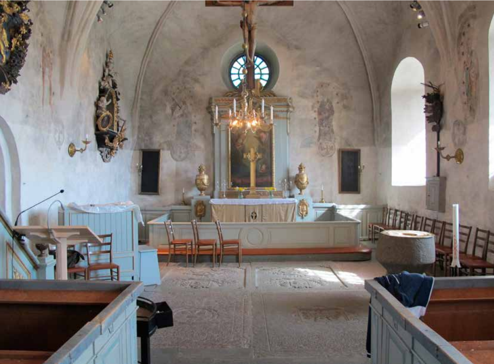
Fig.8. Koret under konservering. LP_2015_00174.