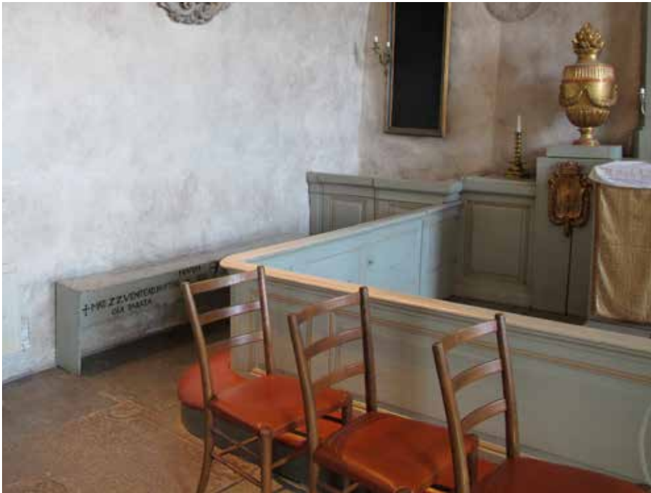
Fig.25. Nattvardsbänken före konserveringen. Antikvarien har ingen efterbild, då bänken var på reparation hos snickeriet när slutbesiktningen ägde rum. Nattvardsbänken före konserveringen.

Antikvarien har ingen efterbild, då bänken var på reparation hos snickeriet när slutbesiktningen ägde rum. LP_2015_00191.