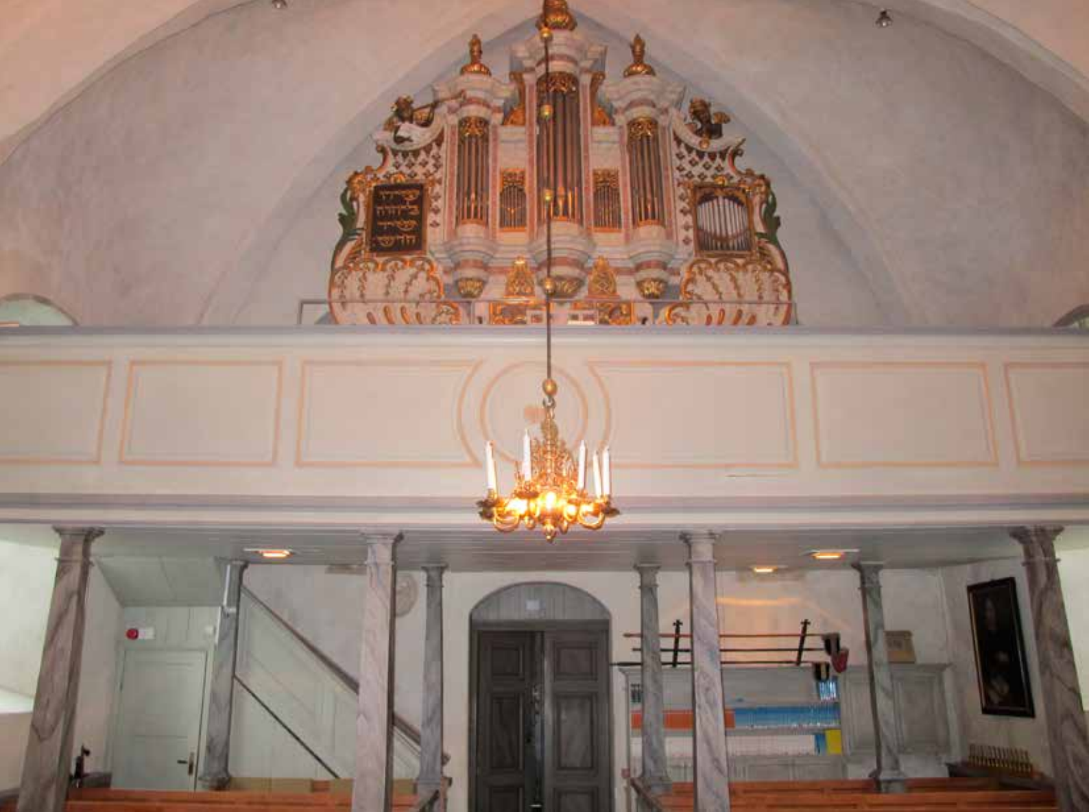
Fig.27. Orgeln efter konserveringsåtgärderna. De två svarta tavlorna på orgelns sidopartier har olika motiv, bestående av Hebreisk skrift respektive orgelpipor. LP_2015_00193.