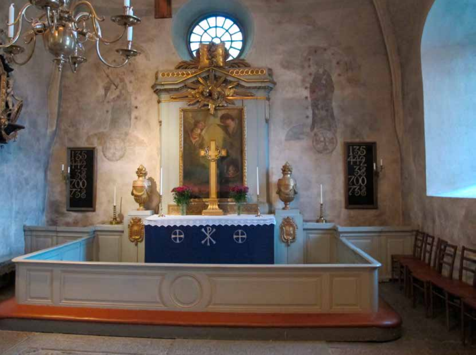
Fig.16. Altaruppsatsen och koret före åtgärderna. LP_2015_00182.