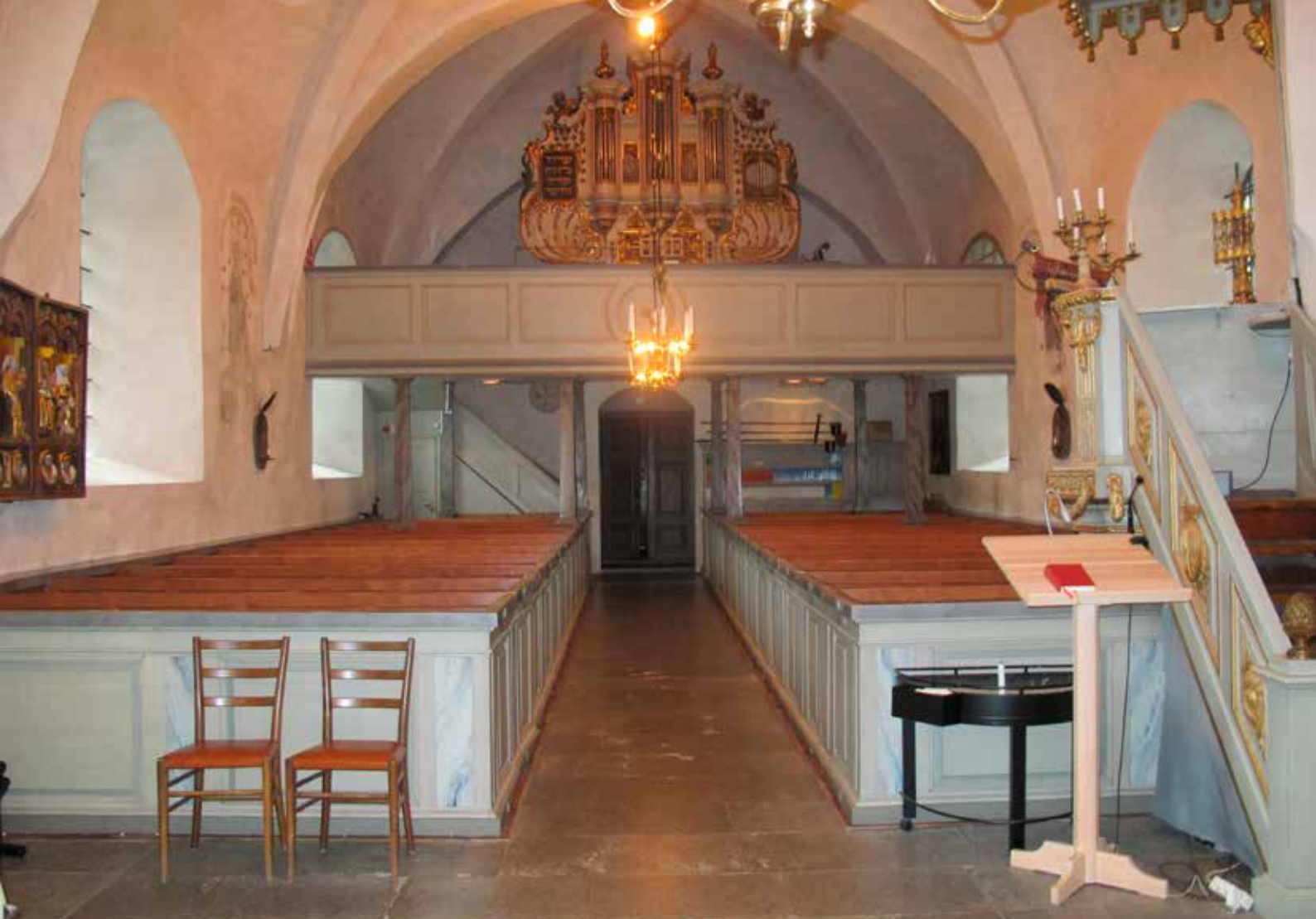
Fig.26. Långhuset, med läktaren och orgeln, sedda från koret efter konserveringen. LP_2015_00192.