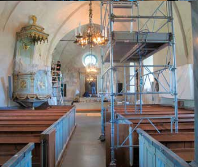
Fig.6. Långhusrengöringen är påbörjad. Skiljelinjen syns på korväggen. Altar uppsatsen och vapnen är också under pågående konservering. LP_2015_00172.