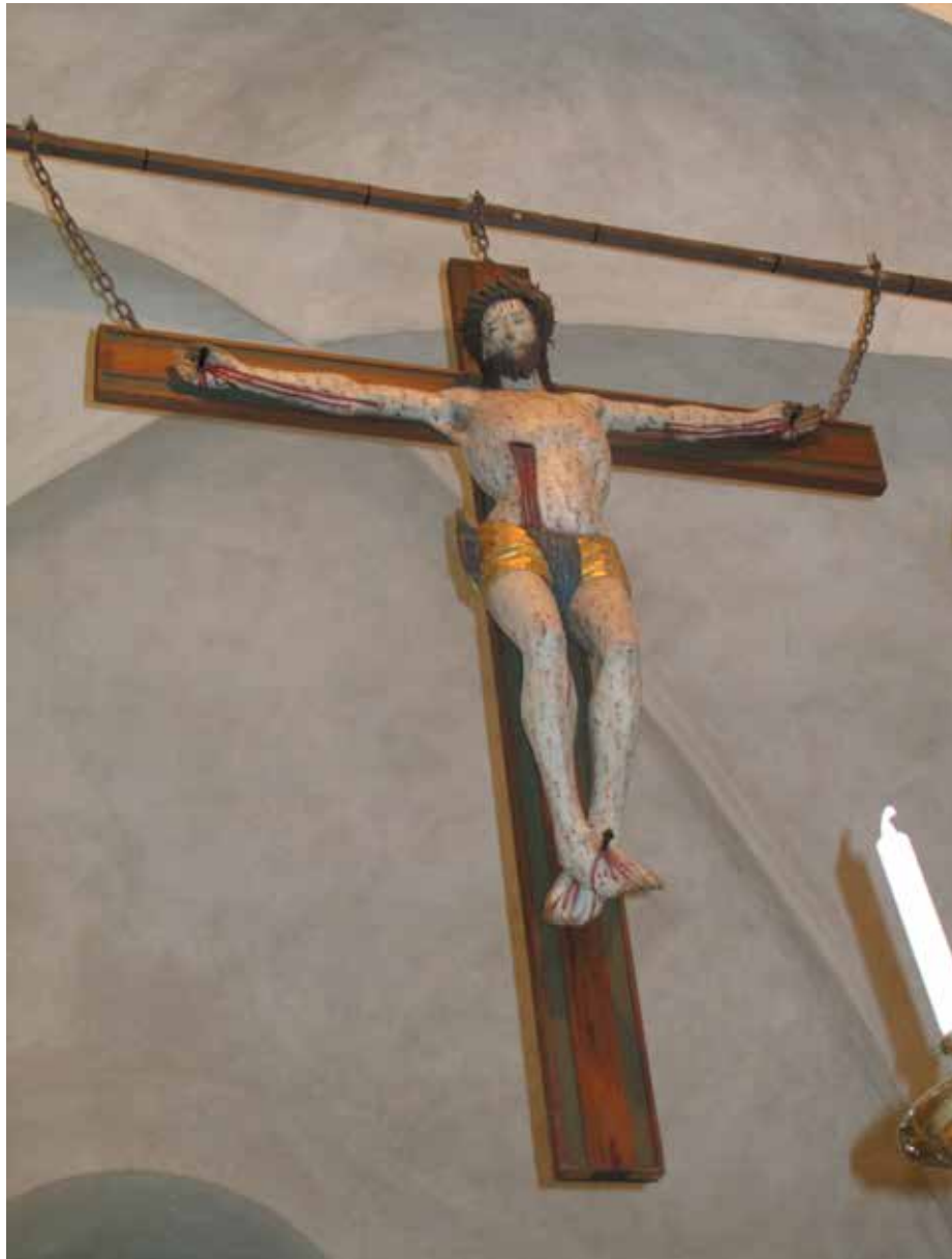
Fig.22. Triumfkrucifixet efter konserveringen. Detaljerna på Kristusfiguren framträdde tydligare från golvet efter åtgärderna. LP_2015_00188.