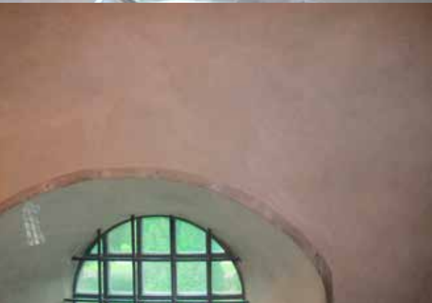
Fig.12. Efter åtgärderna skiftade väggen vackert och putsskadorna var ilagade. LP_2015_00178.