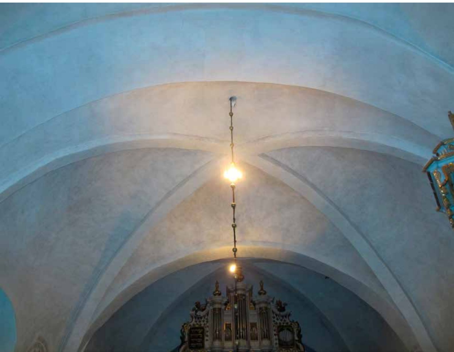
Fig.13. Valven efter konserveringen. LP_2015_00179.