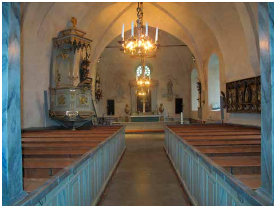
Fig.24. Kyrkorummet sett från väster efter konserveringsåtgärderna, med de slutna bänkkvarteren som flankerar mittgången. LP_2015_00190.

Samtliga ytor våttorkades med vatten med tillsats av en droppe tensid, diskmedel. Spjälkande färg konsoliderades med medium för konsolidering av akrylhartsdispersion i vatten. Färgbortfall retuscherades med akrylfärg som blandades för att uppnå rätt kulör.