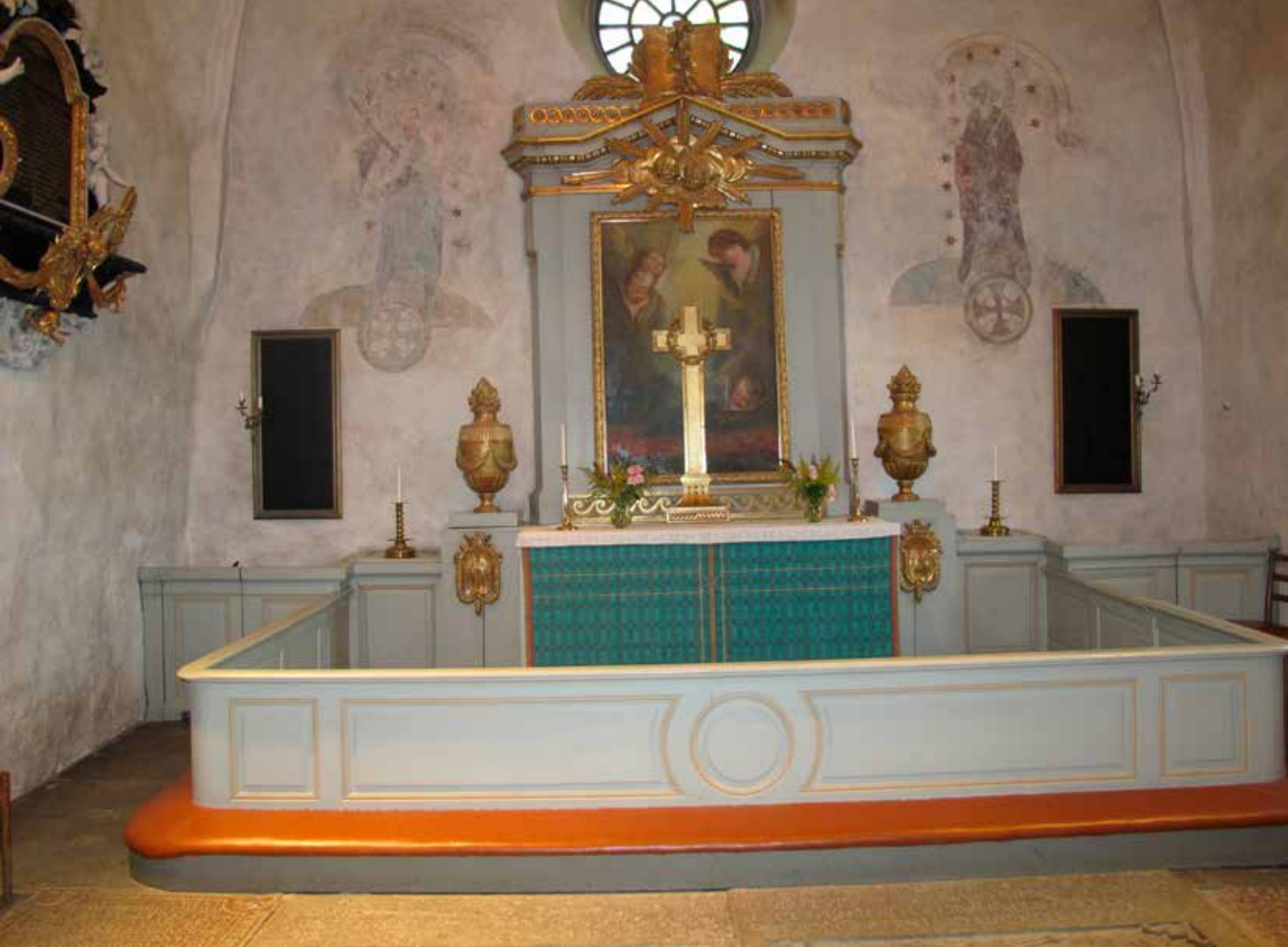
Fig.20. Korskranket och övrig inredning i koret efter konserveringen. LP_2015_00186.