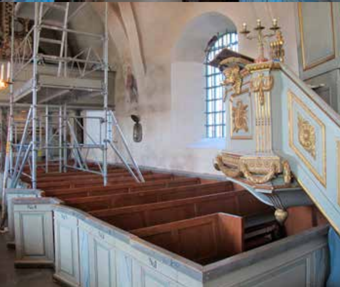
Fig.7. Den norra väggen under pågående konservering. Predikstolens förgyllning, särskilt i spegelramverken, syns här nedsliten före konserveringen. LP_2015_00173.