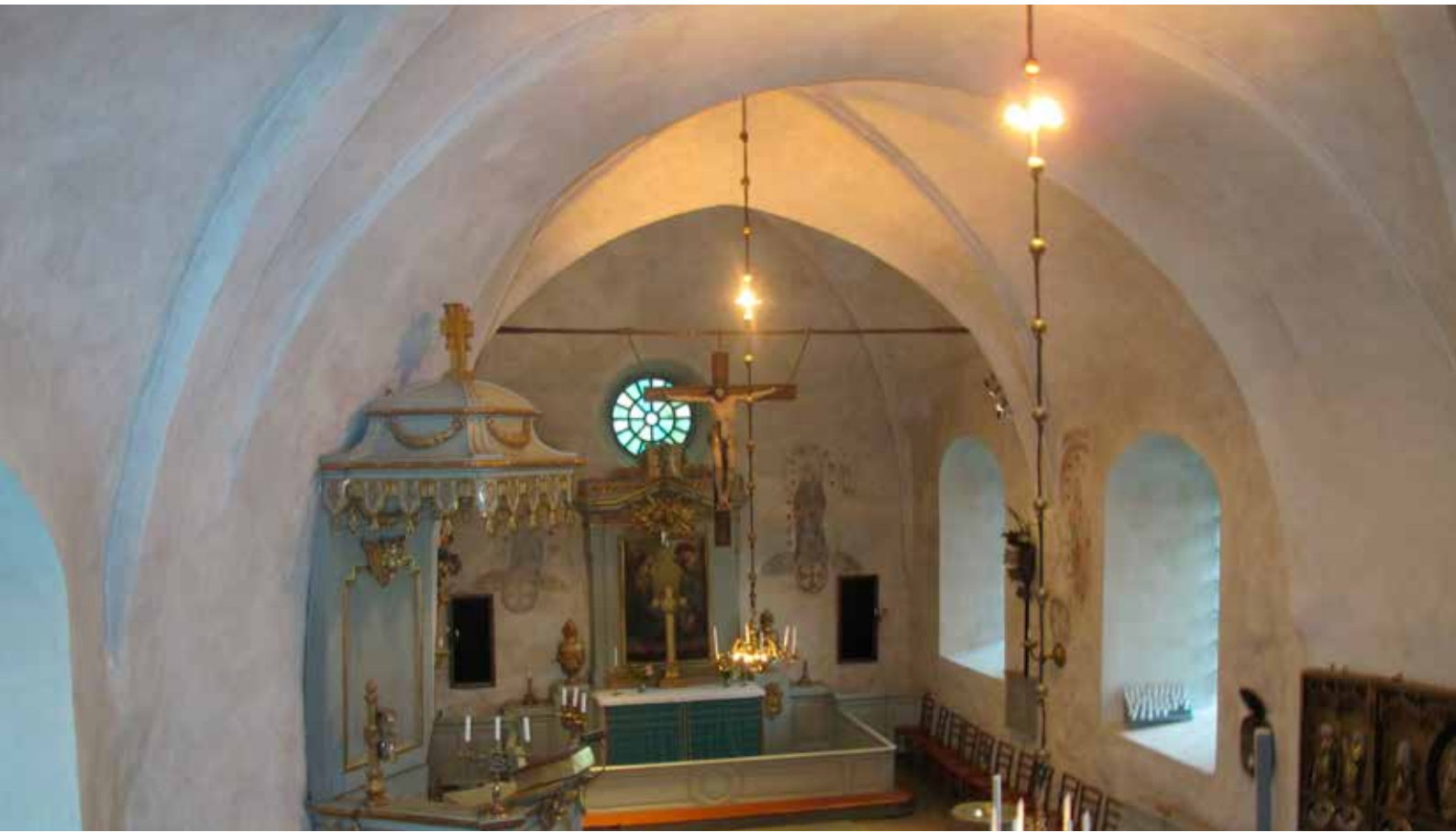
Fig.1. Kyrkorummet efter konservering. LP_2015_00167.