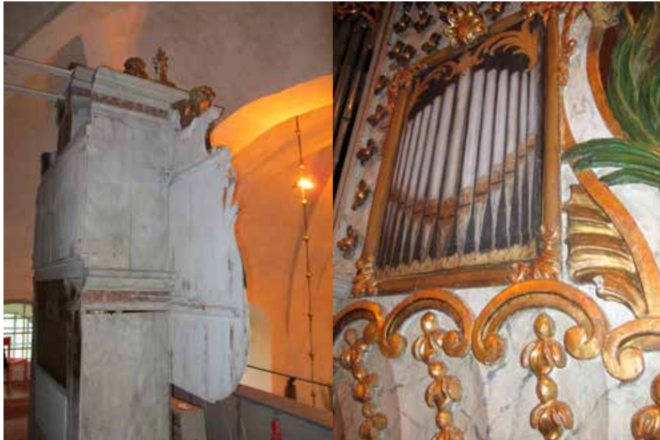
Fig.28. T.v. syns orgelns baksida efter konserveringen, LP_2015_00194.