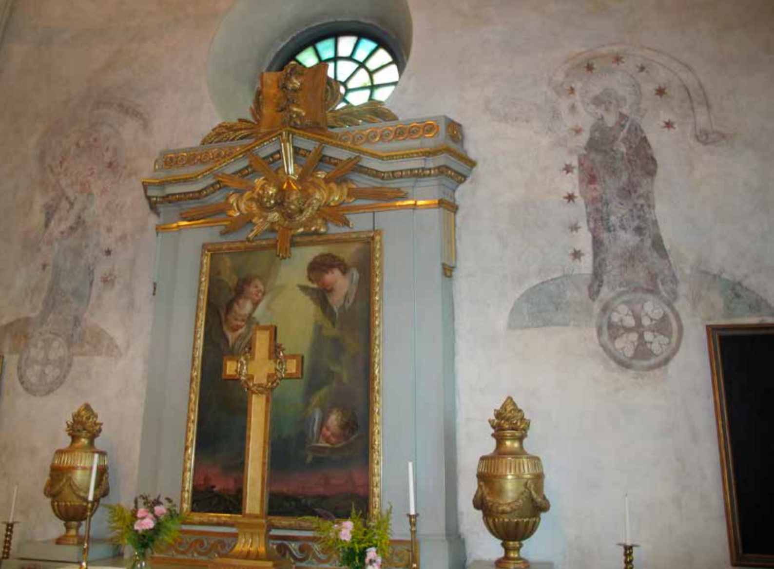
Fig.19. Altaruppsatsen, med tavlan, urnorna och krucifixet konserverade. LP_2015_00185.