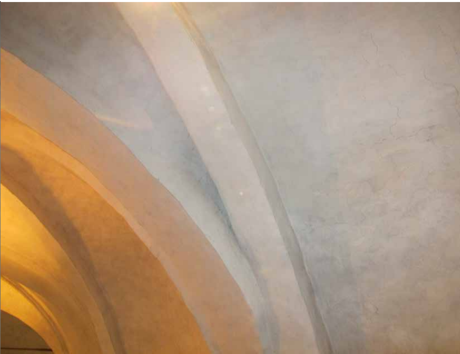
Fig.15. Detalj av valvkappor efter konserveringen. LP_2015_00181.