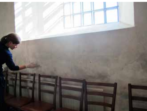
Fig.9. Den södra långhusväggen i koret hade putsskador och omfattande smutsade partier som framträdde tydligt ovanför elementet före åtgärderna. LP_2015_00175.