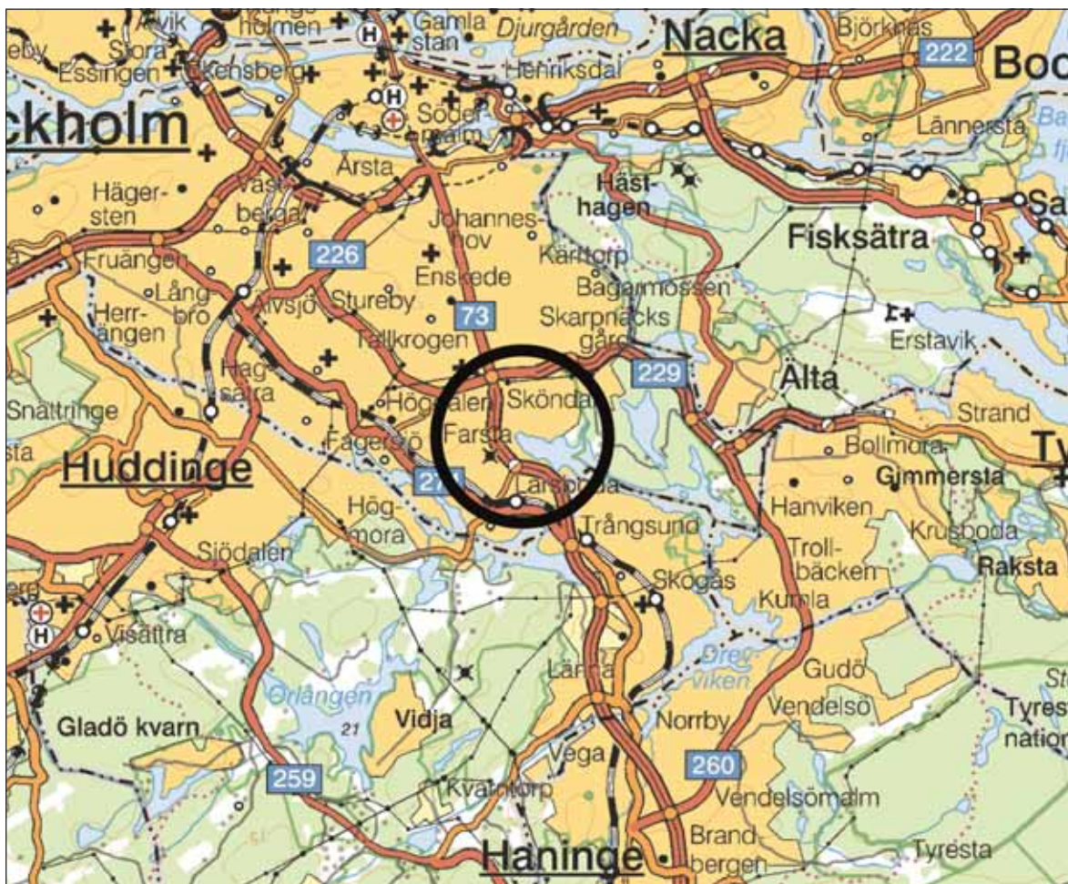
Fig. 1. Läget för utredningsområdet markerat på översiktskarta. Skala 1:200 000.