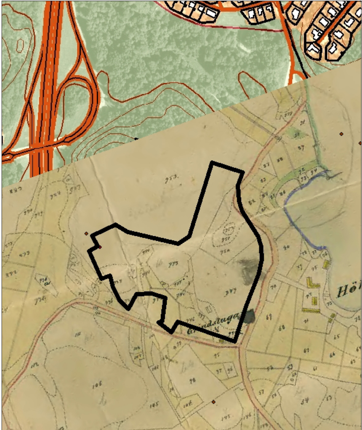
Fig 3. Kartöverlägg med karta från 1874 rektifierad mot dagens fastighetskarta. UO markerat med svart linje.. Skala 1:4000.

Brännkyrka 104:1 är belägen i direkt anslutning till gränsen mot UO. Fornlämningen var i fornminnesregistret (FMIS) inför utredningen registrerad som en rund flack stensättning med en storlek av 5 meter i diameter. Cirka 100 meter syd om UO är registrerad en fornlämningsliknande bildning (stensättningsliknande, RAÄ Brännkyrka 176:1) med den antikvariska bedömningen "övrig kulturhistorisk lämning" (ÖKL). Cirka 300 meter V om UO finns en skadad stensättning (RAÄ Brännkyrka 181:1) samt enligt FMIS svärbedömda terrasseringsar (RAÄ Brännkyrka 181:2, bedömd som ÖKL). Väst om dessa lämningar vidtar det på (huvudsakligen) 1950-talet exploaterade Farsta. Området inventerades förvisso 1929-1930 men det är rimligt att anta att lämningar trots detta kan ha försvunnit i samband med byg-