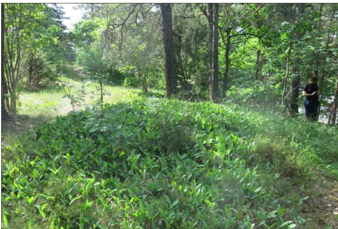
Fig. 4. RAÄ Brännkyrka 104:1 från NV vid inventeringen etapp 1. Till höger i bild syns arkeolog Tina Mathiesen.

Vid inventeringen påträffades flera anläggningar i anslutning till den registrerade stensättningen RAÄ Brännkyrka RAÄ 104:1. Anläggningarna bedömdes preliminärt utgöras av åtta stensättningar (inklusive