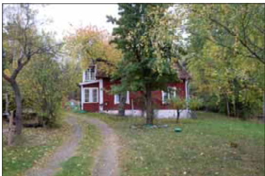
Fig 34. Läderbacka torp

Stora Ursviks gård finns omnämnd sedan 1500-talet och den nuvarande mangårdbyggnaden är från 1873. De timrade gårdsbyggnaderna är rivna.