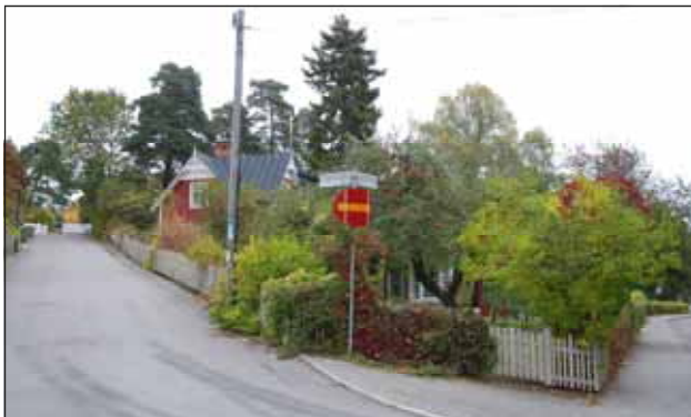
Fig. 19. Korsningen Långlötsvägen-Karlavägen.

Duvbo var ett torp som på 1800-talet utvecklades till en mer betydande egendom, med eget tegelbruk. Efter att tegelbruket lades ned 1895 bytte gården ägare och såldes vidare till AB Hus på Landet , vars