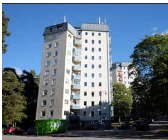
Fig 30. Stjärnhusen.