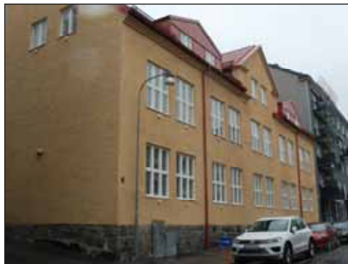
Fig. 11. Före detta industribyggnad vid Vattugatan.