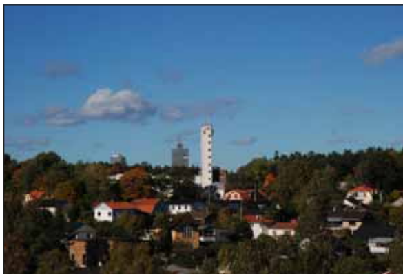
Fig. 33. Hissprovningstornet i Lilla Ursvik.

Lilla Ursviks nuvarande mangårdsbyggnad härrör från 1800-talet. Gården köptes 1894 av uppfinnaren Gustav de Laval som bedrev jordbruk och jordbruksteknisk forskning. 1906 såldes den vidare till skotten Peter Samuel Graham som anlade en hissfabrik på gårdens marker och bland annat lät uppföra det hissprovningstorn som numera är ett viktigt landmärke. Mangårdsbyggnaden blev nu disponentbostad. 1906 lät Graham bygga 14 enhetligt utformade villor på Egnahemsvägen åt fabriken arbetare. Vid en ekonomisk nedgång för företaget började resten av gårdens mark styckas upp och säljas av, och ett villasamhälle växte så småningom fram. Främst kom området att bebyggas med kataloghus från 1940-talet. Hissstillverkningen pågick fram till slutet av 1970-talet. Därefter har en rad olika industrier och verksamheter verkat på platsen. I villaområdet har några nya villor tillkommit bland annat längs med Milstensvägen under 2000-talet.