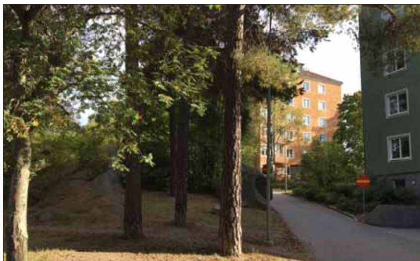
Fig. 13. På norra sidan om Tulegatan finns ett punkthusområde från 1940-talet, anlagt enligt principen "hus i park".

I stadens utkant mot nordost, nedanför Kyrkparken, finns friliggande punkthus från 1960-talet, sju våningar höga mot Götgatan och tio våningar mot Tulegatan. Den höga, fritt placerade bebyggelsen kontrasterar mot rutnätsstaden. På norra sidan Tulegatan följs den stora skalan upp med punkthus i 6-12 våningar från samma tidsperiod. Tillsammans utgör byggnaderna en sammanhållen 1960-talsmiljö. Fasaderna är putsade och färgsatta i blekt grå/grön nyans. I husens bottenvåningar finns verksamhetslokaler och mellan huskropparna en upphöjd torg-