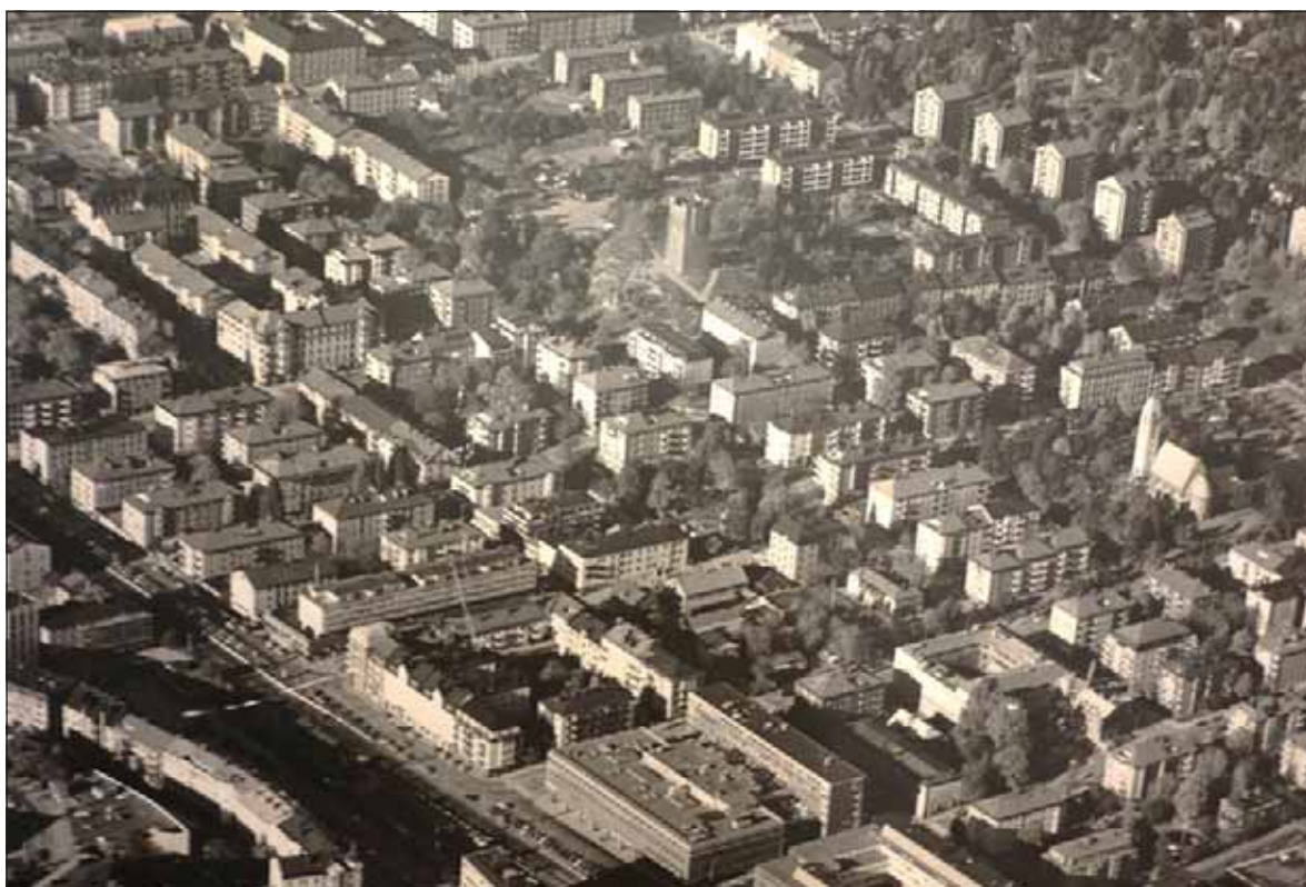
Fig. 5. Flygfoto över Sundbyberg från nordost som visar bebyggelsen norr om järnvägen efter genomförandet av 1942 års stadsplan.

nadsverksamhet. På Sterners förslag infördes lamellhus som genom sitt fristående läge skulle medge mer plats för sol, ljus och grönska.