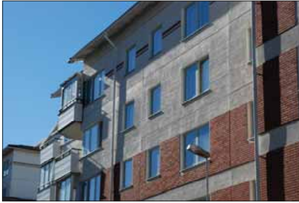
Fig 27. Vikingen.

kommer, för att stärka stadsmässigheten.