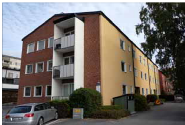
Fig. 24. Välgestaltad efterkrigstidsbebyggelse.

Ny bebyggelse har på senare år uppförts i stadsdelen, särskilt i de västra delarna.