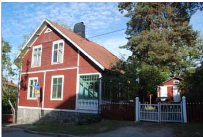
Fig. 25. En av de bevarade trävillorna.

Lilla Alby präglas idag av efterkrigstidens flerbostadsbebyggelse bestående av lamellhus och punkthus från 1940, -50 och -60- och 70-talen. Flera av husen är arkitektoniskt intressanta och välbevarade med utmärkande detaljer och material i portar och sockelvåningar. Av områdets tidiga historia finns Lilla Alby gård kvar med mangårdsbyggnad från 1833. Två välbevarade trävillor finns bevarade på Otterstavägen. Intressant är även den välgestaltade missionskyrkan med omgivande trädgård samt två barnrikehus på Humblegatan. Längs med Bällstaån ligger Sundbybergs f.d. elverk från tidigt 1900-tal - en välbevarad industribyggnad i tegel och puts.