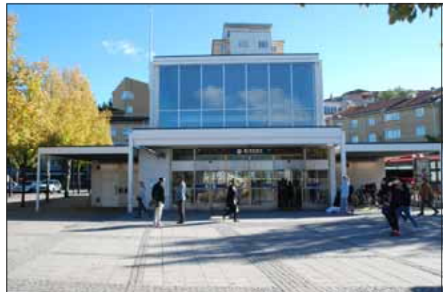
Fig. 28. Torgplatsen i Rissne centrum.

Rissne centrum är anlagt på låglänt f d åkermark mittemellan de fyra bostadsområdena. Den öppna ytan är uppdelad i östra sidans hårdgjorda torgplats och västra sidans grönområde. Från torgets markbeläggning, ett rutnät av smågatsten och betongplattor, strålar gångvägar ut på den solfjädersformade gräsytan. Som centrumbyggnad tjänar ett butikshus med åttakantig planform, inspirerad av kinesisk tempelarkitektur. Intill ligger en mer modernistisk tunnelbanebyggnad, med ljusa, uppglasade fasader och skarpa geometriska former. I norr avgränsas centrum av tre bevarade kasernbyggnader, från 1940-45, som har tegelmurade, slammade fasader och tegeltäckta sadeltak. Utmed torgets södra sida passerar Kavallerivägen, vars angränsande tegelhus har blandat innehåll – affärslokaler, kontor och bostäder.