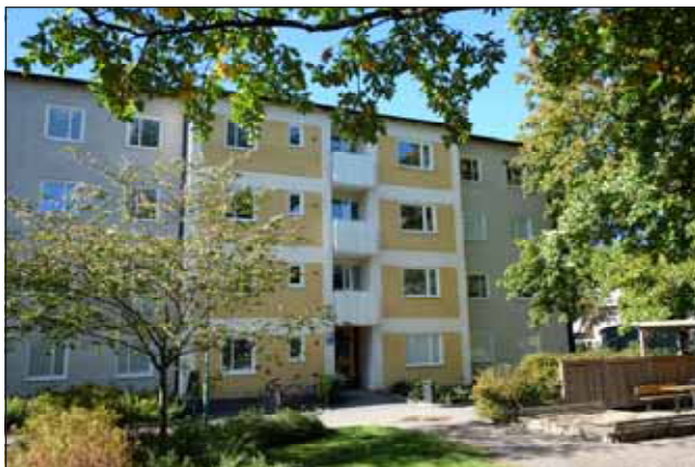
Fig 29. Putsfasader i jordfärger och dova pasteller dominerar.

Det långsmala villakvarteret i sydväst innehåller blandad bebyggelse från 1900-talet varav ett antal villor är välbevarade exempel från sina respektive tidsperioder.