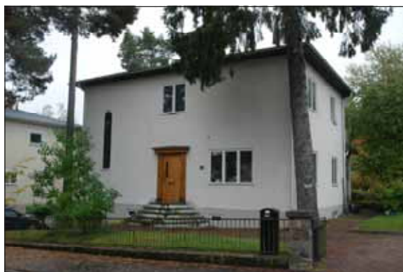
Fig 32. Välbevarad villa på Furuvägen.