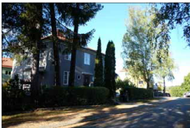
Fig. 23. Området har ett svängt gatunät och stort inslag av grönska.

Representativa villor för industriernas högre tjänstemän uppfördes på områdets södra sluttningar i början av 1900-talet. I kvarteret Enen uppfördes vid samma tid ett flerbostadshus i jugendstil längs med Järnvägsgatan. Halva kvarteret kom att bebyggas med sluten kvartersbebyggelse medan andra halvan bebyggdes med villor enligt den stadsplan som fastslogs 1925 och där Hästhagen reserverades för villa-bebyggelse utmed ett slingrande gatunät, underordnat naturliga terrängförhållanden. Området var i princip fullbebyggt vid slutet av 1920- och början av 1930-talet. Då stadsplanebestämmelserna inte varit