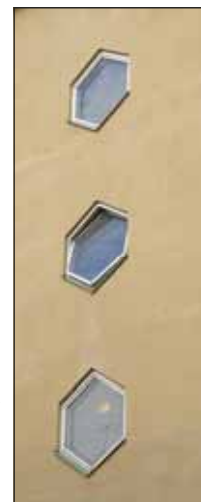
Fig. 6. I Sundbyberg finns gott om sexkantiga fönster. Därför har en hexagon valts som grafiskt element i stadens officiella logotyp.

Sundbybergs bebyggelse hade vid det laget redan blivit modern och storskalig.