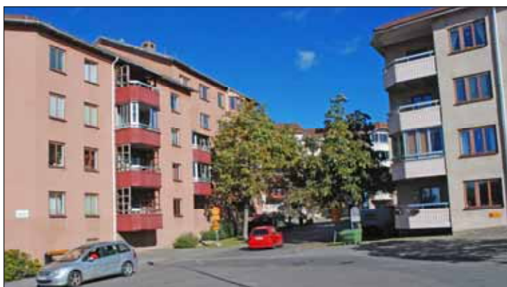
Fig 26. Skvadronen.

Sedan de sista militära förbanden lämnat Rissne fastställdes snabbt en stadsplan 1980, byggstart följde och 1982 flyttade de första hyresgästerna in. Bostadskvarter och tillhörande centrum utbyggdes etappvis fram till 1987. I norra Rissne tillkom därefter ett industrikvarter och 1992 färdigställde SEB: s huvudkontor vid Ulvsundavägen.