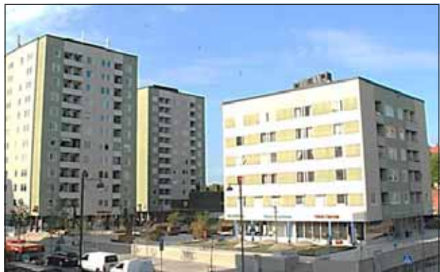
Fig. 12. Punkthusen vid Tuletorget uppfördes på 1960-talet.