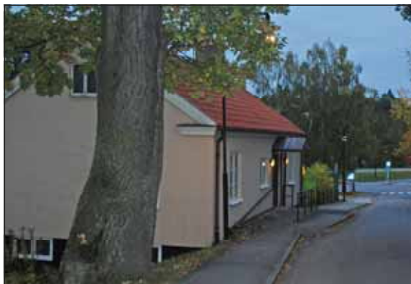
Fig. 21. Ekbackens grindstuga.

Ekbackens sjukhusområde ligger på en höjd, vars slanter tjänat som betesmarker. Idag har området antagit en mer parkliknande karaktär, fast ekar och tallar från betesmarkernas tid växer kvar. Bebyggelsemiljön har Kvardröjande drag av sanatorium.