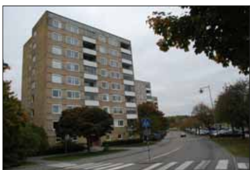
Fig. 38. Punkthus vid Örsvängen.

Områdets centrumbyggnad ligger i suterräng, med en våning västerut mot en platsbildning och två våningar söderut/österut. Fasaderna är klädda med stående lättbetongplank med ytballast av marmorkross. Planken indelas med vertikala band av bruna Höganäsklinker.