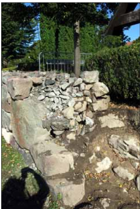
Fig. 3. Den äldre murens kärna.