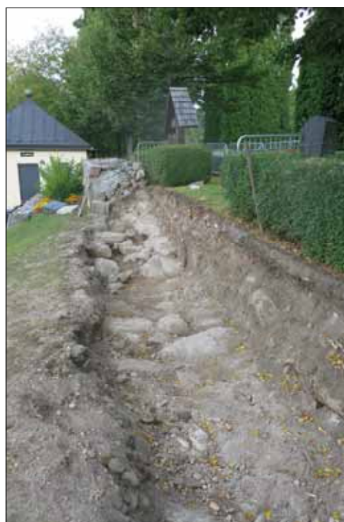
Fig. 5. Basen av ett borttaget murparti.