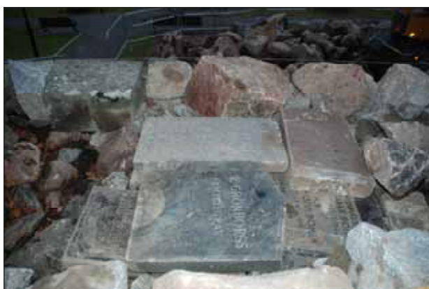
Fig. 4. Totalt åtta stycken yngre gravstenar lades in i den omlagda muren.

Inga fynd äldre än 1850 framkom. Två yngre gravstenar från tiden kring 1900 framkom och beslut togs under arbetet att återinföra dem i muren. Dessutom tillfogades sex stycken yngre gravstenar som under senare år borttagits från kyrkogården sedan gravrätten återgått.