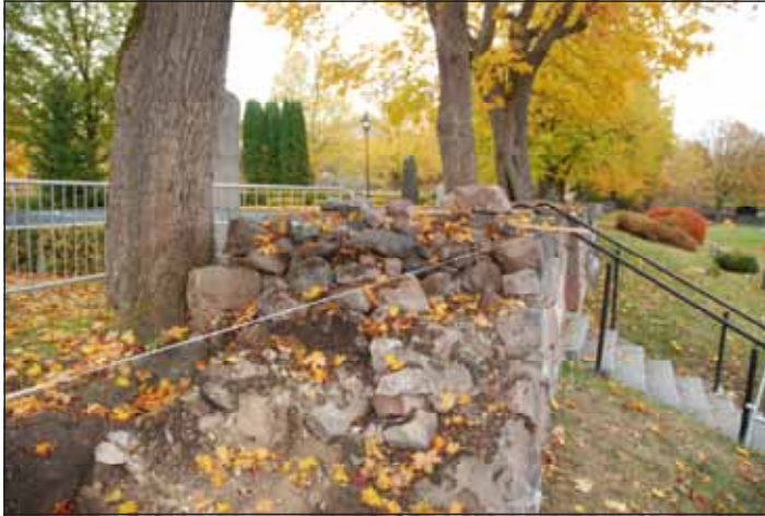
Fig. 3. Sektionsbild av kyrkogårdsmur före omläggning, mot väster 2016-10-19.