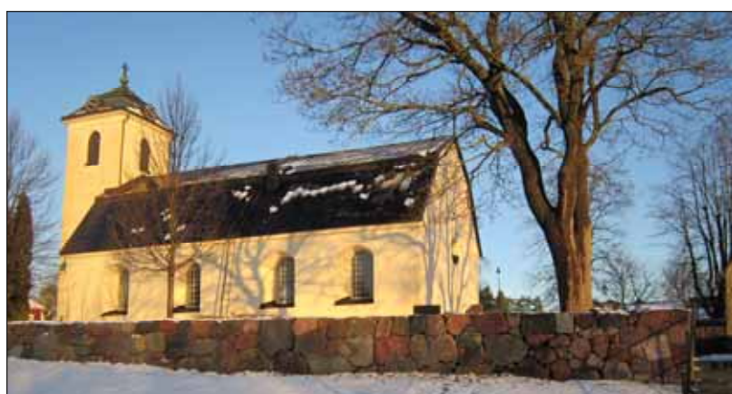
Fig. 13. Kyrkogårdsmuren vid slutbesiktning 2016-12-14.