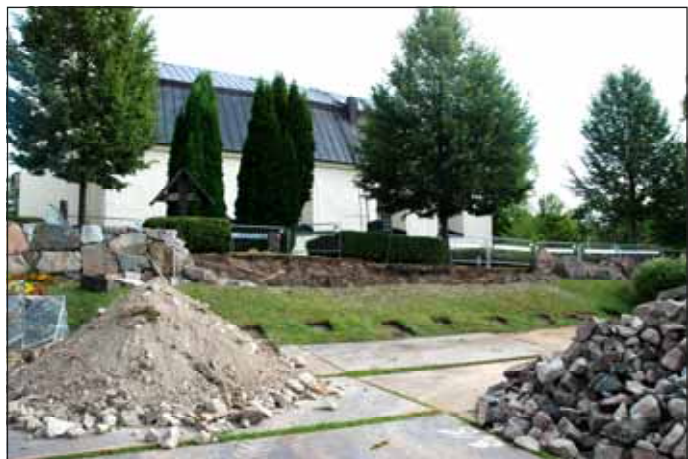
Fig 4. Foto efter byggtidens två första veckor, 2016-08-25.

Den omlagda muren skiljer sig från föregående, genom att vara helt igenom kallmurad. För att få större stabilitet än förut anvisades 20 % bindare i muren, fördelade jämnt över sträckan. I praktiken inleddes detta att bindstenar lades med 5-7 meters mellanrum. Partier som bedömdes