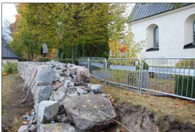
Fig. 12. Sektionsbild av nylagd kyrkogårdsmur, foto mot öster 2016-10-19.

Utlåtande efter slutbesiktning 2016-12-14