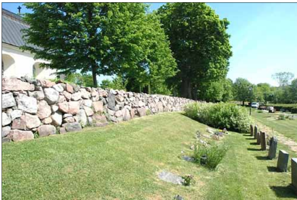
Fresta södra kyrkogårdsmur fotograferades 2016-06-02, vid ett förberedande möte inför årets omläggning.