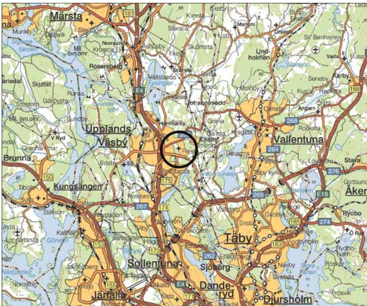
Fig. 1. Läget för Fresta kyrka markerat på översiktskarta. Skala 1:200 000.