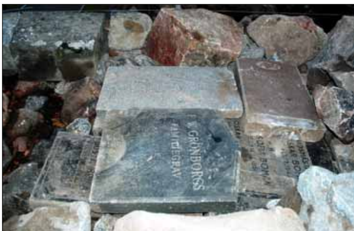
Fig. 11. Åtta gravstenar från utgångna gravrätter lades in i kyrkogårdsmuren 2016-11-22.