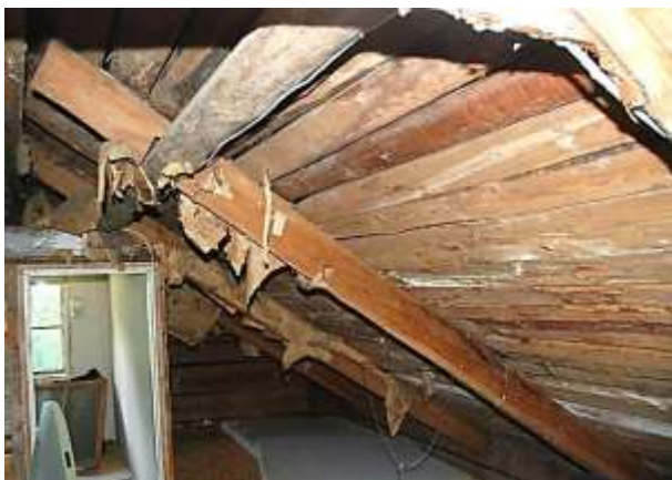
På övre våningens mellersta del ligger takstolarna synligt.

Övre våningens mellersta del är kallvind. Takstolarna är av rundstockar. Underlag för den yttre tegeltäckningen är en horisontell panel av okantade bräder.