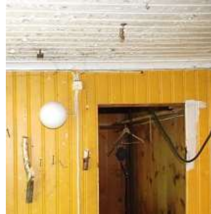
Norra förstugans väggar och tak är klädda med pärlspåntpaneler. Nedan ses arbetarbostadens kök. Fotona togs 2016-07-05

Fönster: Enkla utåtgående, spröjsade i sex rutor vardera, profilerade foder 95 mm. Vitmålade snickerier.