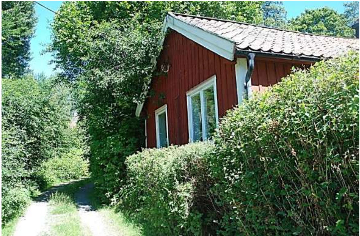
Tätt intill manbyggnadens västra gavel passerar Skvaltkvarnsbacken, tidigare en del av landsvägen som förband Stockholm med Bergslagen. Fotot togs 2016-07-07.