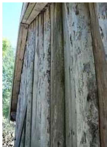
Norra gavelns panel är omålad.

Invändigt har friliggande stolpresning, snedsträvor och omålade lockpaneler. Takstolar av plank ligger också synliga. Golv finns inte utlagt.