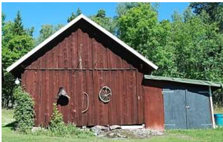
Vagnslidrets södra gavel 2016-07-06