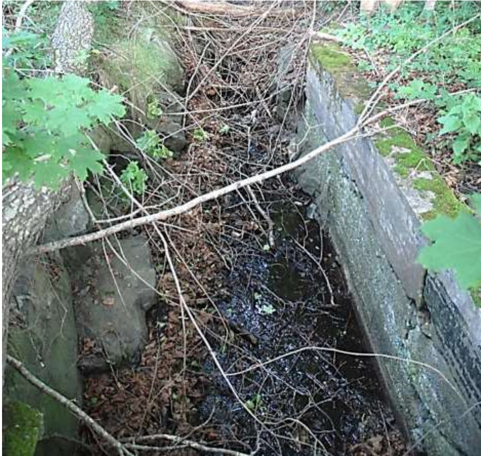
Betonggjuten kanalränna i Aspvik 2016-07-05

Fastigheten Aspvik 1:4 omfattar elva faluröda byggnader, belägna i en sydsluttning med igenvuxna hagmarker och berg i dagen. Tillfart är den slingrande Skvaltkvarnsbacken, en tidigare landsväg som utgår nerifrån Enköpingsvägen. Genom området rinner ett vattendrag, i en grävd och sprängd kanal som numera skymms av grönska. I norr vidtar en barrskogsklädd höjd.