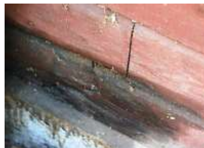
Rötskada i mjölnarbostadens timmerstomme