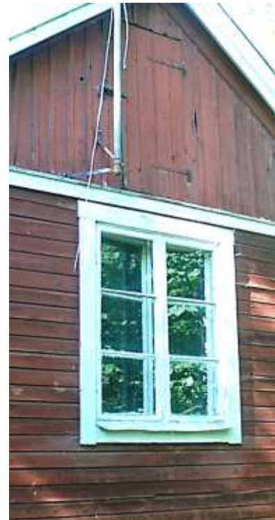
Södra gaveln 2016-07-05

Västra sidans farstukvist har på södra sidan ett fönster indelat med mittpost, med vitmålade snickerier och korrugerade hörnjärn. Fönsterbågarna är enkla och utåtgående, spröjsade i sex rutor av munblåst glas. På västra sidan har farstukvisten ett fönster indelat med två mittposter, med vitmålade snickerier och korrugerade hörnjärn. De tre fönsterbågarna är enkla och utåtgående, spröjsade i sex rutor av munblåst glas.