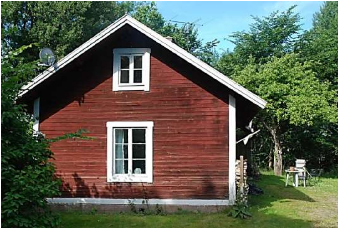
Mjölnarbostadens östra gavel 2016-07-05

Efter att nuvarande hyresgäst tillträdde 1979 genomfördes en upprustning som pågick 1980-85. Bland annat skedde omläggning av yttertaket, vilket medförde att tidigare enkupiga tegelpannor ersattes med tvåkupiga.