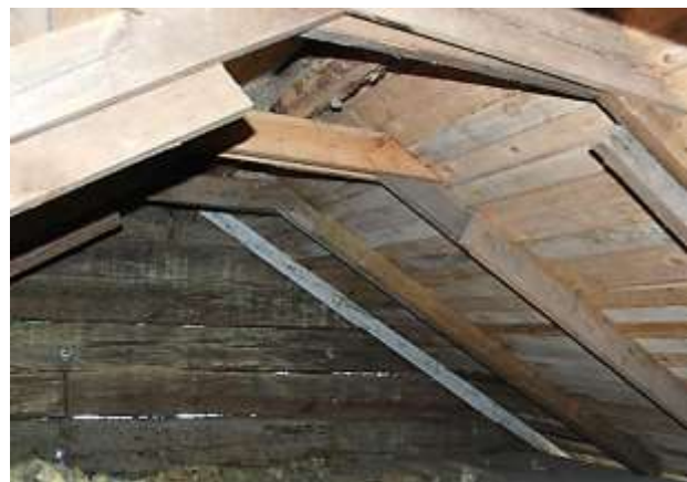
Bilden till vänster visar källarstugans tidigare bostads våning. Bilden ovan visar källarstugans vind. Fotot togs 2016-07-05.