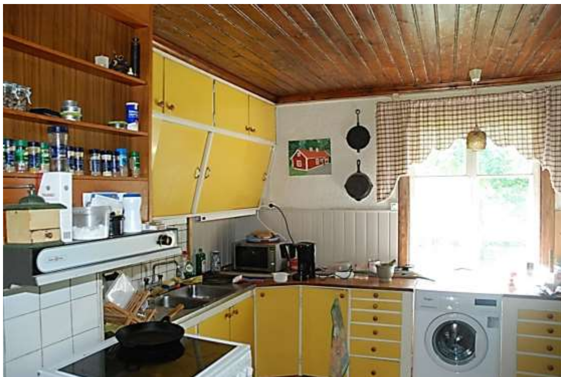
Köket bär spår av moderniseringar vid skilda tillfällen.

Huset var från början disponerat som parstuga, fast den ursprungliga planindelningen har modifierats vid senare ombyggnader. Interiörerna bär avtryck från renoveringar gjorda under senare delen av 1920-talet, på 1950-talet och 1980-85.