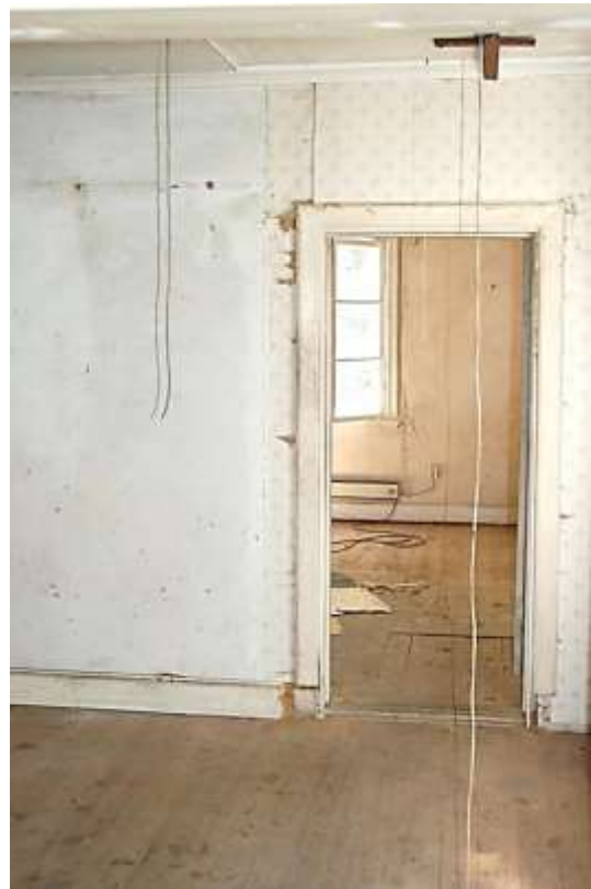
I förgrunden är kammaren och i bakgrunden finrummet. Foto togs 2016-07-05.

Finrummet har dörr mot västra farstun och mot kammaren. Längst till höger ses finrummets kolonnkakelugn med friser i nyrenässansstil. Fotot togs 2016-07-05.