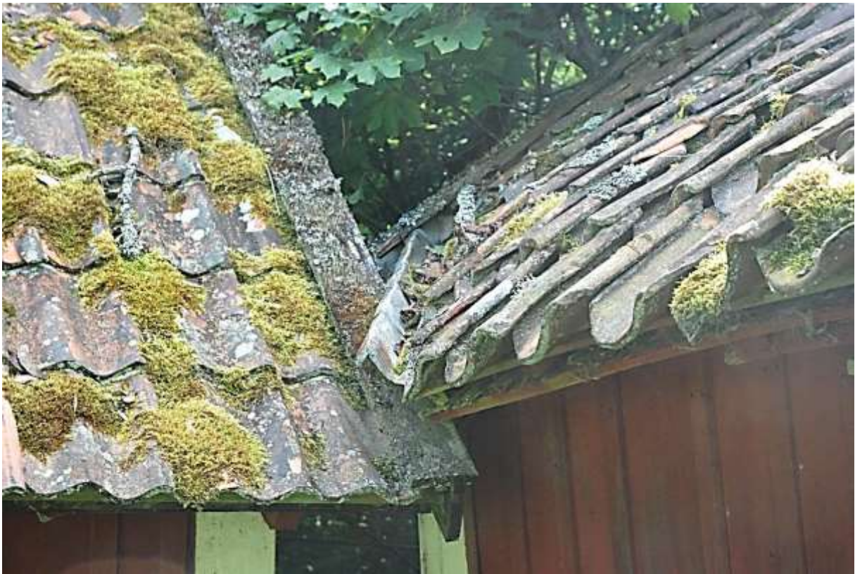
Två bodars yttertak stöter ihop på fastigheten Aspvik 1:4