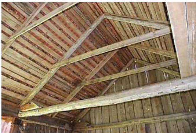
Vagnslidrets takstolar och glespanel.