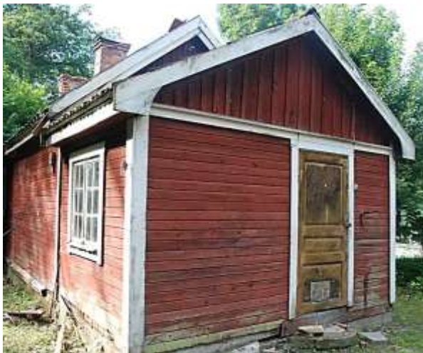
Arbetarbostadens norra farstukvist.

Vid inventering i 2016-07-05 hade fastighetsförvaltaren tillfälligt tagit bort avspärrningarna. Rummen var helt tömda på lösöre.