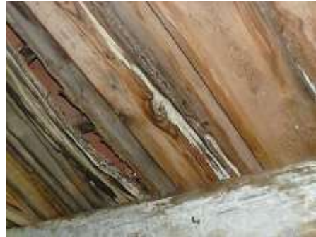
I byggnad 5 har taket rötskadats till följd av långvarigt läckage. Foto 2016-07-06