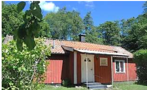
Södra sidan av Kvarntorps gamla manbyggnad 2016-07-07

Manbyggnaden i ett våningsplan ligger på norra sidan om ett gårdstun, bevuxet med buskar och fruktträd. Infarten är grusad. Byggnadstid är troligen första hälften av 1800-talet. Från att ha varit använd som bagarstuga skedde ombyggnad 1929. 3 Då tillkom elektrisk belysning, liksom vatten och avlopp. Nästa stora upprustning skedde i början av 1950-talet. 4 Från denna tid är fasaden, fönstersnickerier och delvis fast inredning. I början av 2000-talet nyinreddes rummen. Numera står huset normalt obebott.