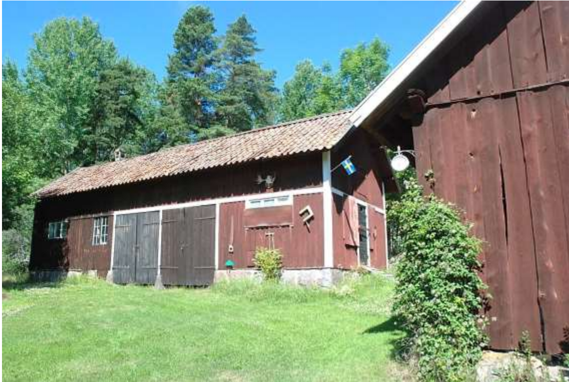
Kvarntorps ladugårdsbacke 2016-07-06