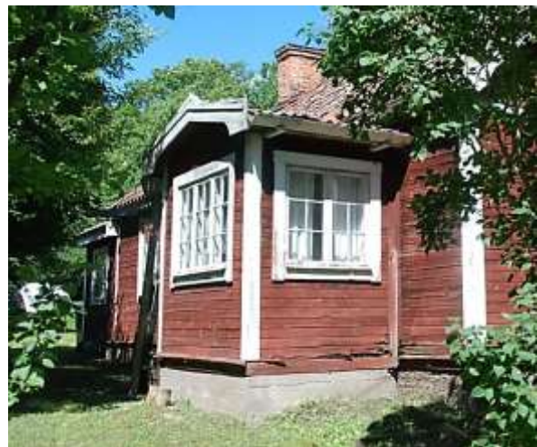
Arbetarbostadens västra långsida med farstukvist.