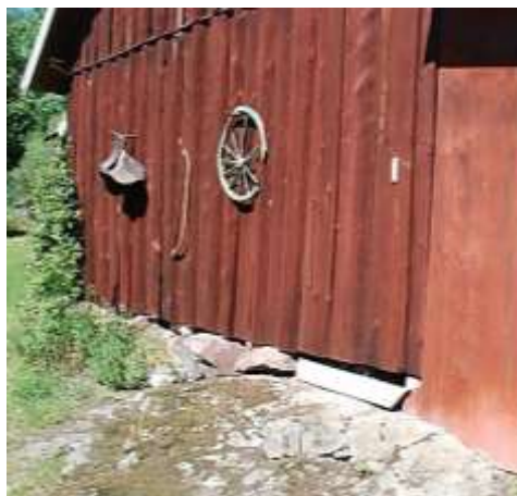
Sydöstra delen vilar direkt på berg.