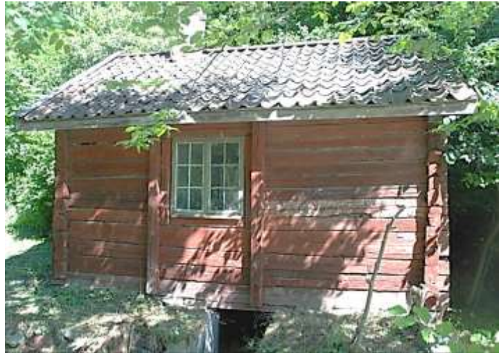
På källarstugans västra sida finns nedgång till smedjan. Fotot togs 2016-07-05.