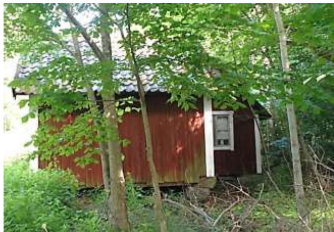
Skogen tättnar kring bodarna 8-9. Fotot togs 2016-07-06.

Vid besiktning sommaren 2016 att de båda bodarna står varaktigt övergivna, i slagskugga därför att omgivande skog alltmer tagit överhanden. För bodarnas fortbestånd krävs i första hand att de närmaste träden avverkas.