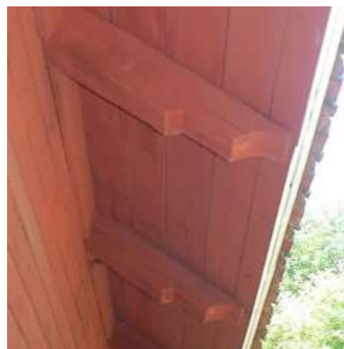
Mjölnarbostaden har en djup takfot som sitt främsta särdrag.