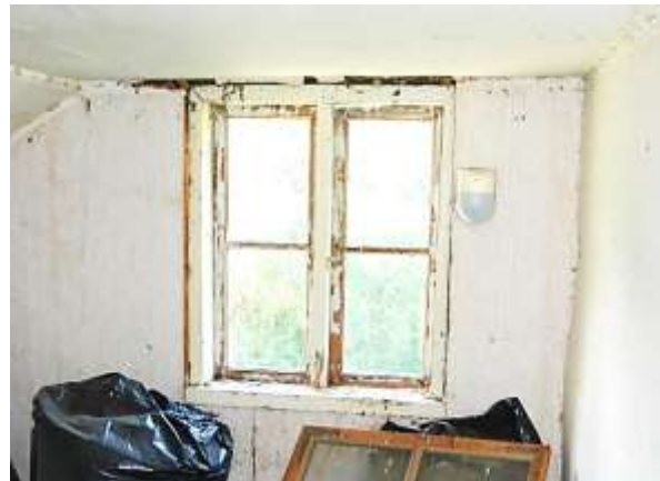
Övre våningens östra gavelrum.