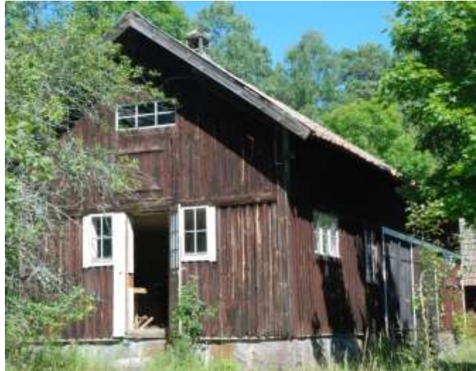
Västra gaveln 2016-07-06

På östra gaveln finns en utåtgående ramverksdörr, klädd med liggande tjärstruken fasspåtpanel.