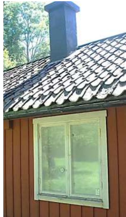
Del av manbyggnadens norra sida 2016-07-06

Skorsten: En tegelmurad skorsten med krön av betong är dragen genom taknocken. Skorstenen har strukits med asfaltlösning.