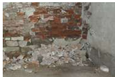
Tegel har rasat från källarmuren.

För att säkerställa byggnadens fortbestånd bedömdes att de närmaste 20 åren krävs reparationer till en beräknad kostnad av 350 000 kr.