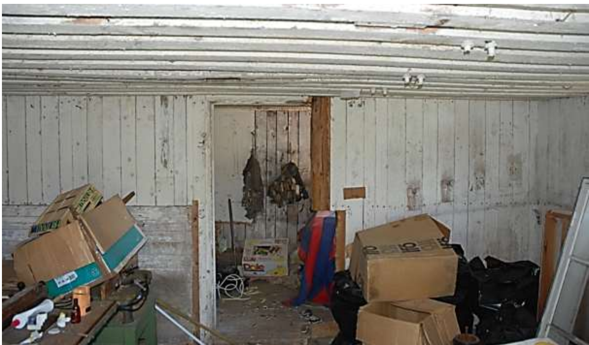
Nedervåningens två rum i östra delen

Västra delens nedre plan har två rum inredda med skurgolv, samt tak och väggar av vitlimmade paneler. I västra delens övre plan finns omålade paneler och synlig stomme. Östra delens nedre plan har ett rum inrett med skurgolv, väggar av vitlimmade skivor och vitlimmat bjälktak. Mellersta delen har stående omålade paneler och omålat bjälktak.