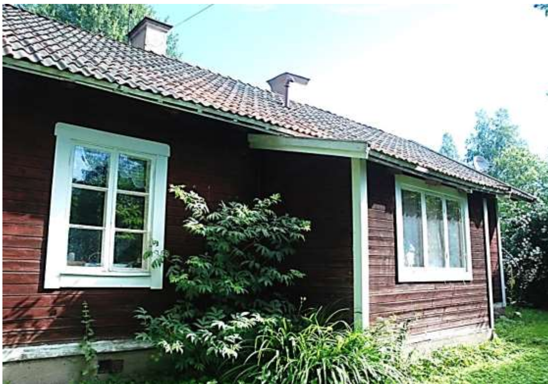
Södra långsidan med veranda som senare helt har införlivats med huset.