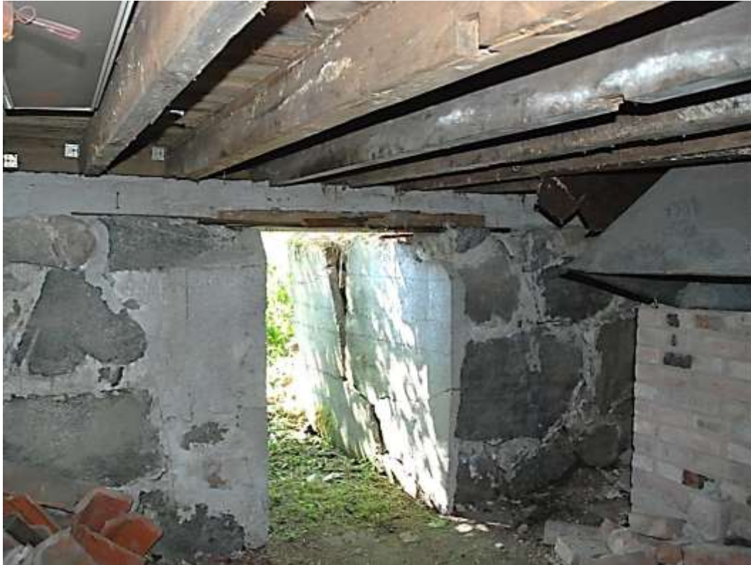
Källaren har mer än metertjocka murar av gråsten. Foto togs 2016-07-05