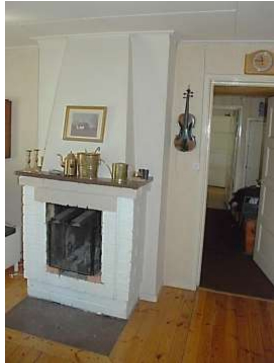
Vardagsrummet har en öppen spis murad av gult tegel, sannolikt från 1950-talet, som senare överstrukits med vit färg.

Eldstad: Öppen spis murad av gult tegel, som överstrukits med vit färg.