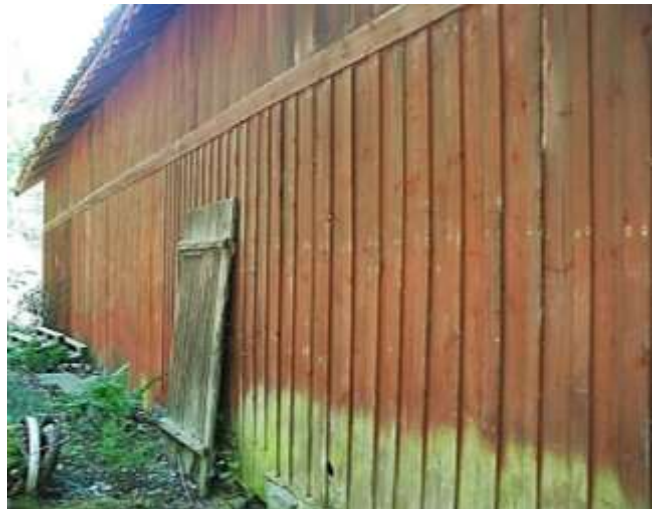
Norra långsidan, vars panelfasad avdelas med en våningslist.

Terrängen sluttar från på östra och södra sidan, där gräsbevuxna ytor vidtar. Gräset klipps regelbundet. Terrängen stiger på norra och västra sidan, där skogsparti vidtar, med ekar, askar, tall och björk.