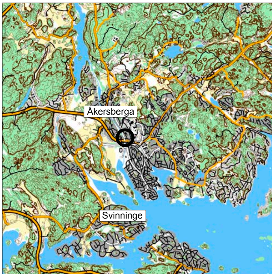
Fig 1. Terrängkartan med markerat område för nu aktuell förundersökning, skala 1:100 000.