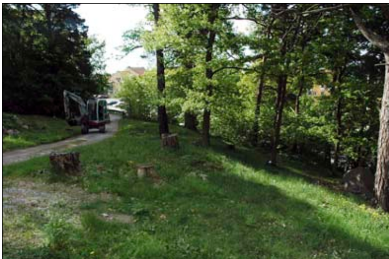
Fig 3. Gravfältet från väster, foto Å Berger bildnr lp20100132.

Syftet med förundersökningen var att avgränsa gravfältet mot väster. Sökschakt grävdes med utgångspunkt från de i ytan synliga anläggningarna. Schakten rensades för hand för att eventuella tidigare okända anläggningar skulle kunna konstateras. De synliga anläggningarna och de grävda schakten mättes in med totalstation och integrerades i Intrasis. Schakten lades igen efter avslutat arbete.