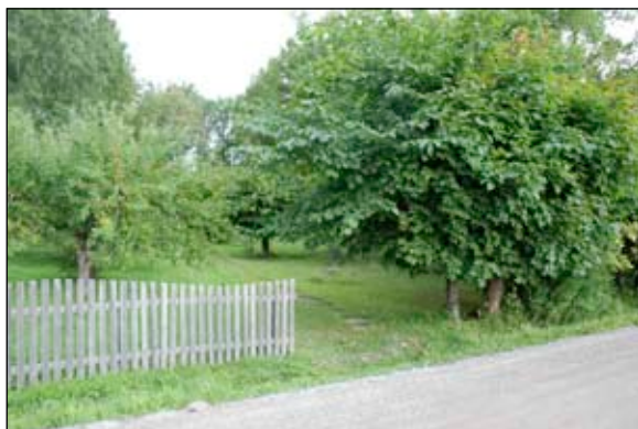
Fig 1. Infart från Baggensvägen, från S. Bildnr: lp20110537.

Utredningsområdet omfattar en ca 2000 m 2 stor ännu obebyggd fritids-/villatomt, Boo 1:254 (se bilaga 1 och 2). Fastigheten är en s.k. skafftomt med en knappt 4 m bred utfart mot Baggensvägen i sydost.