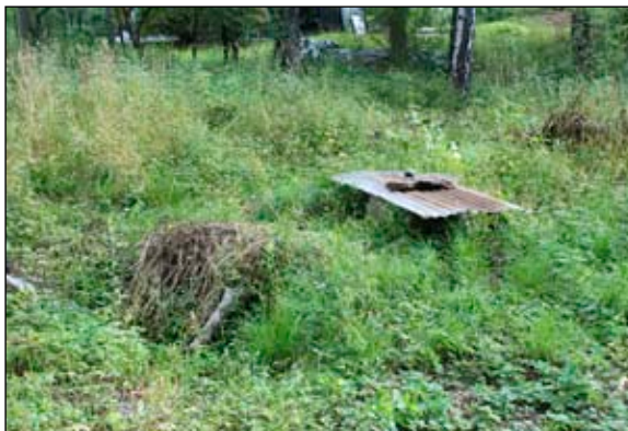
Fig 4. Ett cementrör med provisoriskt lock av plåt. Svale, från V. Bildnr: lp20110542.

Invid den N tomtgränsen, SO om huvudbyggnaden på fastigheten 1:262, påträffades en delvis nedgrävd skräphög. Skräpet kan övervägande dateras till 1900-tal och då troligen den andra halvan.