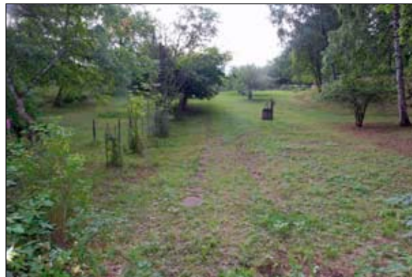
Fig 2. Den endast fyra meter breda uppfarten, från NV Bildnr: lp20110543.