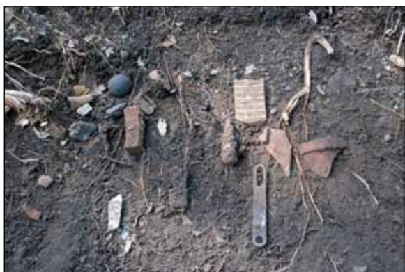
Fig 5. Sentida fynd i schakt E. Bildnr: lp20110544

Invid den N tomtgränsen, SO om huvudbyggnaden på fastigheten 1:262, påträffades en delvis nedgrävd skräphög. Skräpet kan övervägande dateras till 1900-tal och då troligen den andra halvan.