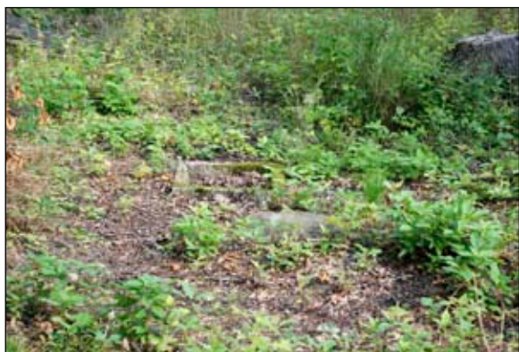
Fig 3. Mitt i bilden anas den cementkvadrat som troligen haft funktion av kallskafteri/ svale, från S. Bildnr: lp2011053741.

Ytan har under någon period varit, om inte bebodd, så åtminstone säsongutnyttjad för förvaring av matvaror (fig. 3 och 4).