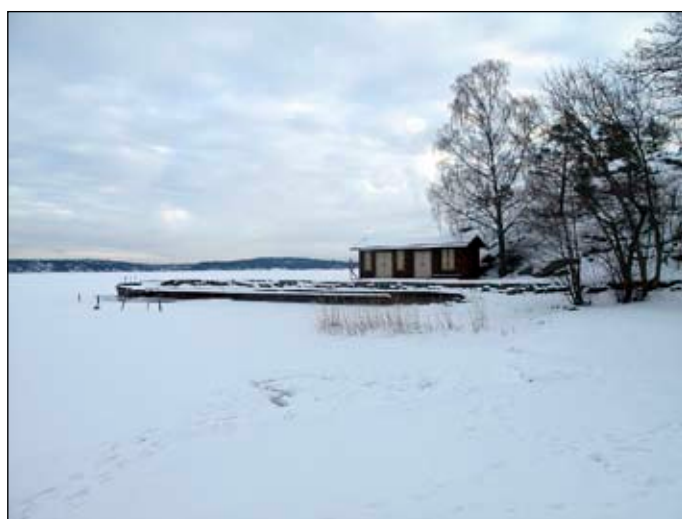
Fig 5. Tyresö 1:815. Brobänkens stenbrygga och sjöbod.