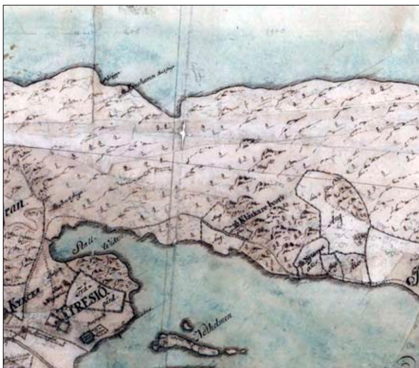
Fig 3. Arealavmätningsskarta från 1752 med Kårshamn utmärkt, Lantmä- teriverket.