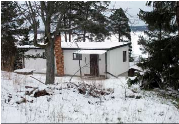
Fig 10. Tyresö 1:107. Ursprunglig sportstuga.