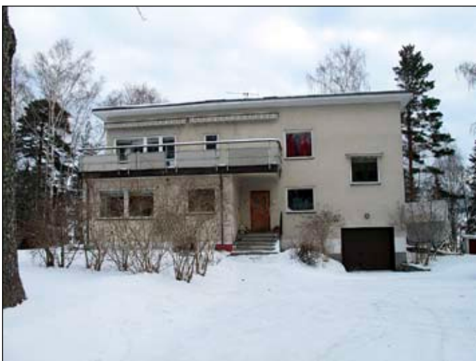
Fig 12. Tyresö 1:429. Putsad villa.