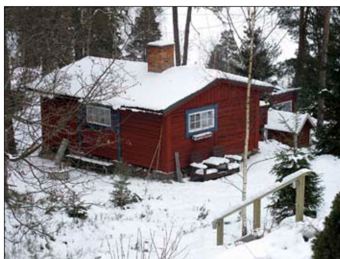
Fig 9. Tyresö 1:249. Ursprunglig timrad sportstuga.