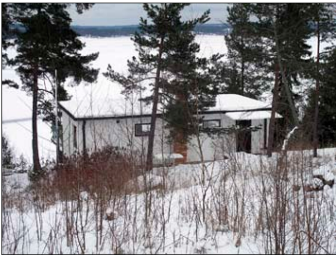
Fig 11. Tyresö 1:107. Ursprunglig sportstuga.