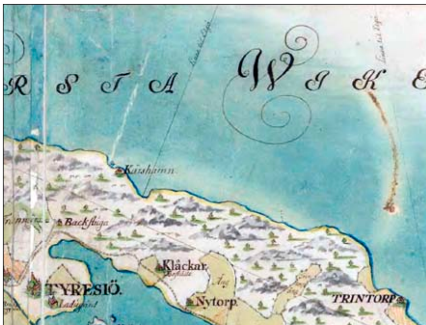
Fig 2. Ägomätningsskarta från 1748 med Kårshamn utmärkt, Lantmäteri- verket.

Området är kraftigt kuperat med lummig växtlighet med inslag av högra träd där barrträden dominerar. Genom området slingrar sig också smala vägar som både följer kustlinjen sträckning samt klättrar över berget i en nord sydlig riktning. Områdets centrala punkt är Bro- bänken med dess stensatta brygga samt sjöbod. Bryggan fungerade under lång tid som huvudbrygga för Tyresö slott.