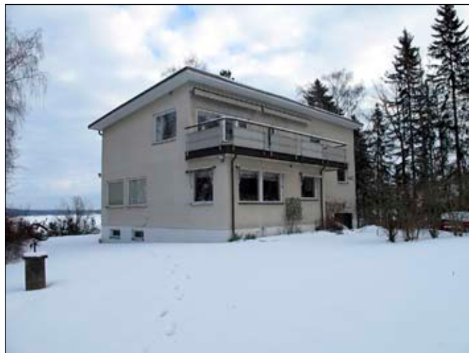
Fig 13. Tyresö 1:429. Putsad villa.

Villa uppförd 1963 efter ritningar av Svenska Teknikhus AB. Villan är traditionellt utformad