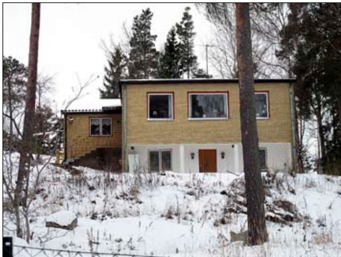
Fig 17. Tyresö 1:121. Villa i gult tegel.

med en t-formad plan. Fasaderna är klädda med rött tegel samt har vissa putsade partier. Sadeltaket är täckt med tvåkupigt betongtegel. Det något indragna entrépartiet är ursprungligt med betongtrappa och rödmålat dekorativt smidesräcke. Entrédörren har rombformat kassettmönster samt rombformad glasruta. Villans fönstersättning är varierad och tidstypisk. Fönsterbandet på entrésidan har bröstning av ligande panel.