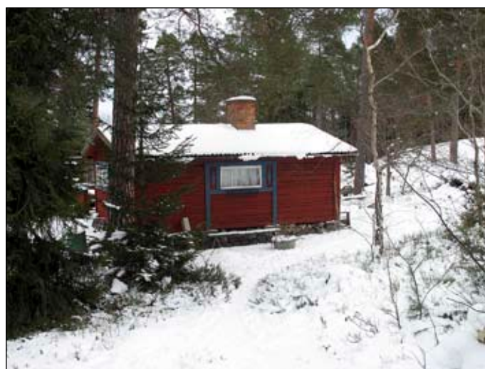
Fig 8. Tyresö 1:249. Ursprunglig timrad sportstuga.

Byggnadens form och detaljutformning med fasad- och takmaterial samt fönster bör skyddas i plan. Underhåll ska utföras med anpassning till byggnadens karaktär och kulturhistoriska värde. Byggnaden bör förses med rivningsförbud.