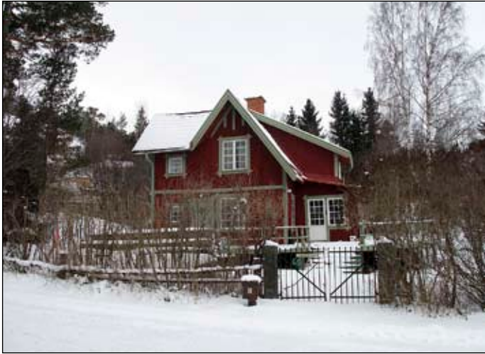
Fig 6. Tyresö 1:830. Sommarnöjet fotat från öster.