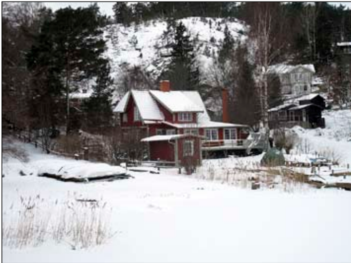
Fig 7. Tyresö 1:830. Sommarnöjet fotat från nordost.