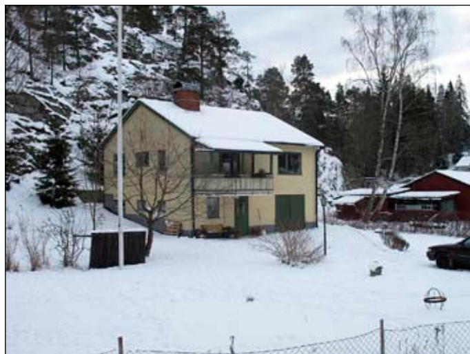
Fig 14. Tyresö 1:70. Putsad villa.