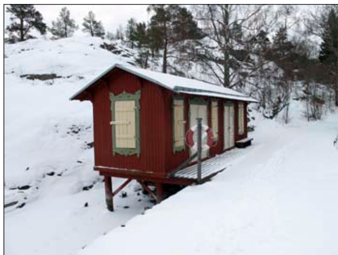
Fig 4. Tyresö 1:815. Sjöboden vid Brobänken.

Sommarnöje uppfört någon gång i början på förra seklet. Byggnaden finns markerad på häradsekonomiska kartan från 1901-1906. Fasaderna är klädda med slamfärgsmålade locklistpanel av olika dimensioner i röd kulör och med grönmålade våningsavskiljande band samt dekorativa fönster- och dörrromfattningar. Även entrédörren är grönmålade i samma kulör, dock är den inte ursprunglig.