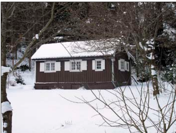
Fig 7. Tyresö 1:444. Ursprunglig sportstuga.

Byggnaden som är placerad precis vid vattnet i anslutning till Brobänken är tillbyggd vid ett flertal tillfällen men ger fortfarande ett ursprungligt intryck som går att avläsa. Flertalet av de vitmålade, småspröjsade fönstren med tillhörande innerfönster på den tidigast uppförda byggnadsdelen är ursprungliga. Sadeltaket med dess olika takfall är täckt med tvåkupigt lertegel. Byggnaden har två oputsade tegelskorstenar. Den västra av dem är placerad i anslutning till en lägre tillbyggnad med oklart användningsområde.