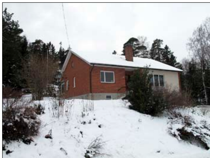
Fig 15. Tyresö 1:122. Villa i rött tegel.