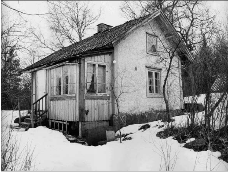
Fig 3. Torpet Långbacken.

fotodokumentation samt undersökning i form av metalldetektering och eventuell schaktning.