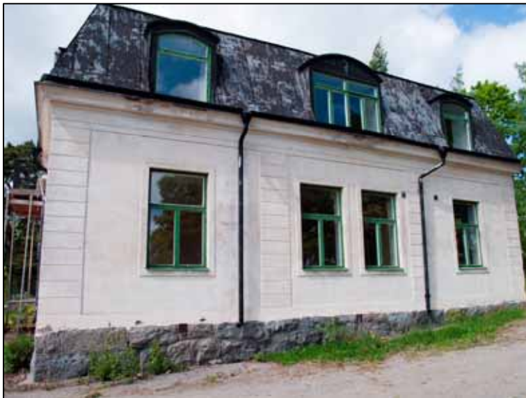
Byggnadens östra fasad som tydligt visar den strama arkitekturen.

Samtliga fönster är grönmålade och ospröjsade. Indelningen med två nedre och en övre luft är tidstypisk och sannolikt ursprunglig. Bågar och glas kan dock ha bytts ut vid någon tidpunkt. Om så är fallet troligtvis runt 1930-40-talet. Bottenvåningens fönster har markerade omfattningar i samma kulör som fasaderna.