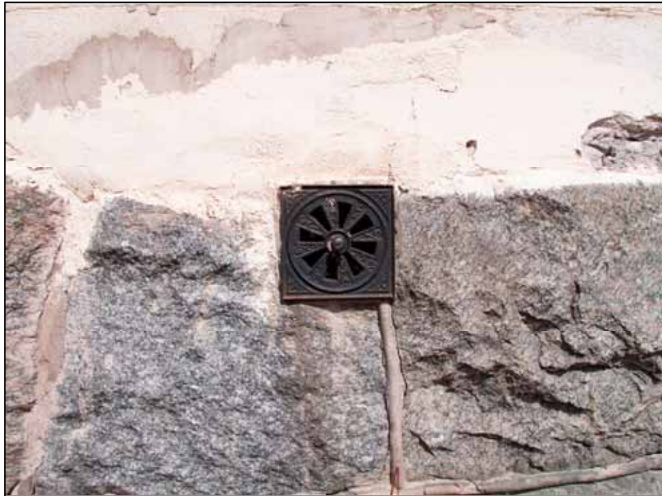
Ursprunglig gjutjärnsventil i sockeln.