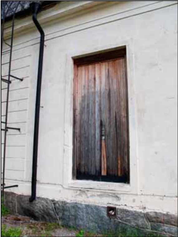
Den senare upptagna entrén på den västra fasaden.