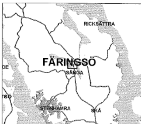
Karta Ekerö kommun 2011.