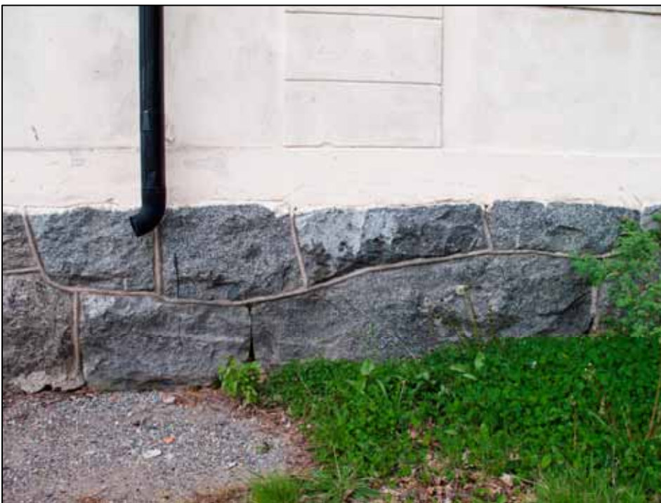
Den fogade naturstenssockeln.