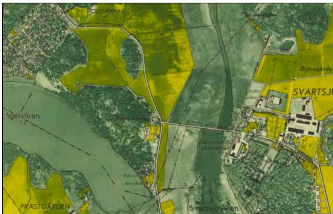
Färingsö fd Alderdomshem och Barnbördshus, utsnitt ur Ekonomiska kartan 1951.