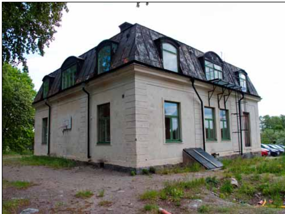
Byggnadens nordvästra hörn.