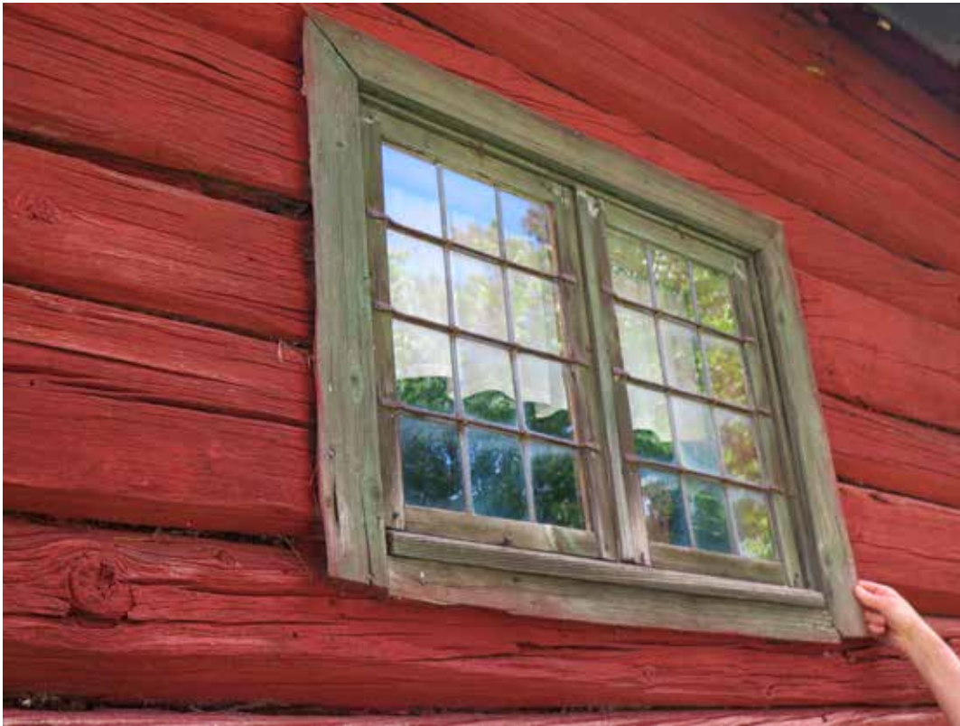
Fig. 12. Väg C1. Fönster. LP_2014_00042.