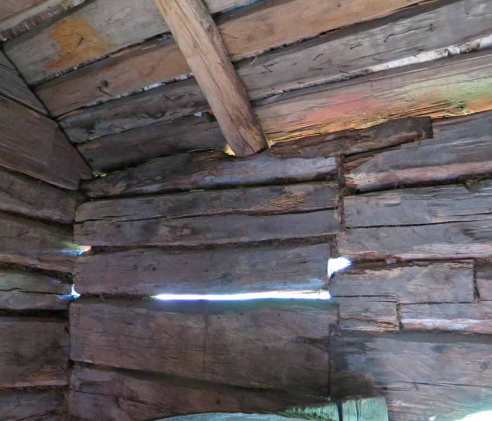
Fig. 19. Vegg A2 inifrån förstugan. Här syns glipor och skarvar i timmerstommen. LP_2014_00073.