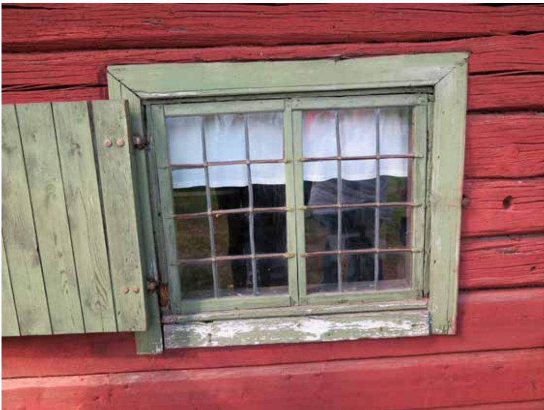
Fig. 8. Vagg A3. Fonster. LP_2014_00040.