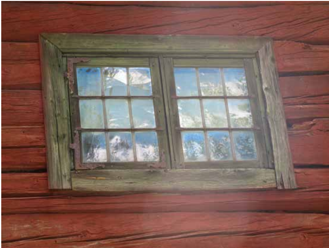
Fig. 13. Vagg C1. Fönster. LP_2014_00042.