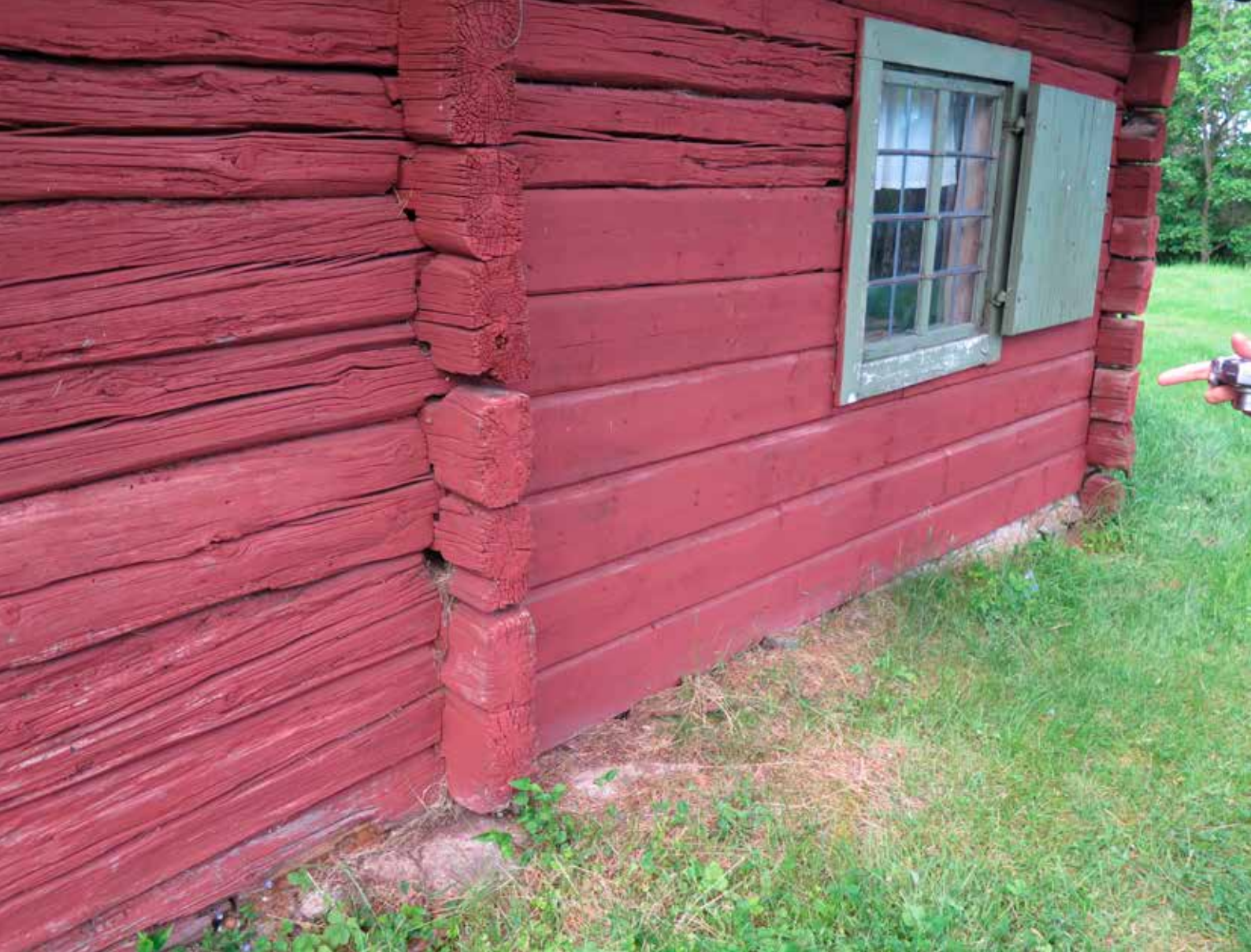
Fig. 4. Vegg A1. LP_2014_00035.