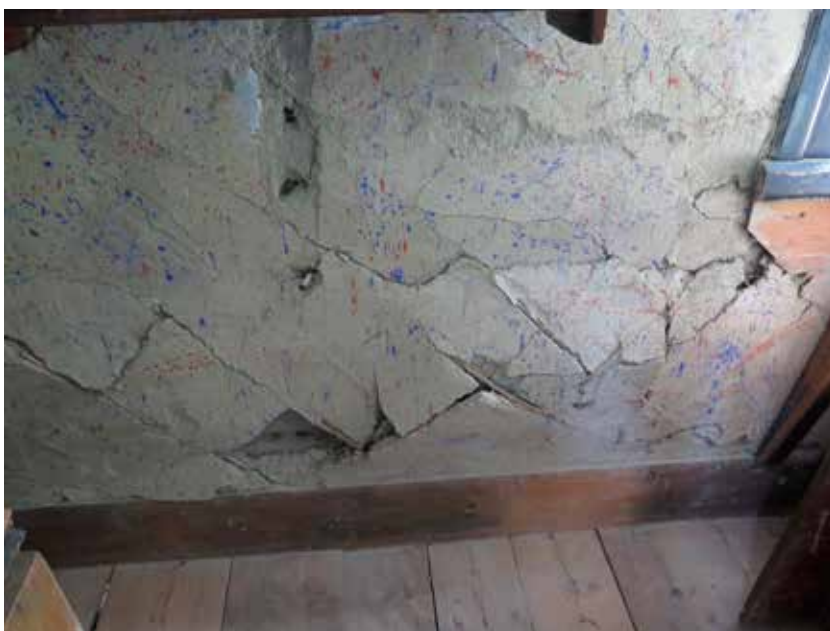
Fig. 17. Övre bilden. Köket. En av takbjälkarna stöds mot skåpet. LP_2014_00049 Fig. 18. Nedre bilden. Kök med spis. LP_2014_00047.