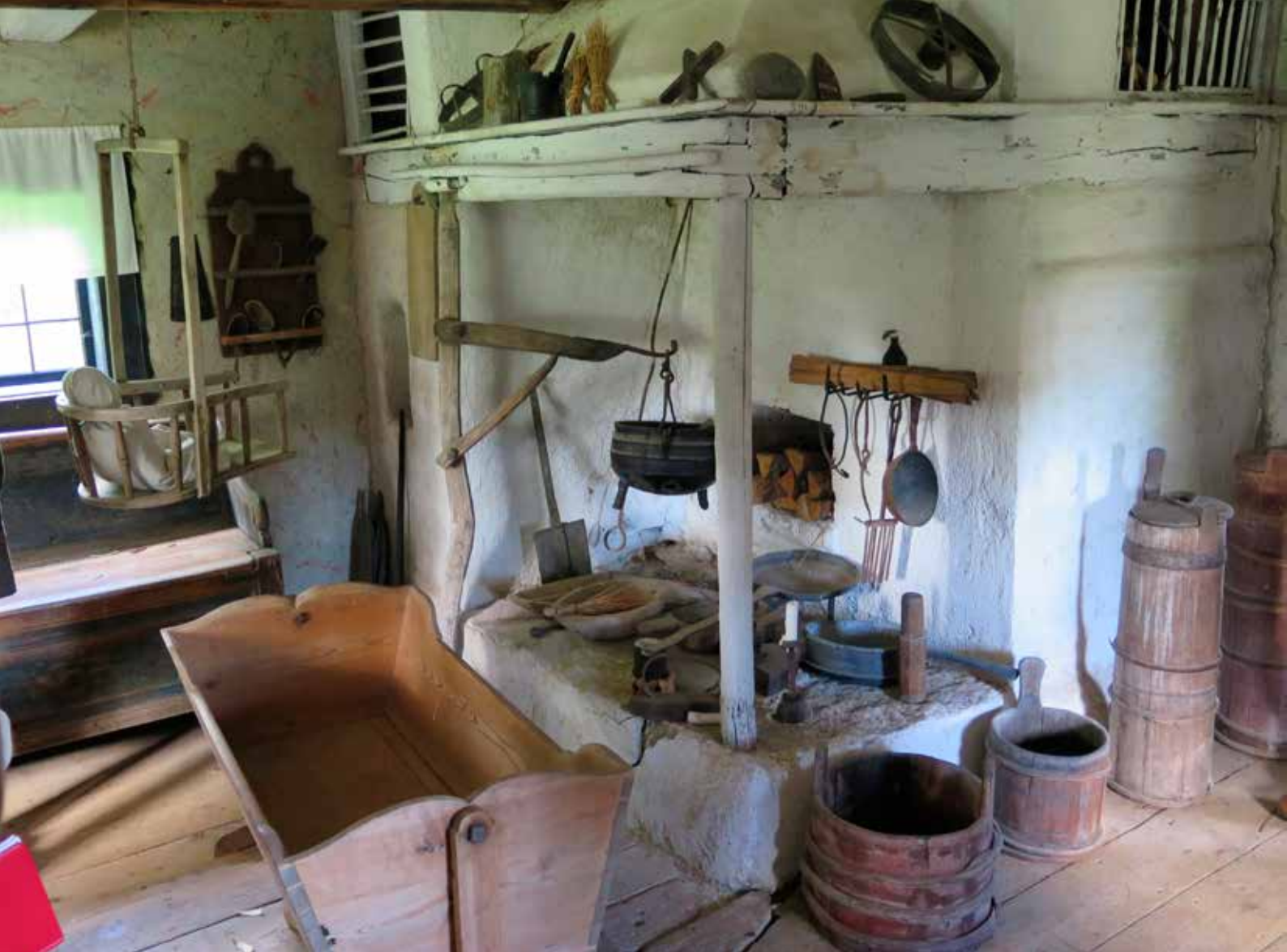
Fig. 16. Kökets väggar är lerklinade. Sprickor och bortfall förekommer. LP_2014_00048.