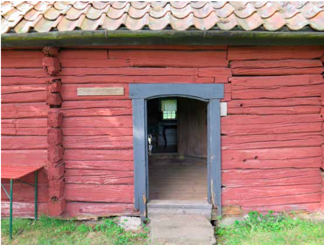
Fig. 5. Vegg A2. Entré. LP_2014_00036.