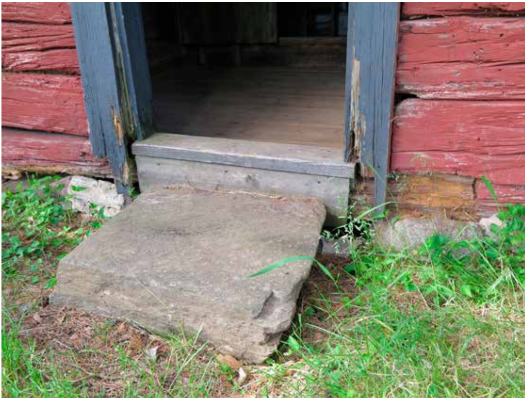
Fig. 6. Vegg A2. Skador på dörrfoder och syllstock. LP_2014_00037.