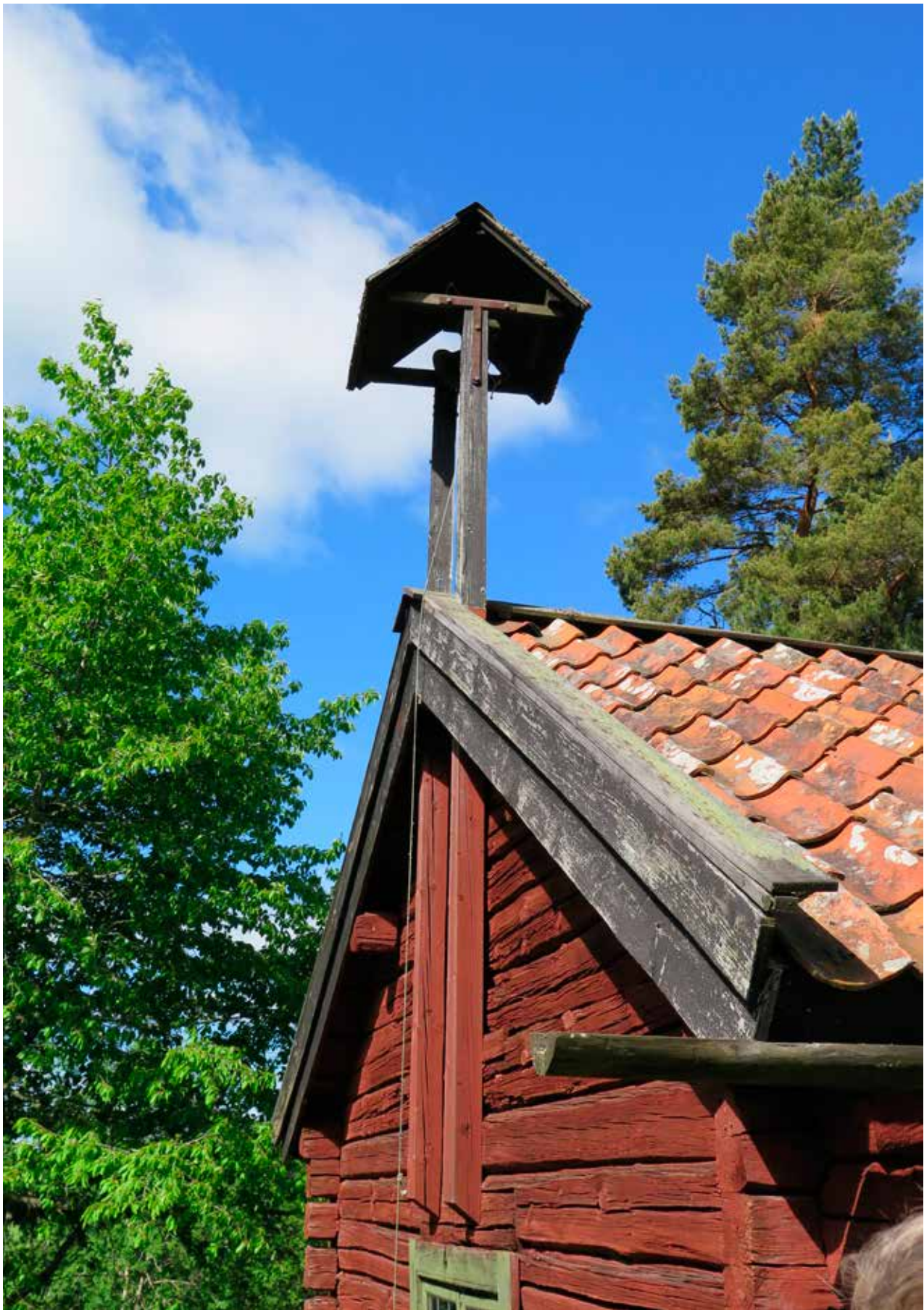
Fig. 9. Del av vägg B. LP_2014_00058.