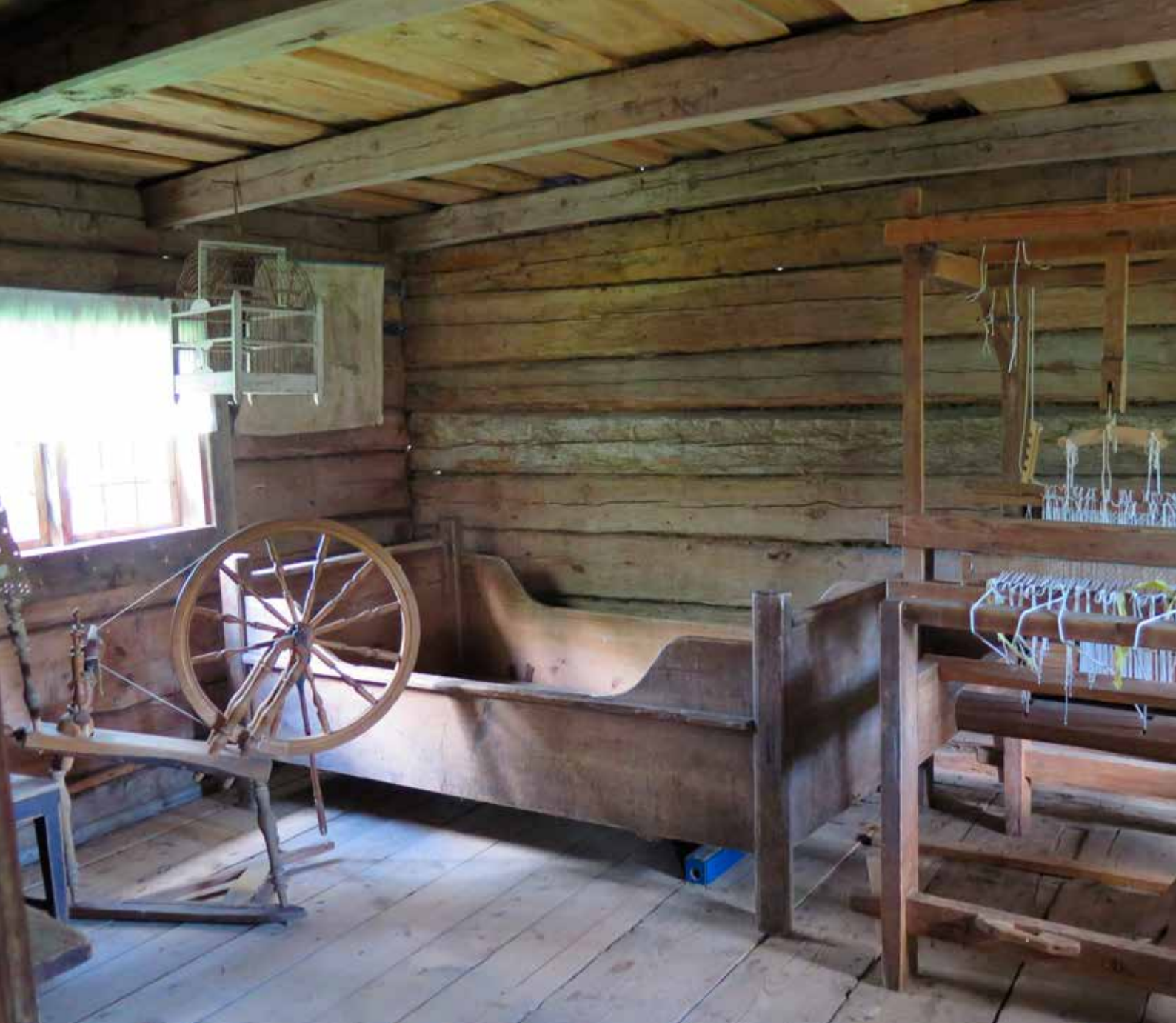
Fig. 23. Anderstugan. LP_2014_00053.