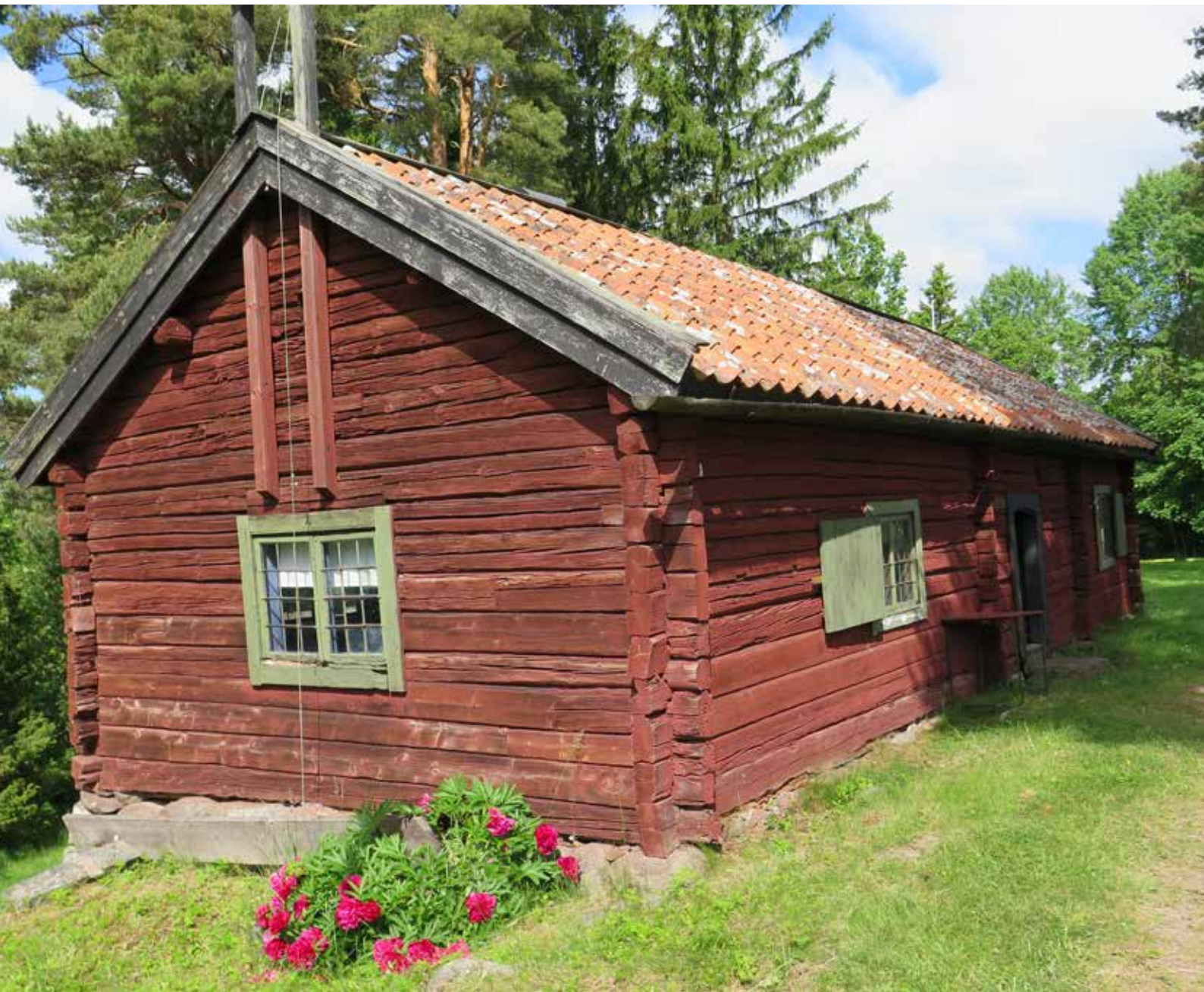
Fig. 1. Hammarbystugan, Eriksskulle. Foto taget från nordväst. Lp_2014_00033.