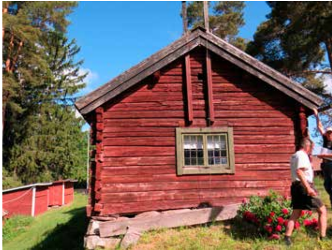
Fig. 10. V ägg B. LP_2014_00041.