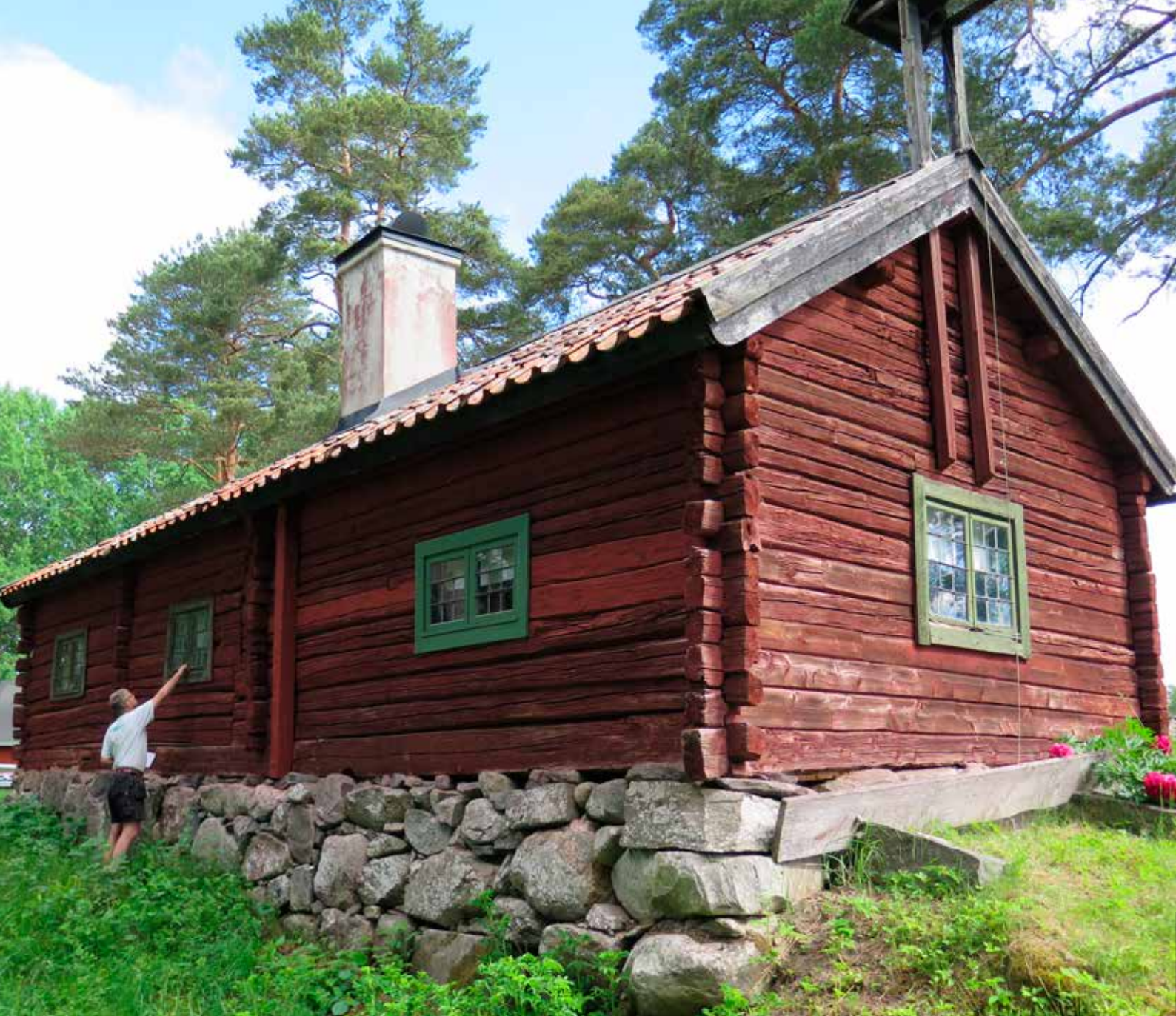
Fig. 2. Hammarbystugan. Foto taget från sydväst LP_2014_00034.