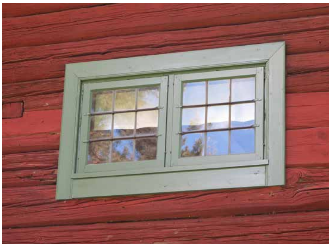
Fig. 15. Vägg C3. Nyttillverkat fönster. LP_2014_00046.