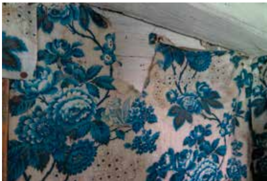
Fig. 20. Spis i kammaren. LP_2014_00050.