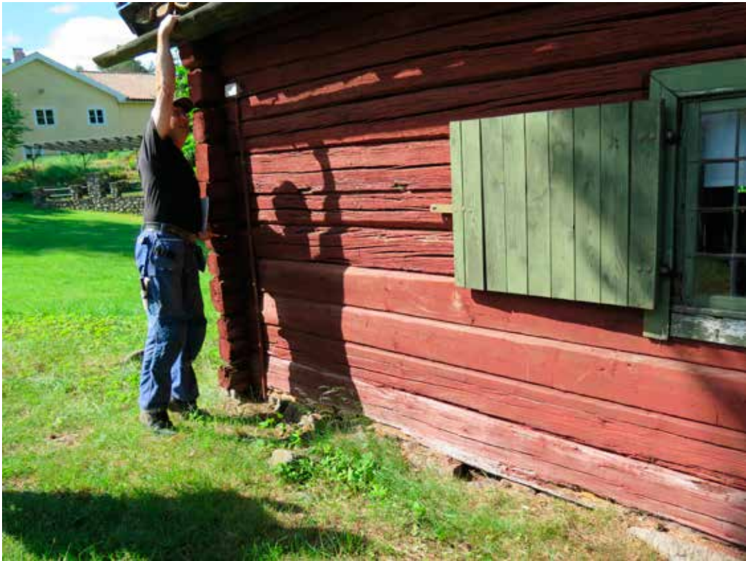
Fig. 7. Vagg A3. LP_2014_00038.