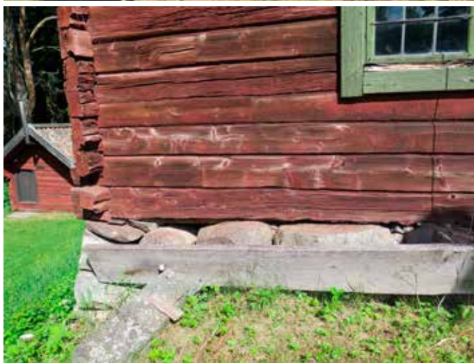
Fig.11. V ägg B. Skador på fönster- snickerier samt syllstock. LP_2014_00070.