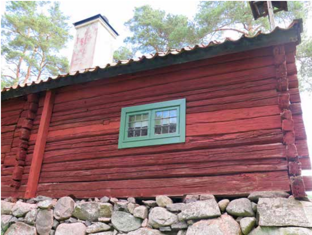
Fig. 14. Vegg C3. Följaren syns till vänster i bild. Fönster med nytillverkade snickerier. LP_2014_00044.