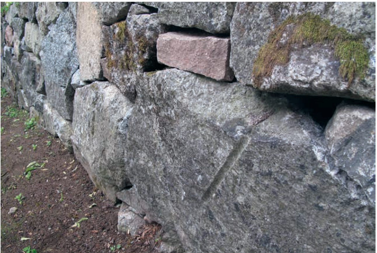
LP 201300591. Borrkärna Västra Ryd