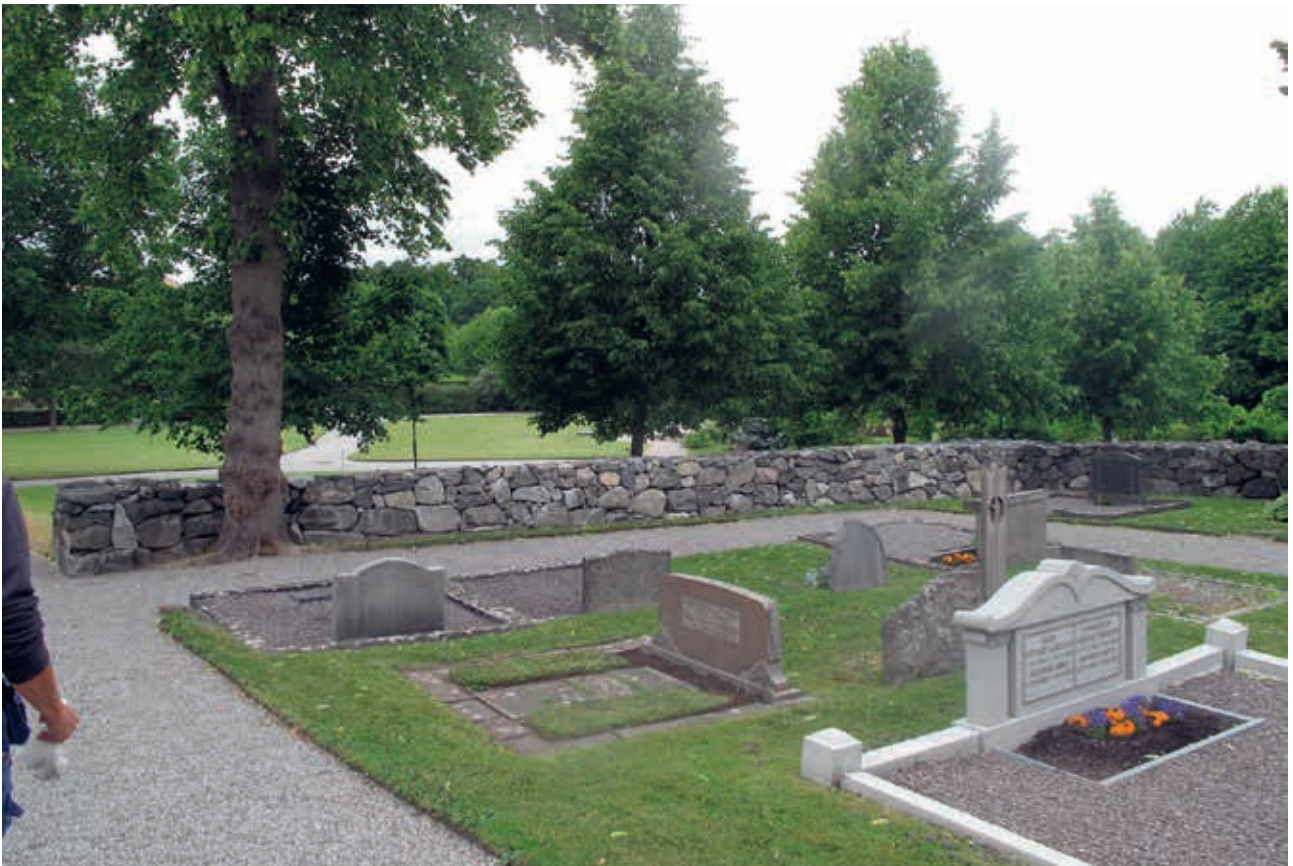
LP 201300588. Omlagda delen Kungsängen