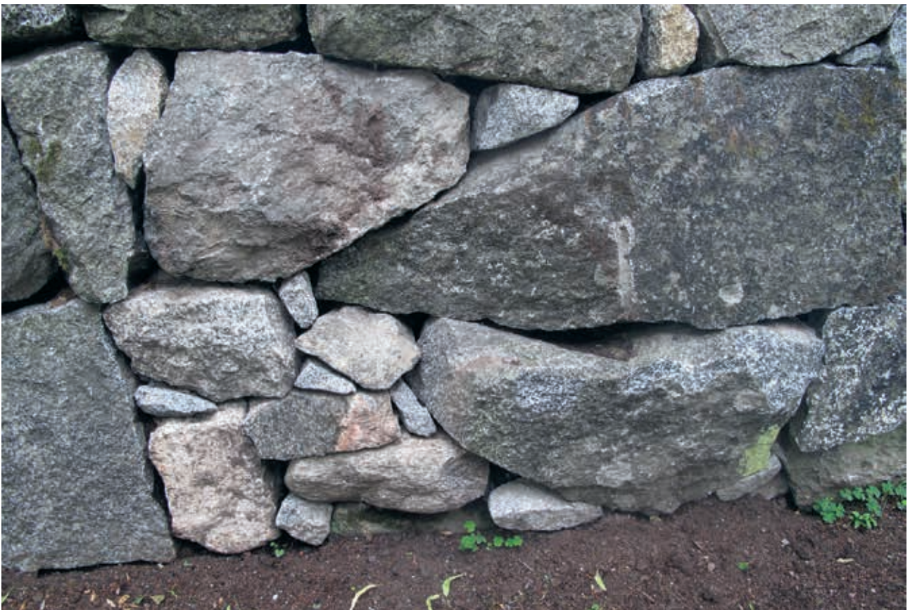
LP 201300596. Småsten underst Västra Ryd