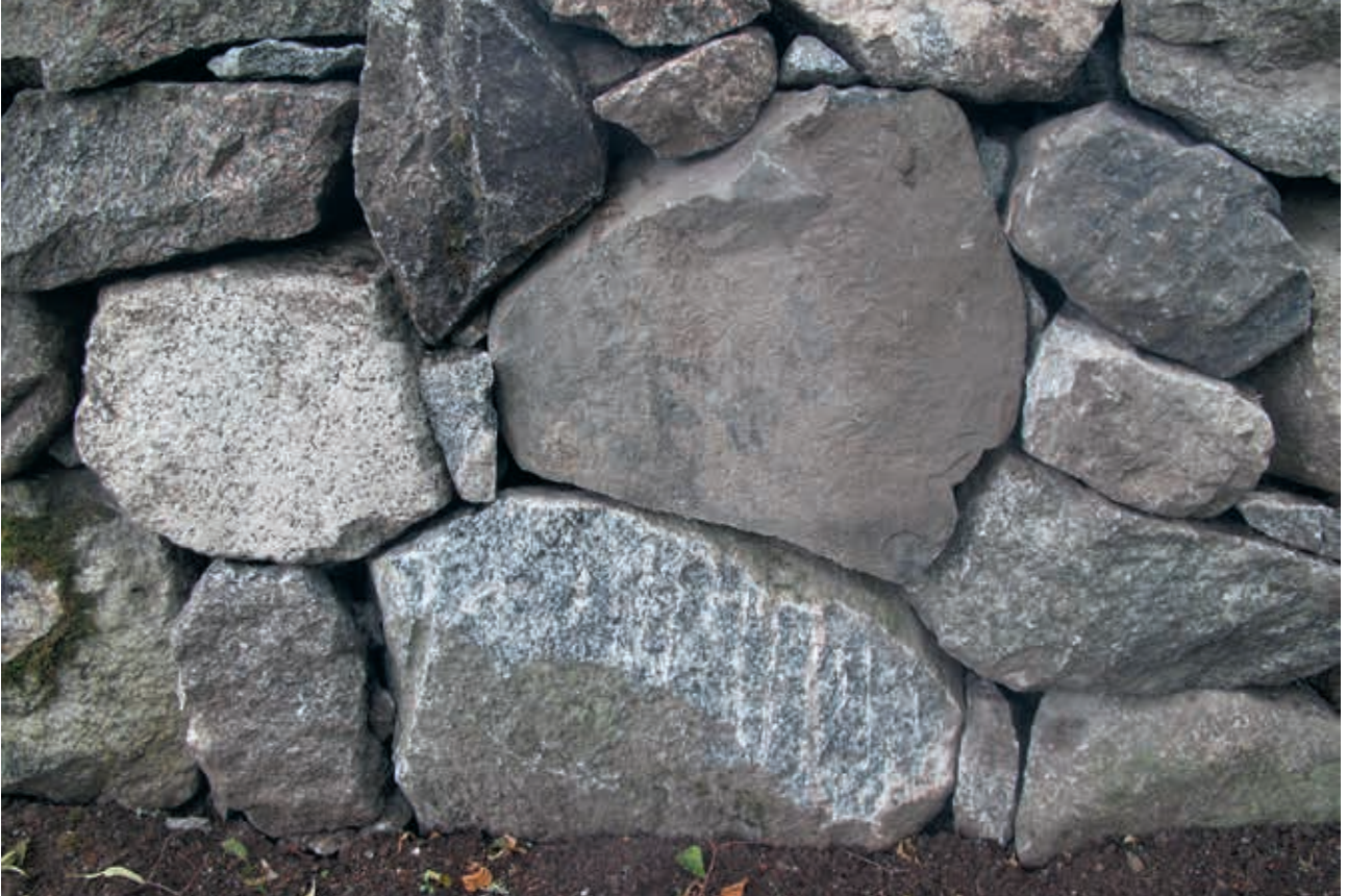
LP 201300593. Kanthuggen sten Västra Ryd