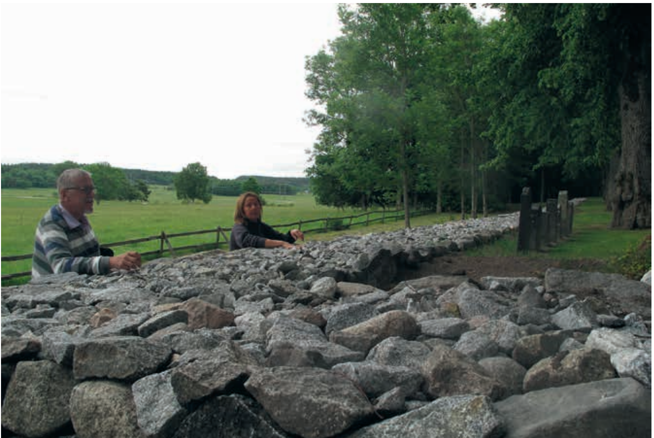
LP 201300598. Staket måste sättas upp utefter den östra mursträckningen, där marken terrasserar i Västra Ryd