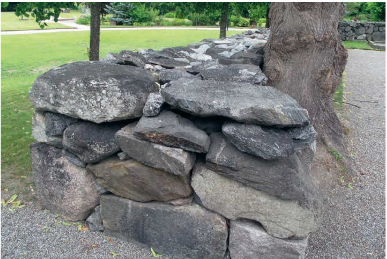
LP 201300589. Lösa block Kungsängen