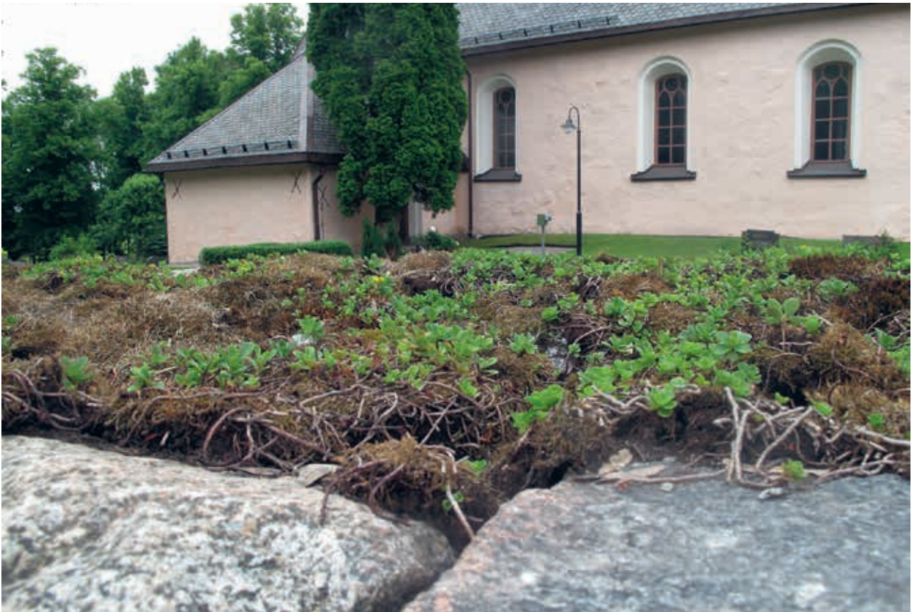
LP 201300600. Sedum på muren Västra Ryd