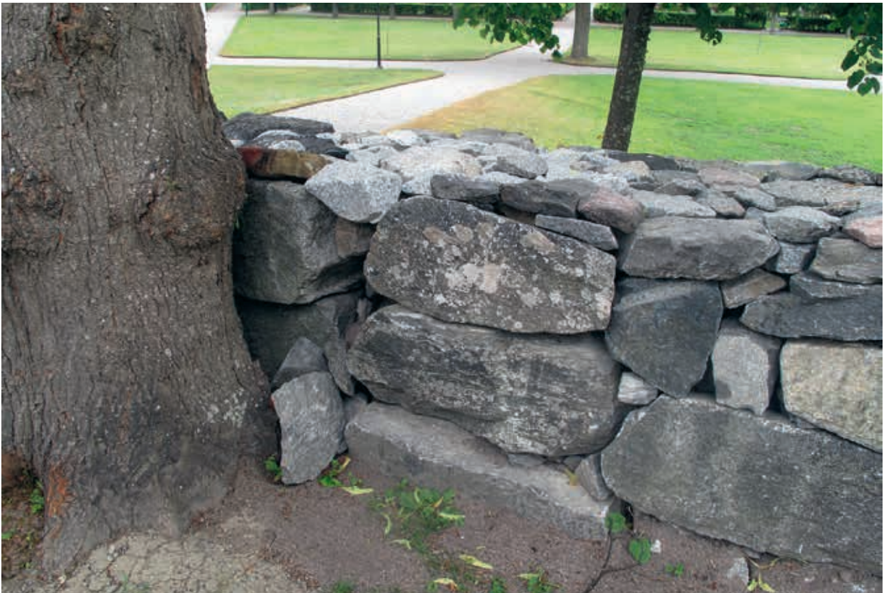
LP 201300590. Ras Kungsängen