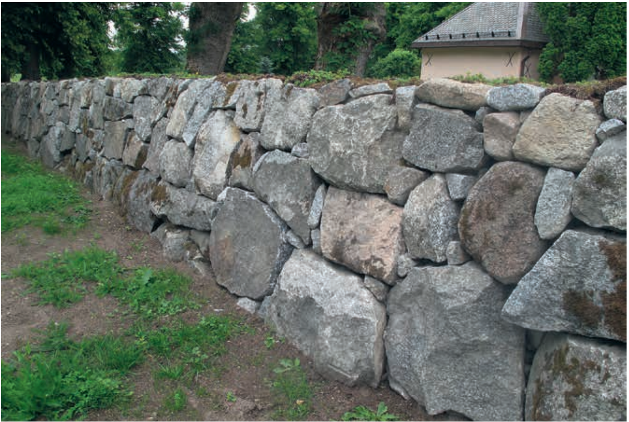
LP 201300599. Pyramidal murform Västra Ryd

Sedum har legat på hela murens sträckning vid Västra Ryds kyrka, men saknas efter omläggningen i de nordöstra delarna samt utmed den östra delen. Sedum bör läggas tillbaka. Knappt någon mossa finns heller kvar på stenytorna.