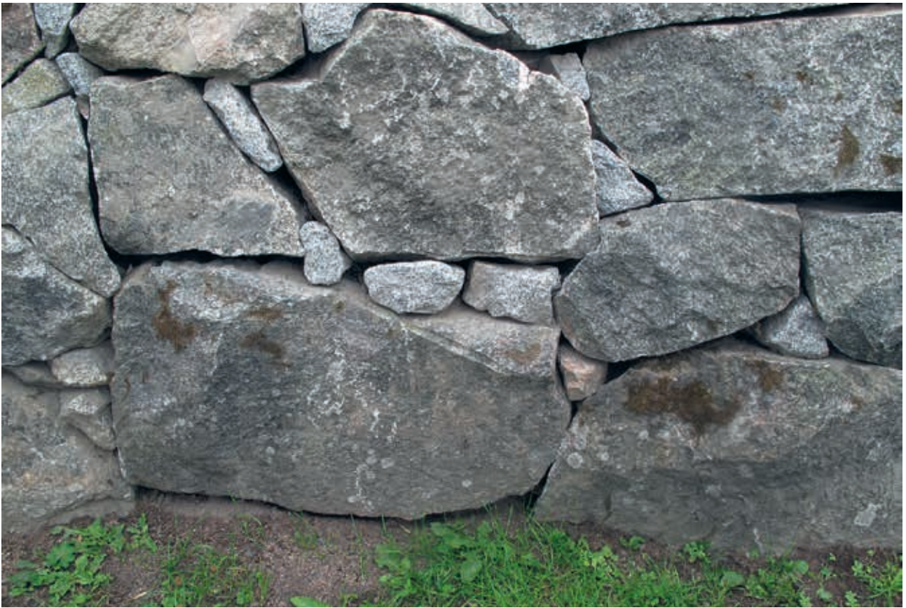
LP 201300595. Småsten Västra Ryd