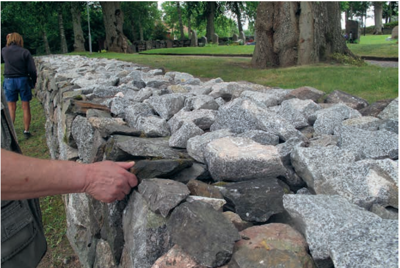
LP 201300597. Löst material på den östra mursträckningen Västra Ryd