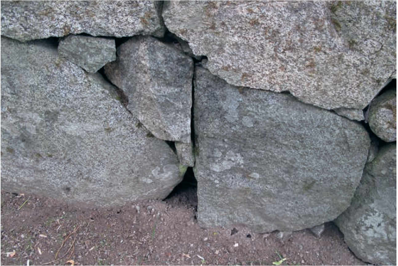
LP 201300594. Risk för gryt Västra Ryd

Små sönderknackade stenar ligger efter omläggningen under de större blocken och förväntas stödja konstruktionen, vilket inte anses stabilt. Många lösa stenar förekommer i båda murarna, vilka kan plockas rakt ut ur sina ställen i muren. Under muren finns flera håligheter som bör sättas igen för att undvika att bli till grävlingsgryt. Murens östra sträckning på Västra Ryds kyrkogård har små lösa stenar liggande längst ut i murens kant, vilket medför instabilitet och risk för olyckor vid barns lek på muren. Stenarna faller lätt av och kan även orsaka ras. Det är lämpligt att placera stora stenar i murens kant. Inuti kan muren däremot fyllas med mindre stenar. Eventuellt kommer ett skyddsstaket att behöva sättas upp utmed den östra sträckningen strax innanför muren, som här terrasserar och har en lägre marknivå utanför muren. De omlagda murpartiernas ovensidor böjlar något och håller inte någon rak linje, inte heller i längdled. På Västra Ryds kyrkogård är den nya muren mellan tornet och den norra stigluckan högre åt norr med två decimeter. Murarna kalvar något, men detta tycks ok, då de har en typiskt riktig pyramidal form.