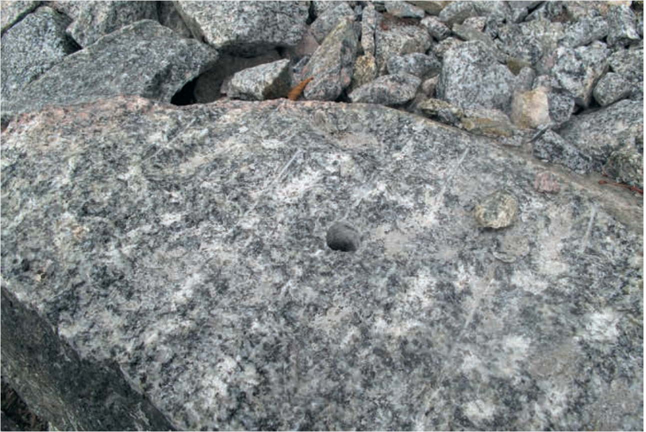
LP 201300592. Borrhål Västra Ryd