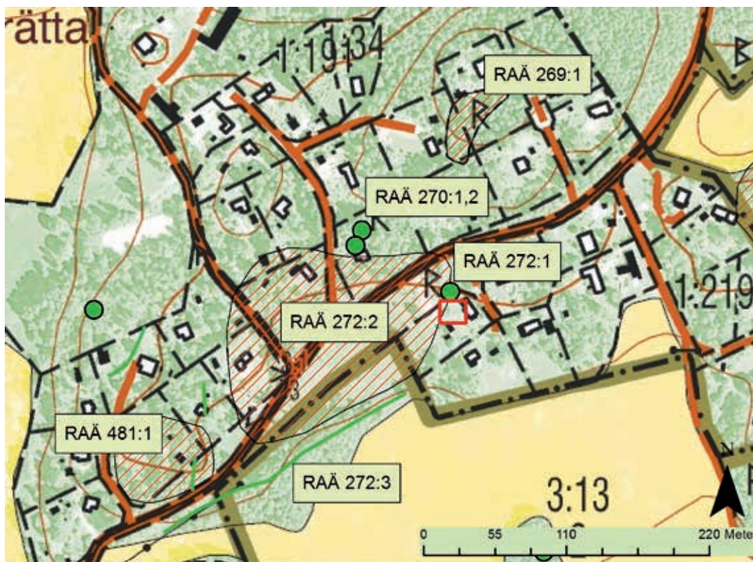
Fig. 3. Fastighetskartan med förundersökningsområdet markerat med rött samt RAÄ nummer nämnda i texten utsatta. Skala 1:4000