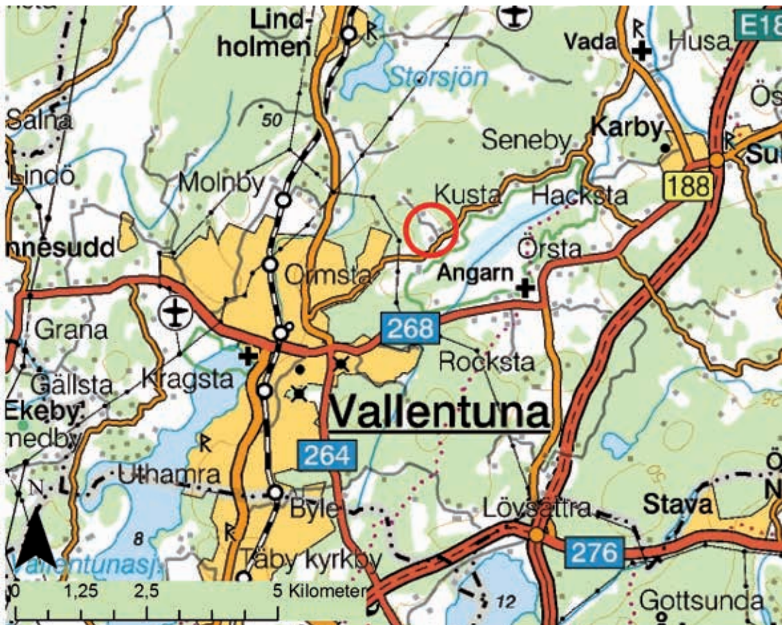
Fig. 1. Översiktskartan med förundersökningsområdet markerat med röd cirkel. Skala 1:100 000.