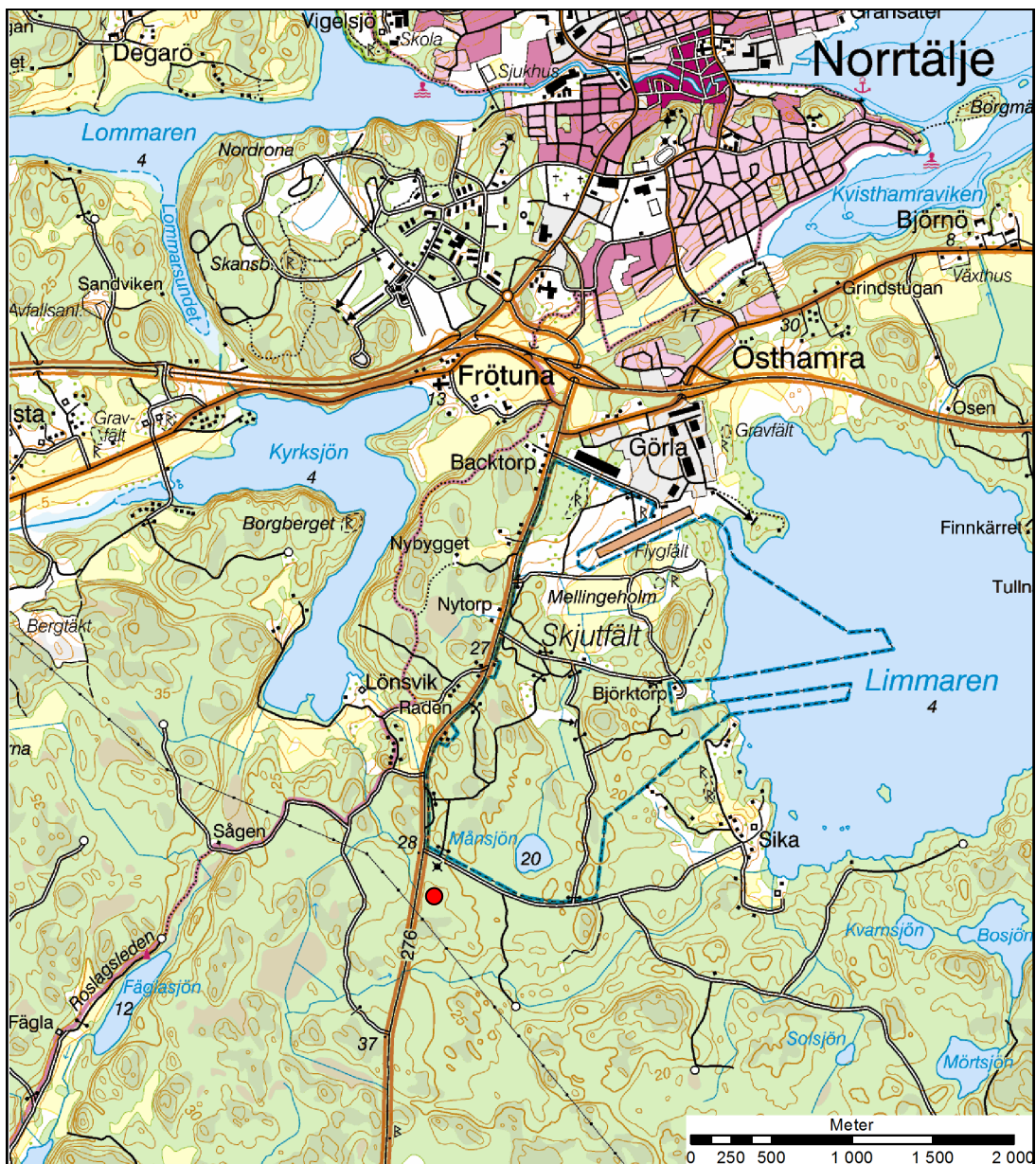
Fig. 1. Terrängkartan med undersökningsområdet markerat med röd punkt. Skala 1:40 000.