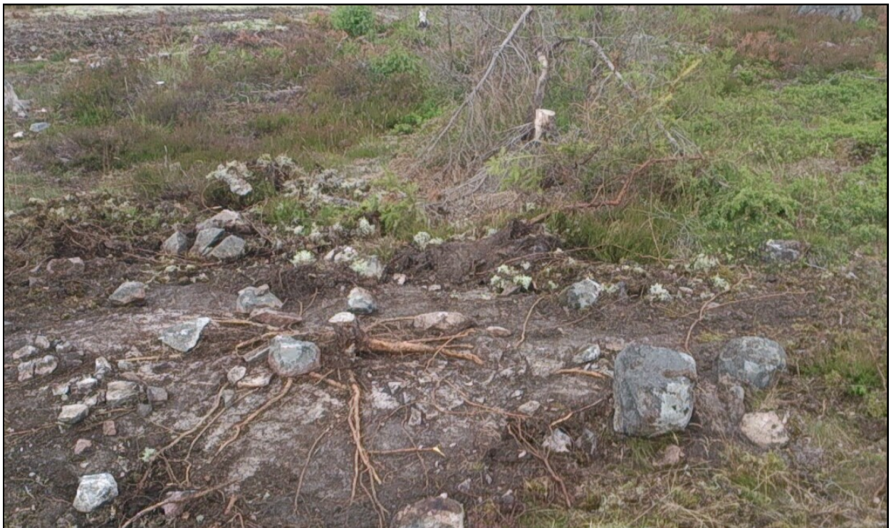
Fig. 4. Stensättningen visade sig bestå av spridd sten på en berghäll. Foto från söder.