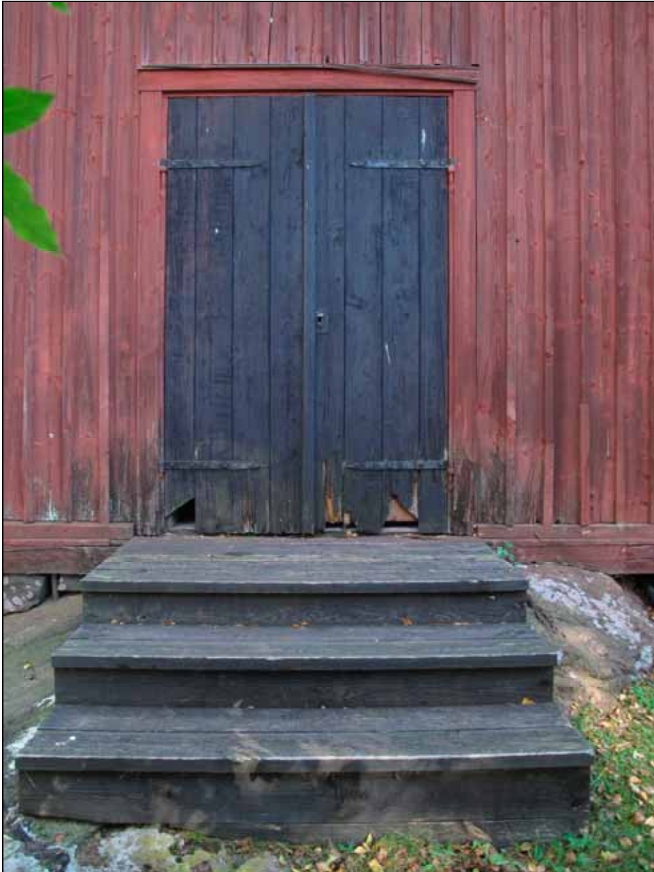
Rötskadad dörr och panel före utförda arbeten. Foto: Lisa Sundström, bildnr lp20110940.