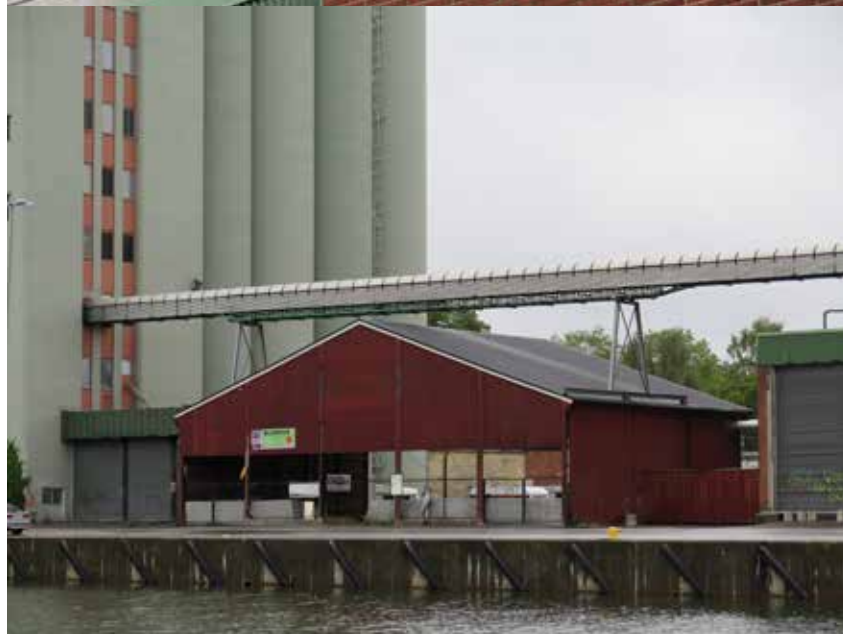
Fig. 16. Övre bilden. Detalj från maskintornets östra fasad, östra silon. LP_2014_00158.