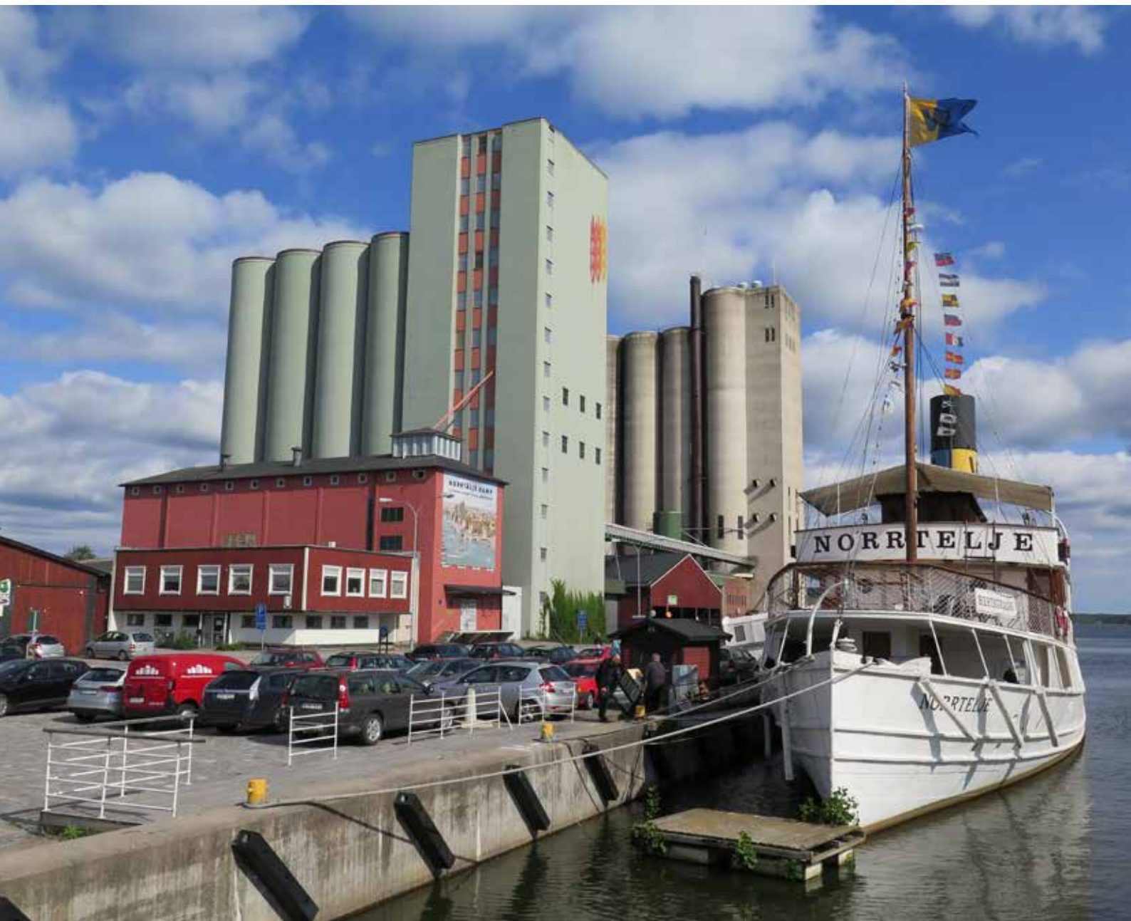
Fig. 1. Norrtälje hamns karaktäristiska silor och ångfartyget S/S Norrtelje. LP_2014_00147.