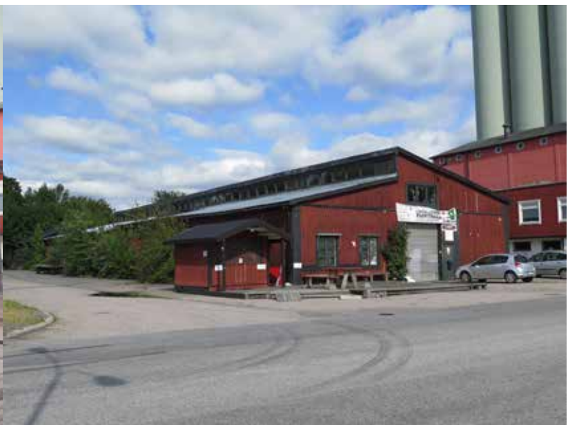
Fig. 22. Byggnad 7. Hamnladan. LP_2014_00165.