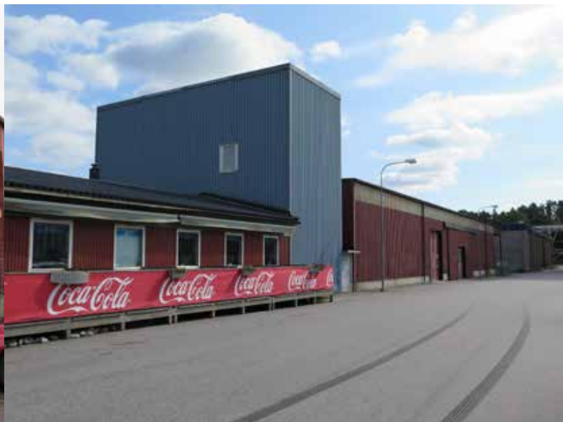
Fig. 35. Byggnad 16. Spånsilon mellan pizzeria och verksamhetslokal. LP_2014_00178.