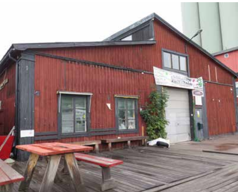
Fig. 21. Byggnad 7. Hamnladans södra fasad. Nuvarande takformen tillkom under en ombyggnad vid 1900-talets mitt. LP_2014_00164.