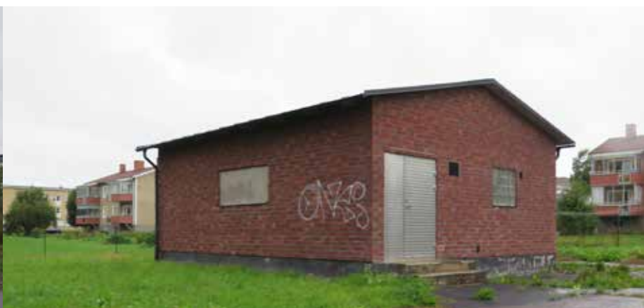
Fig. 43. Byggnad 22. Pumpstation som ligger inom planområdets östra del. I bakgrunden syns bostadsbebyggelse. LP_2014_00186.