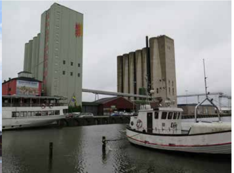
Fig. 11. Mellersta och östra silon. Fotografi taget från Societetsparkens strandpromenad. LP_2014_00153.

funktion i hamnen under en stor del av 1900-talet, och visar också på en viktig näring för den omkringliggande landsbygden. Tillsammans med de intilliggande silorna syns utvecklingen både i utformningen av silor och i omfattningen av spannmålshanteringen i hamnen. Byggnaden har därmed ett lokalthistoriskt värde och ett byggnadsteknikhistoriskt värde.