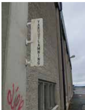
Fig. 31. Övre bilden. Byggnad 14. Spannmålmagasinet fotograferat från Societetsparken. LP_2014_00174.