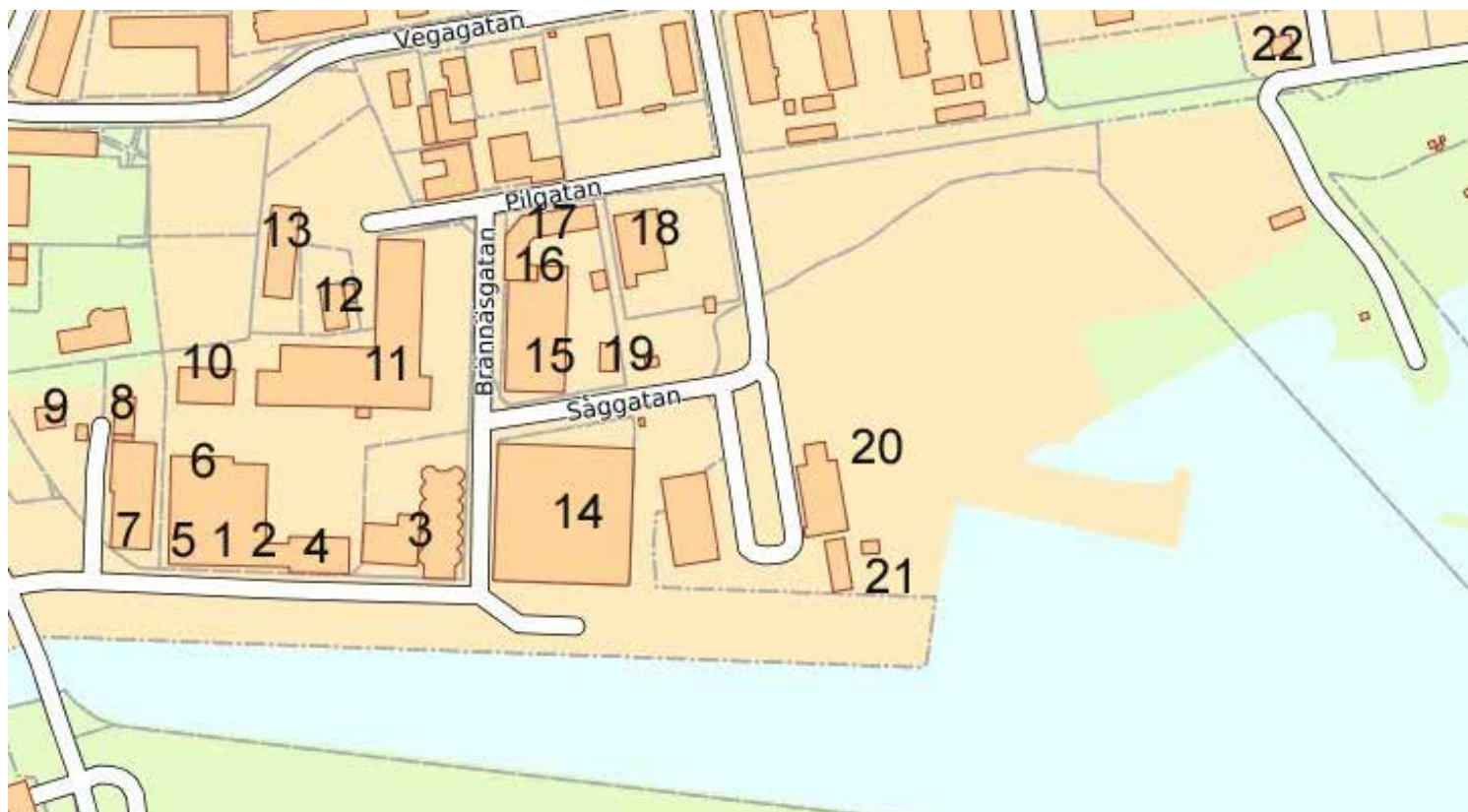
Fig. 8. Karta med numrering över de dokumenterade byggnaderna.