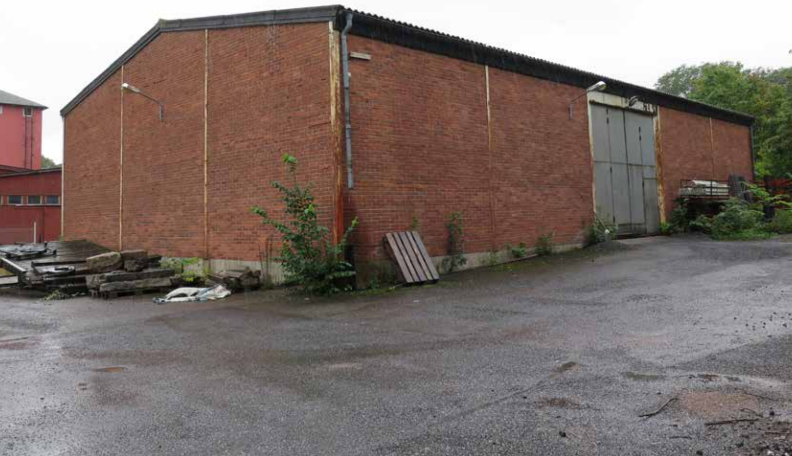
Fig. 25. Byggnad 10. Lagerbyggnaden fotograferad från nordost. LP_2014_00168.