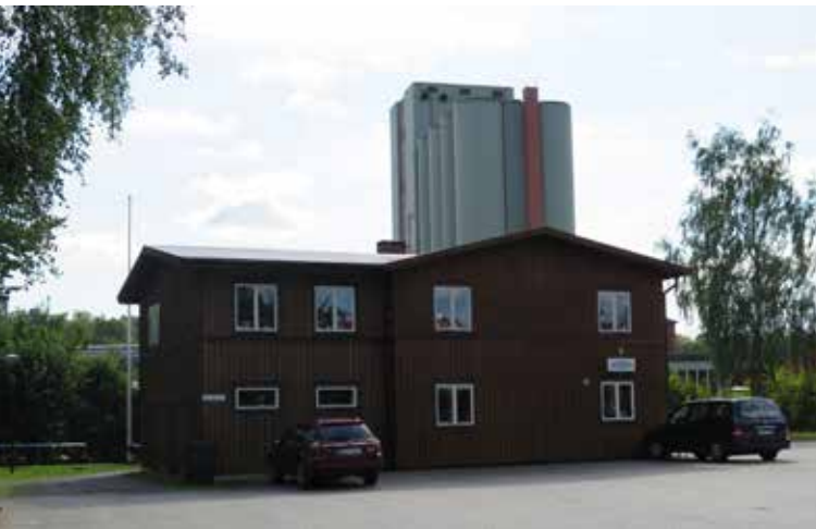
Fig. 29. Byggnad 12. Bostadshus. Mellersta silon syns i bakgrunden. LP_2014_00172.