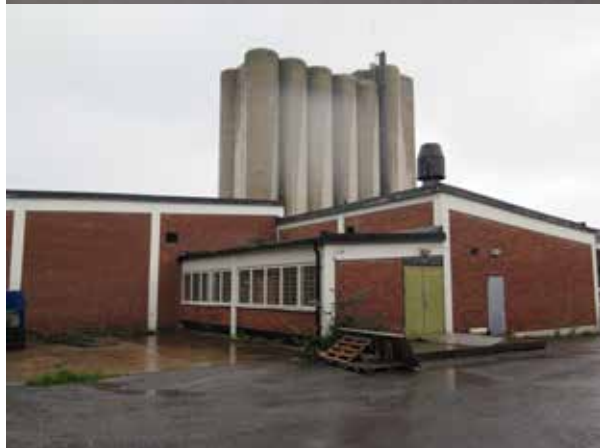
Fig. 27. Byggnad 11. Byggnadens äldsta del, fotograferad från nordväst. I bakgrunden syns den östra silon. LP_2014_00170.