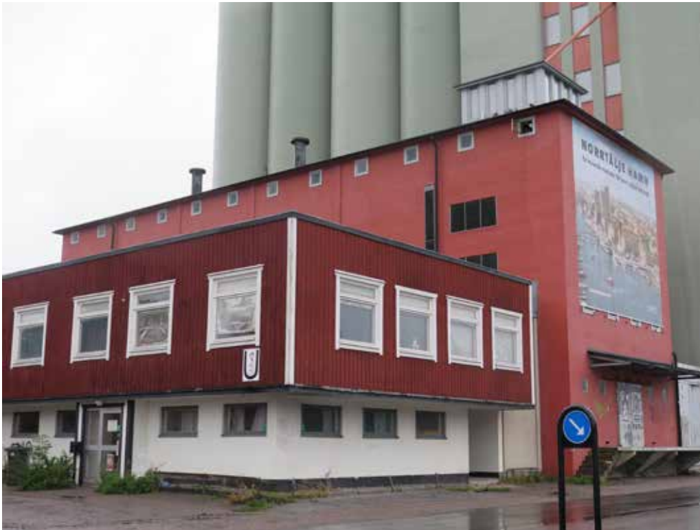
Fig. 9. Rosa sädesmagasinet med U-huset (byggnad 5) på sin ena sida och den gröna silon (byggnad 2) på andra. Fotografi taget från sydväst. LP_2014_00152.