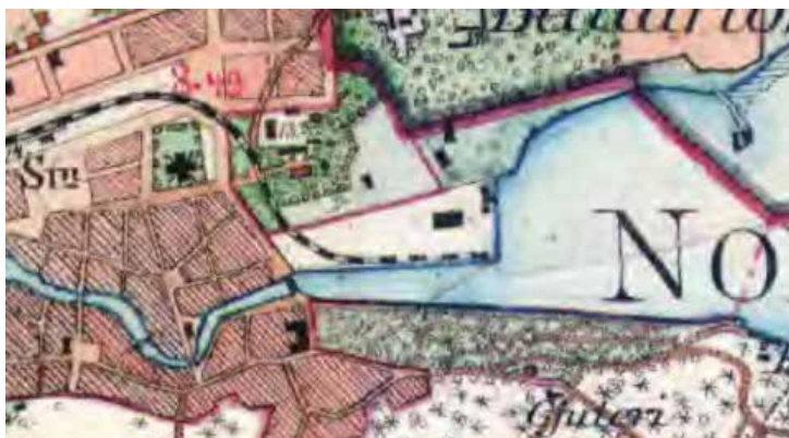
Fig. 3. Utsnitt ur häradsekonomska kartan från 1901-06. Här syns järnvägsspåren som gick ner i hamnen.