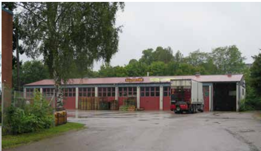
Fig. 30. Byggnad 13. Byggnaden fotograferad från öster. LP_2014_00173.