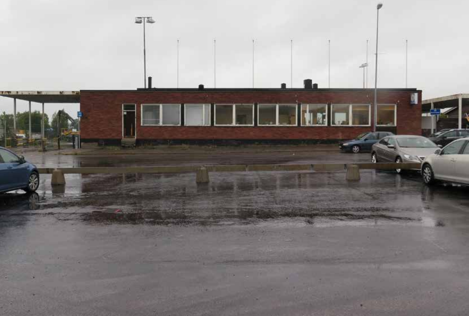
Fig. 39. Byggnad 20. Den f d färjestationen, fotograferad från väster. På parkeringen som syns i bild anlände färjepassagerare förr med buss. LP_2014_00182. B