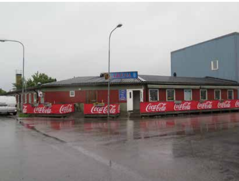
Fig. 36. Byggnad 17, pizzeria i korsningen Brännäsgatan-Pilgatan. LP_2014_00179.