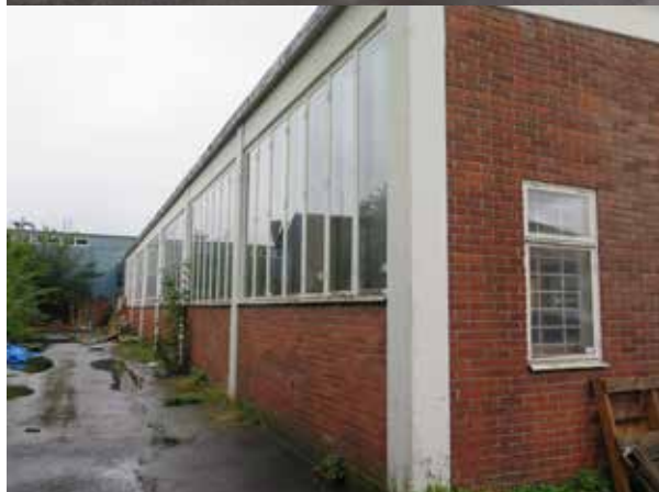
Fig. 28. Byggnad 11. Verkstadens fasad åt norr. LP_2014_00171

vitputsade vertikala och horisontala putsade fält. Den äldsta verkstadensdel har en vägg åt norr med stora fönster med vitmålade bågar. Den lägre byggnadskroppen som sträcker sig i öst-västlig riktning har fasad dels klädd med gråmålat tegel och röd stående panel och dels med träpanel målad i rött och ljusgrått. Mitt på långsidan finns entrén till butiken Granngården som dock inte längre finns kvar i lokalerna. Byggnadskroppen längs Brännäsgatan har en fasad till största del klädd med korrugerad grå plåt, men med gavlar i rött tegel vilket var vanligt för tiden då byggnaden uppfördes. En stor del av fasaden mot gatan upptas av fönster och portar.