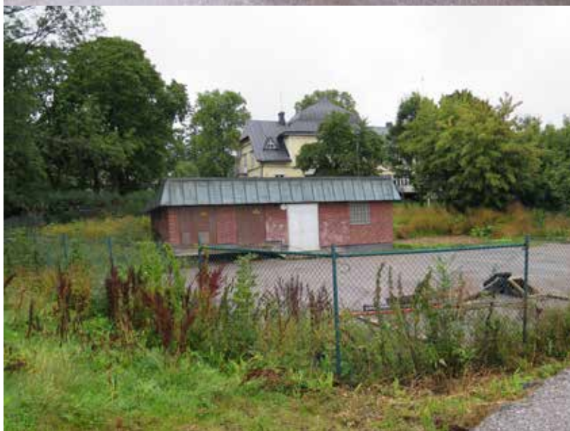
Fig. 23. Övre bilden. Byggnad 8. Byggnaden fotograferad från sydväst. LP_2014_00166.