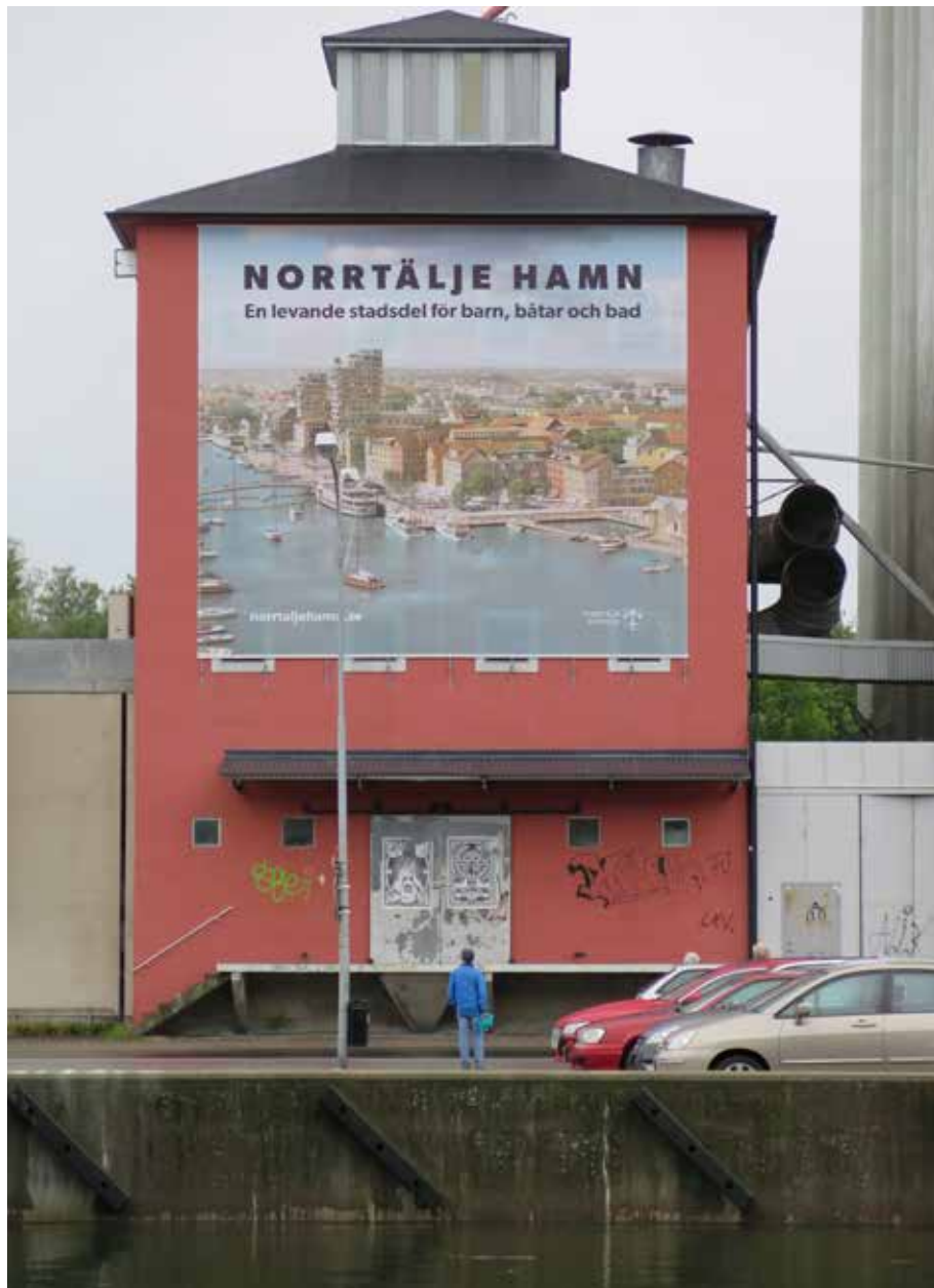
Fig. 2. Rosa sädesmagasinet med reklam för omvandlingen av området. LP_2014_00148.