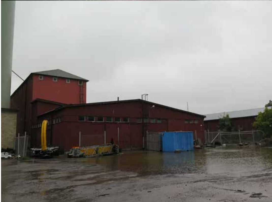
Fig. 19. Övre bilden. Byggnad 6. Byggnadens västra fasad. LP_2014_00162.