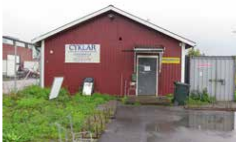
Fig. 38. Byggnad 19. Verksamhetslokal för cykelfirma. LP_2014_00181.

Byggnaden klassas inte som kulturhistoriskt värdefull.