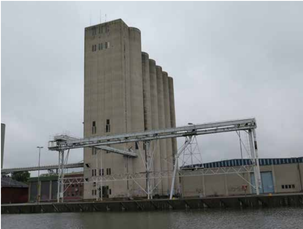
Fig. 12. Östra silon med utlastningsanordning. Fotograferad från Societetsparken. LP_2014_00155.