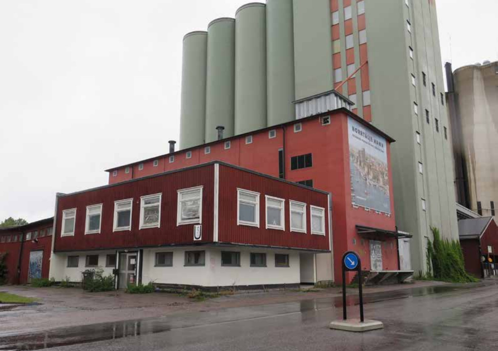
Fig. 18. Byggnad 5. U-huset sett från sydväst. LP_2014_00161.