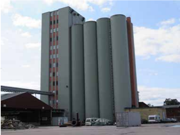
Fig. 10. Mellersta silon från nordost. LP_2014_00154.