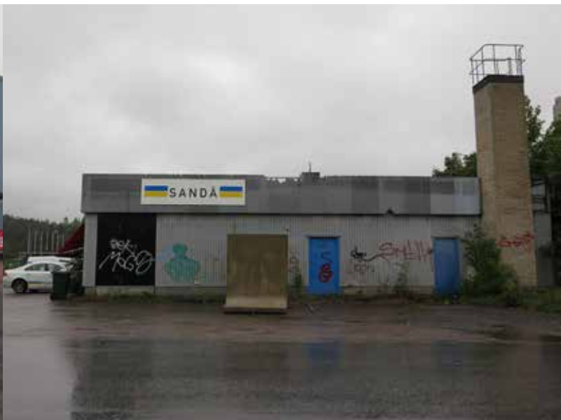
Fig. 37. Byggnad 18. Verksamhetslokal. Fasaderna med korrugerad plåt och funktionen som kontor och verkstad är typisk för området. LP_2014_00180.