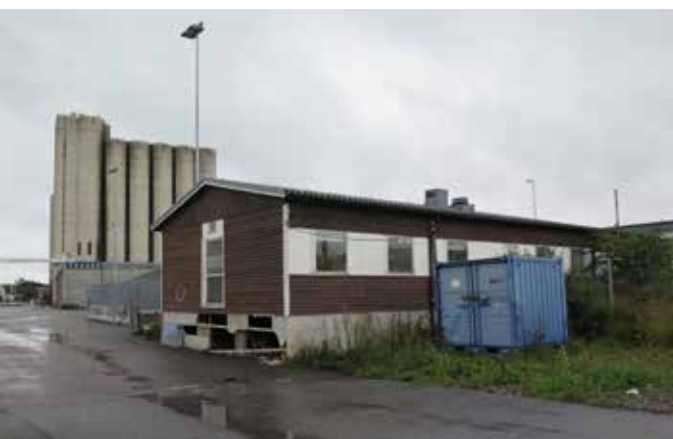
Fig. 42. Byggnad 21. Byggnad som uppfördes för tullen intill färjestationen. I Bakgrunden syns den östra silon. LP_2014_00185.