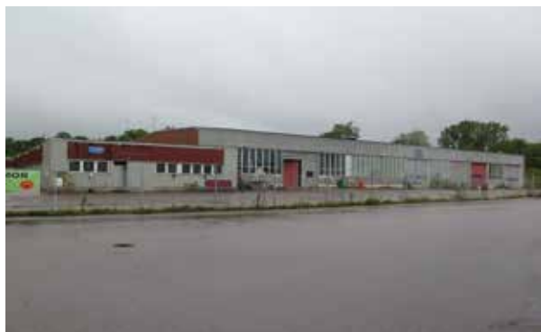
Fig. 26. Byggnad 11. Byggnadens fasad längs med Brännäsgatan. LP_2014_00169.