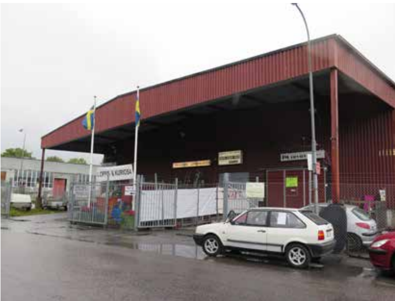
Fig. 34. Byggnad 15. Södra gaveln med ingång till några av de verksamheter som bedrivs i byggnaden. LP_2014_00177.