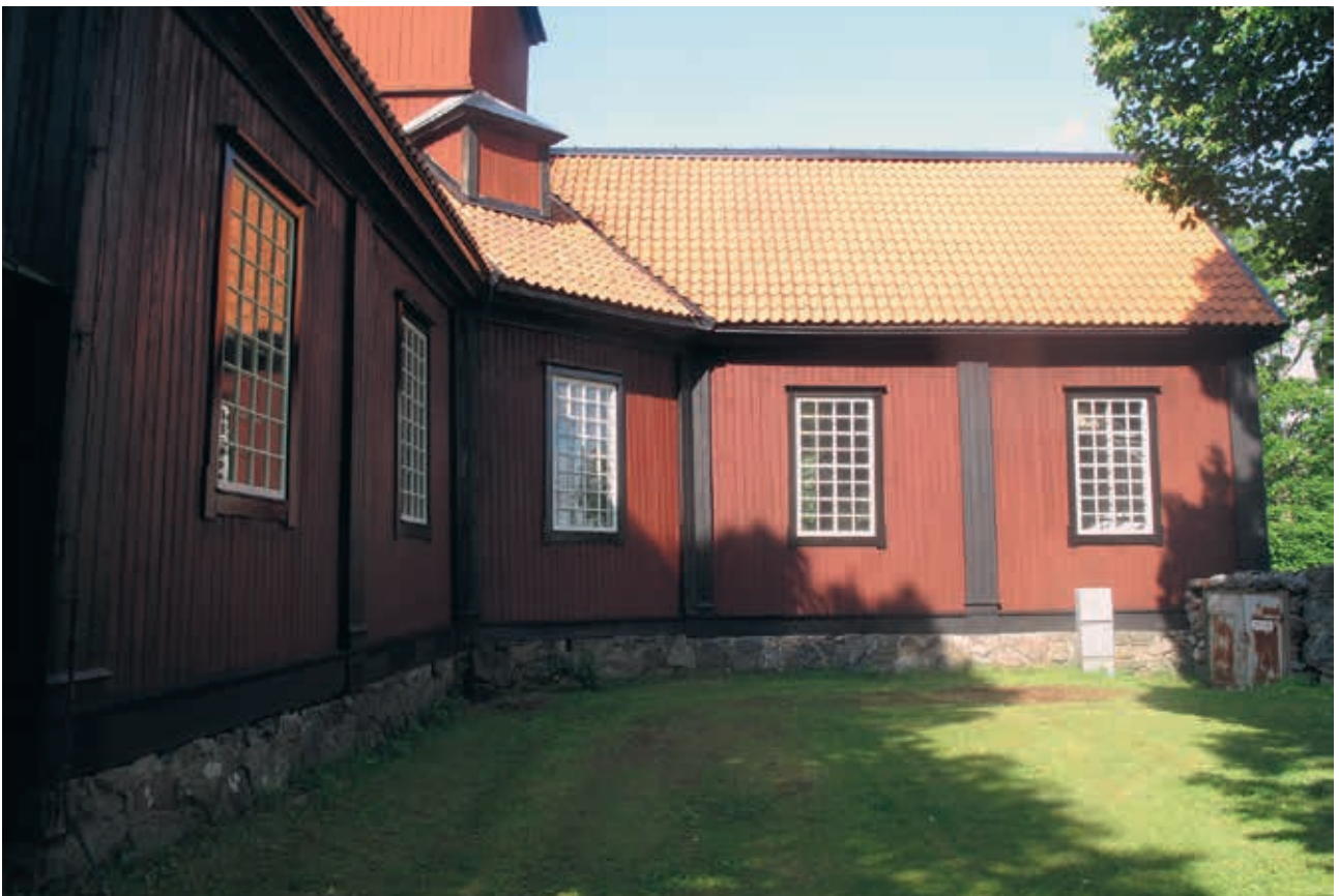
LP 201300542. Norrsidan efter ommålningen, med den fortfarande torkande tjäran.