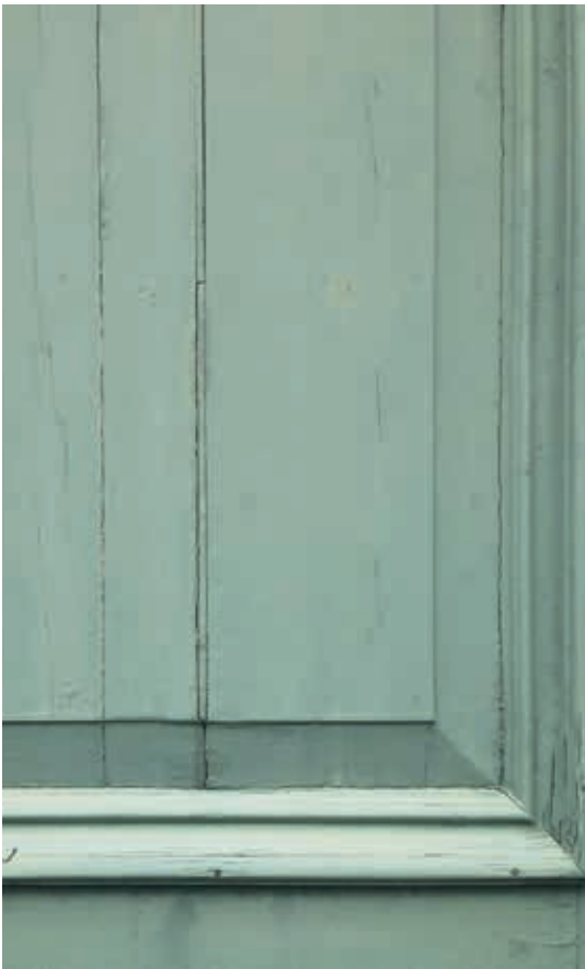
LP 201300546. Dörren på sydsidan innan ommålning.