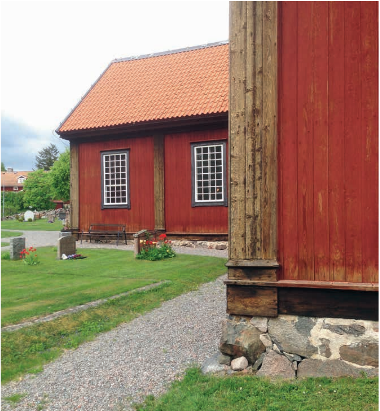
LP 201300540. Kyrkans sydsida innan ommålningen.