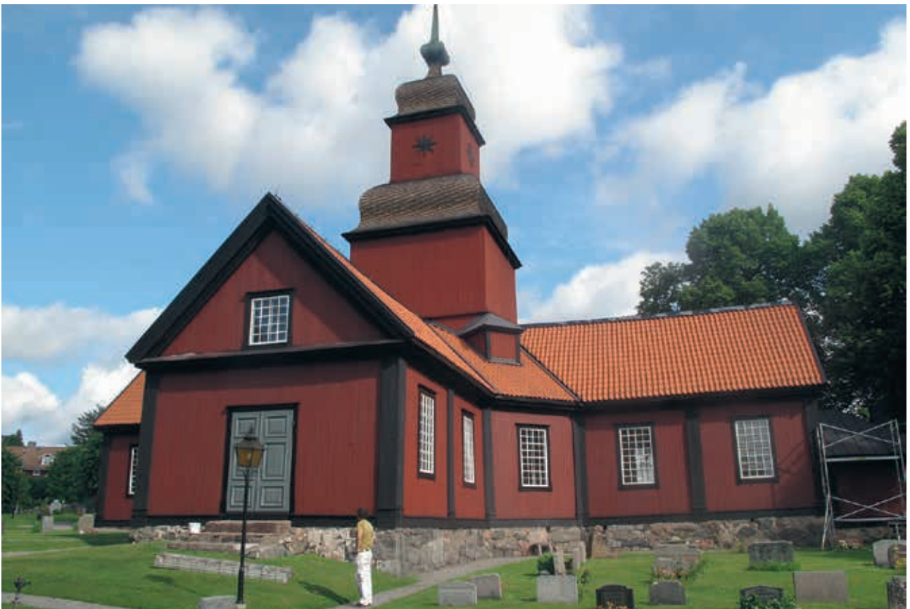
LP 201300551. Kullakyrkan efter ommålningen.