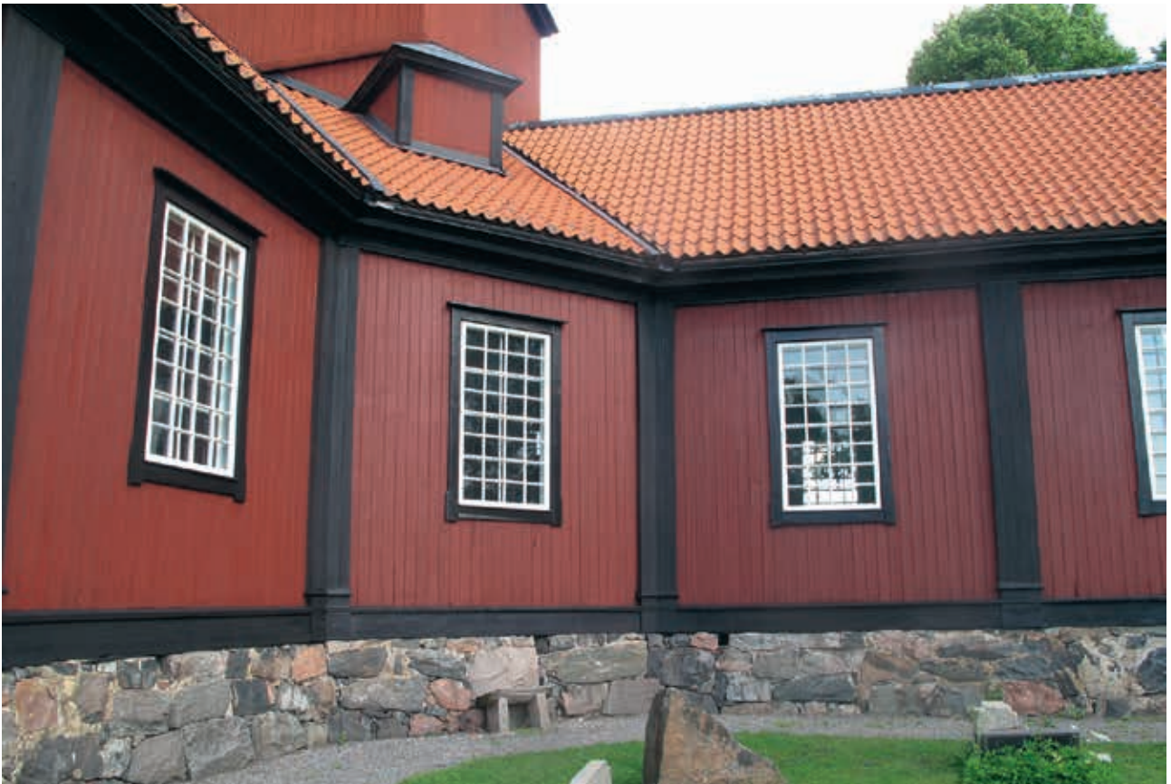
LP 201300541. Kyrkans detaljrikedom syns tydligt efter ommålningen.