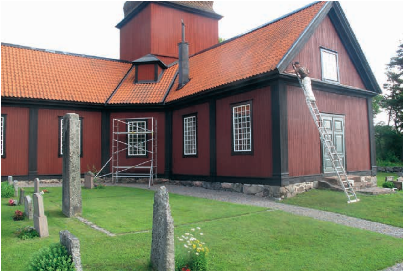
LP 201300543. Kyrkan efter ommålning.