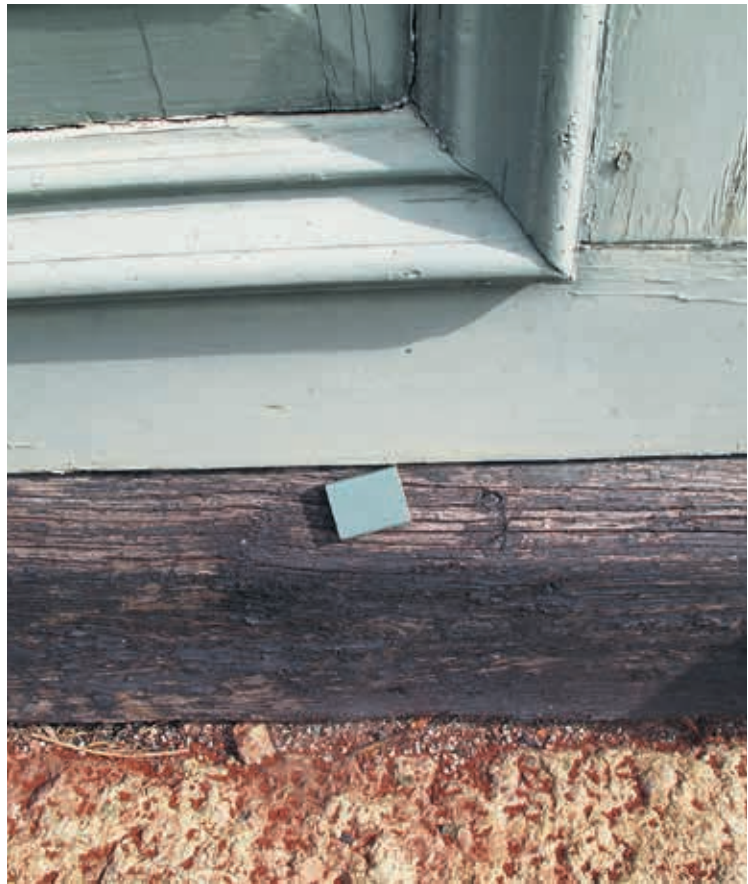
LP 201300547. Färgprov till dörren på sydsidan, där färgen blivit blekt.

De tre dörrarna hade innan ommålning en blågrön (med inslag av lingrön) färgnyans som var nedblekt. Med hjälp av linoljefärgsprover vid det första byggmötet togs en kulör fram av länsmuseet som låg mycket nära den befintliga. Nyansen hade aningen mer blått pigment i sig, för att komma närmare kulörens originalton. Efter en inskanning av befintlig nedblekt färg erhöles en ganska militärgrön nyans som jämfördes med färgkartan (NCS: S 6005-G50Y). Beslut togs därför att välja linoljefärgsprovet, som ju låg mycket nära den nyans dörrarna ursprungligen hade (NCS: S 6005-B80G). Kulören upplevdes proper och värdig och församlingen samt målaren gav sitt gillande. Som linoljefärgsprov hette färgen Grön Verona Jord och kom från Teknisk Målerikonsult, SOH AB. All färgborttagning skedde för hand, genom skrapning och lite borttagningsmedel. En spegel på den södra dörren hade en djup spricka som lagades med en träbit. Övriga mindre glipor lagades med linoljekitt. Dörrarna var tidigare spacklade och lagade med bl.a. plastic paddingmaterial och speglarna i dörrarna var därav fastspacklade. Förevarande ommålning av dörrarna hade en något enklare renoveringsnivå. Om dörrarna skall totalrestaureras behöver de lämnas in. Dörrarna bemålas med tre lager linoljefärg. Det första lagret linoljefärg ströks med mycket uttunnad färg och det andra lagret med lite mindre tunn färg för att vid den tredje bemålningen strykas med ren linoljefärg.