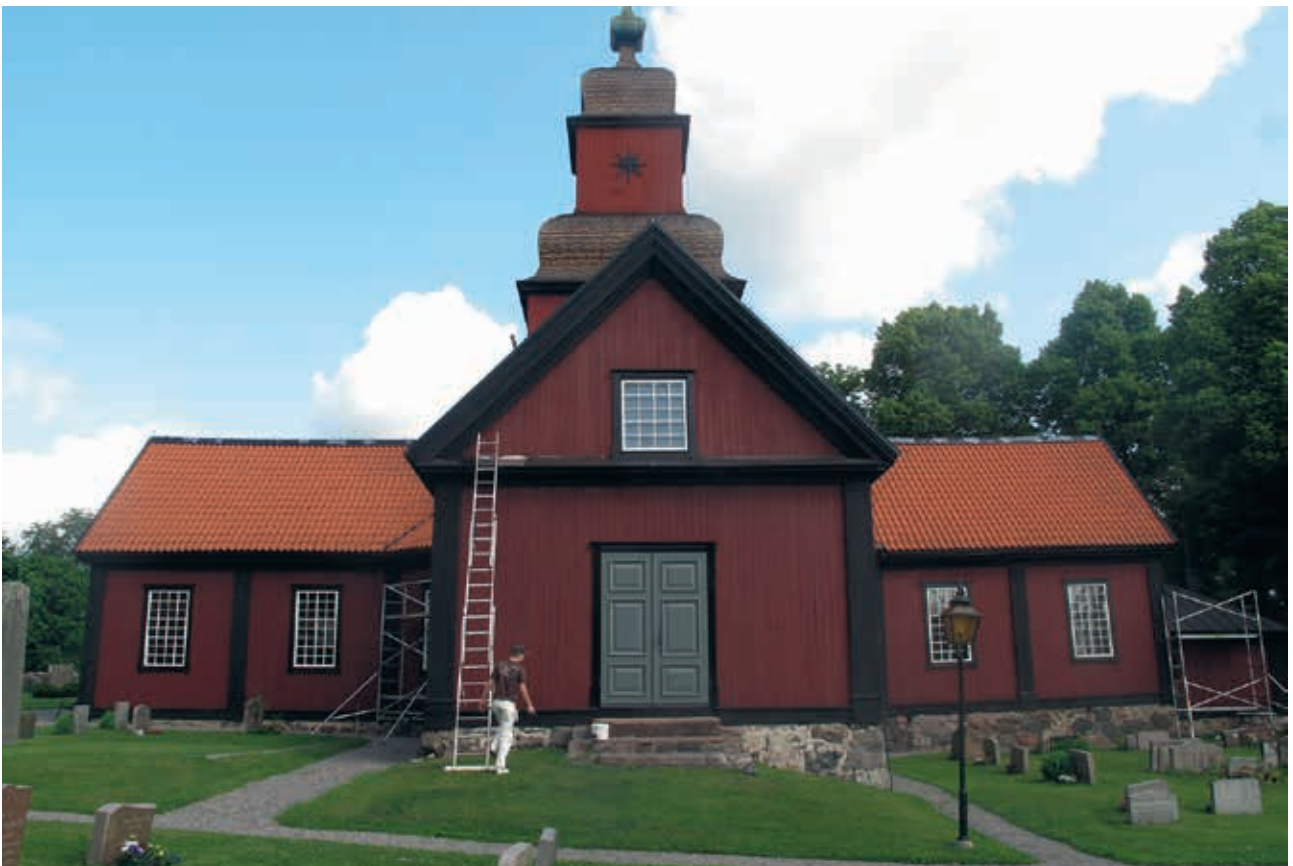
LP 201300544. Kyrkan i sin helhet från söder efter ommålningen.