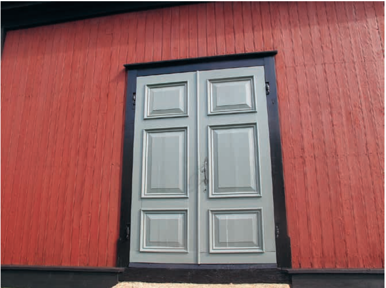
LP 201300549. Dörren på sydsidan efter ommålning och lagning i den mittersta vänstra spegeln samt linoljefärgsmålade dörrfoder.