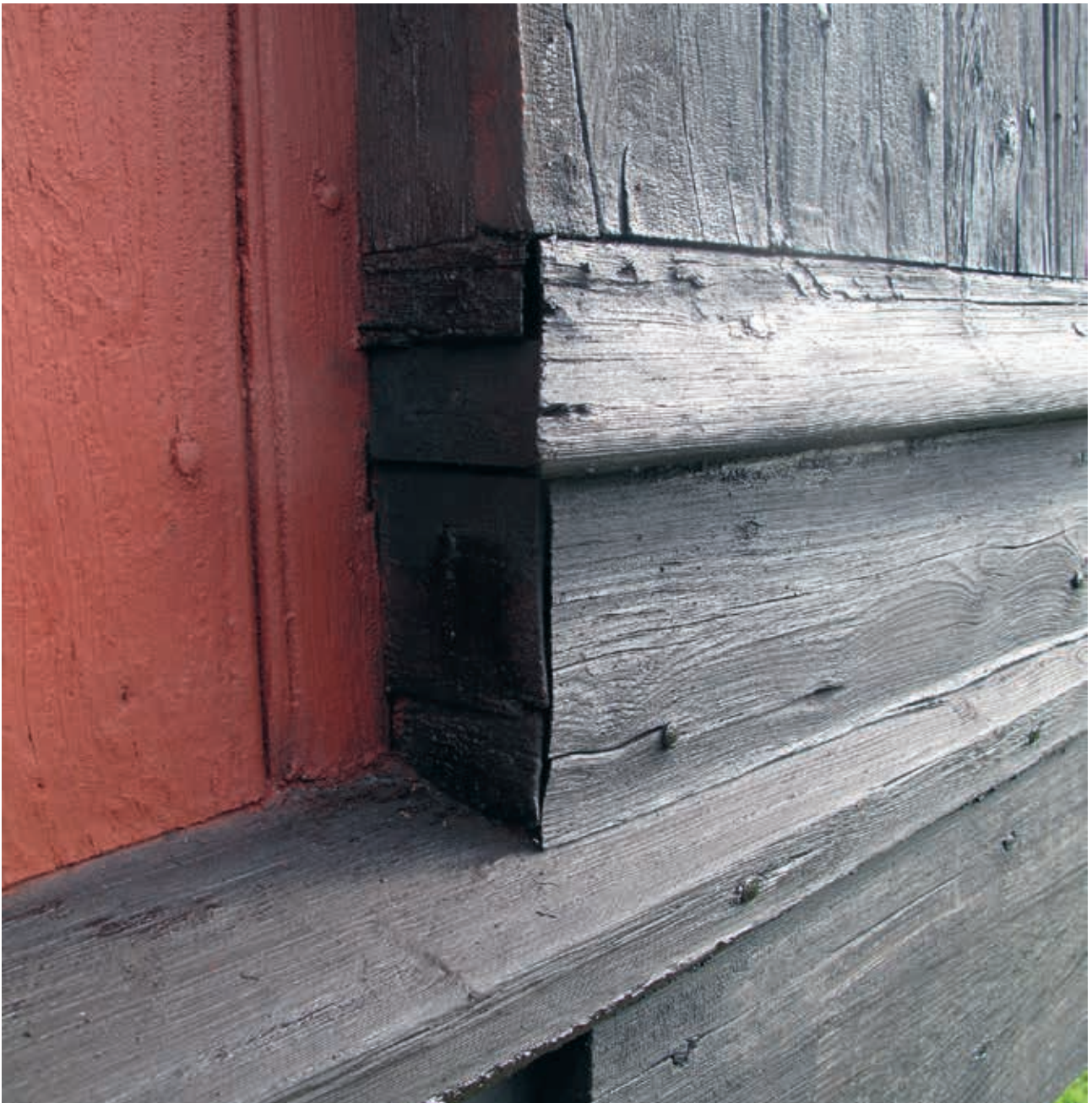
LP 201300545. Lagad detalj på pilasterns nederdel på den södra korsarmen samt offerbrädans möte med pilastern.

I de svarta omfattningarna, takfoten, knutarna, pilastrarna, fotbrädorna och offerbrädorna, användes svärtad tjära. Partierna målades med kimrök, ett svart pigment som tillsattes till tjäran. Till kimröken användes ett svart Falupigment. Alla svarta element behandlades på samma sätt som fasaden, de borstades rena och skrapades på de ställen där det var nödvändigt. Uppe under takfoten, där färgen satt hårdare och hade droppat sig, fick någon färg sitta kvar. Materialet grundades med uttunnad rödfärg. Efter det tjärströks ytorna. De utskjutande offerbrädorna belägna under fotbrädorna målades svarta istället för röda, som de tidigare var, vilket gjorde mötet mellan pilaster och offerbräda mer tilltalande.