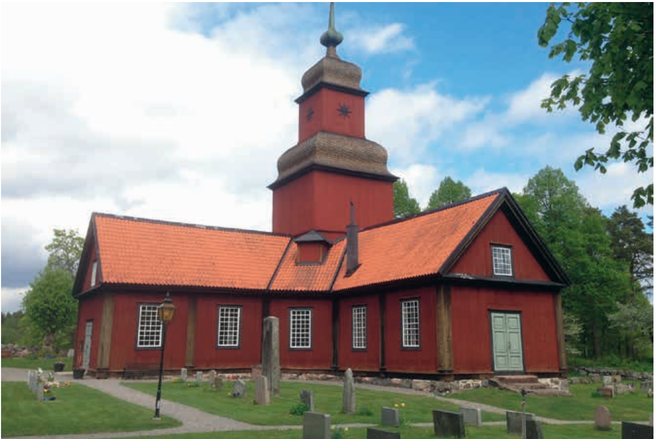
LP 201300550. Kullakyrkan innan ommålningen.