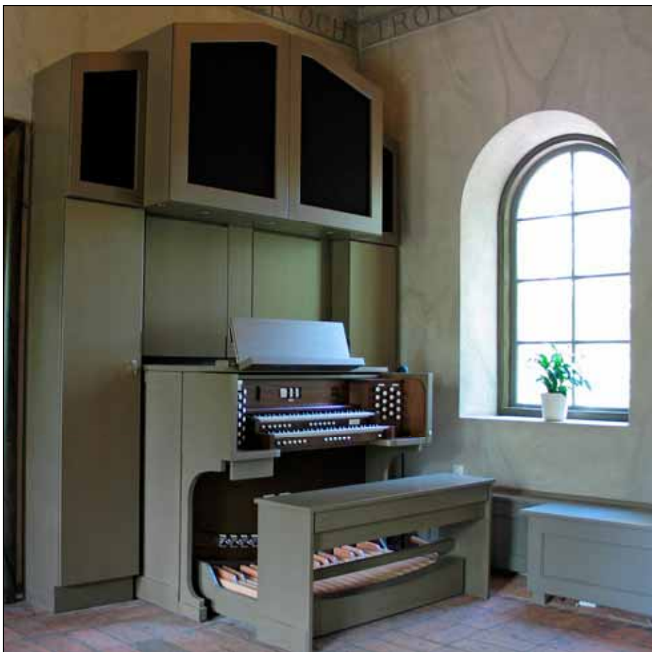
Den nya orgeln med orgelskåp.

Orgelskåp och skåpsinredningen för förvaring tillverkades på snickerifabrik av stommar och luckor i fur och målades på plats.