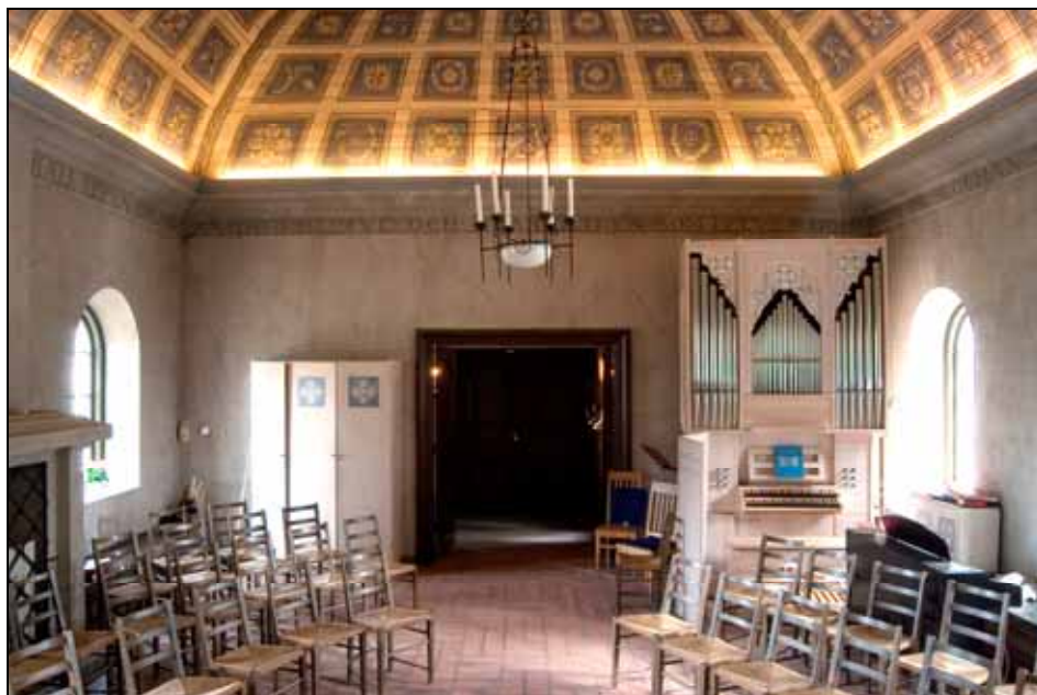
Kyrkorummet före ändring mot öster med skåp och orgel från 1991. Bildnr: lx2005-0683.

och levererad av Svensk Orgelkonsult AB. Orgeln har placerats så att organisten sitter vänd med ryggen mot rummet.