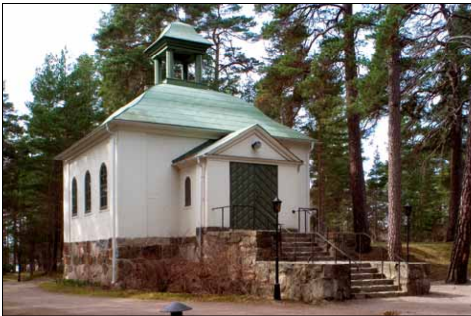
Kapellet från nordöst med hög stentrappa upp till vapenhusets port. Bildnr: lx2005-0684.

Församlingens motiv för förändring är att den höga stentrappan är svår att forcera samt att det är arbetskrävande att bära in och ut kistan i samband med begravningar. Samtidigt har församlingen haft en önskan att ordna en enkel plats för utomhusgudstjänster i närheten av kapellet.