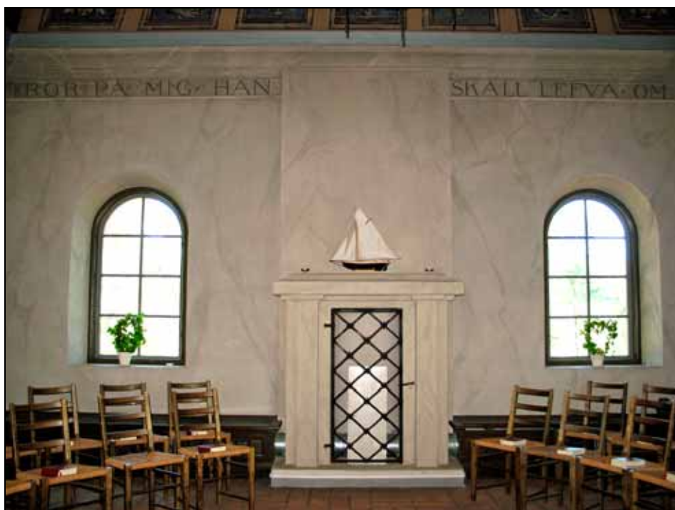
Den nya entrén togs upp på platsen för ett varmluftsintag med utformning av en putsad öppen spis med dekorativt järngaller.

I kapellets norrvägg togs en ny entré upp på platsen för en spiselliknande varmluftskanal.