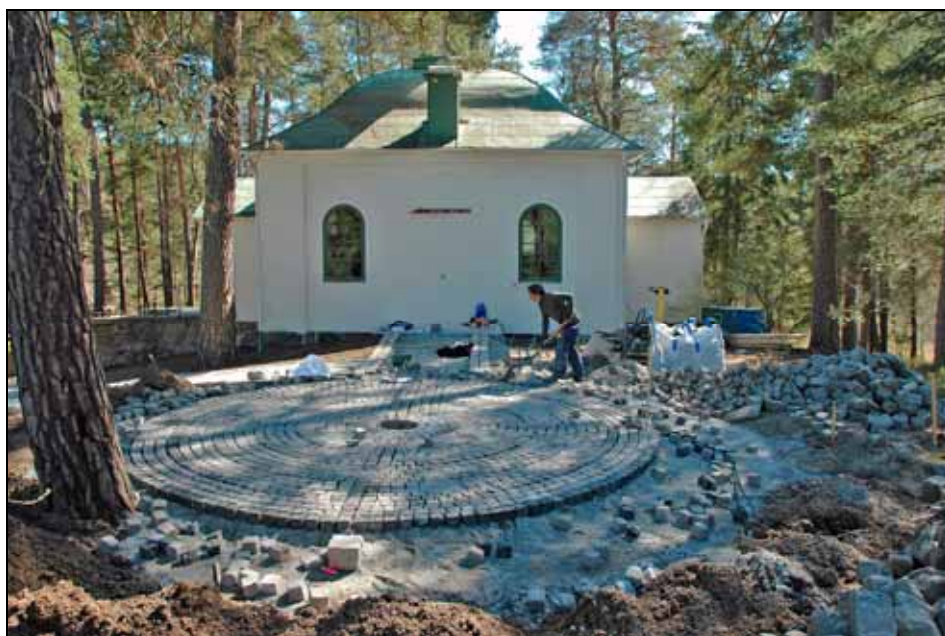
Stenläggning av labyrinten under arbete. Foto: Gunilla Nilsson, 2008, bildnr: lp20110096.