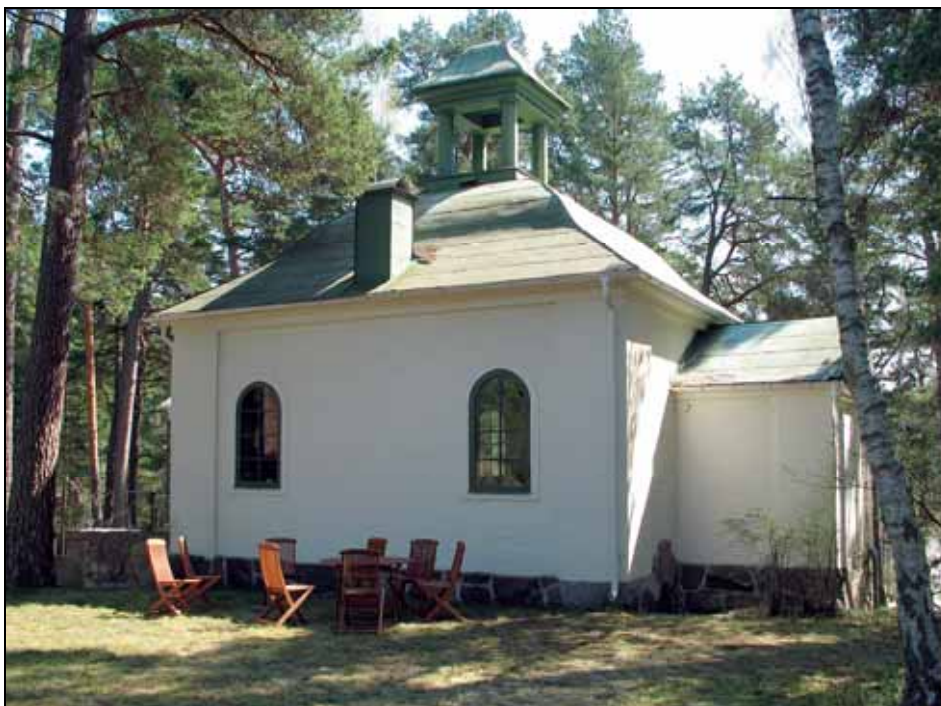
Norra fasaden före upptagande av ny entré och anläggning av ny markbehandling.

Exteriört utfördes den nya entrén med ett glasat vindfång efter ritningar av Björn Uhlén, Millark Studio.