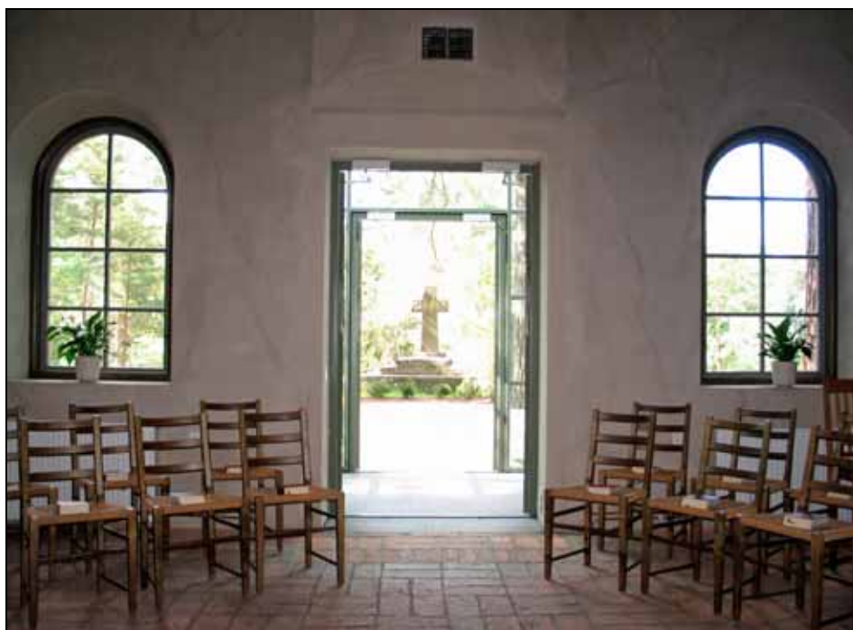
Den nya entrén med utsikt ut över plats med sten lagt i en labyrint.