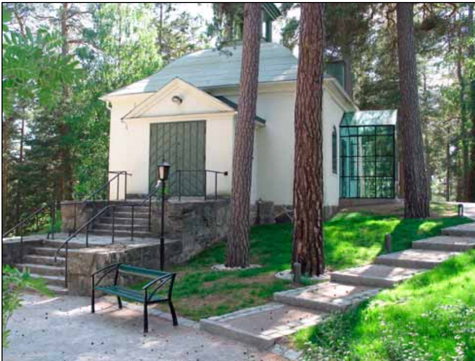
Skogsö kapell med ny entré med vindfång och nya trappor upp till den labyrintliknande stensatta platsen.