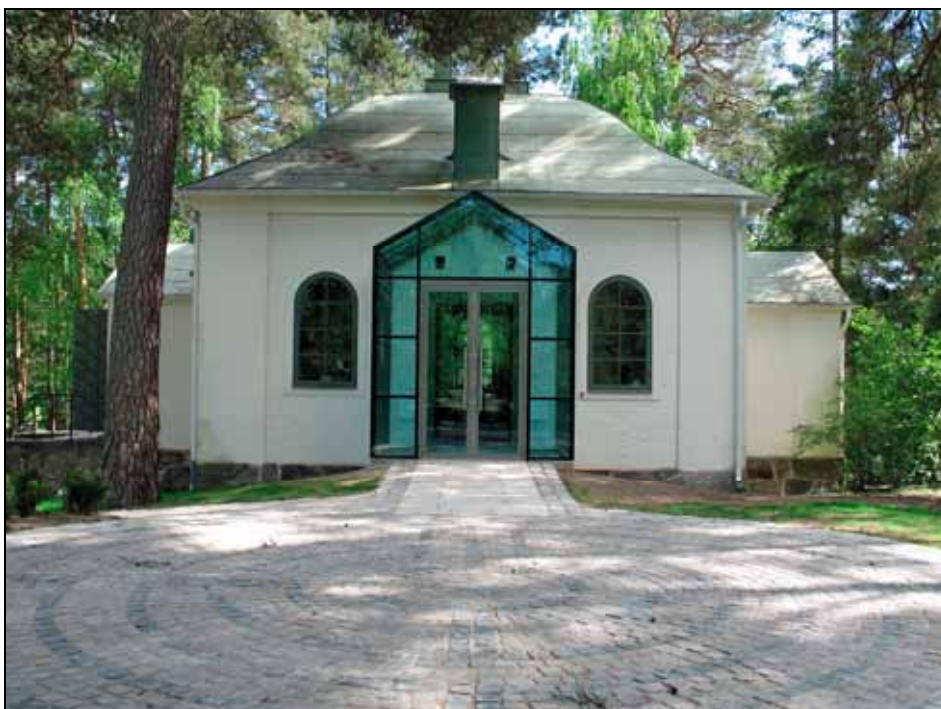
Den nya entrén utfördes med glasat vindfång.