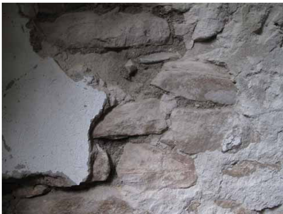
Frilagt murverk på gravkorets norra innervägg. Lp20110533.