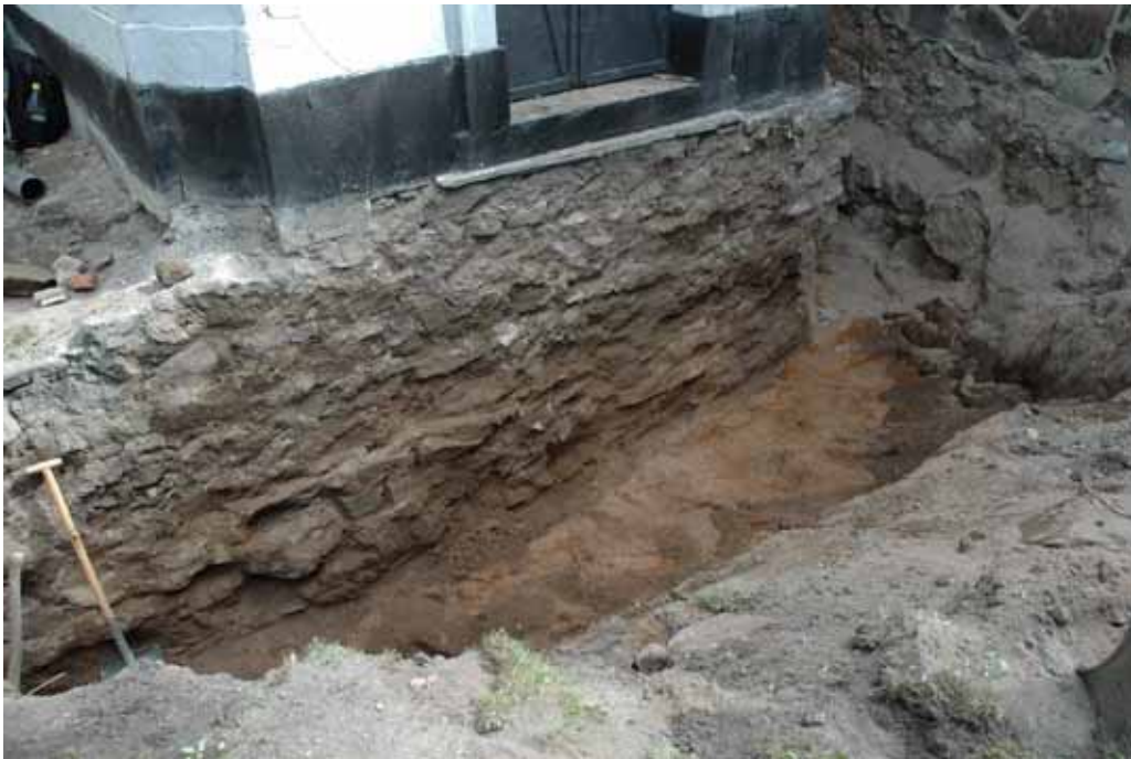
Schaktet söder om gravkoret från sydväst. Lp20110731.