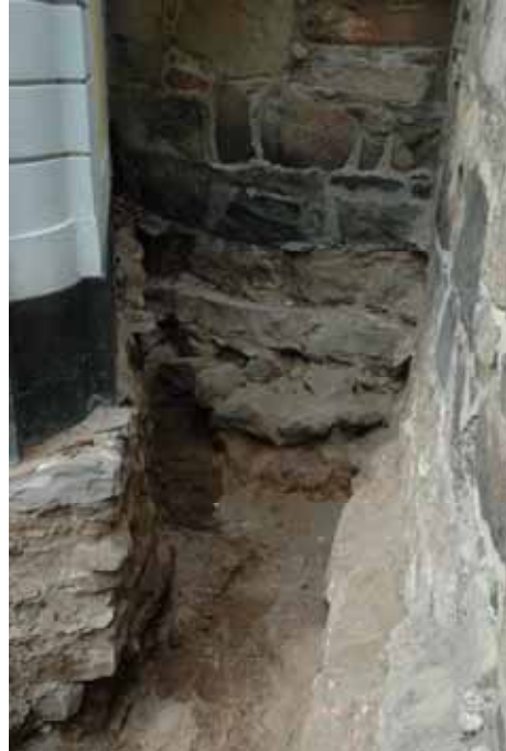
Tv. Utrymmet mellan gravkor och vapenhus efter att stenläggningen avlägsnats. Th. Rundkyrkans grundmur med från fasadlivet utskjutande rustbädd. Marknivån har blivit något förhöjd genom åren och delar av fasadlivet är numera dolt under mark. Lp20110724 och lp20110728.