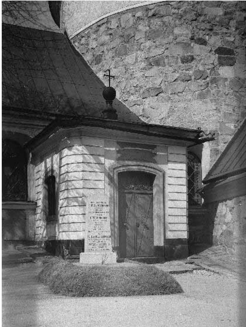
Langes gravkor från sydväst 1917. Lägga märke till hängrännornas tilltagna fall.