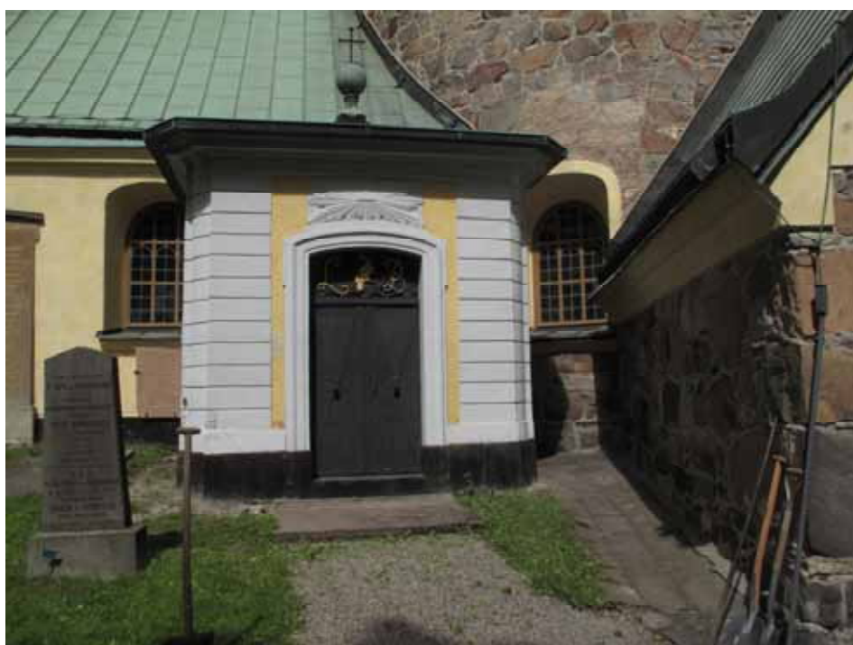
Langes gravkor från söder före restaurering i maj 2008. Lp20110528.