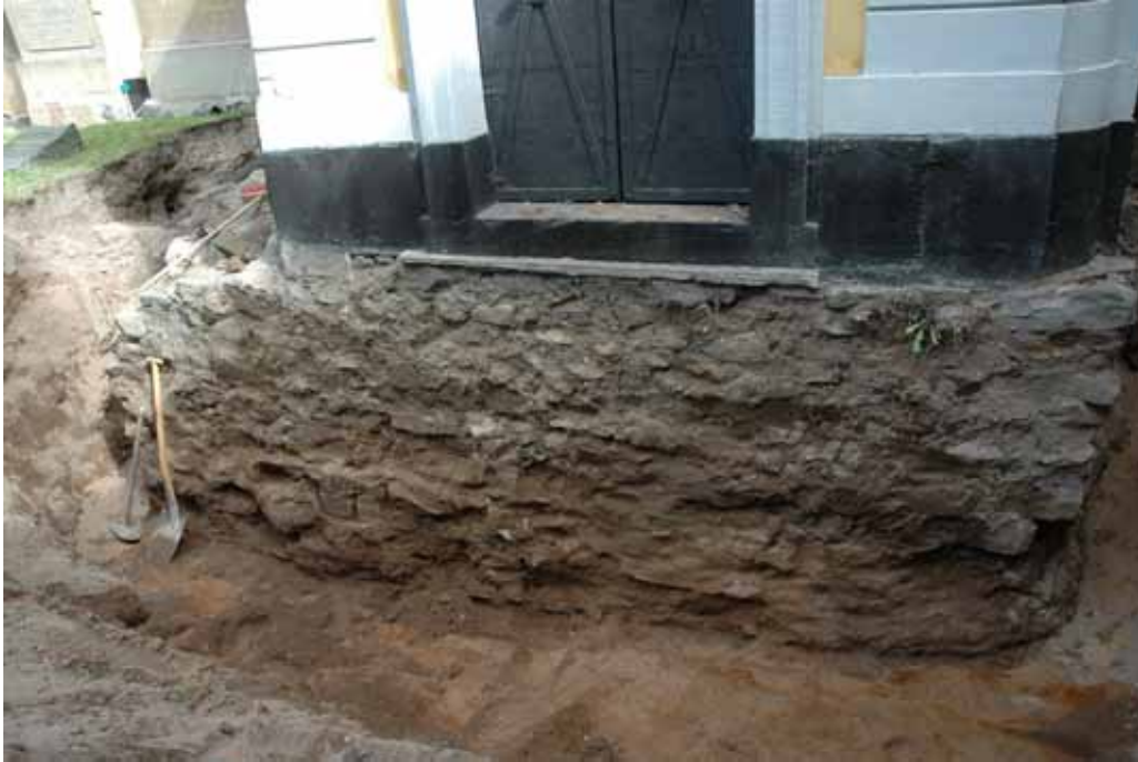
Gravkorets södra grundmur frilades i sin helhet. Lp20110732.