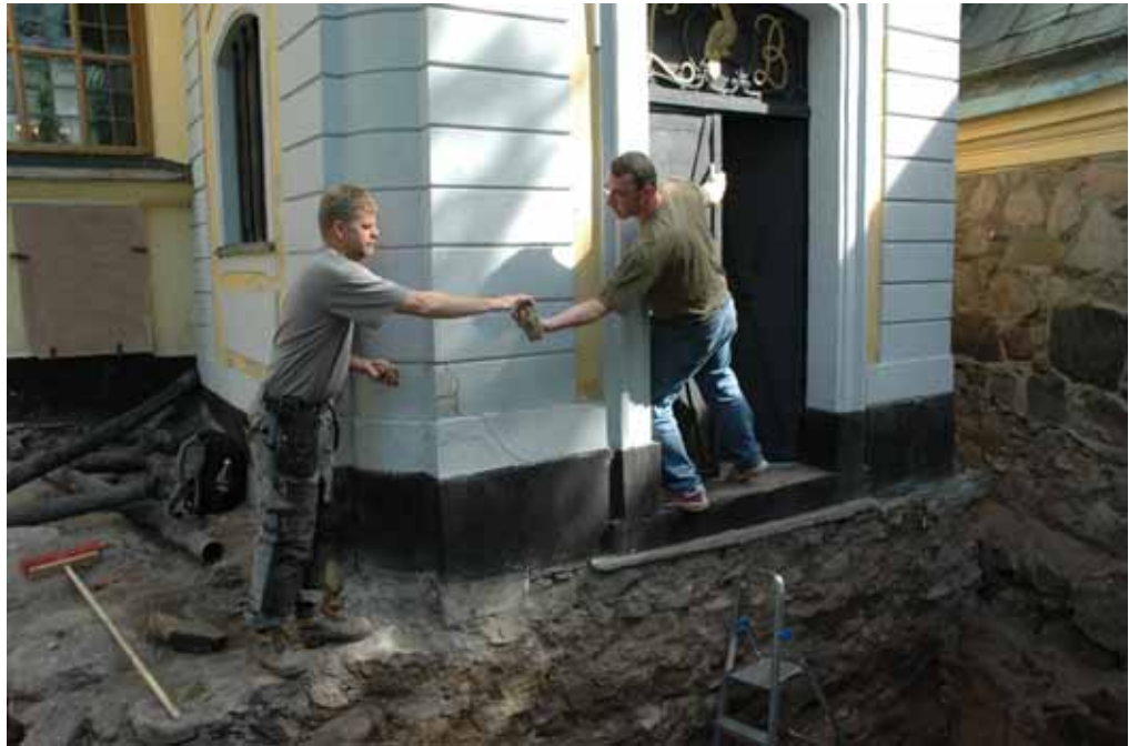
Schaktningen är i full gång. Lp20110733.