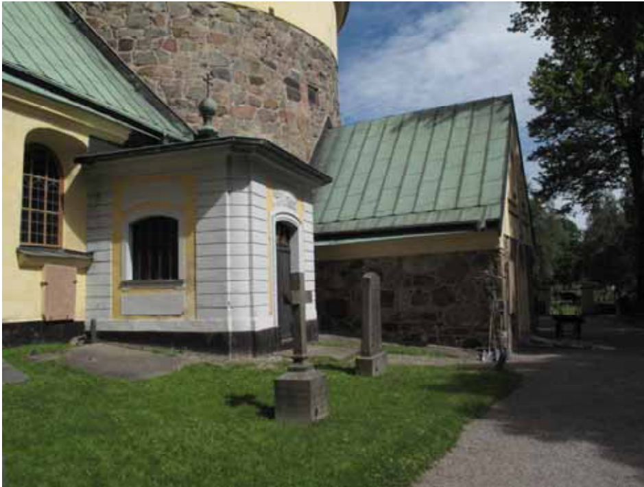
Langes gravkor från sydväst före restaurering i maj 2008. Lp20110527.