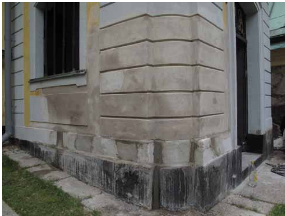
Sydvästra hörnet efter putsläggning. Inledningsvis målas ytan med kalkfärg. Nästa år målas den åter med linoljefärg. Lp20110532.