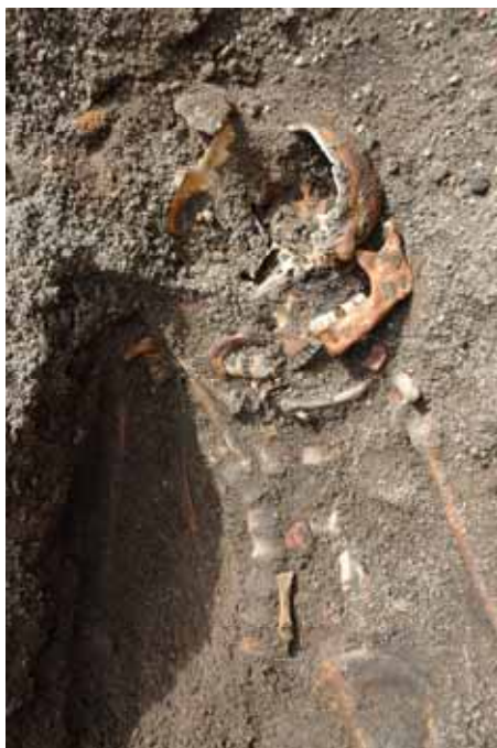
Tv. Vapenhusets grundmur till höger ansluter mot rundmyrkan med en stötfog. Th. En av barngravarna som påträffades invid rundkyrkans vägg. En C-14 analys av skelettet bekräftade att graven är medeltida och troligtvis härrör från 1300-talet. Lp20110729 och lp20110727.