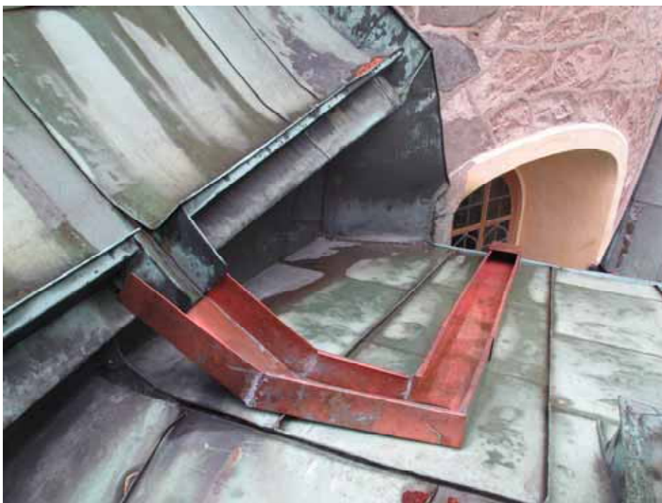
Befintlig utkastare på långhuset kompletterades med ränna ner till gravkorets östra hängränna. Foto Cecilia Pantzar Lp20110530.

Vid grävningen hittades flera formhuggna stenar och tegelstenar som troligtvis härrör från någon äldre byggnadsdetalj i kyrkan.