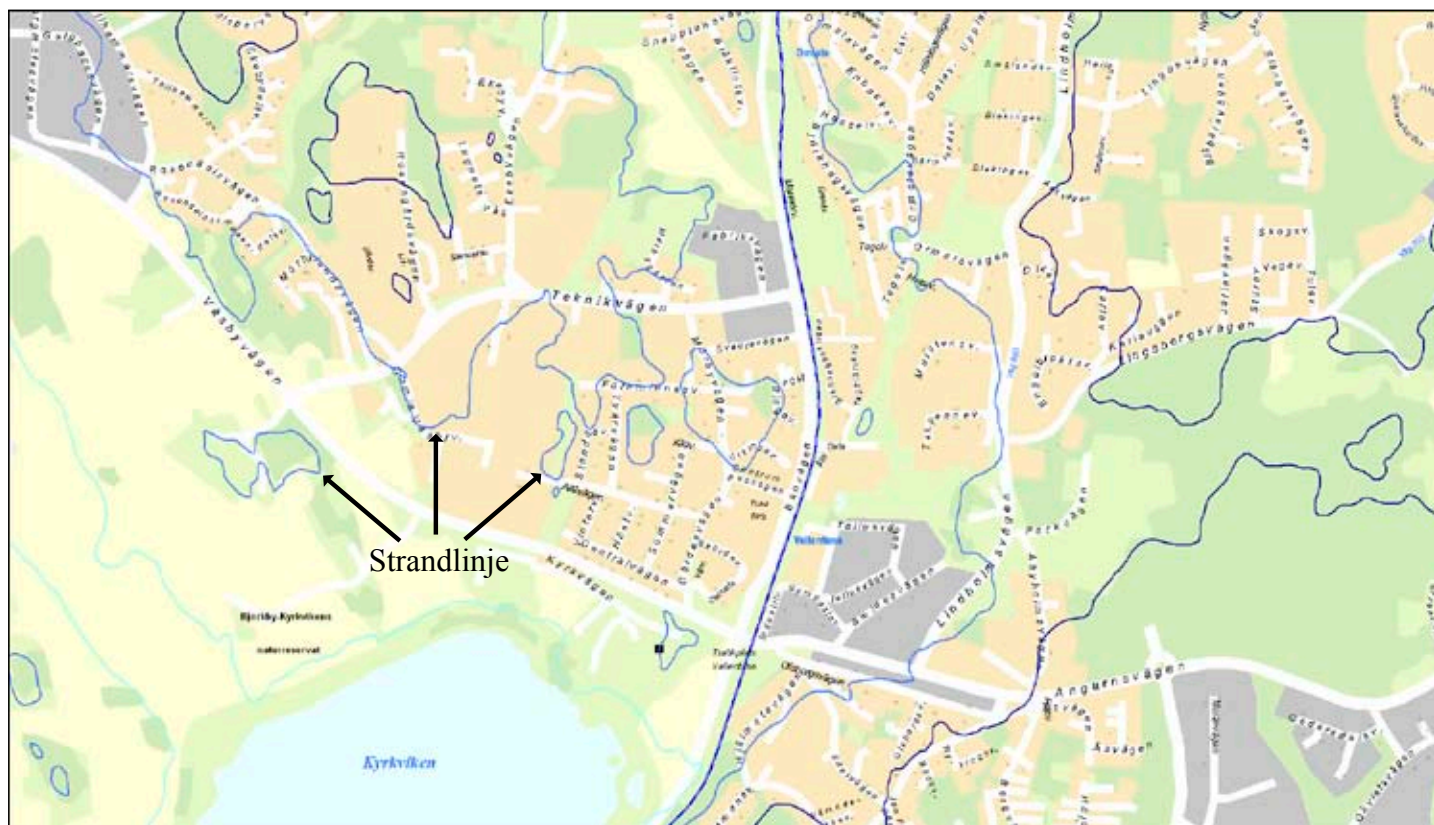
Fig 2. Strandlinjen/havsnivån vid bronsålderns slut markerat med blå linje.

Denna rapport, som kanske snarare skall ses som en artikel, är ett försök att sätta fokus på platsen och de fynd som har gjorts här. En historia som beskriver omvärlden utifrån denna plats som numera ingår i en stadspark i Vallentuna centrum. En plats där vallentunaborna kan känna magin av att befinna sig i samma händelsekedja som människorna som levde före dem. Ambitionen är också att ta upp händelser i världen som direkt eller indirekt har påverkat de människor som har bott, levt och dött här. Vallentuna har aldrig varit opåverkat av omvärlden. Ibland har Vallentuna i vissa avseenden också befunnit sig i centrum, om inte av världen så åtminstone i bygden. Oavsett anledning, eller när man har kommit till Vallentuna så ska man kunna knyta an till dessa lämningar som är skapade av tidigare liv.