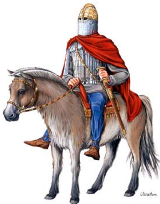
Fig 3. Rinkern från Vallentuna. Rekonstruktionsteckningen bygger på innehållet i den stora gravhögen vid Rickeby i Vallentuna som undersöktes 1980. Fynden påminner mycket om de i båtgravarna i Vendel och Valsgärde och talar för att den gravlagde haft en framstående position i samhället. I Rickebygraven återfanns detaljer från en rustning av järn, en praktfull hjälm, bronsbeslag på hästbetsel, speltärningar och ett antal lyxföremål. Bland de djur som offrats på gravbålet återfanns duvhök. Jakt med rovfåglar var ett exklusivt nöje inom aristokratin i Centraleuropa under järnåldern och våra traktors stormän var inte sena att ta efter. (ill. Mats Vänehem).

Det hände dock någonting i Vallentuna, vid gravfältet RAÄ 27, som skulle komma att få betydelse och som var en konsekvens av de förändringar som skedde i samhället. En person med en alldeles speciell funktion flyttade hit, alternativt ärvde gården. En person som hade kontakter och utbildning utöver det vanliga. En person som var van att röra sig bland samhällets överklass. Han var en Rinker , en man som var i tjänst hos kungen 4 som krigare. Denna person bodde på gården och när han dog begravdes han här i början på 600-talet e Kr. Och faktum är att vi har hittat hans grav. 1980 utfördes en arkeologisk undersökning av en grav som innehöll en man med gravgåvor värdiga en stor makthavare. Föremålen var bemängda med symbolik och typiska för den typ av överklass som Rinkerna tillhörde. Bl a krigarinspirerade föremål så som hjälm och hästutrustning (inklusive häst) men också lyxlivets föremål så som spelbräde