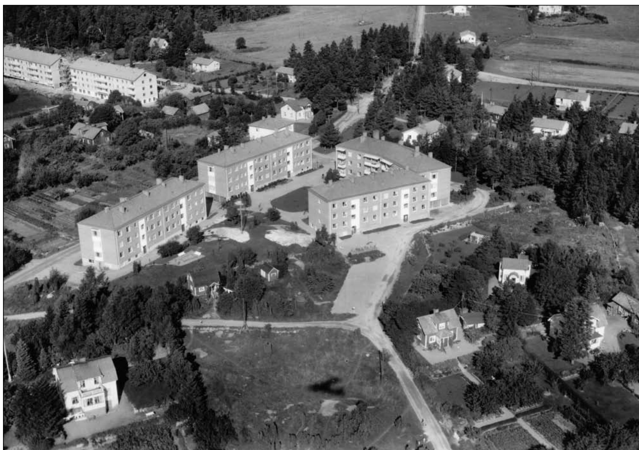
Fig 4. Det centrala Vallentuna som det såg ut 1958.

Rinkebyarna har visat sig ofta ha en relation till en annan typ av gårdar. En typ som liksom Rinkarnas gårdar har haft en speciell funktion. Detta är gårdar med namnet Tuna. Också intill Rickeby finns en Tunagård, nämligen Vallentuna som betyder Tunagården i Valenda hundare 6 . Till detta namn hör en mycket långvarig diskussion inom kulturhistorisk