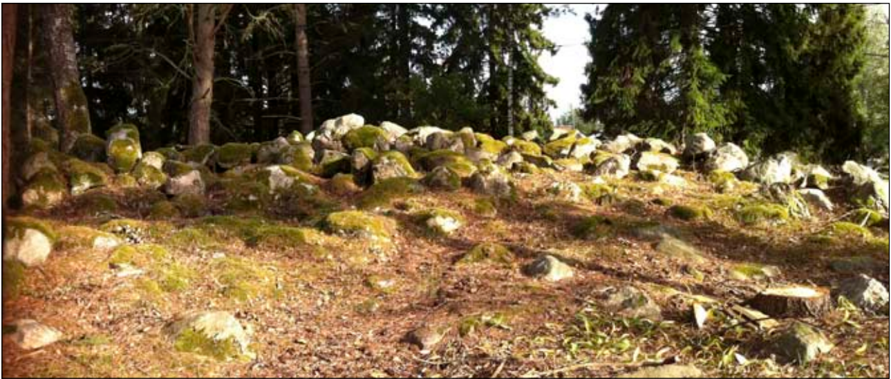
Fig 5. Grundargraven läge på höjden gjorde att den syntes bra på håll.

och språkvetenskaplig forskning. Det är helt övertygande bevisat att Tuna-namnet hör ihop med någon form av forntida samhällsorganisation. Frågan är på vilken nivå och i vilken form. Tunanamnen är mycket ofta sammanbundna med namn på större bebyggelseområden och Tuna är ett mycket vanligt namn på de gårdar som blir centrum i bygderna. Exempelvis så har många kyrkor namn på Tuna, t ex Sollentuna och Färentuna, m fl. Tunanamnet är dock mycket äldre än kyrkorna och det är alltså kyrkorna som har tagit namn av tunaorterna och inte tvärtom. Ursprungligen har namnet betydelsen gårdesgård 7 och i en utvecklad betydelse inhägnat område . Rinken och Tunagårdens funktion har sannolikt en stark relation till varandra. Tunagårdarna har ofta haft en central funktion inom territoriell organisation. 8 Rinken som är begravd i Vallentuna centrum, på gravfältet med beteckningen RAÄ 27, har förmodligen ägt eller förvaltat Tuna. Sannolikt var Tuna och Rickeby en och samma äga där Rickeby kom att få sitt namn efter herren som hade sin gård där. Den ursprungliga gården Tuna är dock sannolikt identisk med det som idag heter Prästgården.