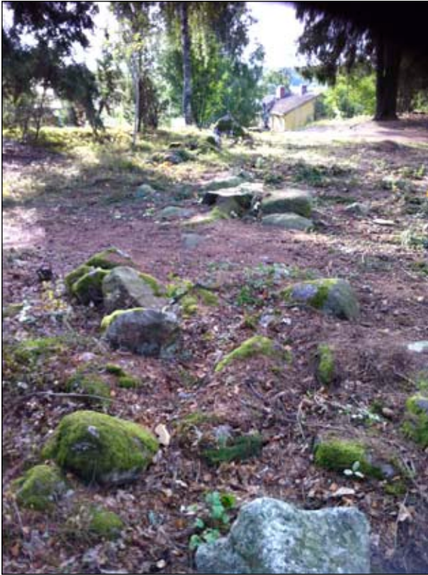
Fig 9. Stensträngen på gravfält RAÄ 27.

På gravfältet 27 i Vallentuna centrum har man som sagt funnit ett helt spelbräde med tre tärningar och spelpjäser. På en av tärningarna fanns en runristning. Texten lyder med latinska bokstäver: "b - A b A b A u k R A l b u -". Helt obegripligt kan det tyckas men i mitten av texten finns ett hAukR , vilket förmodligen har betydelsen Hök . Runinskrifter brukar nästan alltid innehålla ett mansnamn och i detta fall är det alltså Hök . De övriga delarna av texten är svårtolkade.