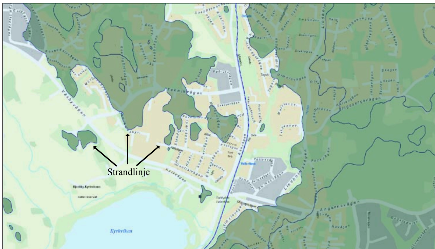
Fig 2. Strandlinjen/havsnivån vid bronsålderns slut markerat med gröna partier/landtytor.

Denna rapport, som kanske snarare skall ses som en artikel, är ett försök att sätta fokus på platsen och de fynd som har gjorts här. En historia som beskriver omvärlden utifrån denna plats som numera ingår i en stadspark i Vallentuna centrum. En plats där vallentunaborna kan känna magin av att befinna sig i samma händelsekedja som människorna som levde före dem. Ambitionen är också att ta upp händelser i världen som direkt eller indirekt har påverkat de människor som har bott, levt och dött här. Vallentuna har aldrig varit opåverkat av omvärlden. Ibland har Vallentuna i vissa avseenden också befunnit sig i centrum, om inte av världen så åtminstone i bygden. Oavsett anledning, eller när man har kommit till Vallentuna så ska man kunna knyta an till dessa lämningar som är skapade av tidigare människor.