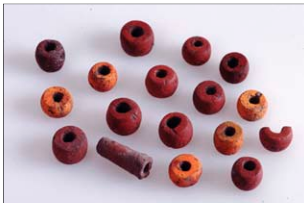
Fig 7. Exempel på röda glaspärlor.

Allt var dock inte krigiskt. Det vardagliga livet utgjordes av bondens normala sysslor. Om det nu var så att det fanns ett militärt ideal i symbolspråket så är det inte säkert att detta alltid omsattes i praktiska handlingar. Ett svärd kan användas som en symbol för makt även fast det aldrig används i praktiken. 11 År 1966 gjordes en arkeologisk undersökning alldeles vid västra delen av Vallentuna centrum där en helt annan typ av symbolik fanns representerad. I en