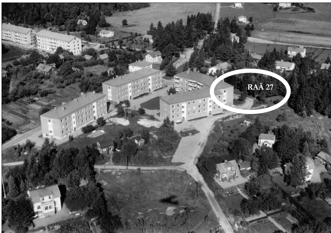
Fig 4. Det centrala Vallentuna som det såg ut 1958.

Rinkebyarna har visat sig ofta ha en relation till en annan typ av gårdar. En typ som liksom Rinkarnas gårdar har haft en speciell funktion. Detta är gårdar med namnet Tuna. Också intill Rickeby finns en Tunagård, nämligen Vallentuna som betyder Tunagården i Valenda hundare 6 . Till detta namn hör en mycket långvarig diskussion inom kulturhistorisk