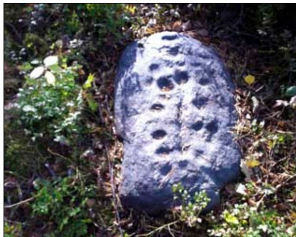
Fig 6. Skålgropsstenen på gravfältet.

och säkerligen också på lite olika sätt. Det finns beskrivningar av hur människor har smörjt in dem med fett eller offerat saker i dem. Än idag kan man hitta mynt som människor har placerat i groparna. En ledtråd till föreställningen kring älvkvarnarna får vi av deras namn som ju antyder att älvor på