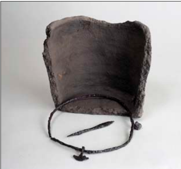
Fig 8. Gravurna, pilspets och torshammarring från mansgrav daterad till 900-talet e Kr.