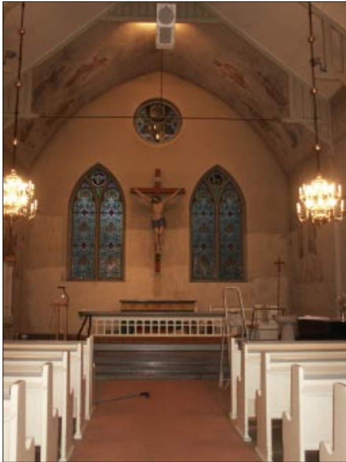
Fig 2. Bildbeteckning: Lp20020008 Koret under rengöring