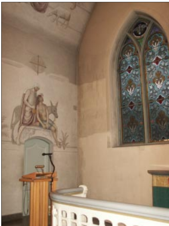
Fig 3. Bildbeteckning: Lp20020009 Koret under rengöring med E. Stenholms målning på norra sidan från 1963