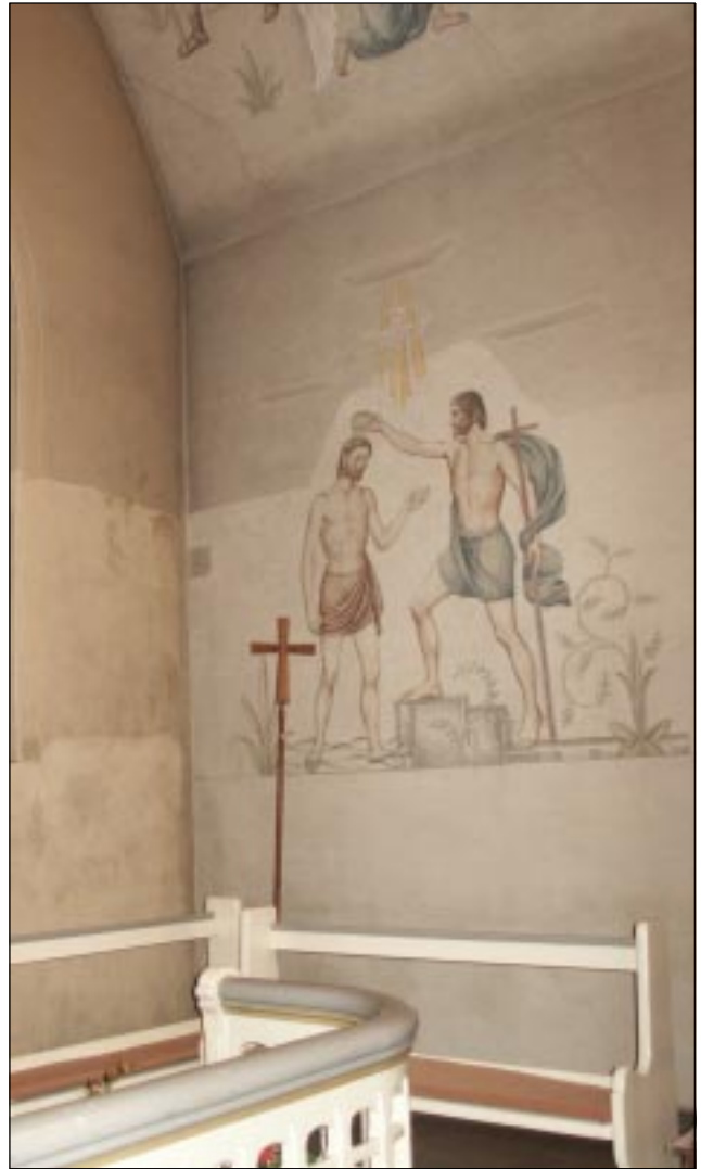
Fig 5. Bildbeteckning: Lp20020010 Koret under rengöring med E. Stenholms målning på södra sidan från 1963