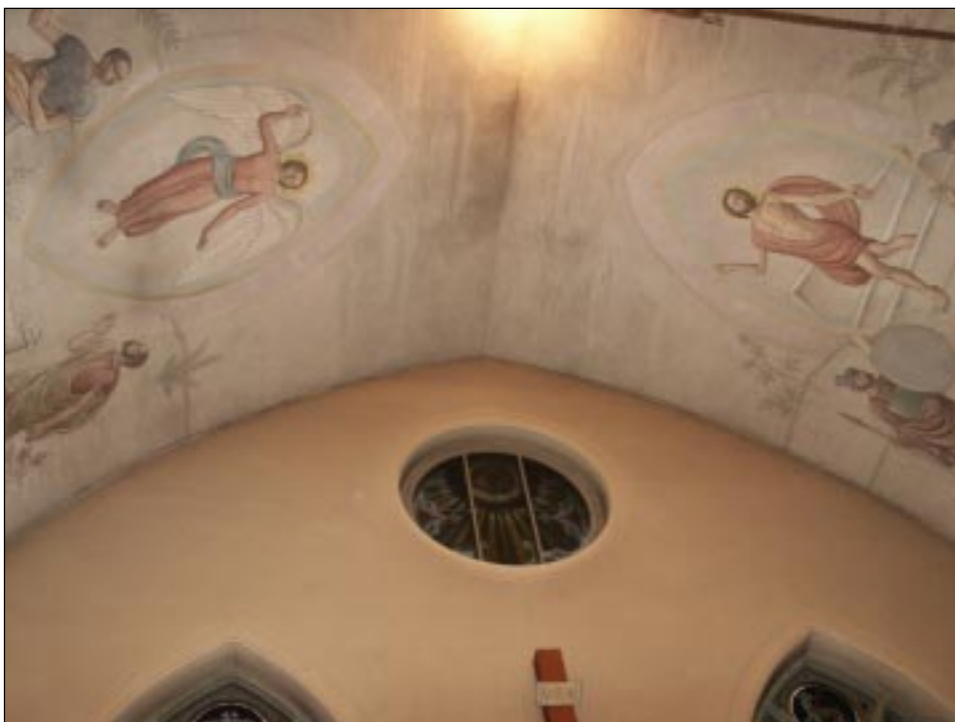
Fig 6. Bildbeteckning: Lp20020011 Korvalvet efter rengöring med Stenholms målningar från 1955