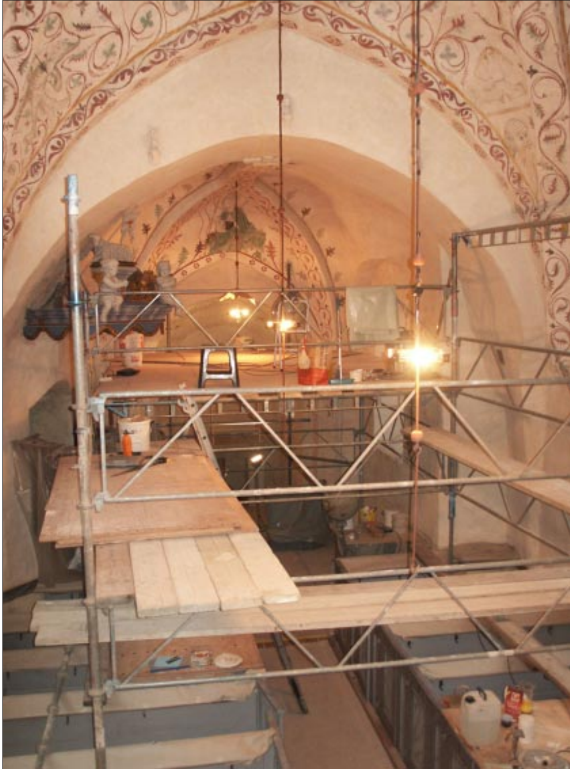
Fig 6. Bildbeteckning: Lp20020007. Arbete pågår.