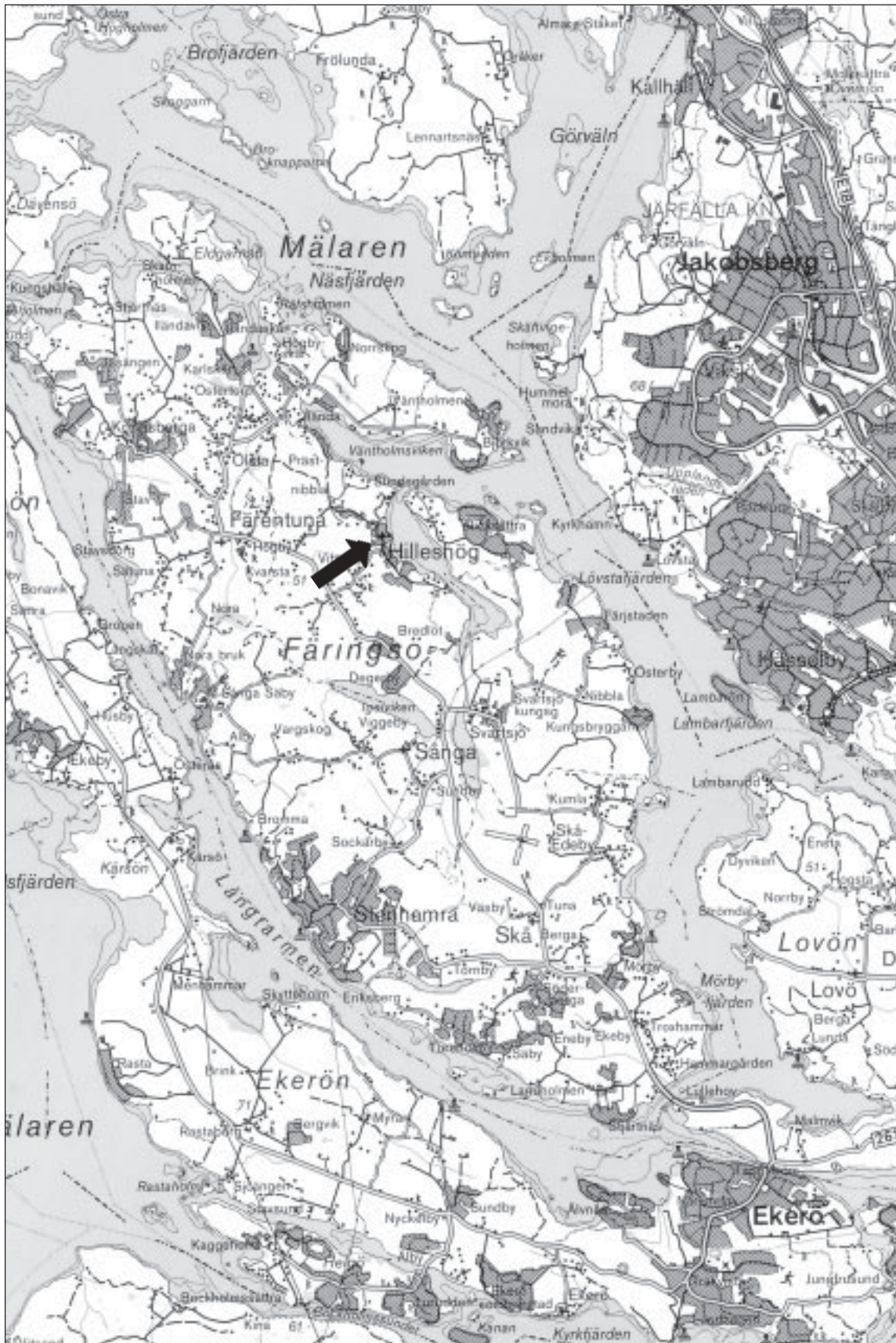
Fig 1. Blå kartan med läget för Hillesbögs kyrka markerat. Skala 1:100 000.