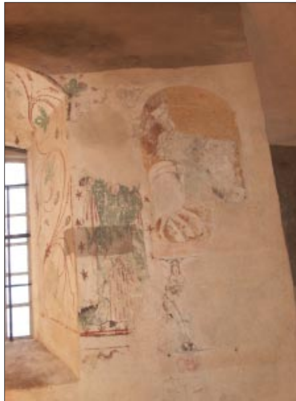
Fig 3. Bildbeteckning: Lp20020004. Sydfönstret i koret. 1920-talets målade mittelbandlist och melerade målning.