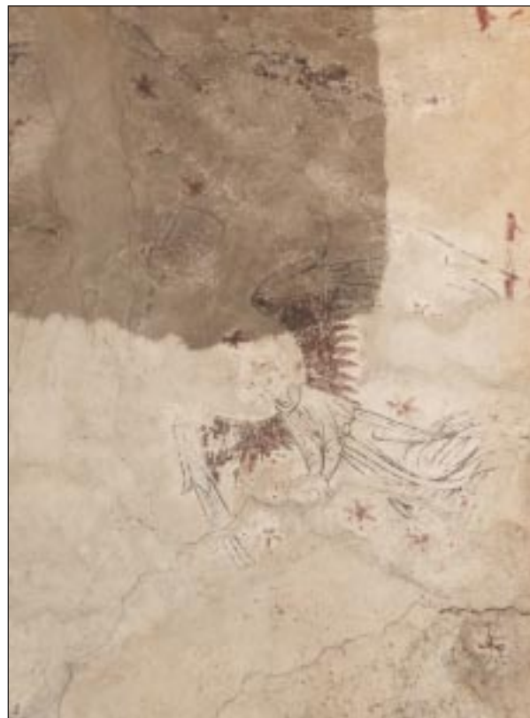
Fig 5. Bildbeteckning: Lp20020006. Valvkapporna i koret sett mot absiden.