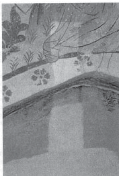
Rengöringsprov på vägg och kappan i kor

Konservatorsrapport för arbeten i Hillesbögs kyrka, utförda 2002-01-15 till 2002-04-07.