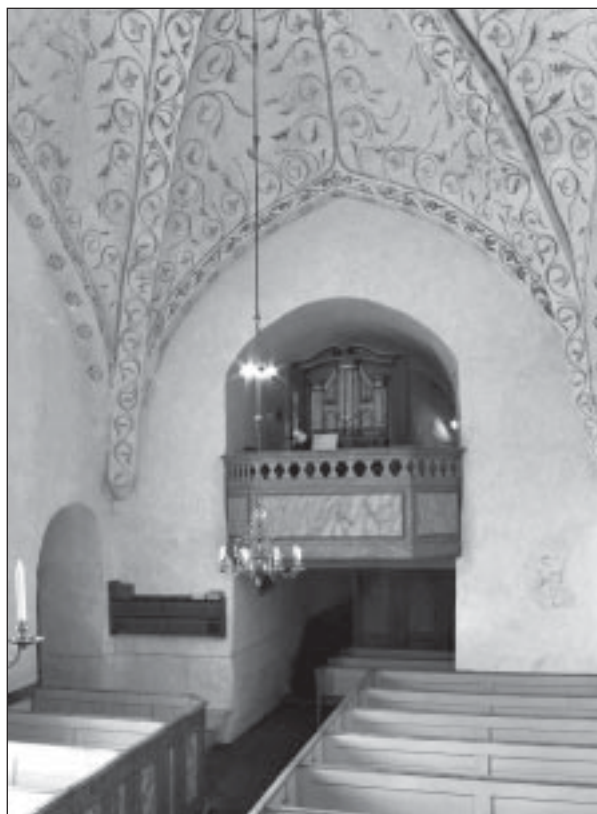
Fig 9. Bildbeteckning: L2002-0036-12. Långhusets västra del med orgelläktare efter rengöring och konservering.