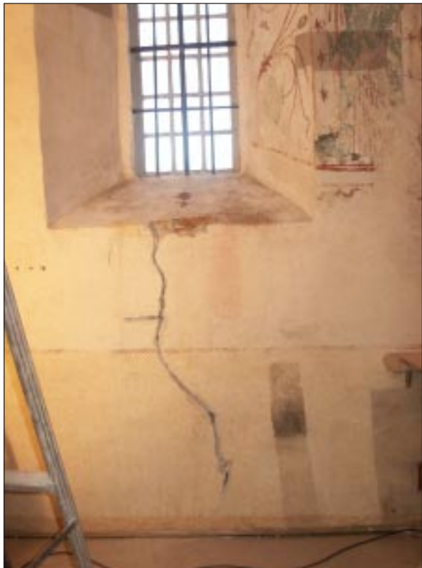
Fig 2. Bildbeteckning: Lp20020003. Absiden. OBS (Fig 2-6 visar interiörer under rengöring och konservering.)