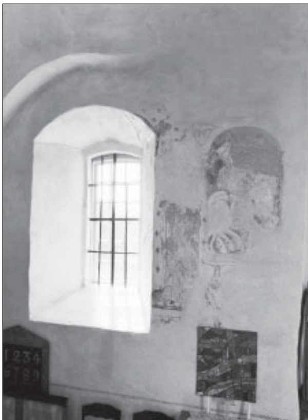
Fig 7. Bildbeteckning: L2002-0036-11. Korets fönster med intilliggande målning efter rengöring och konservering.