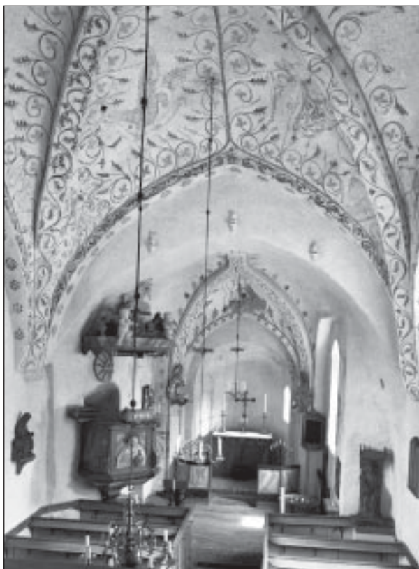
Fig 8. Bildbeteckning: L2002-0038-03. Rengjorda putsytor och målningar sett mot koret.