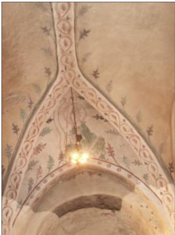
Fig 4. Bildbeteckning: Lp20020005. Målning till vänster om sydfönstret i koret. Foto Eva Wallström