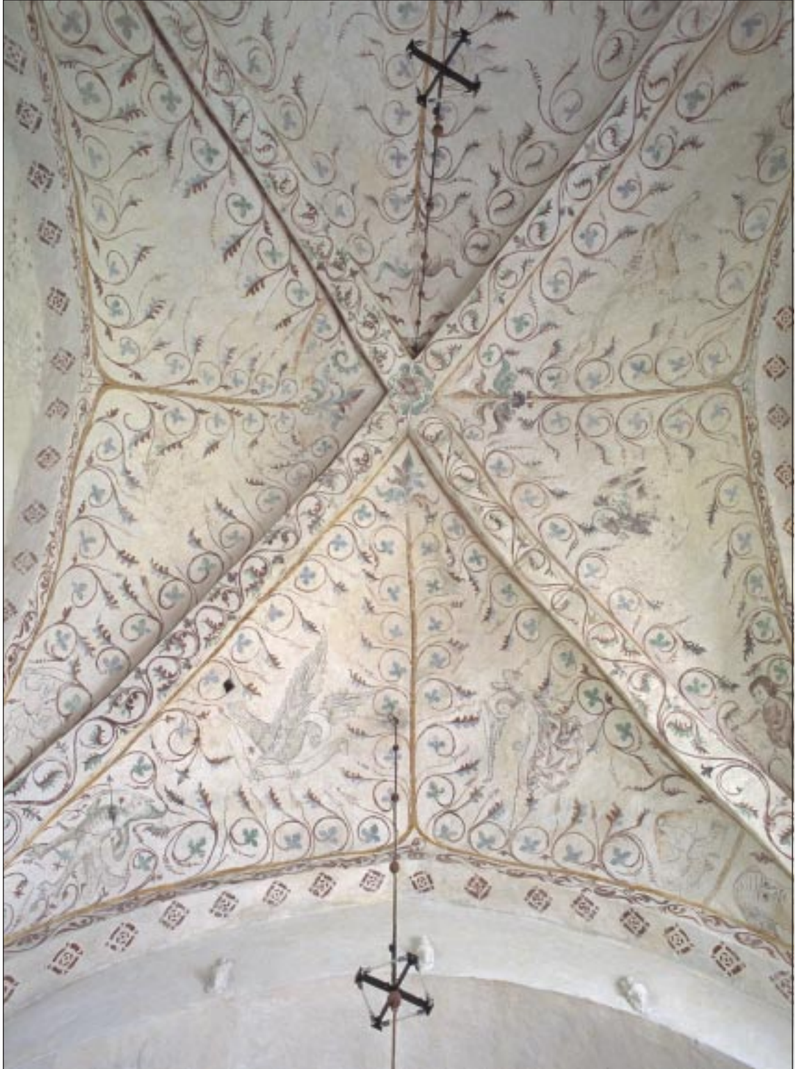
Fig 10. Bildbeteckning: LD2002-0082. Långhusets västra valv efter rengöring.